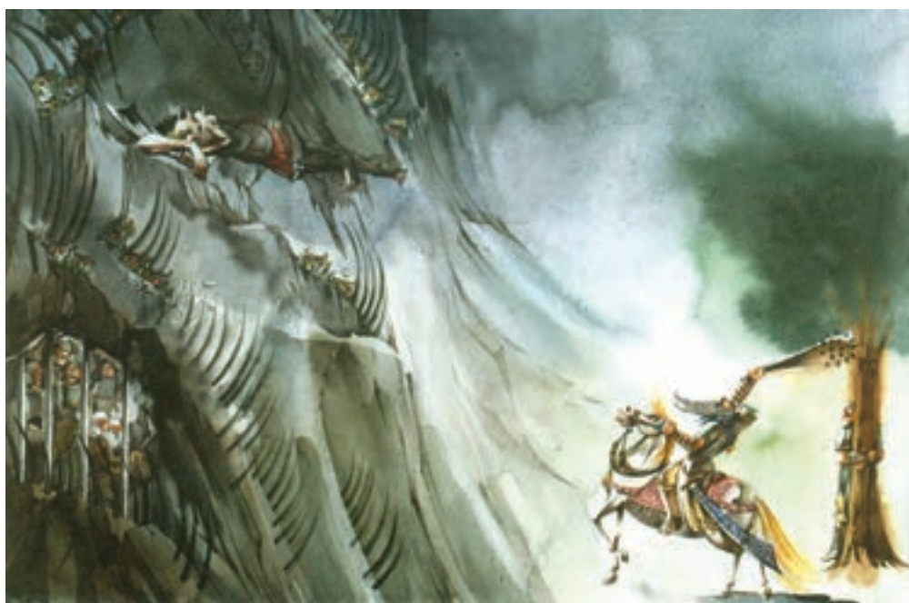
▲ تصویر ۲۴