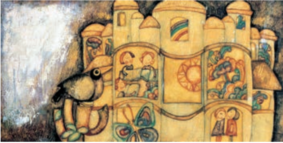
▲ تصویر ۷