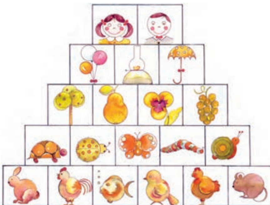
▲ تصویر ۱۹ - تصویرسازی با شکل‌های اصلی - اکولین - اثر اعظم کریمی

به روش‌های ساده‌سازی طبیعت در تصویر شماره ۱۹ دقت نمایید.