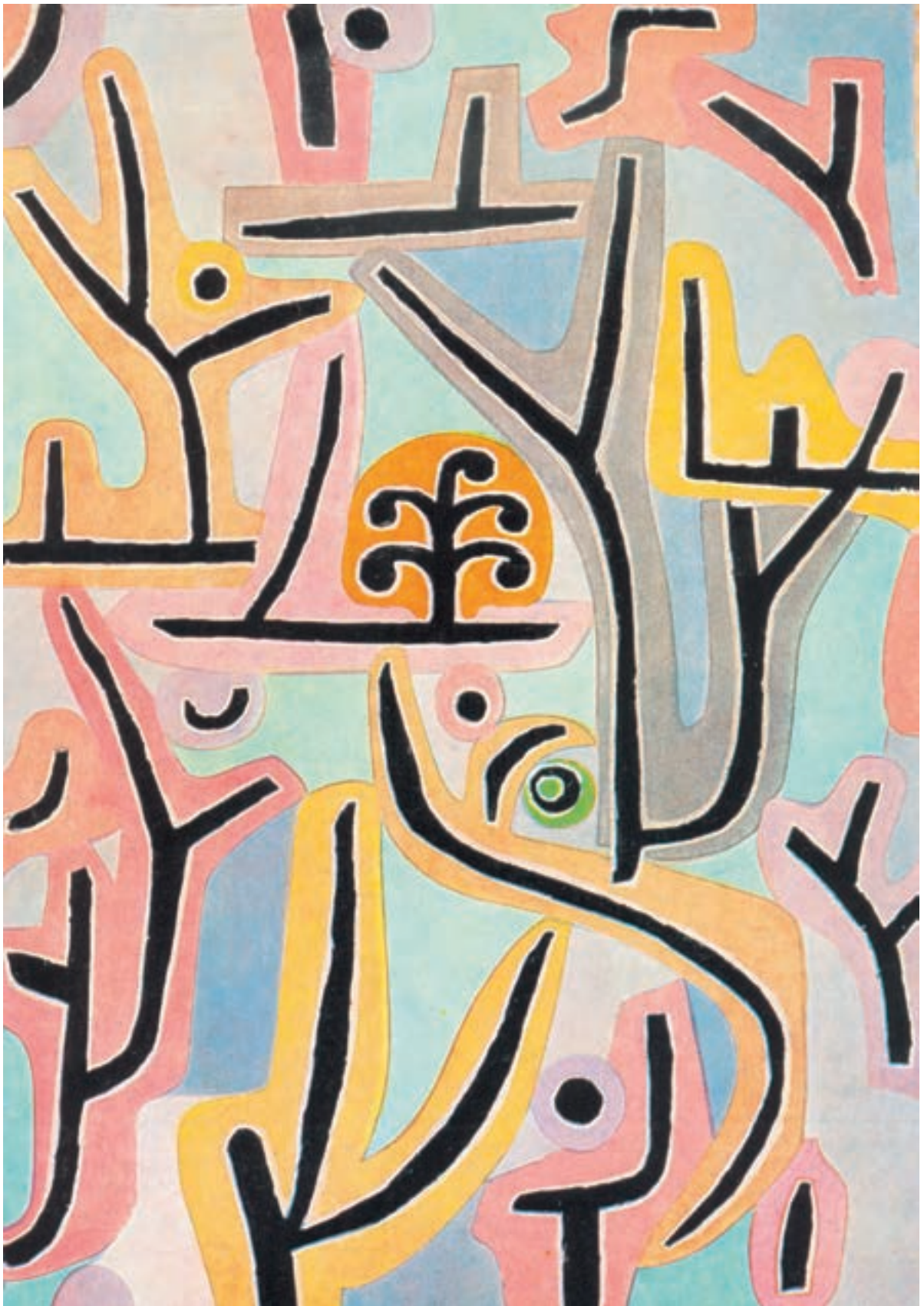
▲ تصویر ۱۶- باغ نزدیک لوسرن - ۱۹۳۸ - رنگ روغن - اثر پل کلی