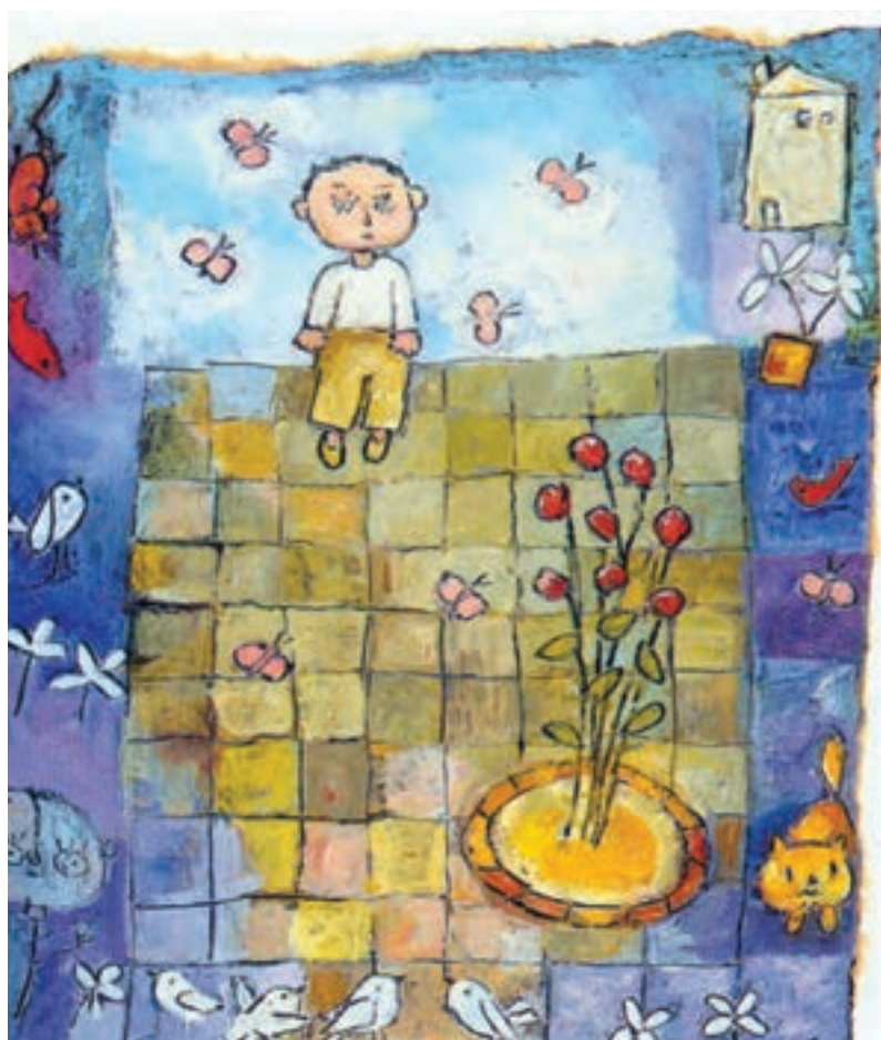
▲ تصویر ۱۲