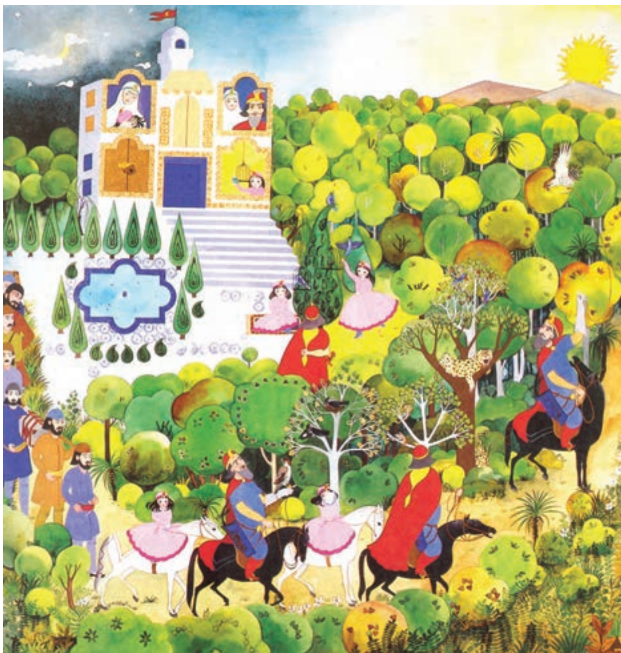
▲ تصویر ۵