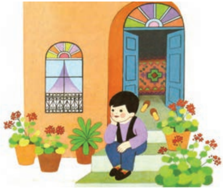
▲ تصویر ۱۳