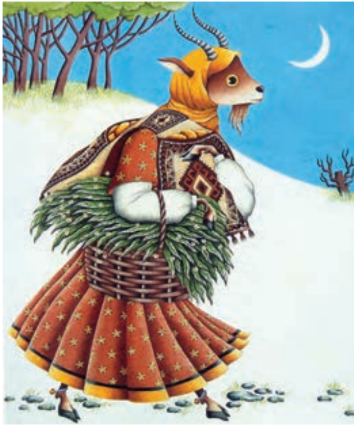
▲ تصویر ۹