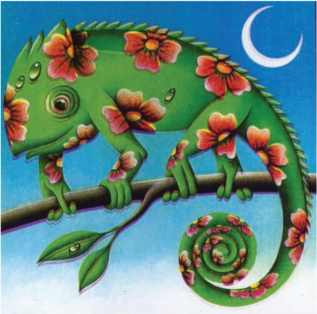
▲ تصویر ۴- اثر بهزاد غریب پور، هنرمند در این تصویر به خوبی از رنگ های سرد و گرم جهت تلطیف و زیباتر جلوه نمودن آفتاب پرست سود جسته است.

اگر طرح را جسم تصویر بدانیم، رنگ نیز به منزله روح آن خواهد بود، بنابراین تصویر، کلام و رنگ لازم و ملزوم یکدیگر خواهند بود. تصویرگر باید از رنگ در حد منطقی و آنجا که نیاز به رنگ حس می شود استفاده نماید و سعی نکند از رنگ در حد اشباع استفاده نماید و با به کارگیری رنگ مخاطب را فریب دهد و سعی در جذب کاذب آنها نماید.