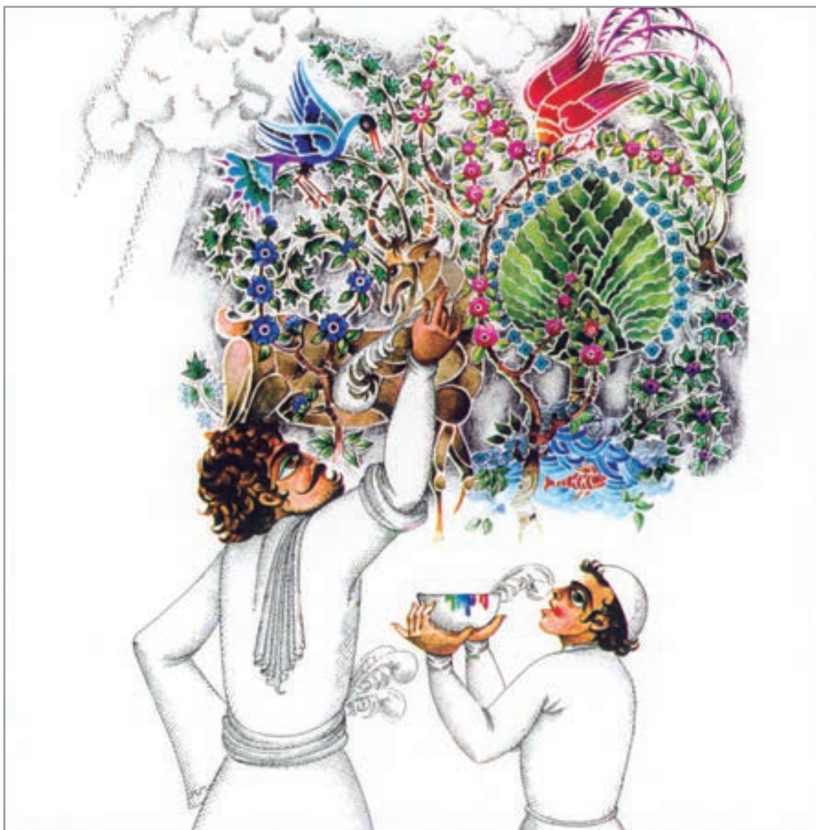
▲ تصویر ۱- اثر علی اکبر صادقی، قصه آب- آفتاب و کاشی، نمونه‌ای از تأثیر پذیری هنرمند با توجه به فرهنگ بومی اسلامی- ایرانی

تصویرسازی کودکان و نوجوانان همواره این سؤال مطرح است که «رنگ مناسب» برای کودکان و نوجوانان کدام دسته از رنگ‌ها مناسب می‌باشند؟ این مسأله بیشتر بستگی به نظر شخصی هنرمند دارد و اوست که دریافت واحدی نسبت به داستان دارد و رنگ‌ها و تعبیری که برای بیان فکر و احساساتش به کار می‌گیرد، کار او را از دیگران متمایز می‌سازد. بعضی از هنرمندان از رنگ‌های درخشان و شاد استفاده می‌کنند (تصویر ۲).