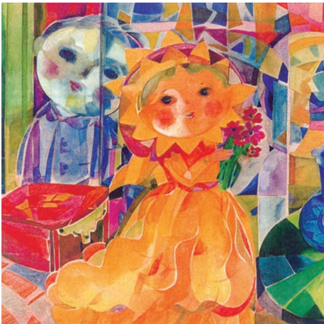
▲ تصویر ۲- اثر محمدعلی بنی‌اسدی، نمونه‌ای از کاربرد رنگ در تصویرسازی - هنرمند در این اثر از رنگ‌های درخشان به خوبی استفاده کرده است و توانسته با مخاطبین خردسال ارتباط برقرار کند.

آنچه مسلم است یک هنرمند جدای توانایی‌های خود و شناخت زیبایی‌شناسی رنگ باید از چگونگی نگرش مخاطب خود و میزان تجسم و شرایط درک سنی، نسبت به رنگ‌ها و اهمیت آن آگاه باشد. چرا که برای قشری کار می‌کند که اگر نتواند با آنها ارتباط برقرار کند، در کارهای خویش موفق نخواهد بود.