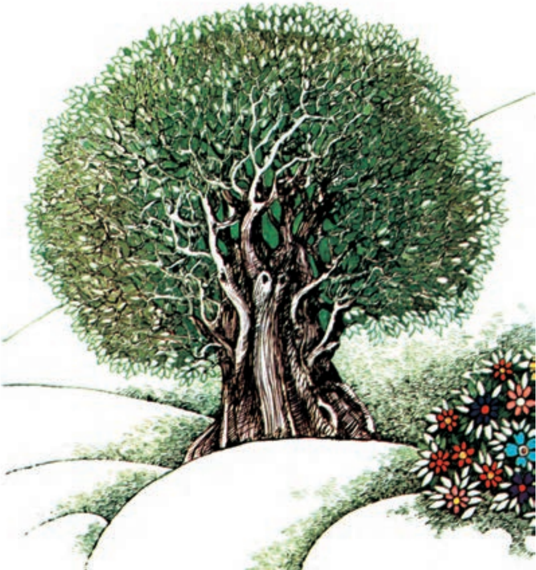
▲ تصویر ۸