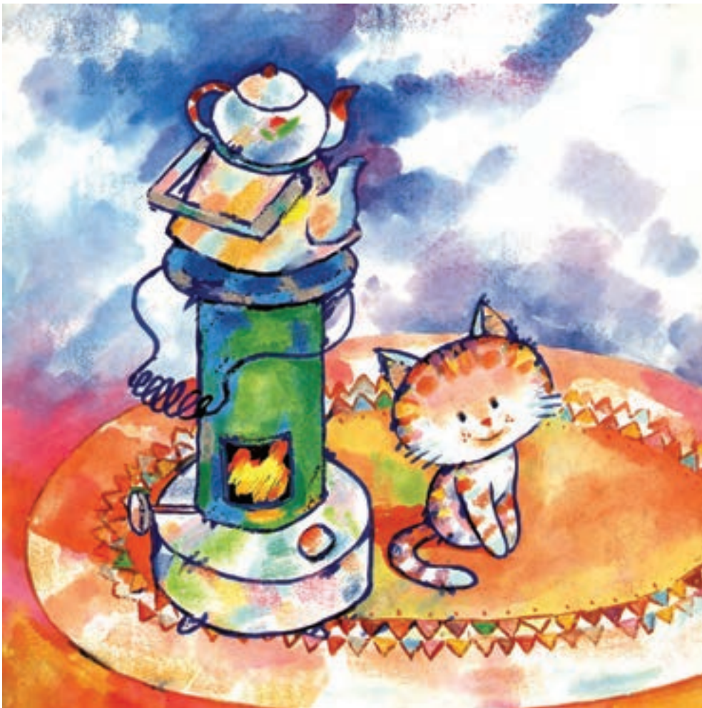
▲ تصویر ۱۴