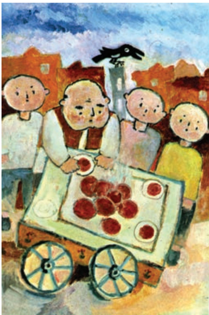
تصویر ۲۰ ◀

دقت کنید، هنرمند جوان در این مجموعه آثار به واسطه کاربرد فرم‌های ساده هندسی توانسته است هر شکلی را که اراده کند به تصویر بکشد و تکمیل نماید. شما نیز همواره تلاش کنید که تمامی اشکالی را که در یک تصویر می‌خواهید طراحی کنید، توسط این اشکال به دست آورید. مطمئن باشید بعد از مدتی نه چندان زیاد، برای خود صاحب شیوه و روش جدیدی در طراحی تصویرسازی خواهید شد، و آثار شما از سایر هنرمندان قابل تشخیص خواهد بود. در اینجا نیز چند نمونه از شخصیت‌سازی‌های