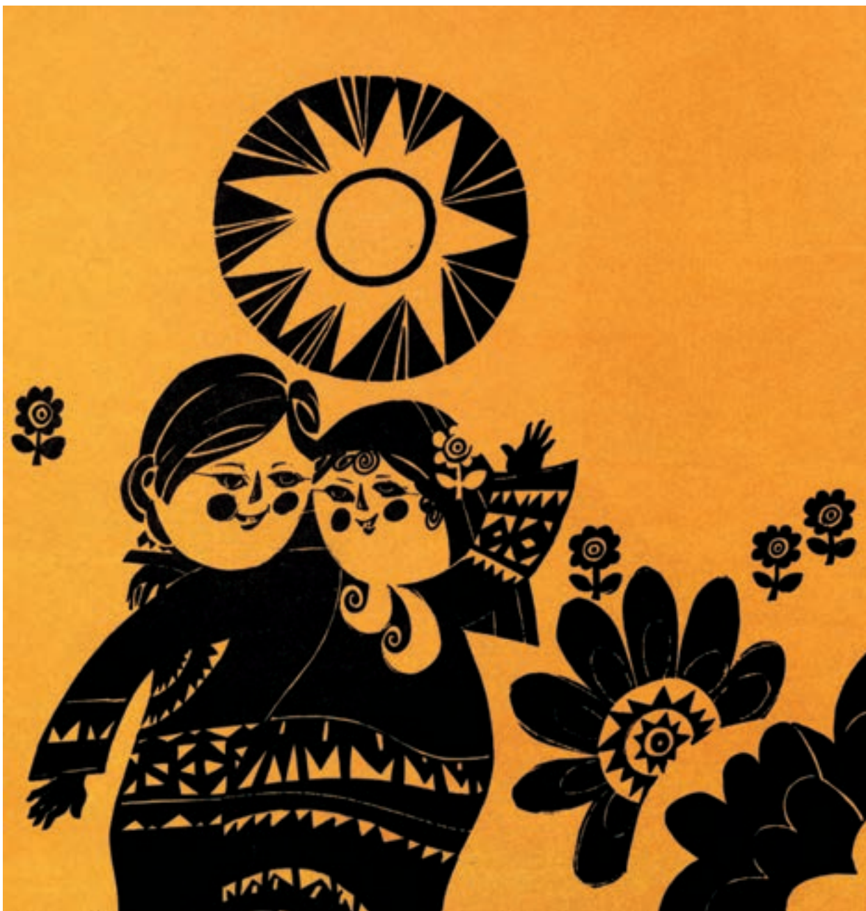
▲ تصویر ۶