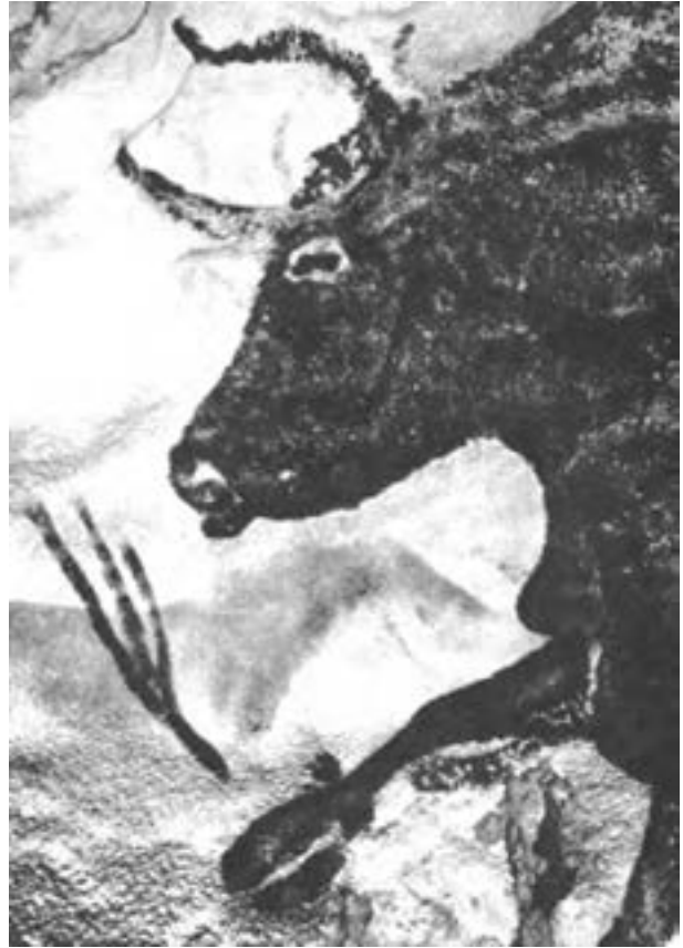
▶ تصویر ۱۵- الف- گاو نر سیاه، جزیی از نقاشی درون غار لاسکو- فرانسه- حدود ۱۰۰۰۰ تا ۱۵۰۰۰ سال قبل از میلاد

انسان‌های غارنشین با استفاده از خط و سطوح هندسی ساده به نحو بسیار ساده و هنرمندانه‌ای توانسته‌اند به قالب‌های ساده و بدیع جهت برقراری ارتباط با یکدیگر و القای مفاهیم و آیین‌های مذهبی دست یابند. و این آرزو همواره هنرمندان