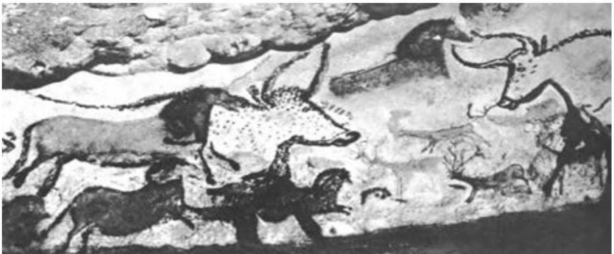
▲ تصویر ۱۵- ب- نقاشی‌های درون غار لاسکو- فرانسه- حدود ۱۰۰۰۰ تا ۱۵۰۰۰ سال قبل از میلاد