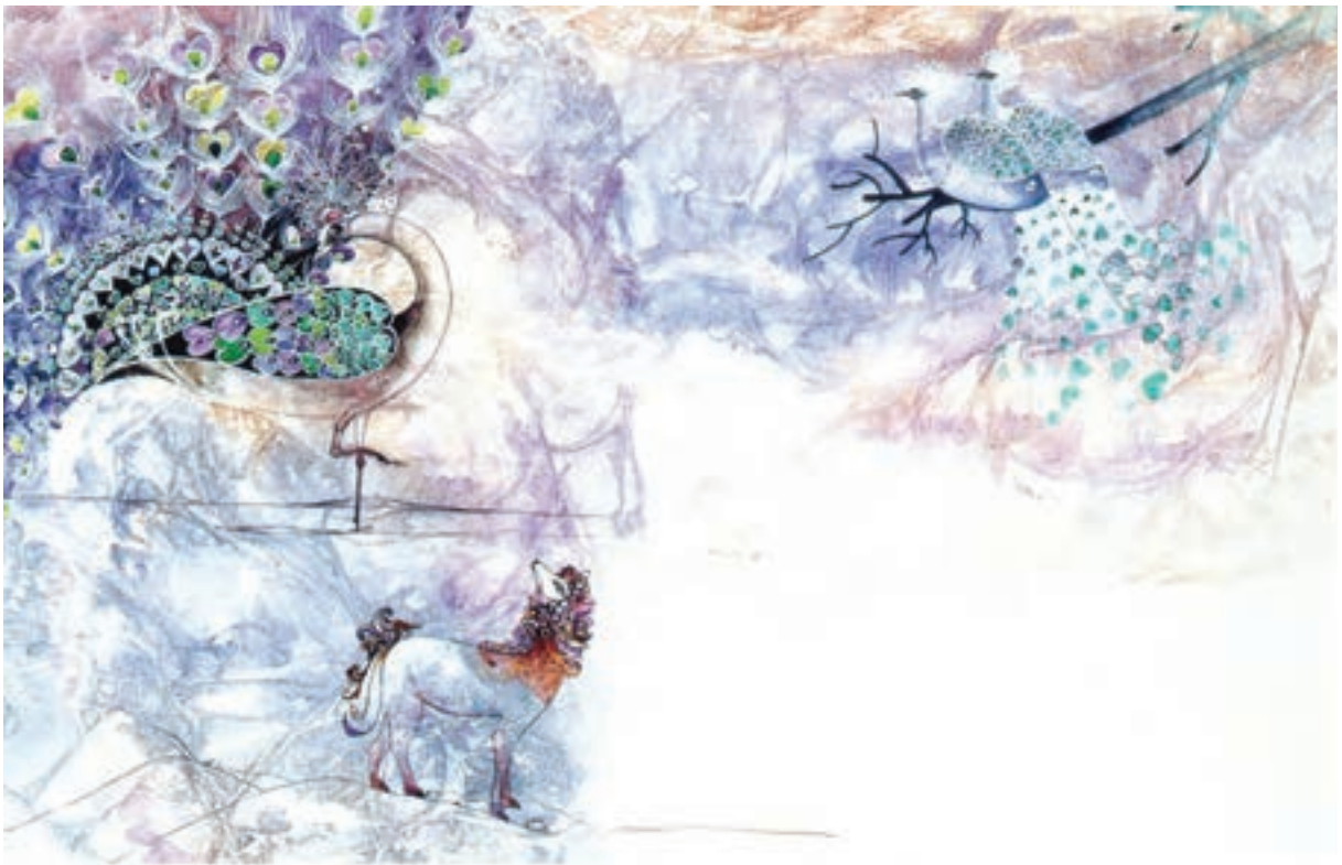
▲ تصویر ۱۰