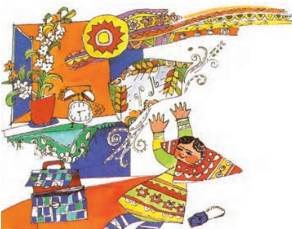
◀ تصویر ۲۱