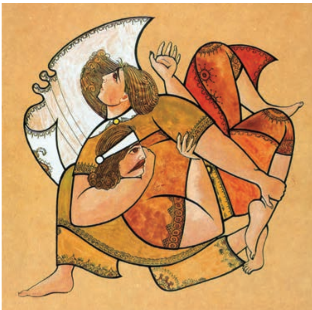
▲ تصویر ۲۳