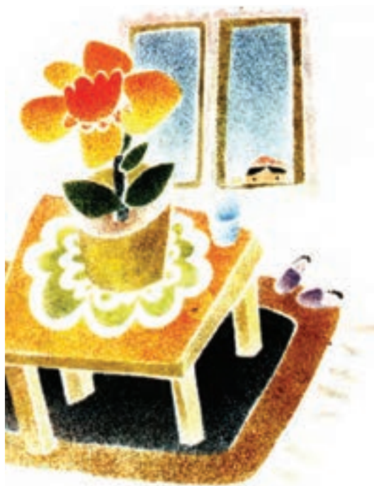
▲ تصویر ۱۱