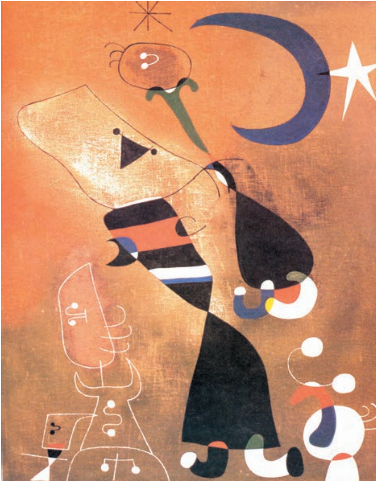
▲ تصویر ۱۷- زن، پرنده و مهتاب - ۱۹۴۹ - رنگ روغن - اثر خوان میرو