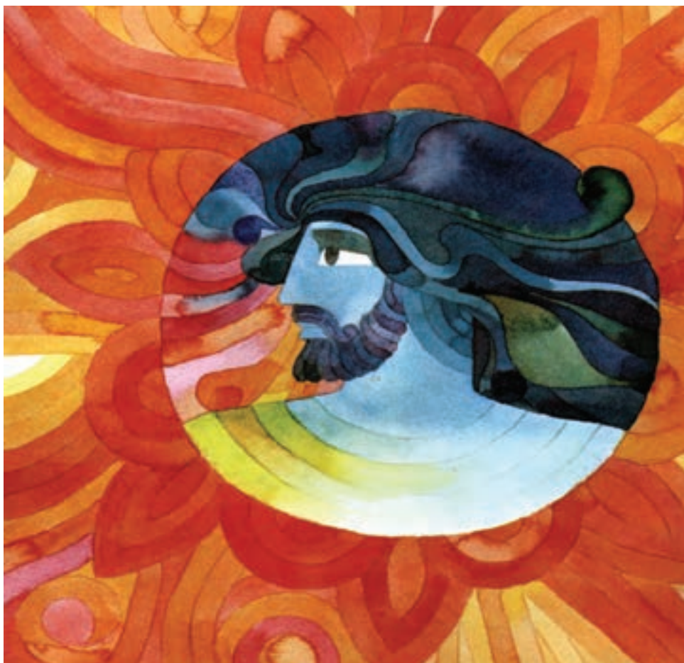
◀ تصویر ۲۲