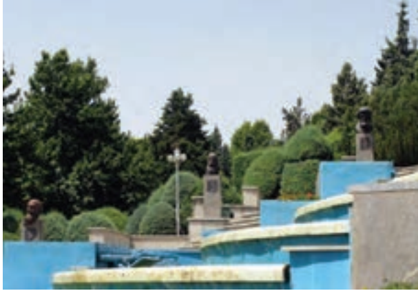
تصویر ۳-۶- لنز واید