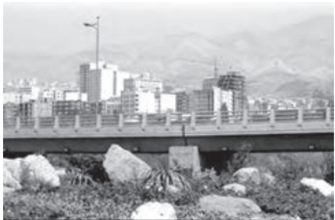
تصویر ۱۶-۶ - لنز واید