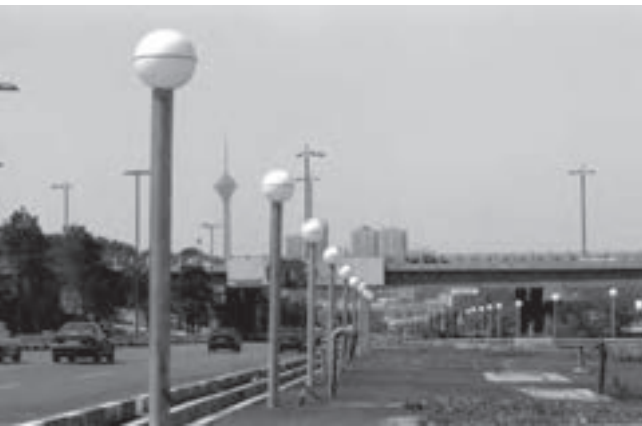
تصویر ۶-۲۲- لنز نرمال

تصاویر ۶-۲۱، ۶-۲۲ و ۶-۲۳ تنها لنزهای نرمال هستند که تصویری بسیار شبیه به آنچه که با چشم می‌بینیم در اختیار ما می‌گذارند و لنزهای واید تصویری خلق می‌کنند که به دلیل پرسپکتیو ویژه آن‌ها پیرانرژی‌تر به نظر می‌رسند. و بر عکس لنزهای تله به دلیل زاویه بسته شان معمولاً عناصر کمتری را در عکس جای داده و تصاویرشان به نوعی آرام‌تر به نظر می‌رسد. تصاویر صفحه بعد این ویژگی را نشان می‌دهند (تصاویر ۶-۲۴ تا ۶-۲۶).