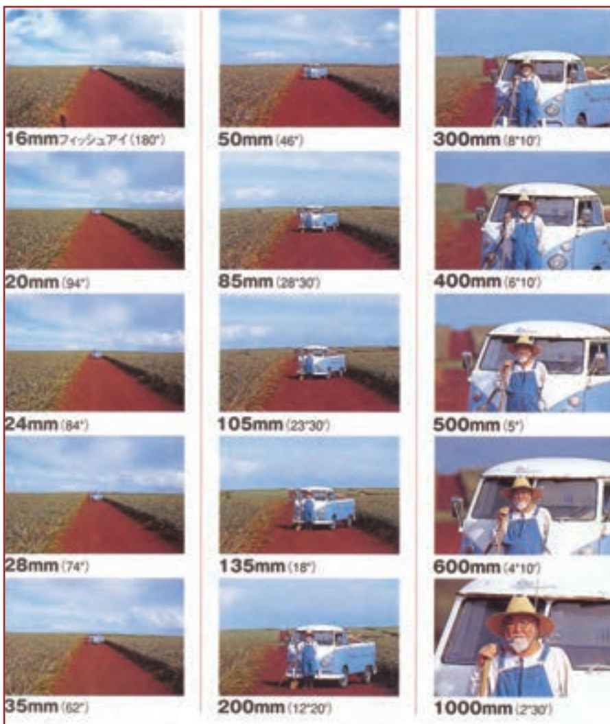
تصویر ۶-۷- تصاویر حاصل از لنزهای مختلف از یک موضوع با زاویه دید هر یک از آن ها