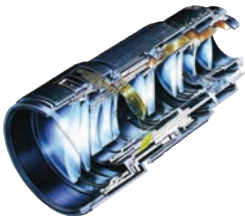
تصویر ۱-۶- تصویری از داخل یک لنز

تصویر تشکیل شده توسط یک عدسی ساده دارای معایب فراوانی است که برای از بین بردن این معایب چند عدسی همگرا و واگرا را با محاسبات دقیق و در فواصل معین از هم قرار می‌دهند، به این گونه عدسی‌ها عدسی مرکب می‌گویند. هر جا که کلمه لنز را به کار می‌بریم منظور مجموعه‌ای از عدسی‌هاست. (تصویر ۱-۶) برای بالا رفتن کیفیت تصویر و جلوگیری از اتلاف نور، روی عدسی‌های لنز را از مواد خاصی و به صورت لایه‌های بسیار نازکی می‌پوشانند علت این که وقتی به لنزها نگاه می‌کنیم سطح آنها را رنگی می‌بینیم همین است. (تصویر ۲-۶) حفاظت از این لایه‌ها بسیار مهم است تا آنجا که ممکن است، باید از کثیف شدن و در نتیجه پاک کردن لنزها خودداری نمود زیرا با از بین رفتن این پوشش‌های رنگی کیفیت لنزها افت خواهد کرد.