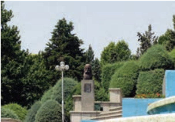
تصویر ۴-۶- لنز نرمال