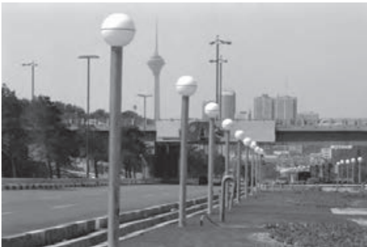
تصویر ۶-۲۳- لنز تله