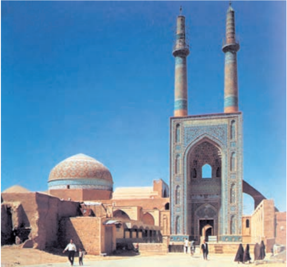
نمونه‌ای از معماری اسلامی سر در مسجد جامع یزد