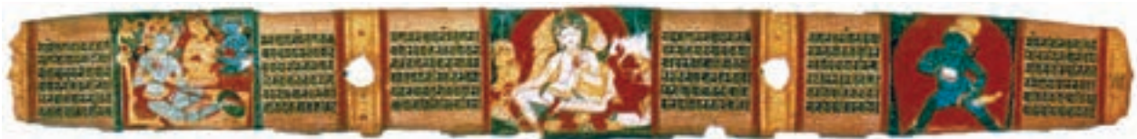
تصویر ۲۲-۳- خلاصه‌ی یک متن کهن، نقاشی بر روی برگ نخل، سده‌ی ۱۱ م

ب) کتاب آرایبی: در هند سابقه‌ی هنر کتاب‌آرایبی کم‌تر از دیوارنگاری است. قدیمی‌ترین کتاب‌های مصور هندی که به حدود سده‌های دهم و یازدهم میلادی مربوط می‌شوند نوعی از کتاب بود که با برگ نخل ساخته می‌شد و در جعبه‌های جلد مانند نگه‌داری می‌شد. هم صفحات و هم جلد را گاهی با نقاشی می‌آراستند. این کتاب‌ها عمدتاً حاوی مضامینی آیینی و مذهبی بود که برخی ویژگی‌های آن یادآور دیوار نگاره‌های پیشین بود (تصویر ۲۲-۳).