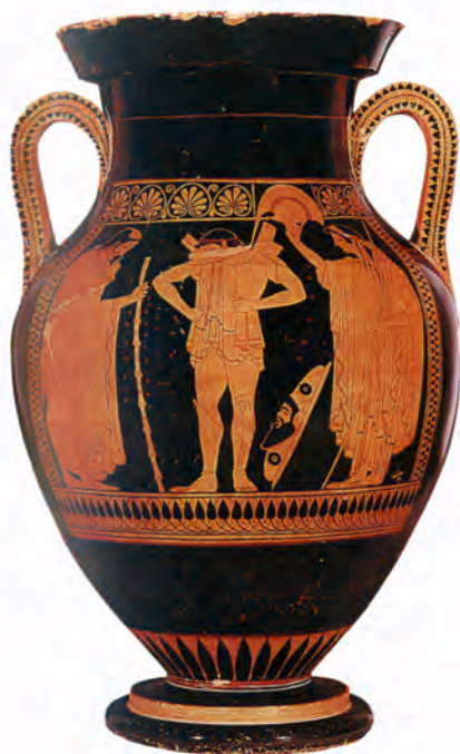
تصویر ۴-۴- گلدان با نقش سرخ (سرخ گون) محل نگهداری موزه واتیکان (سده‌ی پنجم ق.م)

۲- دوره‌ی کهن ۱ : در این دوره ظروف سرخ گون و سیاه گون رواج می‌یابند (تصاویر ۳-۴ و ۴-۴).