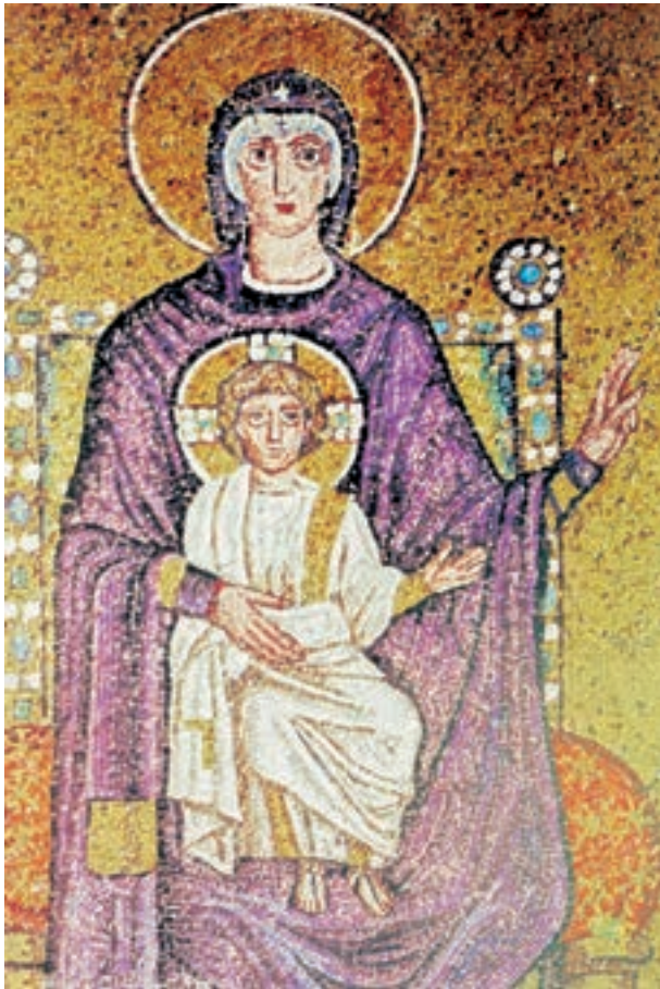
تصویر ۲۴-۴ دیوارنگاری به شیوه‌ی موزائیک، بیزانس، مادونا (حضرت مریم و مسیح کودک) حدود سده‌ی ششم م.

هنر بیزانس تا سده‌ی ششم م، مراحل تکوین خود را پیمود و در هنر موزاییک تبلور یافت. بهترین آثار موزاییک بیزانس را در شهر راونو و در کلیسای سان‌ویتاله ۱ می‌توان یافت. (تصاویر ۲۳-۴ الی ۲۷-۴)