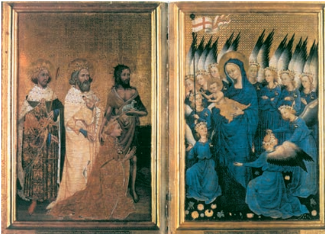
تصویر ۳۳-۴- بحیای تعمید دهنده و قدسیان: ریچارد دوم را در برابر حضرت مسیح و حضرت مریم مقدس شفاعت می‌کند. دو لت جویی، سده‌ی چهاردهم میلادی

۲- نقاشی روی پانل: در این شیوه پس از آماده‌سازی تخته‌های چوب بر روی آن‌ها نقاشی اجرا می‌شد. این پانل‌ها که برای تزین محراب کلیساها به کار می‌رفت، غالباً در چند حالت آماده می‌شد.