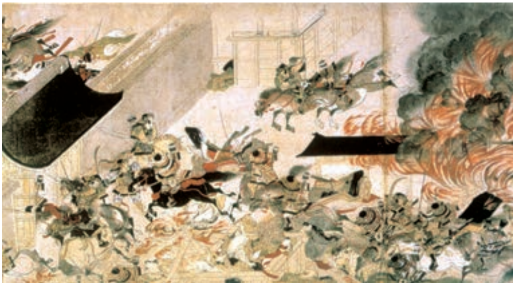
تصویر ۱۵-۳- سوزاندن کاخ سانجو، سده‌ی ۱۳ میلادی، بخشی از یک طومار افقی به طول ۶۸۵ سانتی‌متر. این طومار بزرگ بیانگر یک قیام اجتماعی است.

قطع رابطه با چین در اواخر سده‌ی نهم میلادی زمینه‌ای برای رشد نقاشی بومی فراهم ساخت. ژاپنی‌ها در نقاشی روی دیوارها یا بر سطح پرده‌های چند لته (پاراوان)، که برای آرایش کاخ‌های سلطنتی و کوشک‌های اشراف تهیه می‌شد، مناظری از سرزمین خویش را به تصویر می‌کشیدند. علاوه بر این، طی سده‌های ۱۱ و ۱۲ میلادی هم‌گام با رشد ادبیات ملی، آنان داستان‌های عامیانه و ادبی، مضمون‌های تاریخی و زندگی‌نامه‌ها را بر روی طومارهای افقی تصویرسازی می‌کردند. اگر چینیان نقاشی طوماری را عمدتاً برای منظره‌نگاری به کار می‌بردند، ژاپنی‌ها آن را به خدمت تجسم رویدادهای زندگی گرفتند، ترکیب‌بندی این طومارها برحسب جریان وقایع به چند بخش تقسیم می‌شود. قلم‌گیری نازک و سریع، رنگ‌های غالباً درخشان، و تجسم فضا از زاویه‌ی دید بالا از ویژگی‌های این طومارهای ژاپنی به‌شمار می‌رود. در این گونه نقاشی‌ها جلوه‌های طبیعت گرایانه و تزئین با هم آمیخته شده‌اند. (تصویر ۱۵-۳).