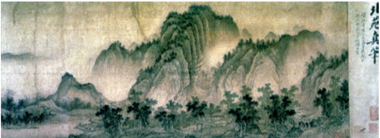
تصویر ۱۳-۳. منظره‌ی کوهستانی، مرکب روی ابریشم، سده‌ی ۱۷ م، طومار افقی.

اگرچه مضامین دنیوی هم چون صحنه‌های زندگی مردم، زنان درباری، حیوانات، به‌ویژه اسب و گل‌ها و گیاهان و پرندگان، در نقاشی چینی به چشم می‌خورد ولی منظره‌نگاری همواره جایگاه خاصی در نقاشی چینی داشته است. چینی‌ها در سده‌ی یازدهم بر اسلوب ترسیم نماهای دور و نزدیک تسلط کامل یافتند ولی اوج منظره‌نگاری در نقاشی چینی عهد سونگ بود، به‌ویژه سده‌ی ۱۲ و ۱۳ م. در این روزگار منظره‌نگاری ناب به اوج شکوفایی رسید. نقاشان اغلب انسان را جزئی کوچک از طبیعت پهناور قلمداد می‌کردند و طبیعت بی‌کرانه را در حالت‌هایی متنوع چون جهانی بی‌انتها، پرشکوه و با اهمیت تصویر می‌کردند (تصویر ۱۳-۳).