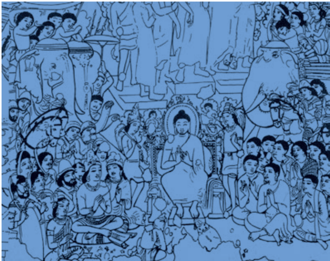
تصویر ۲۱-۳- بودا در میان دوستداران، دیوار نگاره، آجانتا سده‌ی ۶ م

ب) کتاب آرایبی: در هند سابقه‌ی هنر کتاب‌آرایبی کم‌تر از دیوارنگاری است. قدیمی‌ترین کتاب‌های مصور هندی که به حدود سده‌های دهم و یازدهم میلادی مربوط می‌شوند نوعی از کتاب بود که با برگ نخل ساخته می‌شد و در جعبه‌های جلد مانند نگه‌داری می‌شد. هم صفحات و هم جلد را گاهی با نقاشی می‌آراستند. این کتاب‌ها عمدتاً حاوی مضامینی آیینی و مذهبی بود که برخی ویژگی‌های آن یادآور دیوار نگاره‌های پیشین بود (تصویر ۲۲-۳).