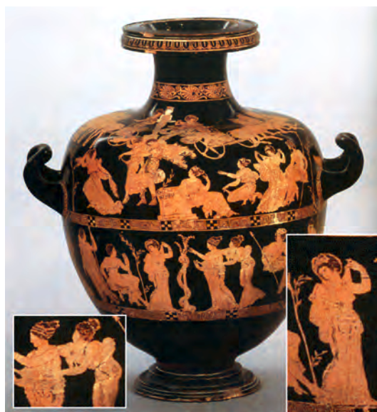
تصویر ۴-۵- گلدان با نقش سرخ (سرخ گون) حدوداً ۴۰۰ ق.م، محل نگهداری بریتیش موزه‌ی لندن

۳- دوره‌ی کلاسیک یا عصر طلایی ۲ : در این دوره مجسمه‌سازی و کنده‌کاری روی سنگ‌های قیمتی و سکه‌سازی رواج پیدا کرد. نقاشان نیز سعی نمودند با نمایش دقیق اجزای بدن و توجه به حرکت‌های زیبا و موزون و تغییر اندازه‌ی اجزا با تکیه بر مشاهدات عینی خود با سایر هنرمندان همگام باشند (تصویر ۴-۵).