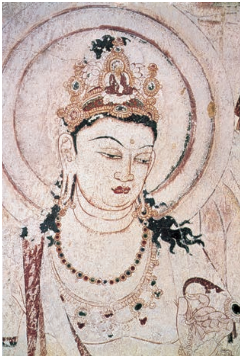
تصویر ۱۴-۳- نقاشی دیواری از معبد هوریوجی، سده‌ی هفتم میلادی، ژاپن در این تصویر تأثیرات نقاشی هندی، به‌ویژه دیوار نگاره‌های غار آجانتا، کاملاً مشهود است.

ژاپن مجمع الجزایری، سر برآورده از آب‌های اقیانوس آرام، در شرق سرزمین چین است. میراث و سنت‌های مشرق‌زمین، به‌خصوص چین، به نحو بارزی در تاریخ و فرهنگ ژاپنی بازتاب یافته است. هنر ژاپنی تقریباً در تمامی مراحل تحول خود از هنر چینی مایه گرفت. هم مواد و هم روش‌های مورد استفاده‌ی هنرمندان ژاپنی غالباً چینی بود و حتی مضمون‌های هنرشان نیز عمدتاً ریشه‌ی چینی داشت. هرچند هنرمندان ژاپنی، گه‌گاه موضوعاتی را از تاریخ یا اساطیر خود و از مذهب شینتو ۱ برمی‌گزیدند. هم‌چنین آیین بودایی، که از سده‌ی شش میلادی وارد ژاپن شد، عامل نیرومندی در تحول مذهب و هنر ژاپنی بود (تصویر ۱۴-۳).