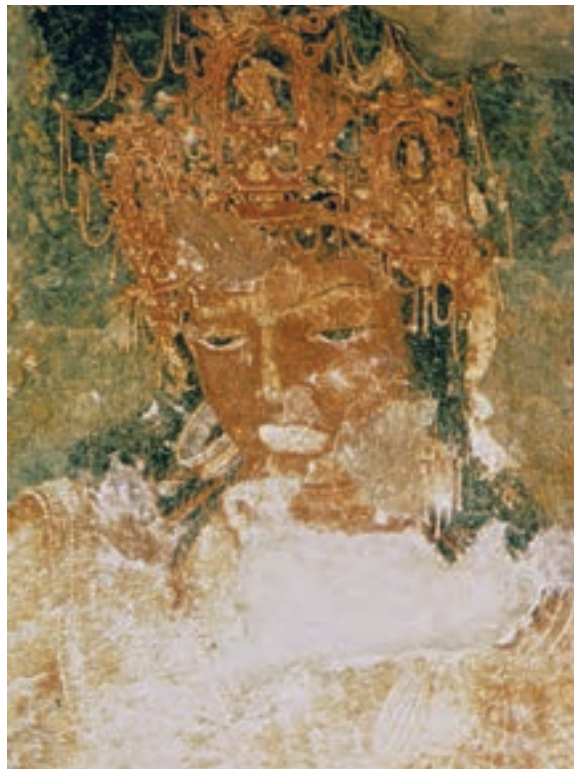
تصویر ۱۹-۳- بودای بزرگ، بخشی از دیوار نگاره‌های معابد غاری آجانتا، سده‌ی ۲ م

تصاویر در ترکیبی پیچیده، تمامی گستره‌ی داخلی معابد را فرا می‌گیرند. رنگ‌های سرخ، سبز و آبی و ارغوانی در نقاشی‌ها بارزترند. قلم‌گیری و تأکید بر خطوط پیرامونی در اغلب قسمت‌ها به چشم می‌خورد و این درحالی است که از حجم‌نمایی نیز چشم‌پوشی نشده است. کاربرد خط، سطح و حجم روابطی خوشایند را پدید می‌آورد که به پیوستگی عناصر تصویر در گستره‌ی سطوح دیوارها و سقف مدد می‌رساند (تصویر ۲۰-۳).