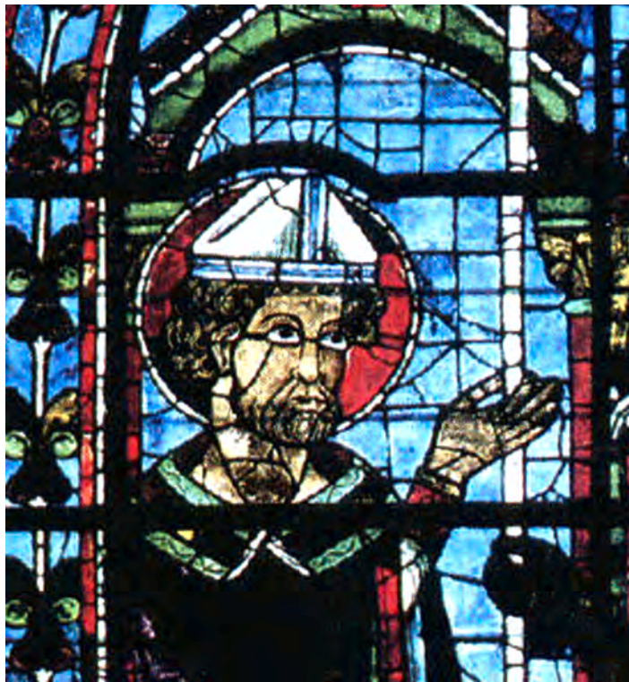
تصویر ۳۲-۴- شیشه نگاره، کلیسای شارتر فرانسه، قرن دوازدهم میلادی (بخشی از اثر)

۲- نقاشی روی پانل: در این شیوه پس از آماده‌سازی تخته‌های چوب بر روی آن‌ها نقاشی اجرا می‌شد. این پانل‌ها که برای تزین محراب کلیساها به کار می‌رفت، غالباً در چند حالت آماده می‌شد.