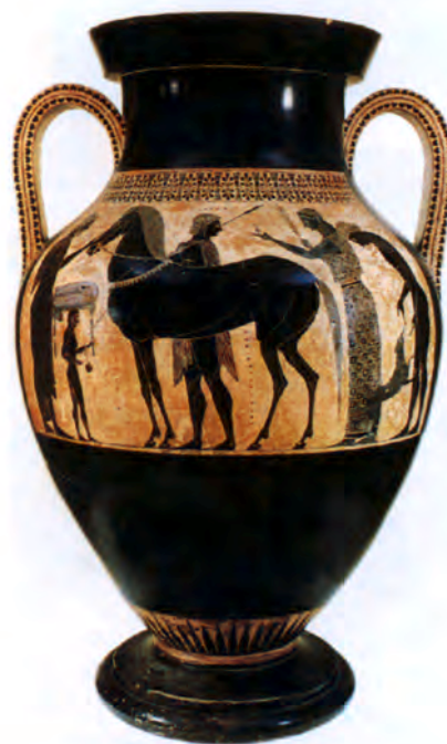
تصویر ۴-۳- گلدان با نقش سیاه (سیاه گون)، محل نگهداری موزه واتیکان

۳- دوره‌ی کلاسیک یا عصر طلایی ۲ : در این دوره مجسمه‌سازی و کنده‌کاری روی سنگ‌های قیمتی و سکه‌سازی رواج پیدا کرد. نقاشان نیز سعی نمودند با نمایش دقیق اجزای بدن و توجه به حرکت‌های زیبا و موزون و تغییر اندازه‌ی اجزا با تکیه بر مشاهدات عینی خود با سایر هنرمندان همگام باشند (تصویر ۴-۵).