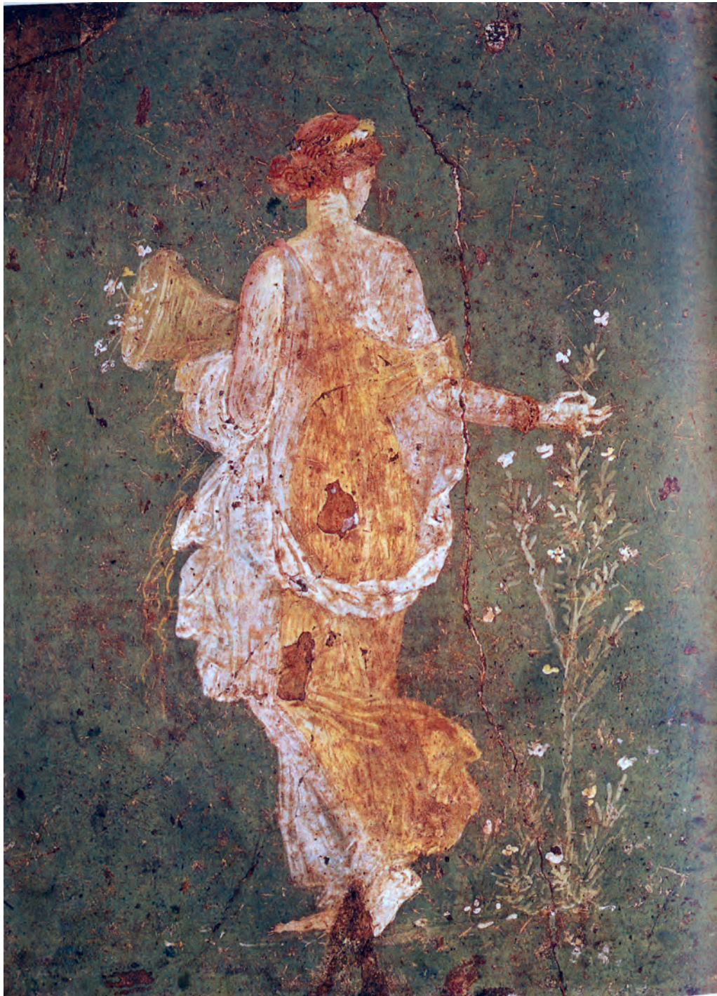
تصویر ۱۶-۴- دوشیزه در حال چیدن گل، قرن اول میلادی، جزئی از یک نقاشی دیواری، موزه ملی باستان‌شناسی، ناپل

در قرن دوم بعد از میلاد مسیح شاهد ظهور شیوه‌ی تکنیکی تازه‌ای در نقاشی رومی می‌باشیم که به تک چهره‌سازی رومی - مصری مشهور است. در این شیوه با استفاده از تکنیک «رنگ موم» ۱ شبیه‌سازی با توجه به ضوابط سایه‌پردازی و برجسته‌نمایی دقیق اجرا شده است (تصاویر ۱۷-۴ و ۱۸-۴).