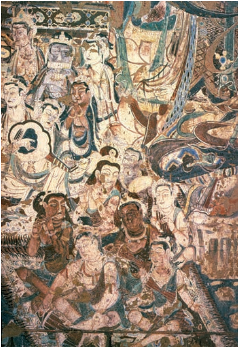
تصویر ۲۰-۳- نوازندگان بودایی، دیوارنگاره، آجاتا، سده ۷ م

اندازه‌ی مختلف پیکرها نشانگر نوعی پرسپکتیو مقامی ۱ است. اندام‌ها در حالتی پرتحرک و سرزنده، که بازتابی از رقص و نمایش مذهبی در هند است، به تصویر درآمده‌اند. اگرچه موضوع و محتوای این تصاویر با جهان ملکوتی مربوط است اما در عین حال توصیفی از دنیای نفسانی نیز هست. اصولاً یکی از ویژگی‌های هنر هند، از جمله در نقاشی‌های پرستشگاه‌ها و در تصاویر کتاب‌ها، آن است که مفاهیم دینی و معنوی را به صورتی دنیوی و زمینی نشان می‌دهد. به عبارت دیگر صحنه‌ها و پیکرها به وضوح عواطف نفسانی و خواست‌های جسمانی را می‌نمایانند. درحالی که این‌ها فقط بازتابی نمادین از اندیشه‌های عارفانه است (تصویر ۲۱-۳).