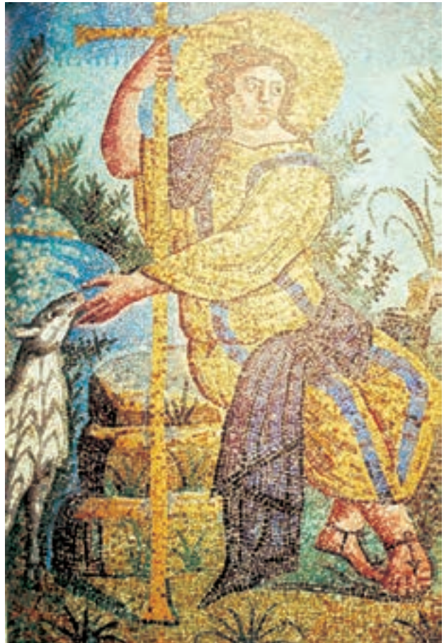
تصویر ۲۳-۴ دیوارنگاری به شیوه‌ی موزائیک حضرت مسیح در هیئت چوپان نیکوکار، راونو حدود ۴۲۵-۴۵۰ م