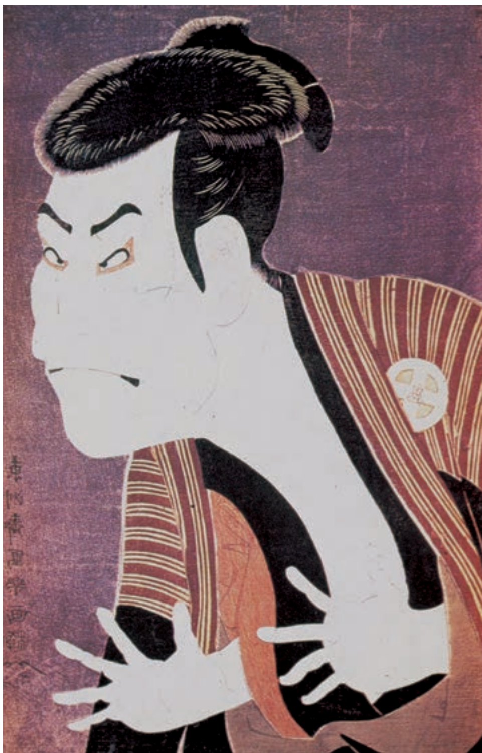
تصویر ۱۷-۳- بازیگر کابوکی باسমে، اواخر سده‌ی هجدهم میلادی. اثر توشوسای شاراکو