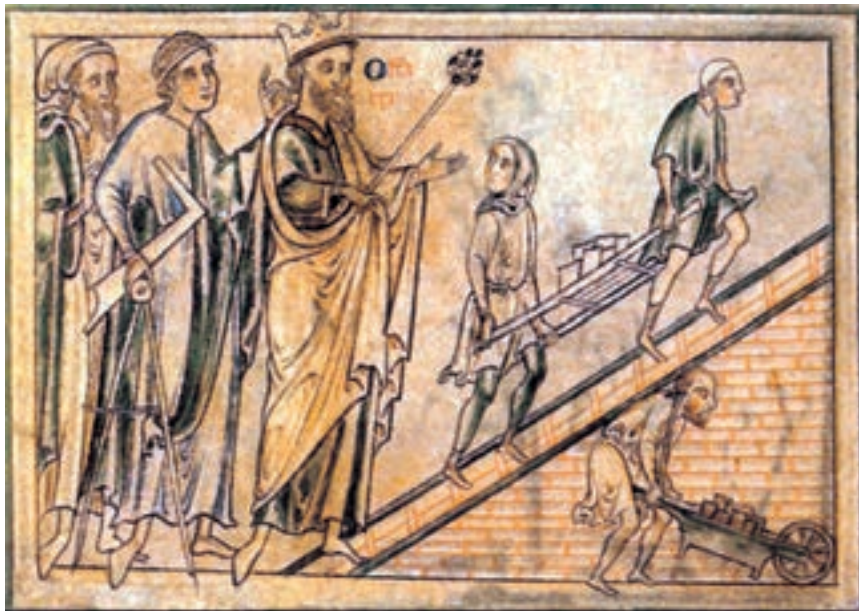
تصویر ۳۰-۴- طراحی ماتیو، پاریس در وقایع نام‌های صومعه‌ی رومن، پادشاه به همراه معمار خود از محل ساختمان یک کلیسای جامع دیدن می‌کند. قرن سیزده میلادی