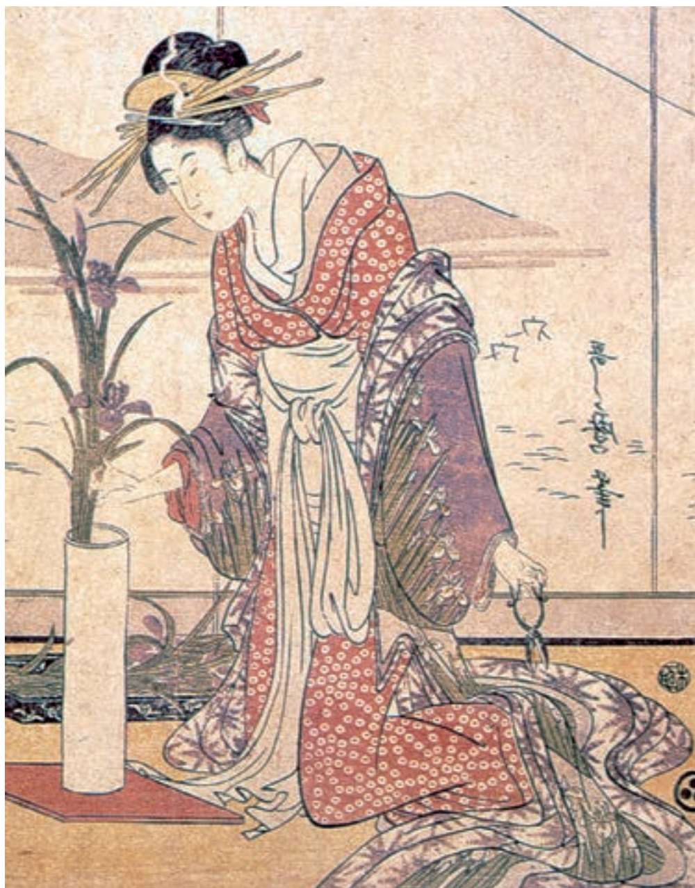
تصویر ۳-۱۶- گل آرایبی، باسمه، سده‌ی هجدهم میلادی، اثر گیتا گاو اوتامارو

باسمه‌های ژاپنی تأثیر عمیقی بر هنر اروپایی اواخر سده‌ی نوزدهم میلادی گذاشت. از میان هنرمندان قرن نوزدهم می‌توان به تولوز لوترک اشاره نمود ۱ که با تأثیرپذیری از باسمه‌های ژاپنی (تصاویر ۳-۱۶، ۳-۱۷ و ۳-۱۸) پوسترهای تبلیغاتی زیادی برای تماشاخانه‌ها و معرفی هنرپیشه‌ها چاپ و تکثیر نمود.