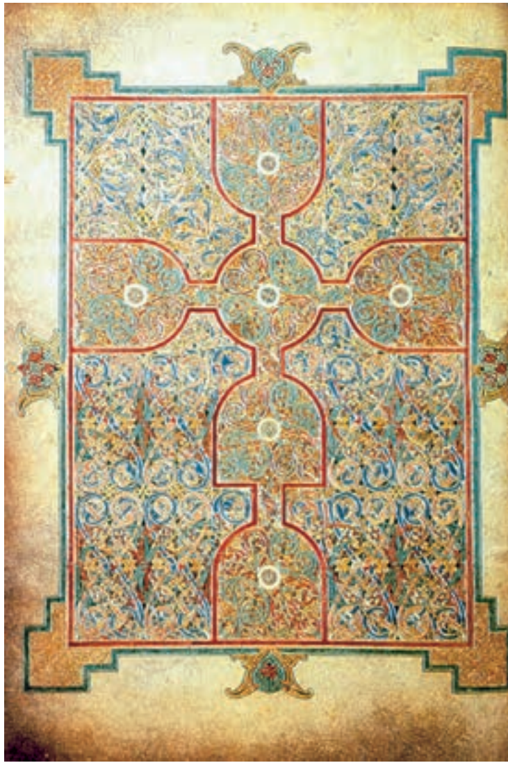
تصویر ۲۹-۴- انجیل لیندیس فارن، سده‌ی هشتم میلادی