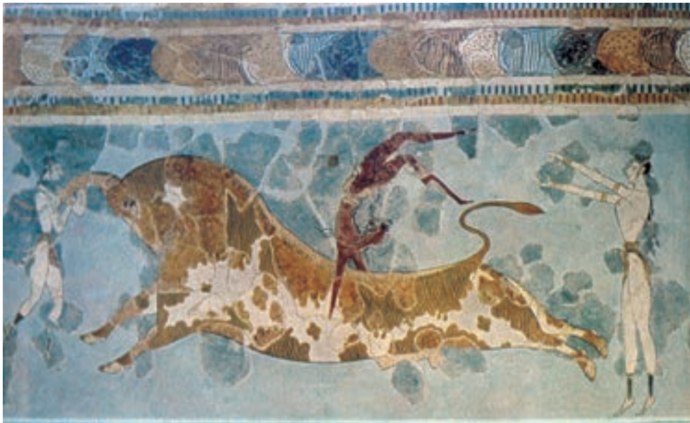
تصویر ۱-۴- هنر کِرتی، نقاشی دیواری از گاو‌بازی حدود ۱۵۰۰ ق.م