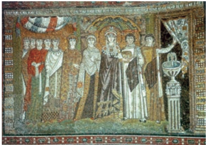
تصویر ۲۶-۴- دیوارنگاری به شیوهی موزائیک، بیزانس، ملکه تئودورا و ملازمان راونا حدود ۵۴۷ م.

موزاییک‌های راونا از میراث سنت‌های هنری یونانی - رومی و سنن هنری خاور زمین برخوردار بودند. محتوای این هنر آمیختگی دو جنبه‌ی مذهبی و درباری را منعکس می‌کند. به عبارت دیگر، در این موزاییک‌ها وحدتی بین شکوه و جلال دنیوی و اخروی ایجاد شده، که بازتاب انطباق قدرت سیاسی و مذهبی در وجود یک فرد واحد یعنی امپراتور است. شیوه‌ی آن به تجرید گرایش داشت و طرح‌های خطی و رنگ‌های تخت و عناصر تزئینی برای نمایش زیبایی‌های روحانی و آرمانی به کار می‌رفت؛ بدین ترتیب هنر مسیحی از قالب بی‌پیرایه‌ی نقاشی‌های به اصطلاح دخمه‌ای، به قالب پرشکوه موزاییک‌کاری «راونا» زیر نفوذ امپراتوران مسیحی، متحول گردید.