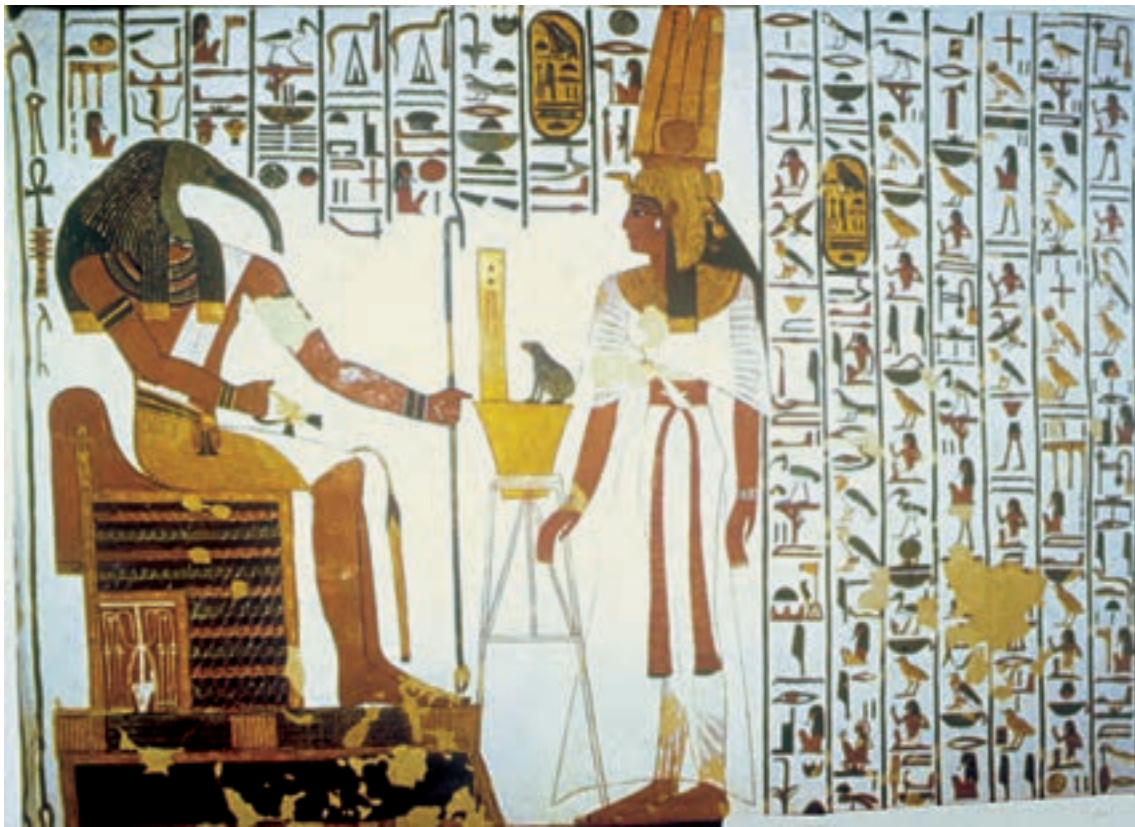
تصویر ۳-۶- نِفرتاری و خدای «توت» بخشی از دیوار نگاره، ابوسمبل، حدود ۱۲۵۵ ق. م خط هیروگلیف، علاوه بر انتقال مفاهیم به موازات دیوار نگاره‌ها، نقشی مؤثر در آراستن فضاهای داخلی بناهای مصری ایفا می‌کرد.

صحنه‌های نقاشی کم‌تر با زمان و مکان مشخصی ربط داشت و پس زمینه‌ها معمولاً دارای طرحی ساده و قراردادی بود. نقاش مصری پرسپکتیو را نمی‌شناخت و اغلب موضوع موردنظرش را در چند بخش ثبت می‌کرد. در نقاشی‌های به‌جا مانده، پایین‌ترین بخش نشان‌دهنده‌ی پیش زمینه است. در هر بخش اشیای عقب‌تر یا داخل اشیای دیگر و یا در بالای آن نشان داده می‌شوند. گاه نیز قطعات و یا پیکرهای جداگانه مراحل مختلف یک عمل را می‌نمایانند. در هر حال اصل بر آن بوده است که نمایش اشیاء و صحنه‌ها صورت توصیفی داشته باشد، نه چنان که در لحظه یا زمان و مکانی معین به نظر آید.