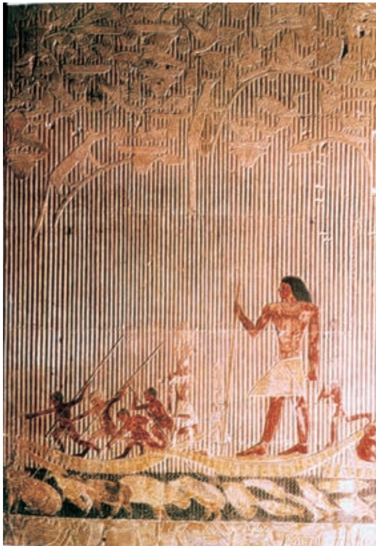
تصویر ۳-۴—نقش برجسته‌ی رنگ‌آمیزی شده، «تی» در حال شکار در مرداب، از مقبره‌ی تی، سقاره، حدود ۲۴۰۰ ق.م