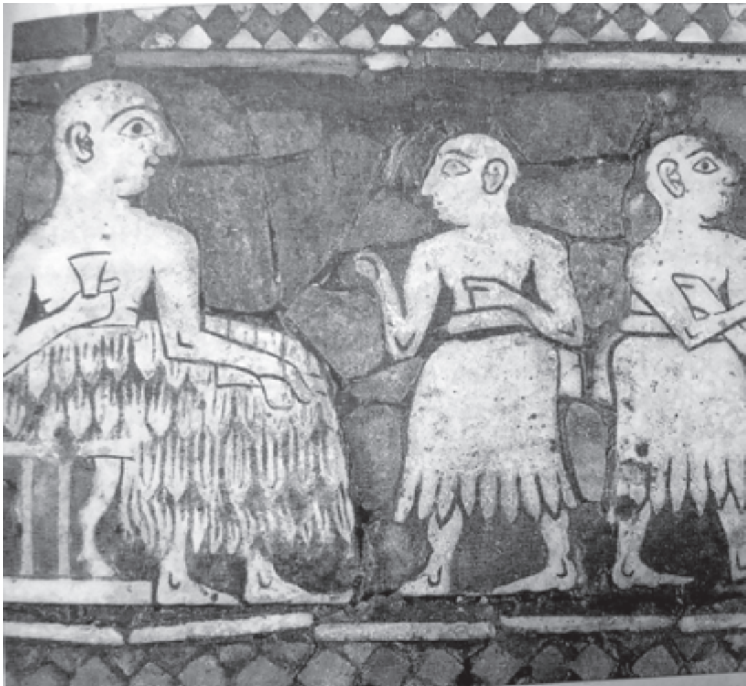
تصویر ۳-۳- بخشی از نشان شهر اور، اواسط هزاره‌ی سوم ق.م