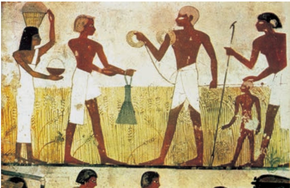
تصویر ۳-۵- پرداخت مالیات، بخشی از دیوار نگاره، حدود ۱۵۰۰ ق. م

اساس کار نقاشی مصری بر روایتگری قرار داشت، بی‌آن که طبیعت‌پردازی کند و یا اشخاص و اشیاء را به همان شکلی که هستند بنمایاند، او از قواعد معینی تبعیت می‌کرد که ناشی از تمایل وی به نمایش مستقیم و واضح و ساده‌ی اشخاص و دنیای پیرامون بود. معمولاً سر و دست و پا از زاویه‌ی نیم‌رخ ولی چشم و نیم‌تنه از زاویه‌ی روبرو ترسیم می‌گردید. این طرز ترسیم اشخاص تابع قاعده‌ای بود که آن را اصل تقابل ۱ گویند و نه تنها در هنر مصر که در هنر سایر جوامع باستانی خاورزمین، از جمله بین‌النهرین نیز، مورد پیروی قرار می‌گرفت ولی مصریان توجه و تأکید بیش‌تری به آن داشتند. (تصویر ۳-۵)