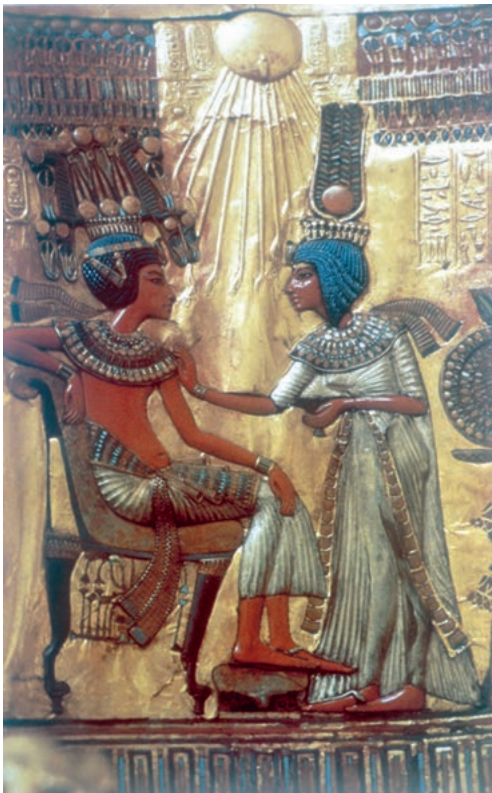
تصویر ۳-۸- بخشی از تزئینات آرامگاه توت عنخ آمون، نقاشی بر روی پوشش طلا، حدود ۱۵۰۰ ق. م

موضوع دیوار نگاره‌ها عبارت بودند از صحنه‌های روستایی، کشت و برداشت، کارگران در حال کار، فرعون و خانواده‌اش در حال بازی و جنگ و تفریح و یا حضور در میهمانی‌های درباری و مراسم مذهبی. این تصاویر، وقایع و اعمال روزمره را در حیات پس از مرگ نشان می‌دادند (تصاویر ۳-۸ و ۳-۹).