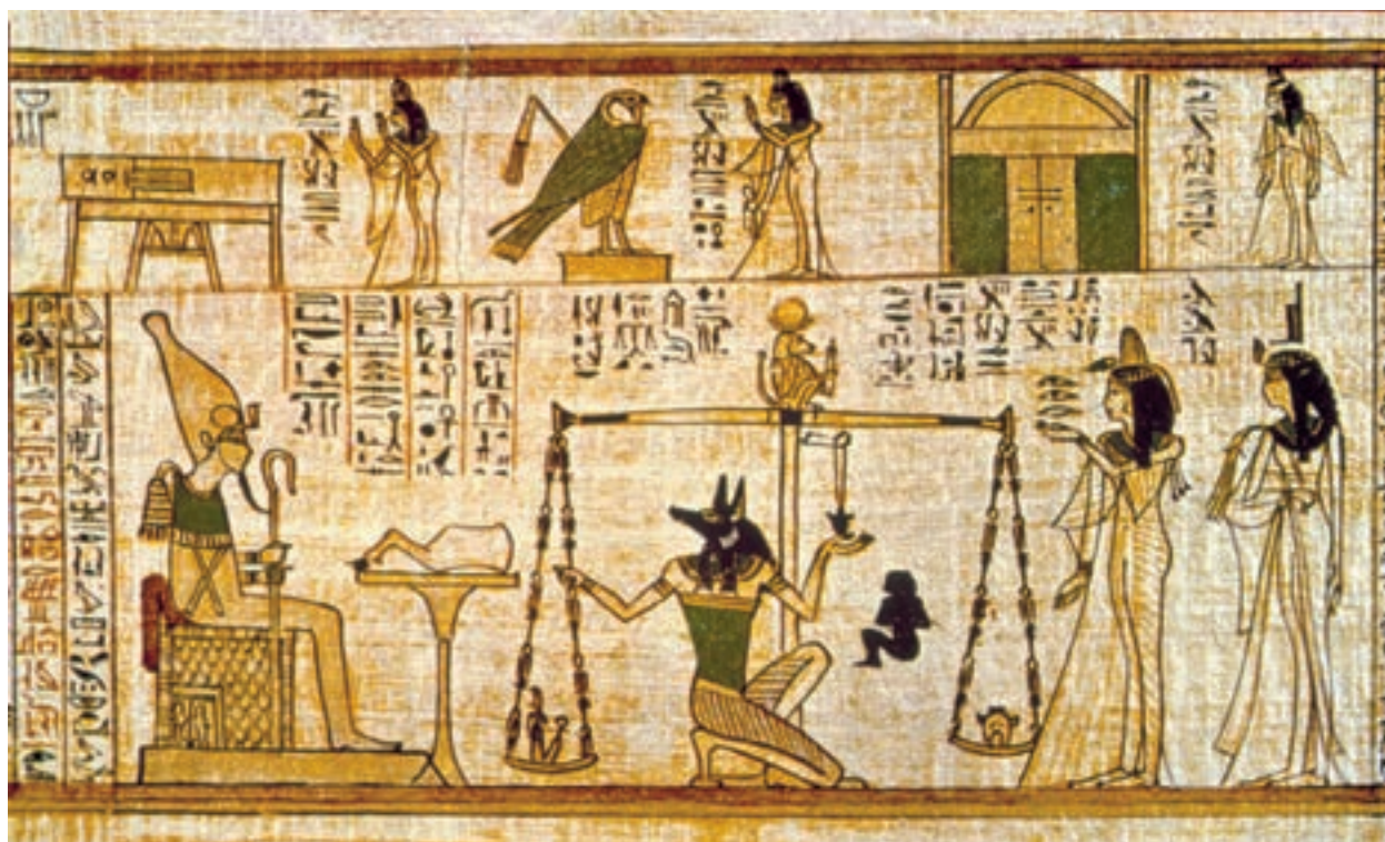
تصویر ۹-۳- خدای شغال «آنوبیس» قلب مرده‌ای را می‌آزماید، بخشی از یک تومار پاپیروس. ۱۲۸۵ ق. م

در اعتقاد مصریان باستان آنوبیس خدای محافظ گورستان‌ها و خدای مرگ به‌شمار می‌رفت و اغلب به شکل آدمی با سر شغال به تصویر درمی‌آمد. در این جا وی را در حال عملکردی ناشناخته به تصویر درآورده‌اند. این‌گونه تصاویر آیینی شاید دیگر هیچ‌گاه به درستی قابل درک و فهم نباشند. زیرا مفاهیم اعتقادی‌ای که موجب خلق آن‌ها شده، امروزه از میان رفته است.