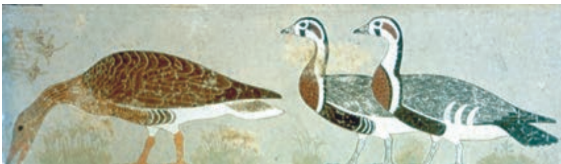
تصویر ۳-۷- غازهای مِذوم، بخشی از دیوار نگاره، بلندی حدود ۴۵ سانتی‌متر حدود ۲۶۰۰ ق. م.

با آن که در دیوار نگاره‌های مصری جنبه‌های قراردادی و خصلت‌های نمادین اهمیت دارد و این شیوه طی تقریباً سه هزار سال، کمابیش بدون تغییر اساسی، تکرار می‌شده‌اند ولی مهارت‌های فنی هنرمند گاه‌به‌گاه، در اجزای نسبتاً کم اهمیت، خود را نشان داده است، مثلاً در شکل حیوانات، و به‌خصوص پرندگان، که نزدیک به شکل طبیعی ترسیم می‌گردیده‌اند. (تصویر ۳-۷)