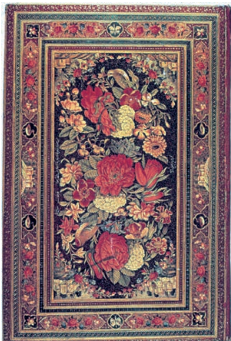
تصویر ۵۲-۲- گل و مرغ، نقاشی زیرلاکی، اثر لطفعلی صورتگر، سده‌ی ۱۳ ه.ق

در این روزگار روش غالب، استفاده از رنگ روغنی و بوم‌های پارچه‌ای بزرگ است این وسیله‌ی جدید که از اواسط حکومت صفویه و در مکتب اصفهان، در میان نقاشان رواج یافته بود به تدریج اصلی‌ترین ابزار در تولید تابلوهای نقاشی می‌شود. نقاشی زیرلاکی نیز که با آبرنگ اجرا می‌شد در این دوره رونق می‌یابد و از استادان آن می‌توان علی‌اشرف و لطفعلی صورتگر را نام برد (تصویر ۵۲-۲).