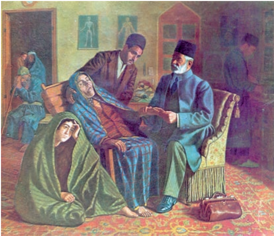
تصویر ۶۸-۲- طبیب و بیمار، اثر حسین شیخ، رنگ روغن روی بوم، ۱۳۱۵ ه.ش.