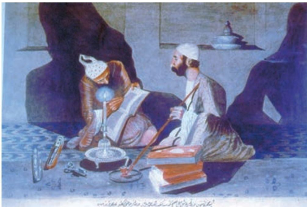
تصویر ۲-۶۲- استنساخ، اثر محمودخان صبا، رنگ روغن روی بوم، ۱۲۷۵ ه.ق