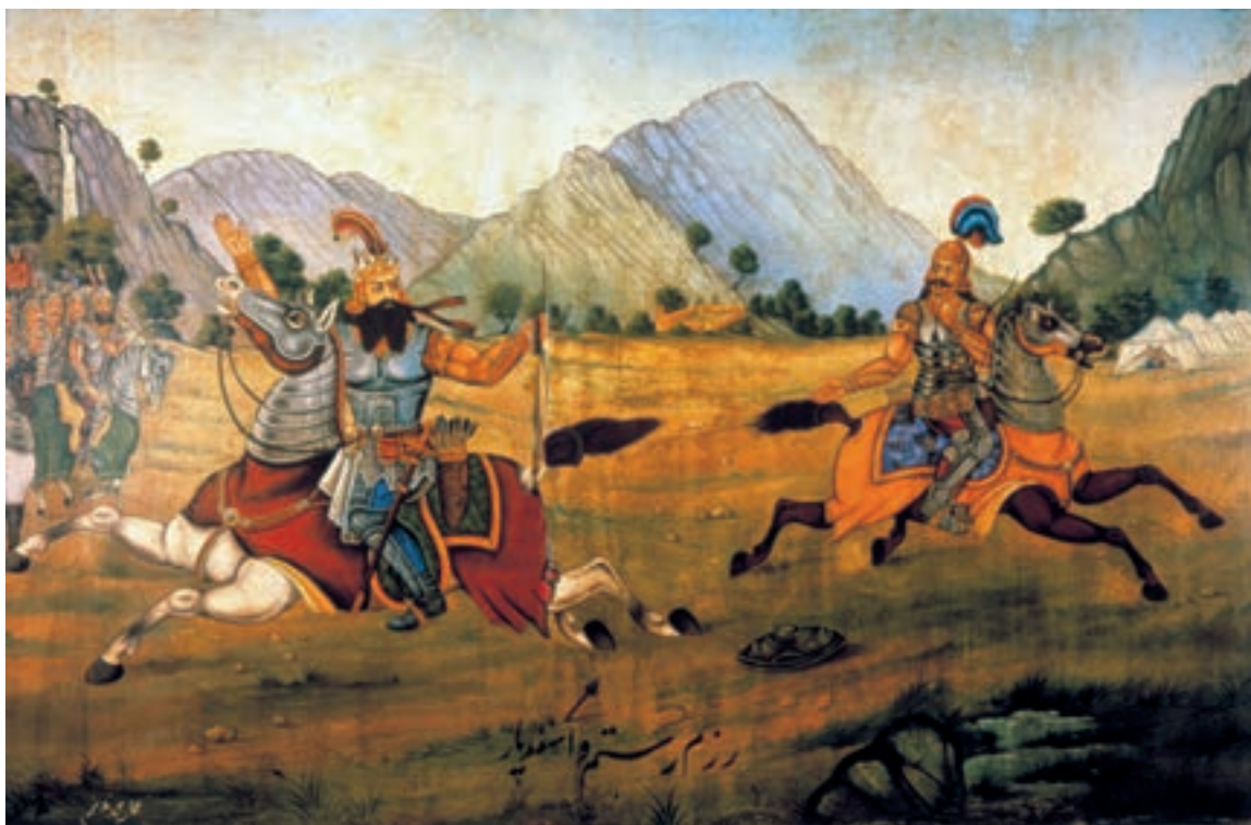
تصویر ۲-۷۰- جنگ رستم و اسفندیار، اثر محمد مدبّر، رنگ روغن روی بوم.

نقاشی قهوه‌خانه‌ای با نقاشانی هم‌چون حسین قولرآقاسی و محمد مدبّر در اوایل سده‌ی حاضر به اوج خود رسید و بر هنر معاصر تأثیر گذاشت. این نقاشان شاگردانی چون حسین همدانی، حسن اسماعیل‌زاده و عباس بلوکی‌فر را پرورش دادند. امروزه با رشد ارتباطات و رسانه‌هایی نظیر رادیو و تلویزیون، این‌گونه آثار روایی که با نقلی (و نمایش سنتی تعزیه) ارتباطی نزدیک داشت و دیگر کارکرد خود را از دست داده‌اند، از رونق افتاده است (تصاویر ۲-۷۰، ۲-۷۱ و ۲-۷۲).