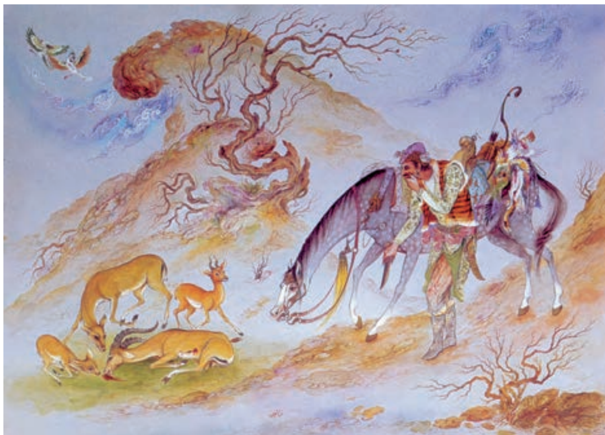
تصویر ۷۵-۲- شکار، اثر محمود فرشچیان، حدود ۱۳۴۰ ه.ش

د- نقاشی نوگرا (مدرن): نفوذ گسترده‌ی گرایش‌های نقاشی مدرن به داخل ایران، همزمان با جنگ جهانی دوم و به موازات رفتن رضاشاه از ایران و برقراری مختصر آزادی‌های اجتماعی و سیاسی، اتفاق افتاد. تشکیل دانشکده‌ی هنرهای زیبا، اعزام گسترده‌ی دانشجویان برای فراگیری هنر به اروپا و تدریس استادان اروپایی در مراکز هنری ایران و توسعه‌ی ارتباطات جهانی، عواملی بود که گروه‌های تحصیل کرده و نوجوی هنر را به سوی هنر مدرن اروپایی کشاند. البته این درحالی بود که حدود ۷۰ سال از پیدایش مکتب‌های مدرن در اروپا می‌گذشت.