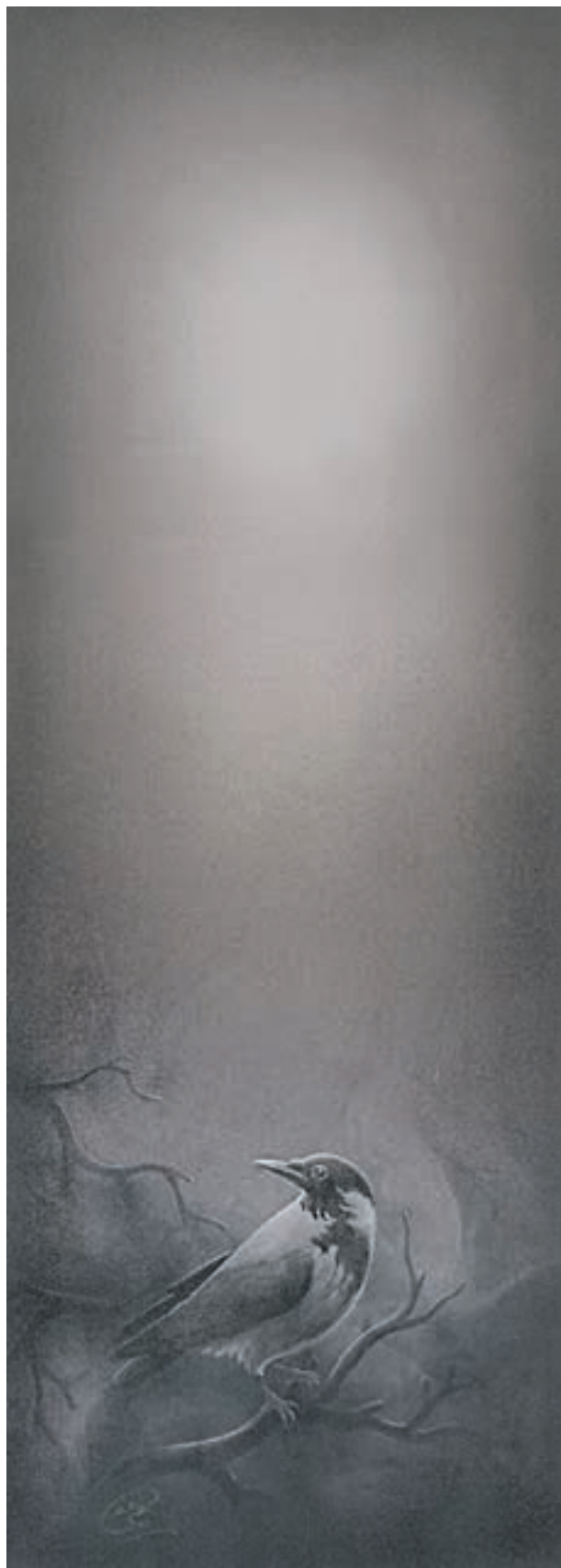
اثر : عبدا... حاجیوند (نقاشی برای همین کتاب)

کادر عمودی برای مرگ در آسمان و افقی برای مرگ در دریا انتخاب شده اند.