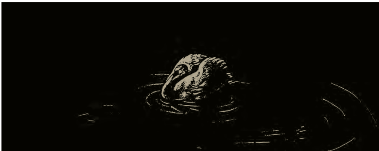
اثر : عبدا... حاجیوند (نقاشی برای همین کتاب)