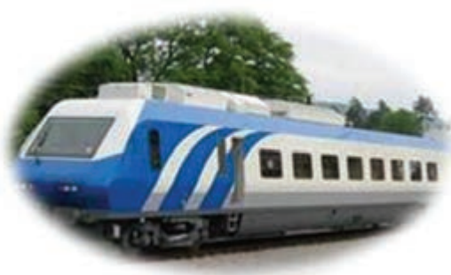
شکل ۲-۱۵- چشم‌انداز آینده استان در بخش حمل و نقل