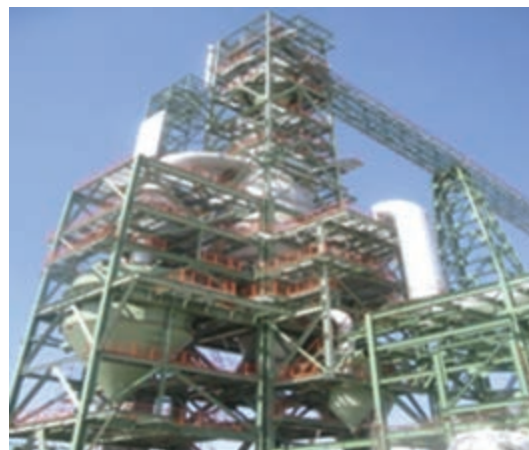
شکل ۱۴-۲- نمونه‌ای از توسعه صنعت بعد از انقلاب اسلامی (فولاد و نیروگاه قاینات) جدول ۱۴-۱- شاخص‌های صنعت و معدن در استان خراسان جنوبی در سال ۱۳۸۹