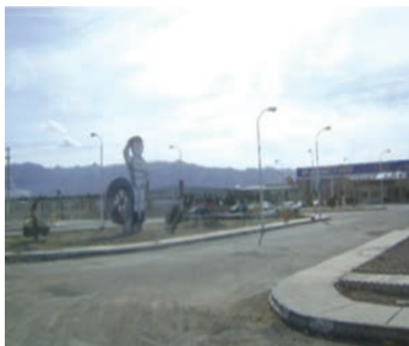
شکل ۱-۴- شهرک صنعتی بیرجند