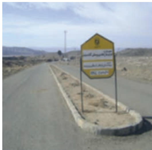
شکل ۴-۱۴- اجرای طرح‌های هادی، راهبردی مناسب برای عمران روستایی