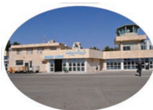
شکل ۶-۱۴ فرودگاه بین‌المللی بیرجند