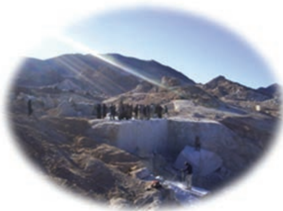
شکل ۳-۱۴- توسعه معادن بعد از انقلاب اسلامی