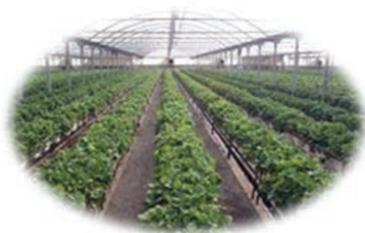
شکل ۱-۱۵- چشم‌انداز آینده استان در بخش کشاورزی