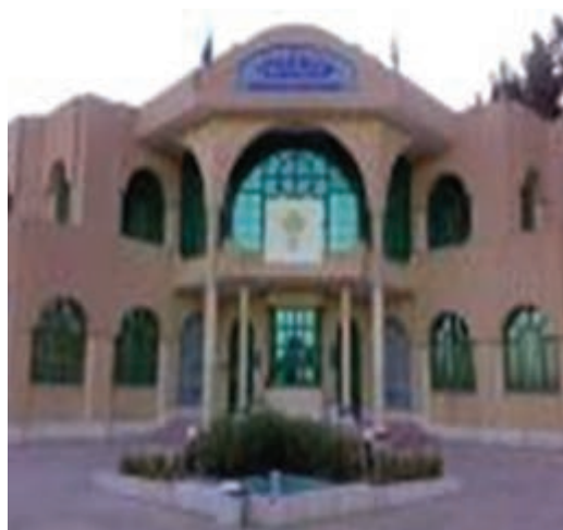
شکل ۸-۱۴- کتابخانه امام رضا (ع)