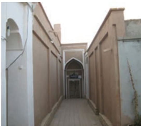
شکل ۹-۱۴- موزه بشرویه

● فعالیت‌های فرهنگی: پس از پیروزی انقلاب اسلامی گسترش مراکز فرهنگی و ایجاد مکان‌هایی که در مسیر فعالیت‌های فرهنگی قرار دارند، مورد توجه مسئولان استان ما قرار گرفت. کتابخانه‌ها، کانون‌های پرورش فکری کودکان و نوجوانان، مجتمع‌های فرهنگی - هنری، موزه‌ها، سینماها، انجمن‌های نمایشی از آن جمله‌اند.