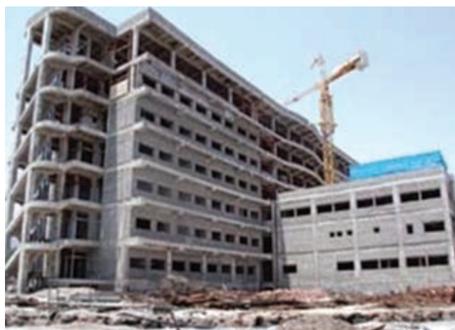
شکل ۱۰-۱۴- عملیات ساخت بیمارستان ۲۰۰ تختخوابی امام رضا(ع)

● فعالیت‌های بهداشتی درمانی: از دستاوردهای مهم انقلاب اسلامی در استان خراسان جنوبی، ارتقای شاخص‌های بهداشتی، درمانی و اختصاص اعتبارات ویژه به بهداشت و درمان است. توسعه مراکز و پایگاه‌های بهداشتی طبق نظام شبکه بهداشت و درمان، راه‌اندازی واحدهای جدید بهداشتی برای دسترسی بیشتر مردم به خدمات بهداشتی و درمانی به خصوص در مناطق روستایی از اقدامات مهم وزارت بهداشت و درمان در سال‌های بعد از انقلاب است.