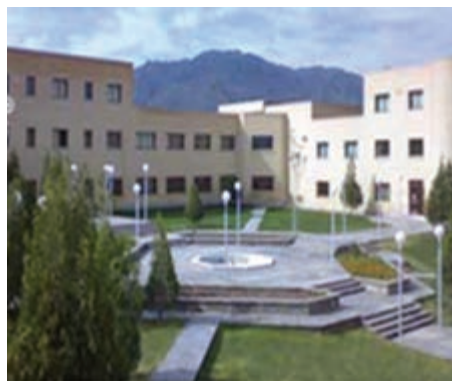
شکل ۷-۱۴ دانشگاه صنعتی بیرجند