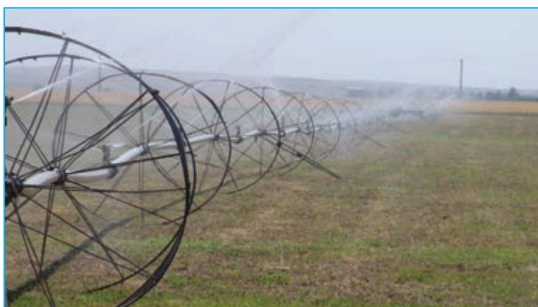
شکل ۲-۶- شیوه‌های نوین آبیاری در بخش کشاورزی در استان

۳- کشاورزی : بخش کشاورزی به عنوان بستر برای کسب اهداف توسعه در کشورهای مختلف امری ضروری قلمداد می‌شود. بخش کشاورزی به طور مستقیم از طریق تولید و صادرات بیشتر و به صورت غیر مستقیم از طریق افزایش تقاضا برای خدمات و فرآورده‌های صنعتی و تهیه مواد اولیه و تولید، به رشد اقتصادی کمک می‌کند و موجب ایجاد فرصت‌های شغلی جدید می‌شود. بخش کشاورزی سازمان یافته و یک پارچه می‌تواند به بهبود امنیت غذایی مردم و کاهش قیمت‌های محصولات غذایی و افزایش اشتغال و تولید و ایجاد پیوندهای اقتصادی مهم در زنجیره غذایی و ایجاد تأثیرات مثبت در محیط زیست کمک کند.