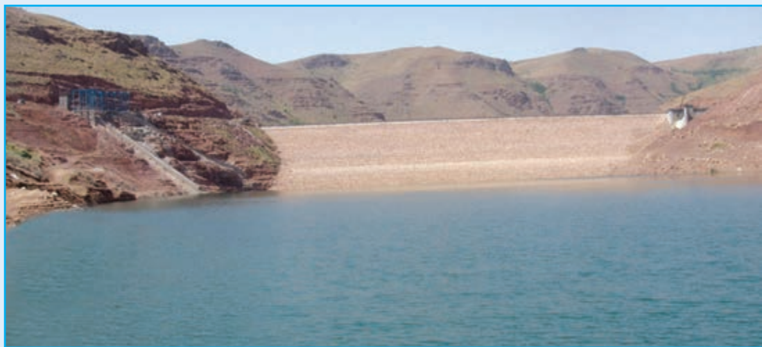
شکل ۳-۶- سد قلعه چای عجب‌شیر

۴- آب : بر اساس آمار سازمان آب منطقه‌ای استان، در حال حاضر مصرف آب‌های سطحی استان از طریق ۱۴۳ سد و بند مخزنی و بند انحرافی، ۷ ایستگاه پمپاژ و ۲۷ شبکه آبیاری و زه‌کشی انجام می‌گیرد. در سال ۱۳۹۰ شاخص بهره‌برداری از آب‌های سطحی و زیرزمینی استان به ترتیب ۵۳/۴ و ۷۹ درصد بوده است.