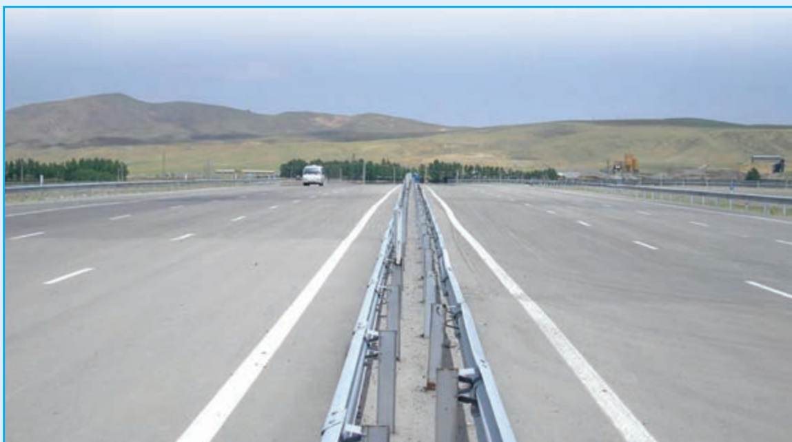
شکل ۴-۶- آزادراه تبریز- زنجان

۹- راه و ترابری : استان آذربایجان شرقی تا سال ۱۳۹۰، ۲۵۲/۱ کیلومتر آزادراه و ۲۹۸/۶ کیلومتر بزرگراه داشت. همچنین تا همین سال طول راه‌های اصلی استان ۱۰۲۹ کیلومتر و راه‌های فرعی ۱۷۴۴/۵ کیلومتر بوده است. طول راه‌های روستایی استان معادل ۱۰۴۲۳ کیلومتر بوده که ۴۳۴۸ کیلومتر (۴۲/۹ درصد) آن آسفالت‌ه بوده است.