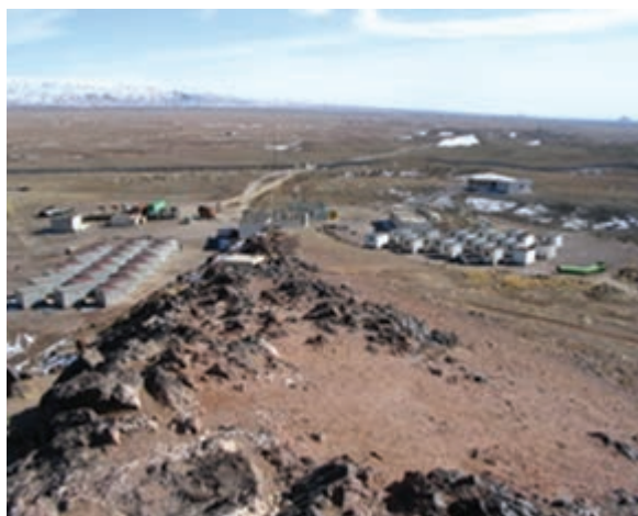
شکل ۳۳-۱۲- آب گرم فردوس