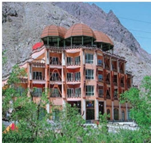
شکل ۱۱-۱۲- هتل کوهستان بند عمرشاه (امیرشاه) بیرجند