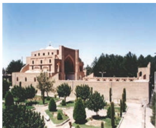
شکل ۳۶-۱۲- مسجد جامع قاین