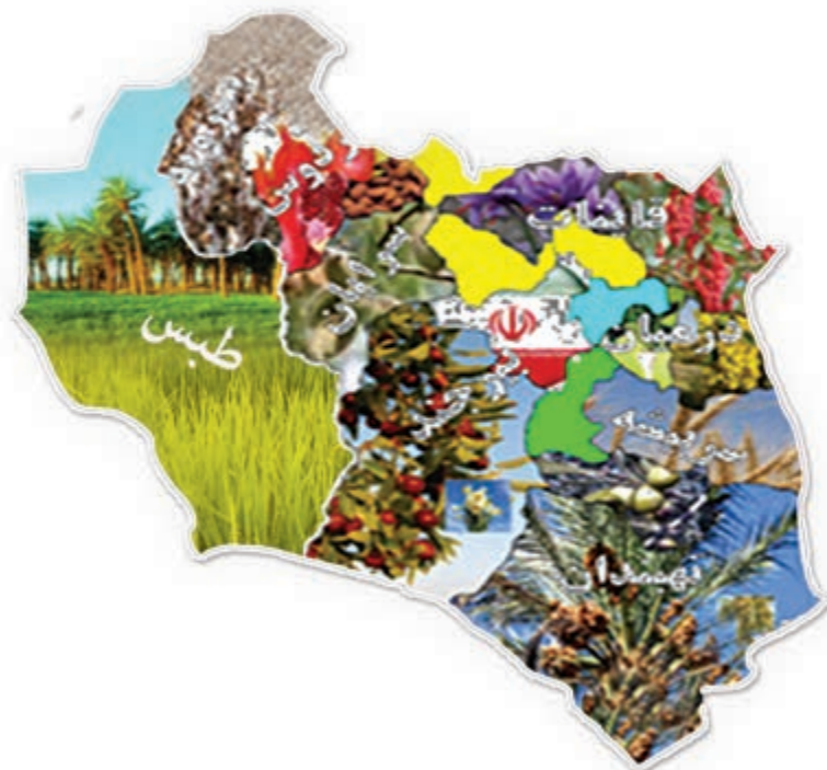
شکل ۲-۱۳- نقشه پراکندگی محصولات کشاورزی استان

استان ما دارای ۱۳۲۶۳۹ هکتار اراضی زیر کشت محصولات زراعی با تولید ۵۷۰۴۱۲ تن و ۴۶۸۸۸ هکتار سطح زیر کشت محصولات باغی با تولید ۶۱۸۹۳ تن است. همچنین از لحاظ دام، استان دارای ۳۴۱۹۳۷۷ واحد دامی می باشد که علاوه بر تولید نیاز استان، به سایر استان های همجوار نیز تولیدات آن ارسال می شود.