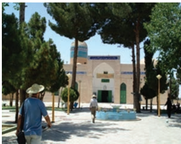
شکل ۳۲-۱۲- امامزادگان سلطان محمد و سلطان ابراهیم