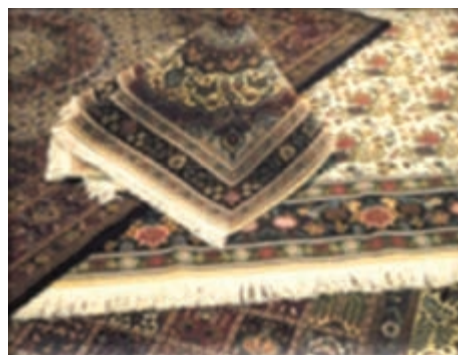
شکل ۶-۱۳- فرش مود

* کدام یک از صنایع دستی در شهرستان محل زندگی شما از رونق برخوردار است؟ چند مورد را نام ببرید.