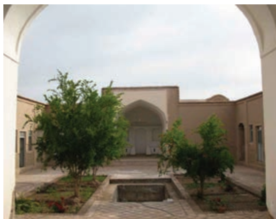
شکل ۱۳-۱۲- خانه تاجور شهر خوسف