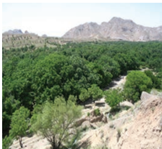
شکل ۲۰-۱۲- دره ییلاقی کریمو و مصعبی سرایان