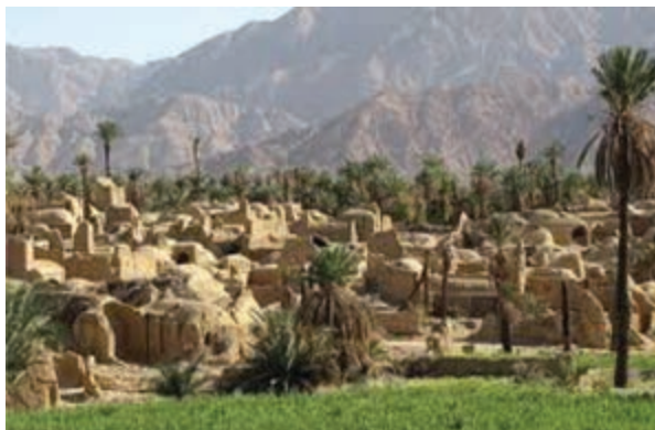
شکل ۳۱-۱۲- روستای اصفهک

● منطقه نمونه گردشگری تون و باغستان - آبگرم فردوس: شهر تاریخی و قدیمی تون در جنوب شهر فردوس با وسعتی حدود ۱۸ هکتار واقع شده است که مجموعه‌ای از جاذبه‌های تاریخی و فرهنگی را تشکیل می‌دهد؛ اما منطقه نمونه گردشگری باغستان آبگرم بیشتر از جاذبه‌های طبیعی برخوردار است.