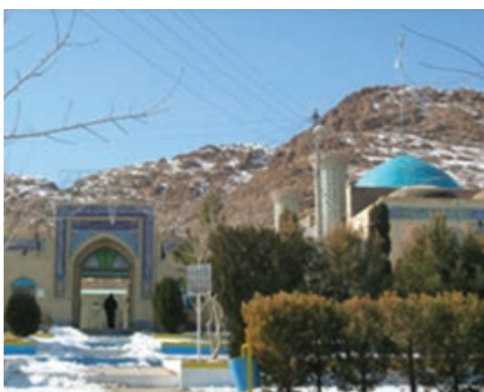
شکل ۶-۱۲- امامزاده هوگند بشرویه