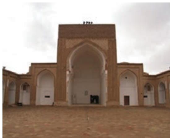
شکل ۳۴-۱۲- مسجد جامع فردوس

● منطقه نمونه گردشگری بوذرجمهر قاین : منطقه نمونه گردشگری بوذرجمهر با وسعتی حدود ۵۰۹ هکتار در ضلع شرقی شهر قاین واقع شده است که پیوند تنگاتنگی با پایتخت زعفران جهان و کانون شهری دیرینه و پایدار سرزمین قهستان و فرهنگ و تمدن کهن دارد.