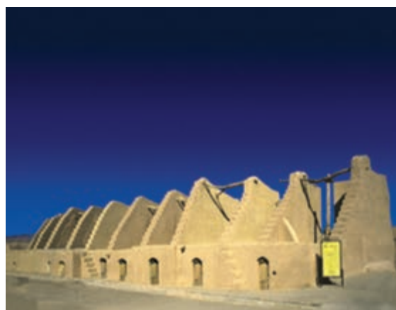
شکل ۳۹-۱۲ آسبادهای خوانشرف نهبندان