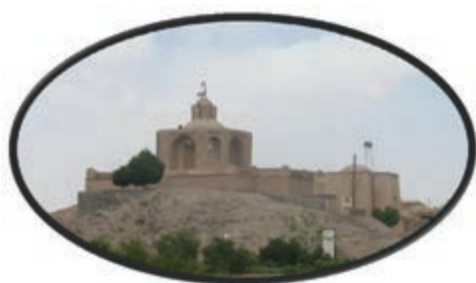
شکل ۱۶-۱۲- آرامگاه ابن حسام در شهر خوسف