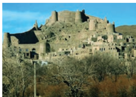
شکل ۱۷-۱۲- قلعه فورگ درمیان