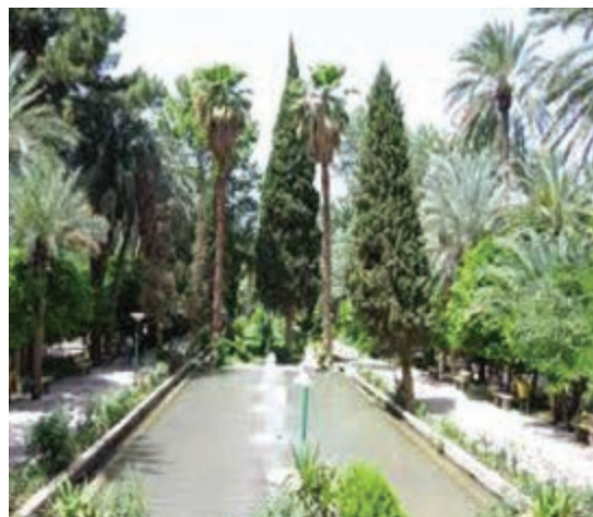
شکل ۲۹-۱۲- باغ گلشن