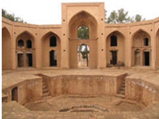
شکل ۳۵-۱۲- مدرسه علیای فردوس