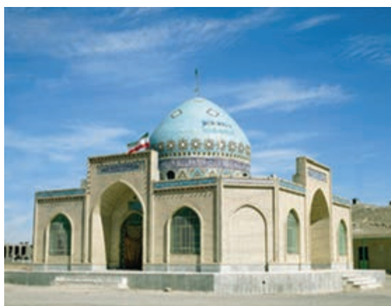
شکل ۴۰-۱۲ مزار آقا سید علی نهبندان