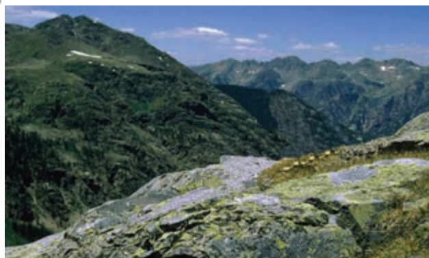
شکل ۱۲-۲۳- قلّه میلاد شاسکوه شهرستان زیرکوه