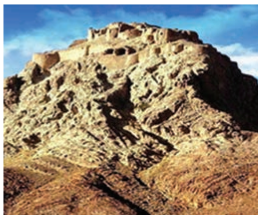
شکل ۵-۱۲- قلعه دختر