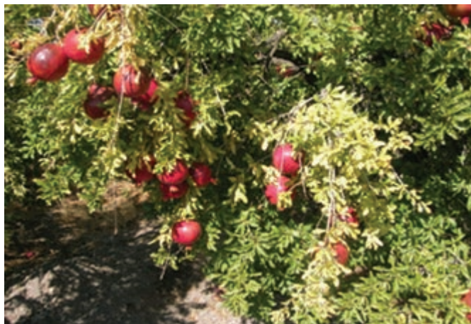
شکل ۳-۱۳- باغات انار در استان خراسان جنوبی

پ) دامپروری : علی رغم شرایط نامناسب اقلیمی، بیش از ۱۵۱۵۳ خانوار عشایری در استان به فعالیت های دامی مشغول اند. علاوه بر آن در بخش دامپروری، پرورش مرغ گوشتی و تخم گذار، گاو شیری و گوشتی، گوسفند، بز و شتر به صورت سنتی و صنعتی انجام می پذیرد.