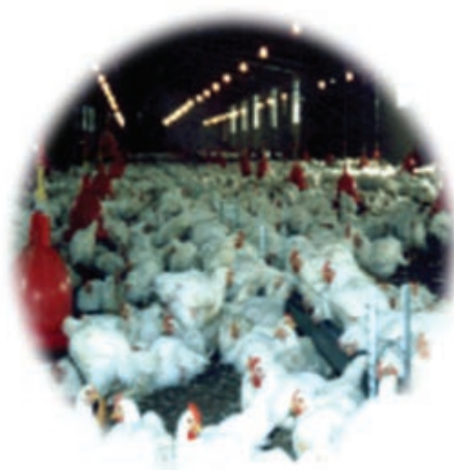
شکل ۴-۱۳- توانمندی های اقتصادی در بخش پرورش دام و طیور