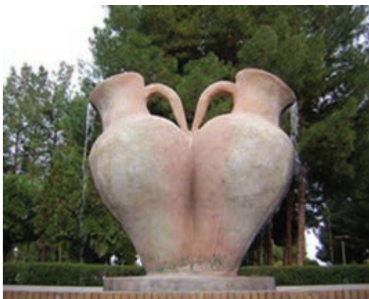
شکل ۴-۱۲- بوستان شهری بشرویه