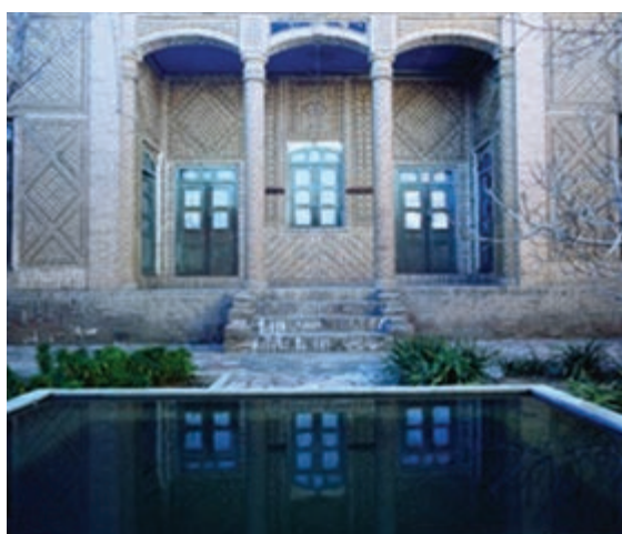
شکل ۱۰-۱۲- خانه فرهنگ بیرجند