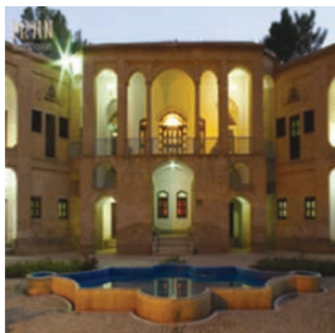
شکل ۱-۱۲- باغ موزه و عمارت اکبریه بیرجند