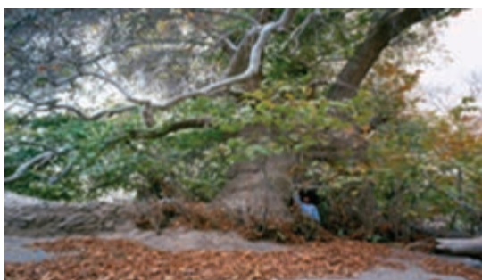
شکل ۱۹-۱۲- درخت هزار ساله دوشنگان