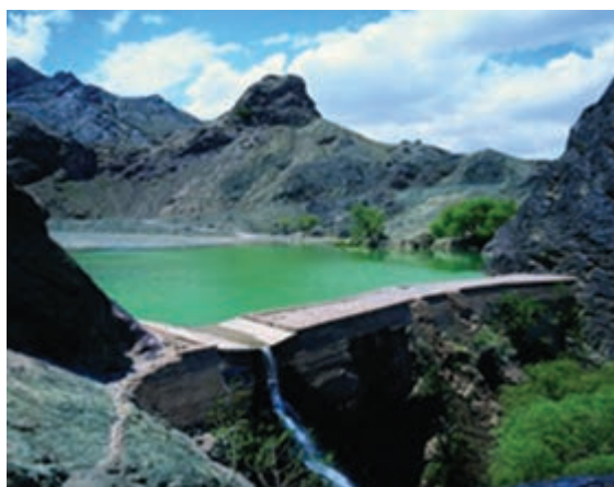
شکل ۸-۱۲- بنددره بیرجند