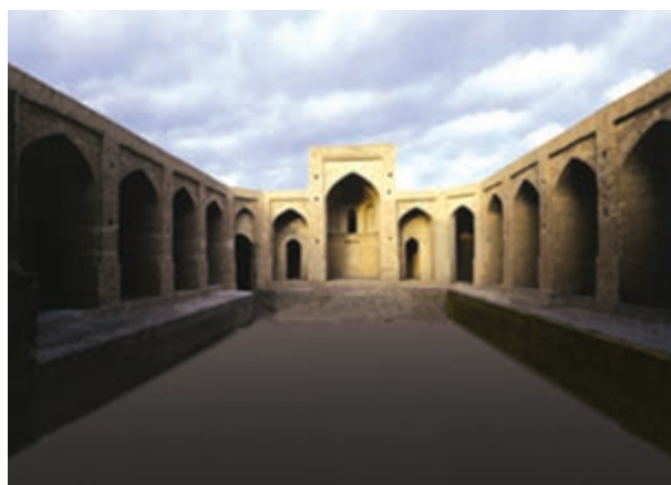
شکل ۲۱-۱۲- کاروانسرای سرایان