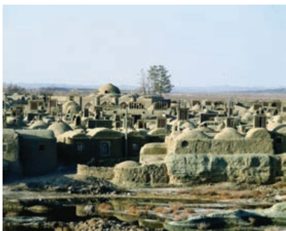
شکل ۱۴-۱۲- بافت تاریخی روستای خور شهر خوسف