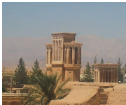
شکل ۳-۱۲- بادگیرهای بشرویه