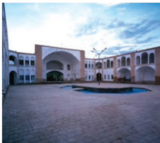
شکل ۹-۱۲- مدرسه شوکتیه بیرجند