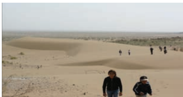
شکل ۱۲-۲۴- کویر همت آباد شهرستان زیرکوه