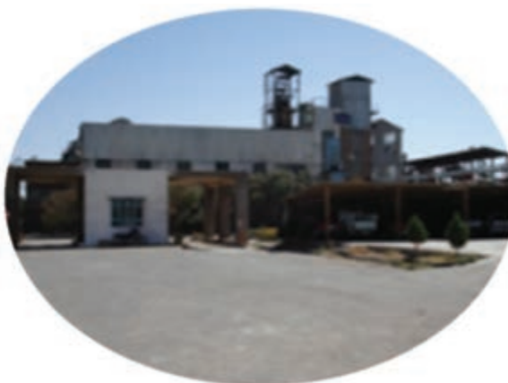
شکل ۵-۱۳- توانمندی‌های اقتصادی در بخش صنعت