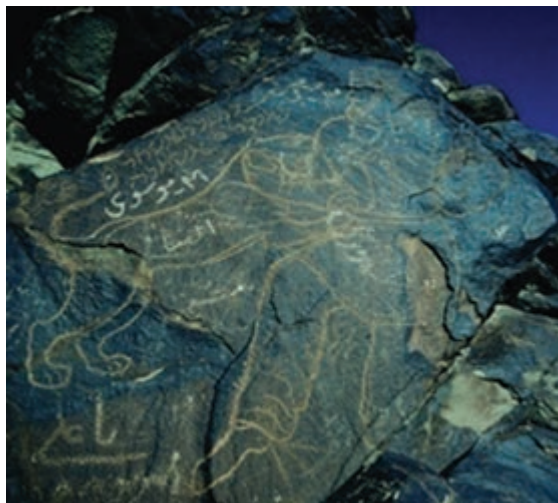
شکل ۱۲-۱۲- سنگ نگاره کال جنگال بیرجند