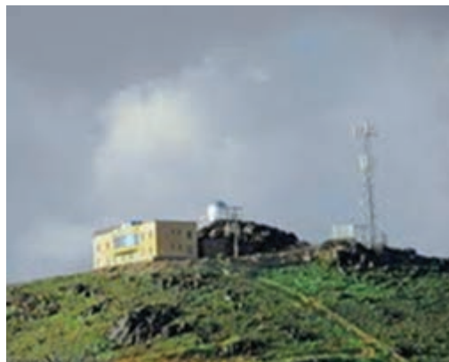
شکل ۲۷-۱۲- رصدخانه دکتر مجتهدی

● مناطق نمونه گردشگری خرو، اصفهک و نای بند طبس : شهرستان زیارتی - سیاحتی طبس با پیشینه تاریخی می تواند به یکی از قطب های گردشگری استان خراسان جنوبی تبدیل شود و باعث شکوفایی اقتصاد منطقه گردد.