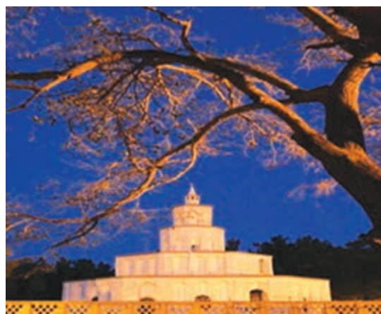
شکل ۷-۱۲- ارگ کلاه فرنگی بیرجند