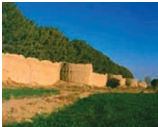
شکل ۲۸-۱۲- قلعه باغ شهر مود