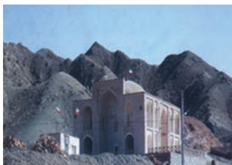
شکل ۱۸-۱۲- امامزاده سلطان ابراهیم رضا