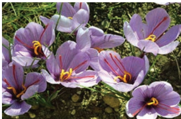
شکل ۳۸-۱۲ مزارع زعفران (طلای سرخ) قاینات

● روستای هدف گردشگری دهسلم در نهبندان: شرایط اقلیمی مناطق کویری از جمله نهبندان باعث شده تا مردم کویرنشین از ابتکار و خلاقیت خود استفاده کنند و با حداکثر بهره‌گیری از عوامل و شرایط طبیعی آن را در اختیار خود درآورند.