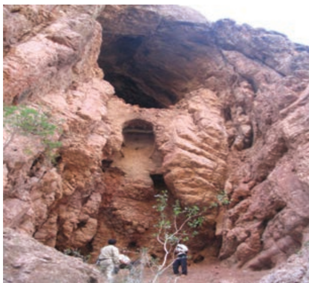
شکل ۱۲-۲۲- غار پهلوان شهرستان زیرکوه