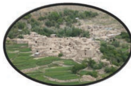
شکل ۱۵-۱۲- روستای آرک شهر خوسف

این منطقه در شهرستان درمیان در ۷۰ کیلومتر محور بیرجند - درمیان - زیرکوه واقع شده است و یکی از قدیمی ترین نقاط استان خراسان جنوبی محسوب می شود. اهمیت آن بیشتر از لحاظ جاذبه های تاریخی و فرهنگی است؛ هرچند دارای مناطق ییلاقی با درختان و باغات سرسبز می باشد و روستاهای هدف گردشگری درمیان و فورگ در مسیر جاده اسدیه به سریشنه و بیرجند واقع شده است.