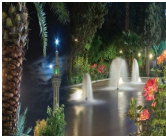
شکل ۳۰-۱۲- بارگاه امامزاده حسین بن موسی الکاظم