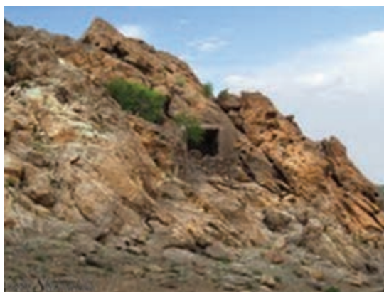
شکل ۲۶-۱۲- غار چنشت