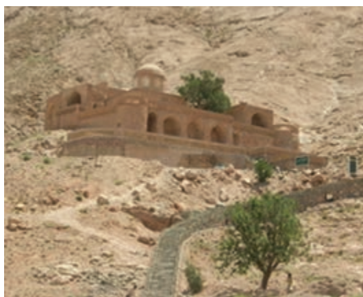
شکل ۳۷-۱۲- بوذرجمهر قاین