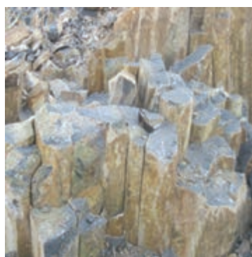
شکل ۷-۱۳- توانمندی های اقتصادی در بخش معدن