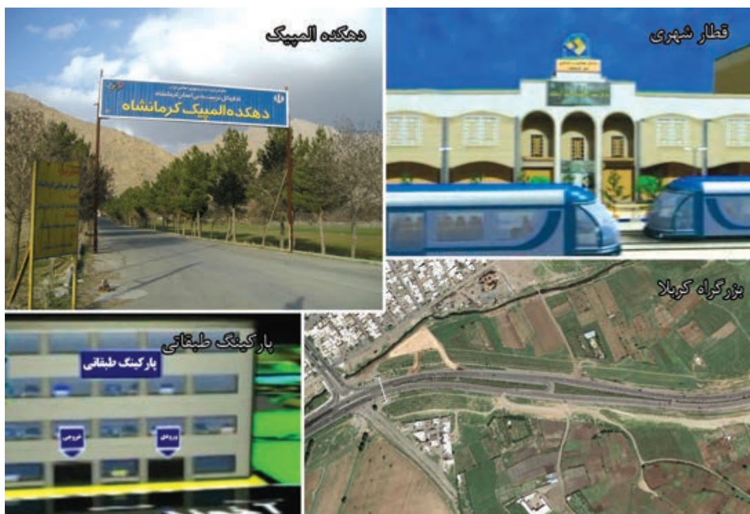
شکل ۸-۶- بخشی از چشم انداز استان کرمانشاه در بخش خدمات