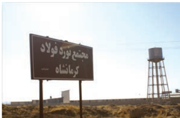
شکل ۷-۶- مجتمع نورد فولاد کرمانشاه