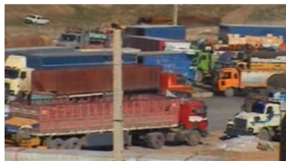
شکل ۱-۶- بازارچه مرزی پرویزخان

در دهه اول پس از انقلاب اسلامی، سرعت توسعه در بخش‌های زیربنایی و عمرانی استان کرمانشاه مانند دیگر استان‌های واقع در غرب کشورمان، به دلیل موقعیت مرزی و تأثیر مستقیم از جنگ تحمیلی، روند کندی داشت. اما در دهه‌های بعدی روند حرکت سرعت بیشتری یافته است. نمود این تحولات در استان را می‌توان در بخش‌های مختلف اقتصادی و زیربنایی مشاهده کرد. در این درس به‌طور گذرا مهم‌ترین این دستاوردها در بخش‌های مختلف بررسی می‌شود: