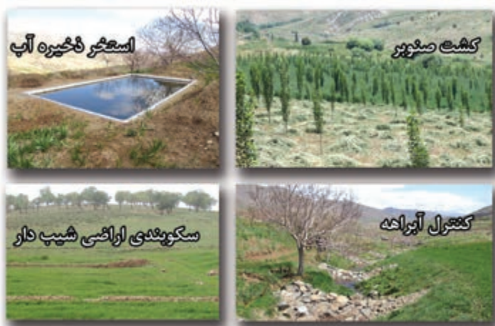
شکل ۵-۶- مهم ترین دستاوردهای بخش منابع طبیعی