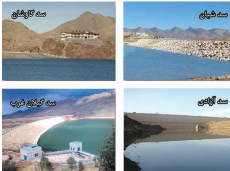
شکل ۳-۶- نمایی از برخی از سدهای استان کرمانشاه