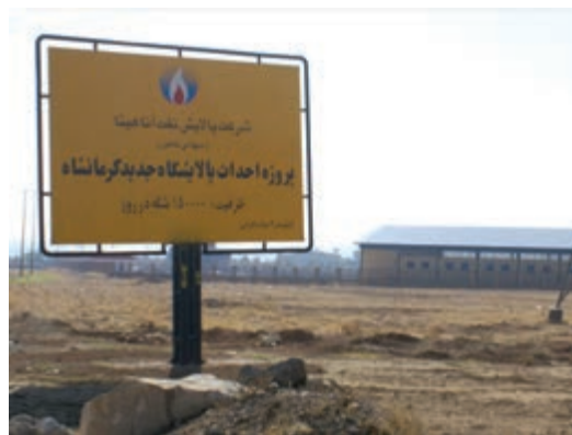
شکل ۶-۶- پالایشگاه نفت آنارک کرمانشاه