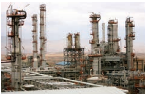
شکل ۲-۶- مجتمع پتروشیمی کرمانشاه