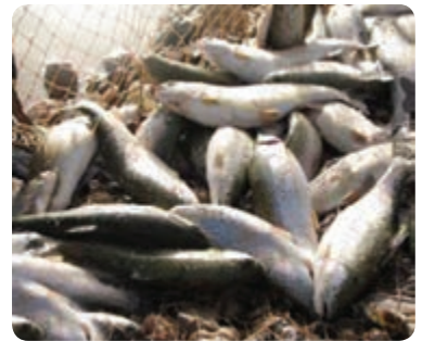
شکل ۱-۶ — نمونه‌ای از تولیدات در زمینه کشاورزی استان یزد