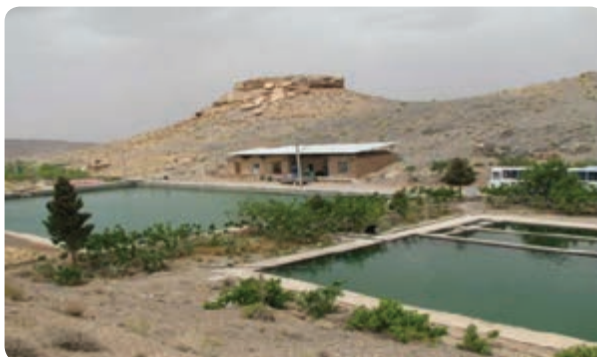
شکل ۳-۶- استخر پرورش ماهی