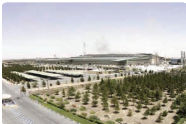
شکل ۹-۶ شرکت فولاد آلیاژی