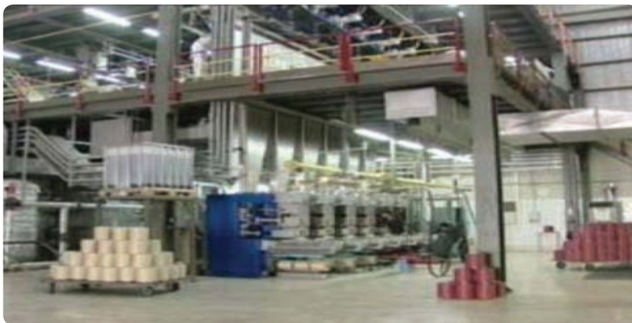
شکل ۱۵-۶ کارخانه کابل نوری یزد