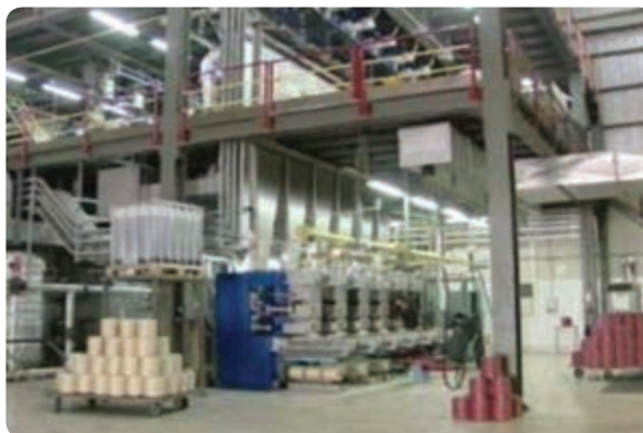
شکل ۸-۶ کابل‌های نوری شهید قندی در یزد