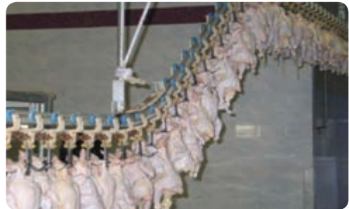
تولید مرغ — میبد