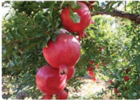
تولید انار — تفت — مهریز