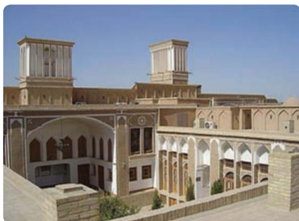
شکل ۱۸-۶- هتل به سبک سنتی در یزد

ایجاد واحدهای اقامتی سنتی و پذیرایی در بافت قدیمی شهرها