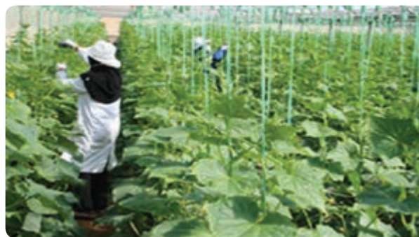
گلخانه تولید خیار