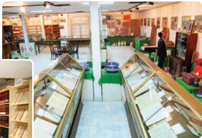
شکل ۱۲-۶- موزه کتابخانه وزیری یزد

فرهنگ و هنر : در سال‌های ۱۳۸۵-۱۳۵۷ تعداد کتابخانه‌های عمومی استان نزدیک به پنج برابر و تعداد کتاب‌های موجود در این کتابخانه بیش از ۹ برابر افزایش داشته است. تعداد سالن‌های سینما از سه سالن به پنج سالن افزایش یافته است. تعداد چاپخانه‌ها نیز چهار برابر و نشریات محلی از سه عنوان به ۶۲ عنوان رسیده است. توسعه و گسترش کانون‌های پرورش فکری کودکان و نوجوانان و کانون‌های فرهنگی و هنری از جمله دیگر فعالیت‌های فرهنگی انجام گرفته بعد از پیروزی انقلاب است. همزمان با گسترش شبکه‌های سراسری صدا و سیما شبکه استانی صدا و سیما نیز افتتاح گردیده است.