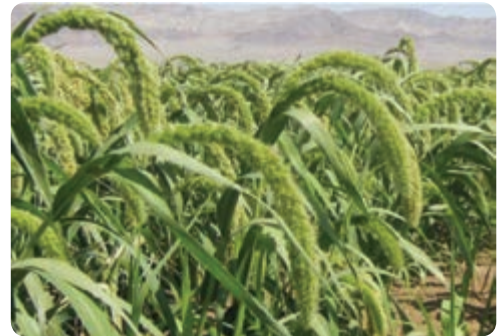
تولید ذرت — خاتم