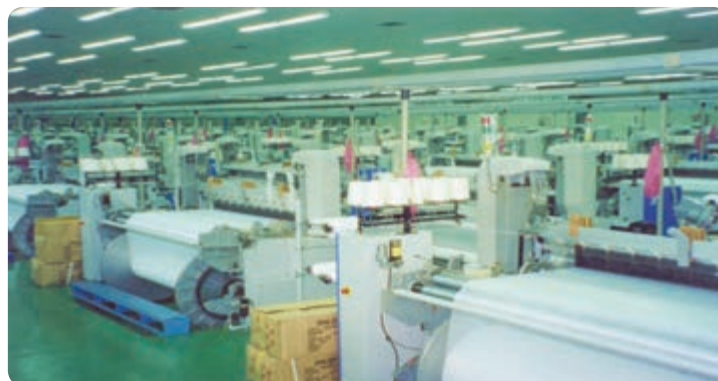
شکل ۶-۷ نمونه ای از صنایع نساجی استان

خوشه صنعتی نساجی استان یزد : از سال ۱۳۸۴ خوشه صنعتی نساجی یزد به عنوان یک خوشه ملی در زمینه نساجی شناسایی و تحت پشتیبانی سازمان توسعه صنعتی ملل متحد قرار گرفته است. تنوع محصولات صنعتی : در حال حاضر یزد متنوع ترین منسوجات را در کل ایران دارد. انواع تولیدات موجود را می توان به شکل زیر دسته بندی کرد : تولید انواع پارچه های مبلی (تولید بیش از ۸۰٪ سهم تولید رو مبلی در ایران) تولید انواع پارچه های پرده ای تولید انواع پارچه های پیراهنی، ملحفه ای، متقال و... محصولات سنتی و بومی (روفرشی، دستمال ابریشمی، چادر شب، انواع شال، روسری، ترمه و...) به موارد فوق می توان محصولات نوین در حال ظهور دارای تکنولوژی بالا با ترکیبات نانو را افزود.