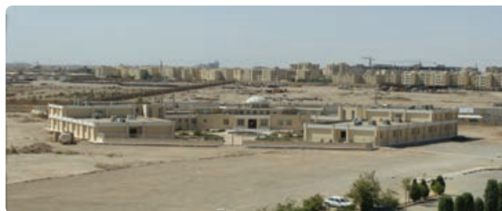
شکل ۲۰-۶- احداث درمانگاه تخصصی و فوق تخصصی بیمارستان شهید صدوقی

ایجاد مراکز مشاوره خدمات پیشگیری آسیب‌های اجتماعی و سلامت