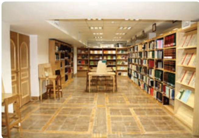
شکل ۱۳-۶- سالن کتابخانه وزیری یزد