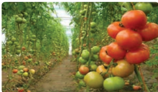
گلخانه تولید گوجه‌فرنگی