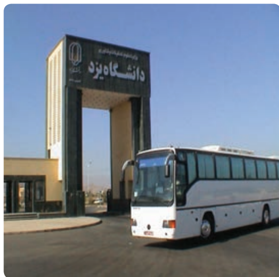
شکل ۱۱-۶- دانشگاه یزد

مراکز دانشگاهی: دانشگاه یزد، دانشگاه علوم پزشکی شهید صدوقی، دانشگاه آزاد اسلامی یزد و میبد و دانشگاه‌های پیام نور تفت،