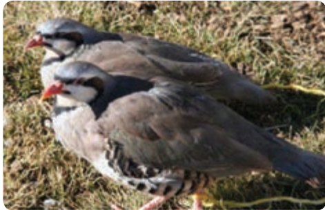
پرورش کبک — میبد