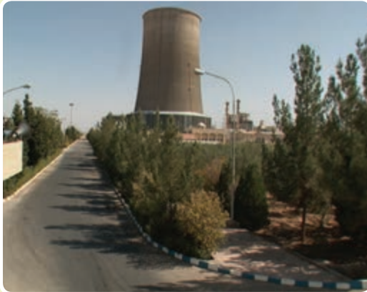
شکل ۱۰-۶- نیروگاه سیکل ترکیبی

۶- ثبت ۳۹ اختراع از سال ۱۳۸۴ تاکنون توسط واحدها و شرکت‌های مستقر در پارک یزد ۷- کسب ۷ مقام کشوری در حوزه رباتیک توسط تیم رباتیک پارک علم و فناوری یزد انرژی: بررسی شاخص‌های صنعت برق نشان می‌دهد، بیشترین سهم مصرف برق استان به ترتیب متعلق به بخش صنعت با ۵۷ درصد و بخش خانگی با ۱۸ درصد است.