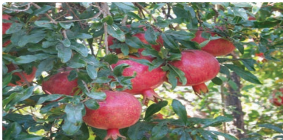
شکل ۱۶-۶ محصول انار

چشم انداز توسعه کشاورزی استان : بخش کشاورزی استان، بخشی توسعه یافته و پایدار، مبتنی بر دانش فنی و تجربه بالای بهره برداران و نیروی انسانی سخت کوش و توانمند است که لازم بوده تا در ارتباط با سایر بخش‌ها و محدودیت‌های موجود در منابع، جایگاه برتر را در تولید و صدور محصولات کشاورزی، تولید بذل اصلاح شده و تولید قلمه و نهال در سطح کشور کسب کند.