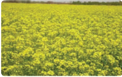
تولید کلزا — ابرکوه