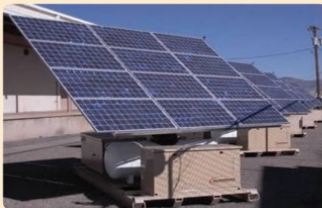
شکل ۱۴-۶- انرژی خورشیدی

در استان یزد به دلیل پتانسیل بالای تابش خورشید، نیروگاه خورشیدی - حرارتی در زمینی به مساحت ۹ کیلومترمربع در ۳۵ کیلومتری شمال غرب شهر یزد در حال احداث است. به منظور ساخت این نیروگاه مشاوران آلمانی و ایرانی (پژوهشگاه وزارت نیرو) ضمن امکان‌سنجی و ارزیابی مناطق مناسب برای نصب نیروگاه، با توجه به مواردی چون: میزان تابش خورشید، تولید، تقاضا و مصرف برق، دسترسی به خطوط انتقال و شبکه دسترسی به سوخت و آب، مسائل زیست محیطی و هزینه زمین مورد استفاده، ناحیه‌ای در شمال غربی استان یزد را به عنوان مناسب‌ترین محل در ایران جهت احداث این نیروگاه انتخاب کرده‌اند.