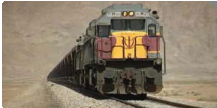
شکل ۱۹-۶- راه آهن استان

با توجه به قرارگیری استان در مرکز کشور و بر سر راه دالان‌های بین‌المللی شمال - جنوب و شرق - غرب و شبکه بزرگراه‌های آسیایی و محل تلاقی مهم‌ترین راه‌های مواصلاتی کشور و همچنین قرارگیری استان در مسیر راه بارهای ترانزیتی از بندرعباس و بندر چابهار و مرزهای شرقی کشور به سمت پایتخت و مناطق شمالی - شمال غرب و غرب کشور، بخش حمل و نقل مورد توجه ویژه‌ای قرار دارد.