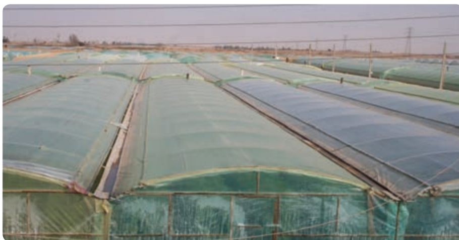
شکل ۱۷-۶- کشت گلخانه‌ای در مهریز