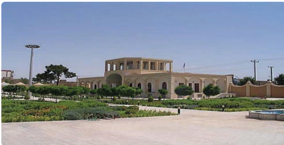
شکل ۲۱-۶- پارک علم و فناوری یزد

محورهای اصلی توسعه بخش زیربنایی، عمران شهری و مسکن اجرای پروژه‌های انتقال آب از خارج حوزه به استان به‌ویژه طرح عظیم خط دوم انتقال آب از سرشاخه‌های کارون بازسازی بافت‌های فرسوده احداث مخازن آب شهری اجرای طرح توسعه دوچرخه‌سواری در شهرها (احیای فرهنگ دوچرخه‌سواری) سرمایه‌گذاری مشترک در جهت احداث پارک‌های عمومی شهری و احداث باغ‌شهرها با اولویت باغ‌شهر یزد تأمین مسکن به‌ویژه برای طبقات محروم و اقشار کم‌درآمد، با استفاده از مصالح و فناوری‌های جدید و روز دنیا رئوس محورهای سند جامع توسعه IT و ICT ایجاد بانک اطلاعات شهری و ارائه خدمات الکترونیک توسط شهرداری‌ها توسعه فروشگاه‌ها و بازارهای اینترنتی توسعه بانکداری الکترونیک توسعه مشاوره و خدمات پزشکی از راه دور توسعه سیستم‌های الکترونیک در سطح مراکز بهداشتی درمانی و دارویی