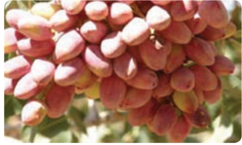
تولید پسته — اردکان