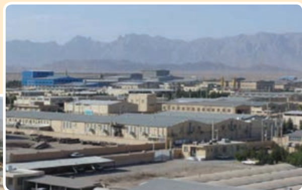
شکل ۴-۶- شهرک صنعتی خضرآباد یزد