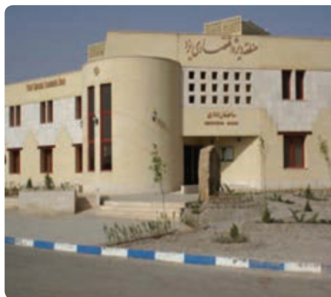
شکل ۵-۶ منطقه ویژه اقتصادی یزد