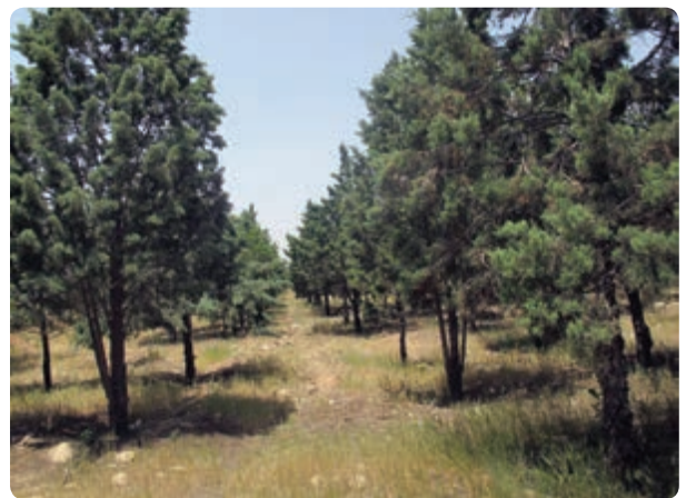
شکل ۱۹-۱۴ مهار آب‌های سطحی و جنگل‌های دست کاشت