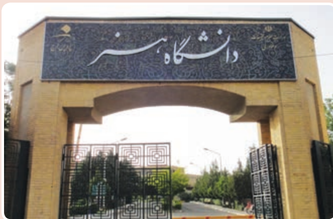
شکل ۱۴-۱۴- دانشگاه هنر - کرج