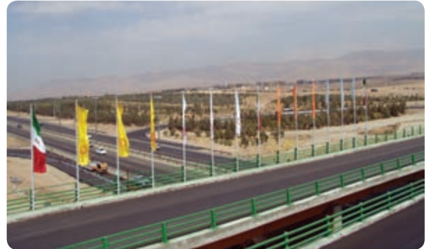
شکل ۷-۱۴- راه‌های استان