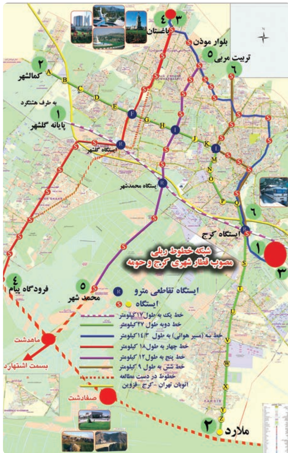
شکل ۹-۱۴ نقشه خطوط مترو کرج و حومه