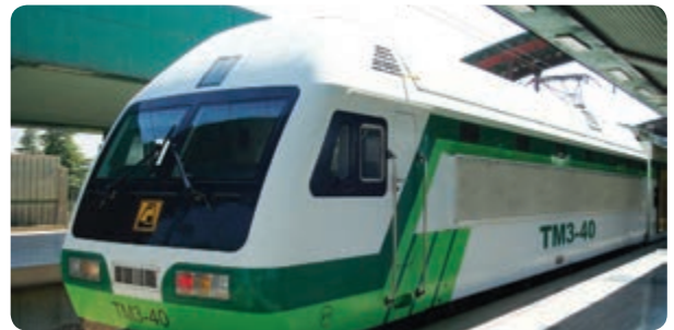
شکل ۸-۱۴- نمونه‌هایی از فعالیت‌های ساخت و ساز در مترو