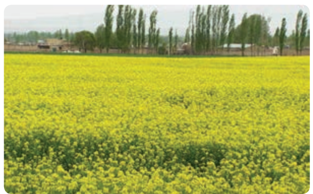
شکل ۱۴-۱- تغییر شیوه‌های سنتی و تبدیل آن به کشت‌های جدید