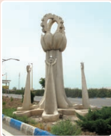
شکل ۳-۱۴- ورودی شهرک صنعتی اشتهارد

شهرک صنعتی اشتهارد: این شهرک به علت دسترسی به راه‌های ارتباطی و زمین‌های بایر و وسیع در مسیر جاده اشتهارد- بومین زهرا مکان‌یابی شد و در حال حاضر با داشتن ۵۲۵ واحد صنعتی فعال (فلزی - غذایی - شیمیایی و...) از اصلی‌ترین مناطق صنعتی کشور محسوب می‌شود.