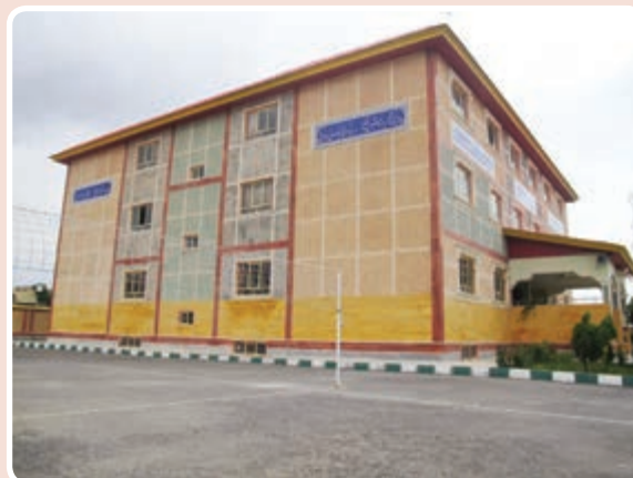
شکل ۱۲-۱۴- مدارس

جدول ۱۳-۱۴- تعداد دانش‌آموزان و کارکنان آموزشی کلیه مقاطع تحصیلی ۹۲-۱۳۹۱