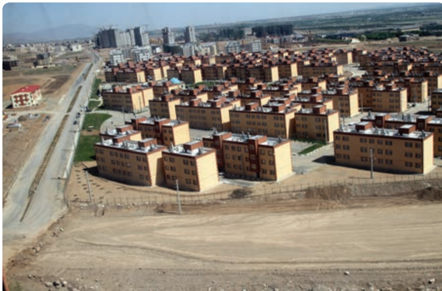
شکل ۱- ۱۵- مسکن مهر