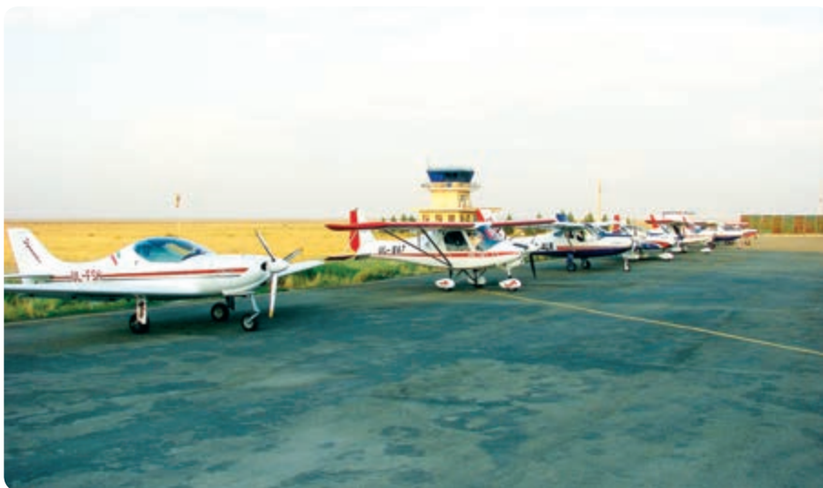
شکل ۱۱-۱۴- فرودگاه آزادی - نظرآباد

✳️ فرودگاه آزادی: این مجتمع فرودگاهی سال ۱۳۷۹ در شرق روستای صالحیه شهرستان نظرآباد افتتاح شد. مهم‌ترین اهداف احداث این فرودگاه تربیت نیروی انسانی در زمینه طراحی و ساخت هواپیماهای کوچک و آموزش هوانوردی است.