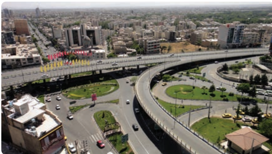
شکل ۴-۱۴- بل‌های روگذر آزادگان نمونه‌ای از فعالیت‌های عمرانی استان

فعالیت‌های عمرانی استان به سه بخش تقسیم می‌شوند: ۱- عمران شهری ۲- عمران روستایی ۳- راه و ترابری و حمل و نقل. ۱- عمران شهری: فعالیت‌ها و دستاوردهای عمرانی بسیاری (در زمینه تهیه طرح‌های تفضیلی و هادی، خدمات شهری، افزایش و اصلاح راه‌های ارتباط درون شهری و سایر تأسیسات زیربنایی) موجب پیشرفت و توسعه شهرهای استان شده است.