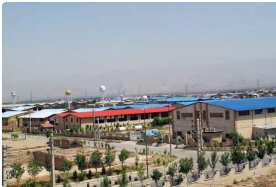
شکل ۲-۱۴- شهر صنعتی نظرآباد

در سال‌های اخیر به دنبال ممنوعیت تأسیس کارگاه‌های صنعتی در تهران، بخش‌هایی از استان برای احداث شهرک‌های صنعتی مورد توجه قرار گرفت که بسیاری از آن‌ها به مرحله بهره‌برداری رسیده است و تعدادی دیگر در حال تکمیل است. اشتغال‌زایی و افزایش تولیدات داخلی از نتایج ایجاد این شهرک‌های صنعتی می‌باشد.