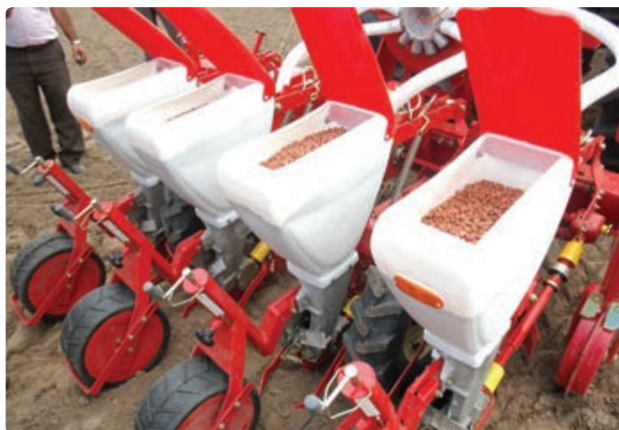
شکل ۹-۶ کاشت مکانیزه بادام زمینی (آستانه اشرفیه)