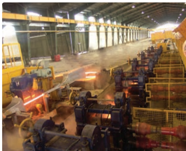
شکل ۱۴-۶ نمونه‌ای از صنایع استان