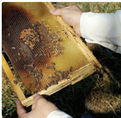
شکل ۱۰-۶ پرورش زنبور عسل

— یکپارچه‌سازی اراضی و مکانیزه کردن کشاورزی: سرانه زمین کشاورزی گیلان 1/13 هکتار است. وسعت کم زمین‌های کشاورزی و کوچک کردن هریک از قطعه‌ها باعث می‌شود تا سرمایه‌گذاری‌ها و مکانیزه کردن کشاورزی مقرون به صرفه نباشد و بازدهی تولید پایین بیاید.