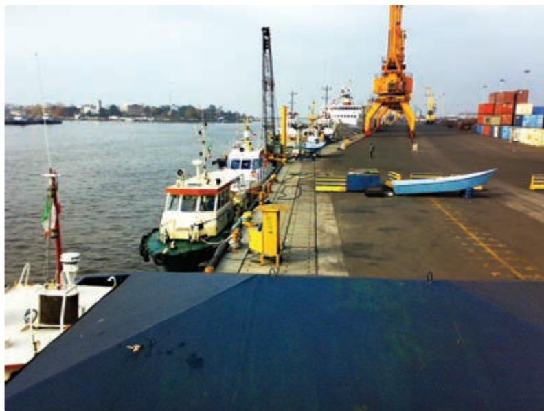
شکل ۶-۷- حمل و نقل دریایی

بعد از سال ۱۳۵۷، ظرفیت بارگیری و تخلیه بار بندر انزلی افزایش یافت و چهار پست اسکله و دو باب انبار سرپوشیده به این تأسیسات اضافه شد. طول موج شکن غربی افزایش یافت و بخشی از کانال به منظور دسترسی به محوطه مورد نیاز احیا شد.