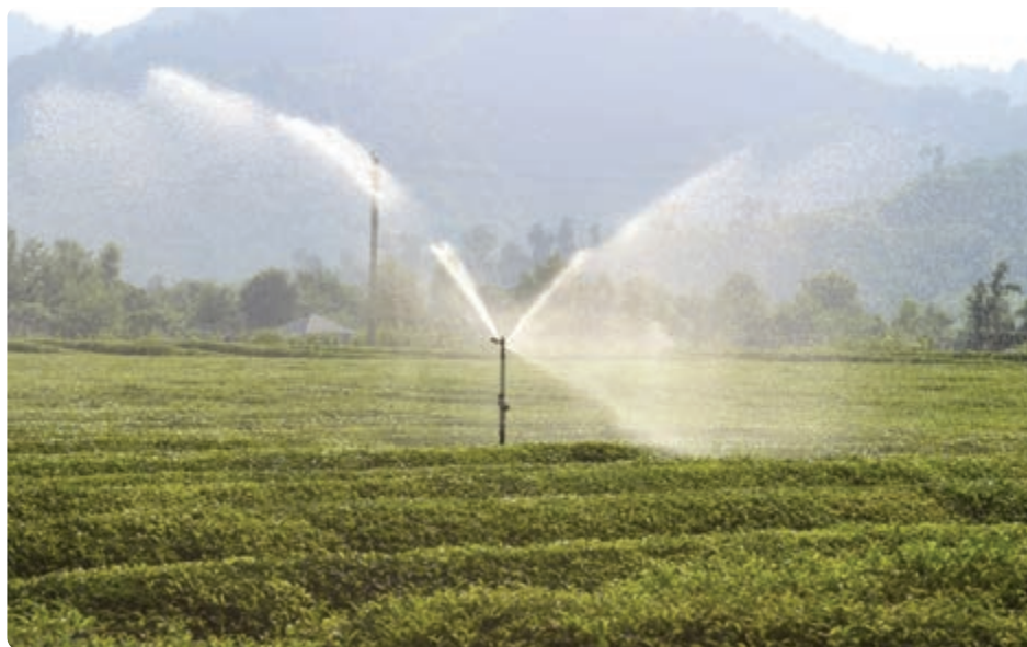
شکل ۱-۶- آبیاری مکانیزه

۱- وضعیت کشاورزی: استان گیلان به دلیل مجاورت با دریای خزر، بهره‌گیری از باران فراوان، رطوبت کافی، رودخانه‌های فراوان و خاک‌های آبرفتی از قطب‌های کشاورزی و حاصل خیز کشور است و در تولید محصولات کشاورزی و تأمین نیازهای غذایی راهبردی کشور نقش اساسی دارد. این استان در حال حاضر، درصد کمی از محصولات کشاورزی کشور را تولید می‌کند اما می‌توان با برنامه‌ریزی اصولی توان تولیدی این سرزمین را بالا برد. به دلیل رشد جمعیت و افزایش مصرف مواد غذایی ناشی از آن طی چند دهه گذشته، لازم است جهت افزایش محصولات کشاورزی مخصوصاً در استان‌هایی مانند گیلان برنامه‌ریزی‌هایی انجام شود.