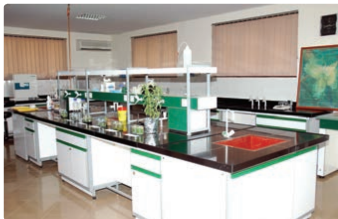
شکل ۱۲-۶- روش‌های جدید بیوتکنولوژی

افزایش بازدهی آبیاری و ازدیاد نرخ بهره‌وری از منابع آب : با استفاده بهینه از منابع آب و با بالابردن بازدهی آبیاری می‌توان کشاورزی استان را توسعه داد. در این زمینه، لازم است بین ارگان‌های مختلف برای استفاده صحیح و معقول از آب هماهنگی‌هایی صورت گیرد. ایجاد تأسیسات کوچک مهار آب‌های سطحی و بهره‌برداری بیشتر از آب‌های زیرزمینی به همراه استفاده از روش‌های جدید آبیاری، می‌تواند در افزایش تولید باغ‌های چای، زیتون، توت و کشتزارهای برنج مؤثر باشد.