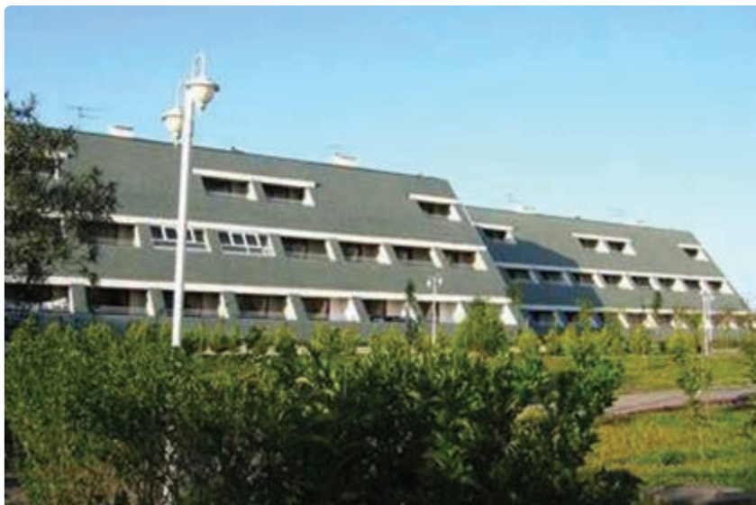
شکل ۶-۶- هتل سفید کنار

۳- وضعیت خدمات و بازرگانی: در طی سه دهه اخیر در استان، بخش خدمات بسیار پیشرفت کرده است. در تمامی سال‌های مورد بررسی، شمار شاغلان آن به طور مطلق و نسبی افزایش یافته است. آهنگ افزایش در سال‌های ۸۵-۱۳۷۵ به شدت رشد داشته و سهم شاغلان این بخش از ۳۹/۱ درصد به ۵۰/۱ درصد افزایش یافته است. در این دوره به طور متوسط، سالانه ۱۳۳۴ شغل در این بخش ایجاد شده است.