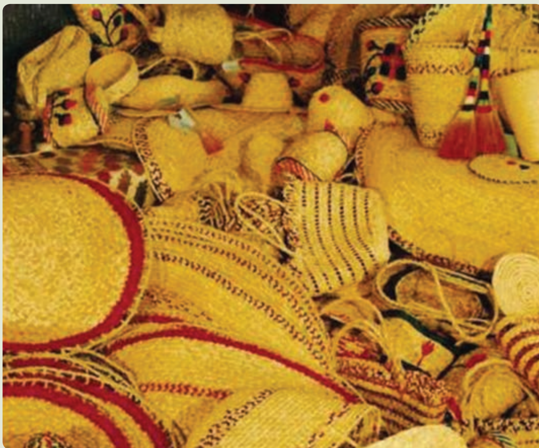
شکل ۵-۶- صنایع دستی