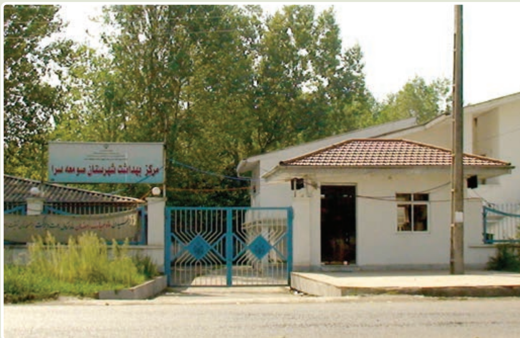
شکل ۸-۶- مرکز بهداشت

۴- حمایت از هویت و فرهنگ اسلامی : تعداد کتابخانه‌های عمومی قبل از انقلاب در استان ۲۵ باب بود که در سال ۱۳۸۶ به ۵۹ باب رسیده است. در این مدت، تعداد اعضا و مراجعان به کتابخانه نیز افزایش محسوسی داشته است. تعداد کل موزه‌های تحت نظارت اداره فرهنگ و هنر قبل و بعد از انقلاب یک باب است. همچنین، در دوران انقلاب اسلامی یک موزه در بندر انزلی و تحت نظارت نیروی دریایی ایجاد شده است. گردشگران خارجی استفاده‌کننده از هتل‌های استان به ۸۰۸۴ نفر در سال ۱۳۸۵ رسیده و در سال‌های اخیر، از نظر تأسیسات گردشگری نیز رشد قابل توجهی صورت گرفته است؛ به گونه‌ای که تعداد اتاق‌های تأسیسات اقامتی از ۱۱۱۳ اتاق در سال ۸۰ به ۱۷۰۳ اتاق در سال ۸۵ رسیده است. قبل از انقلاب اسلامی، تعداد نشریات محلی اعم از هفته‌نامه، ماه‌نامه، فصل‌نامه و سالنامه تنها ۵ عنوان بود که در سال ۱۳۷۳ به ۱۵ عنوان و در سال ۱۳۸۶ به ۸۷ عنوان رسیده و تعداد تأسیسات و مکان‌های ورزشی نیز از ۲۳ مکان در سال ۱۳۵۷ به ۱۷۴ مکان در سال ۱۳۸۶ رسیده است.