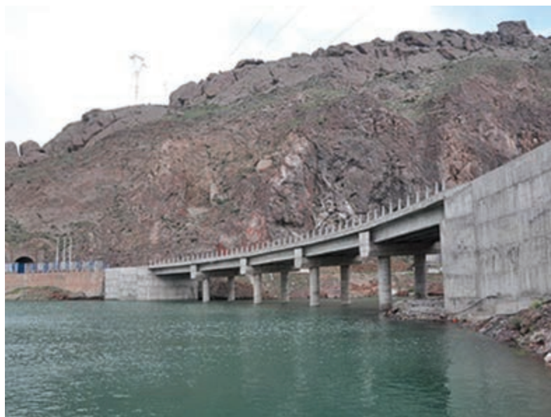
شکل ۱۶-۶- راه آهن قزوین - رشت - آستارا در حال احداث