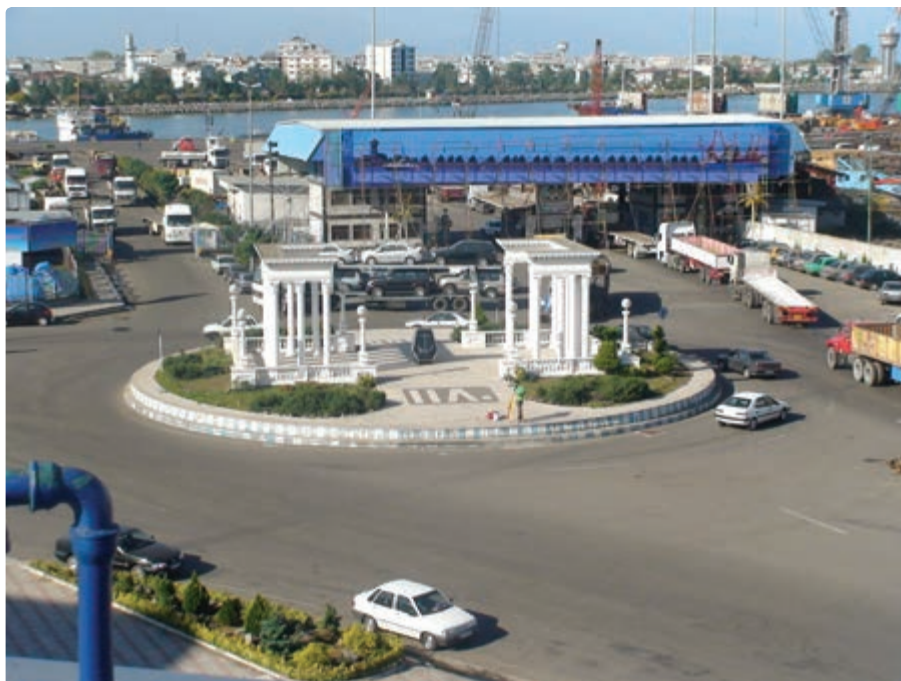
شکل ۴-۶- بندر انزلی- میدان توحید