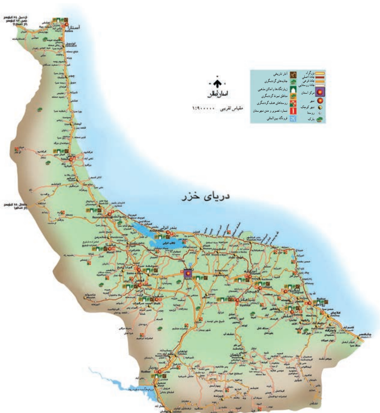
شکل ۱۸-۶ نقشه گردشگری استان