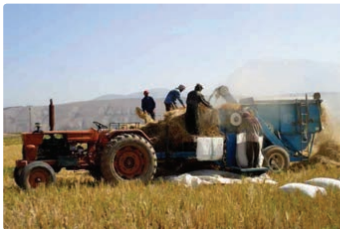
شکل ۱۱-۶- کشاورزی مکانیزه

— افزایش تولیدات گلخانه‌ای : کشت گلخانه‌ای در استان، زمینه را برای تولید بیش‌تر انواع مختلف محصولات کشاورزی فراهم می‌سازد و علاوه بر سوددهی بالا موجب می‌شود تا از این تولیدات در همه فصول سال استفاده کنیم.