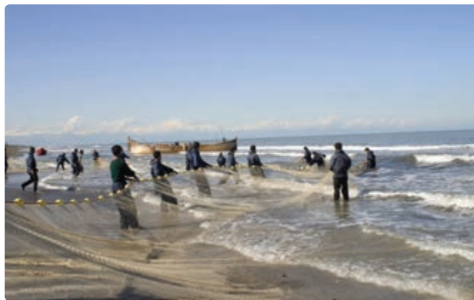
شکل ۳-۶- صید ماهی در دریای خزر