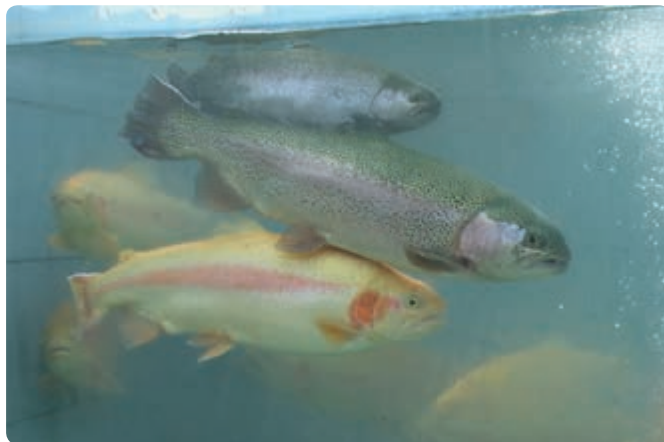
شکل ۲-۶- پرورش ماهی قزل‌آلا

تأمین می‌کند. این استان در بخش مربوط به فعالیت‌های صیادی و آبریز پروری موقعیت منحصر به فردی دارد که با وجود رودها و آبگیرهای داخلی و دریا، مقدار تولید قابل افزایش است.