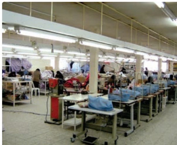
شکل ۱۳-۶ نمونه‌ای از صنایع استان

برای توسعه بازرگانی، رشد صنایع کارخانه‌ای، گردشگری و ... توسعه جاده تهران - قزوین - رشت به آستارا ضروری است. این محور ارتباطی در جابه‌جایی بار و مسافر و ارتباط با کشورهای خارجی و استان اردبیل نقش عمده‌ای دارد.