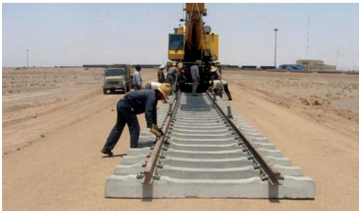
شکل ۱۵-۶- مراحل ساخت راه آهن قزوین - رشت - آستارا