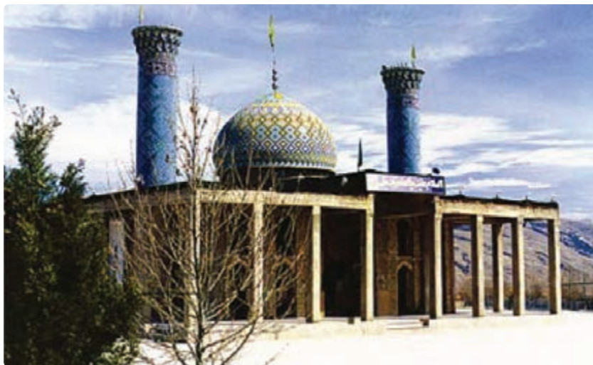
شکل ۱۴-۵- امامزاده شهید — فراشبند

— جاذبه‌های فرهنگی: سعدیه — حافظیه — سیبویه در شیراز و مقبره شیخ بیضاوی در سروستان.