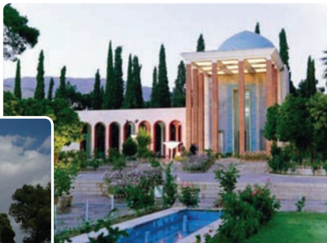
شکل ۱۵-۵- سعدیه - شیراز