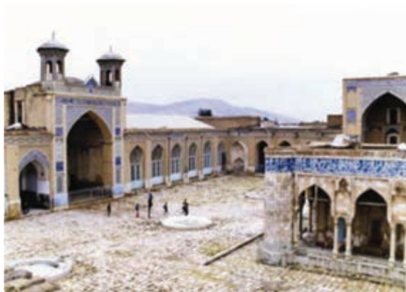
شکل ۲۰-۵- مسجد جامع عتیق - شیراز