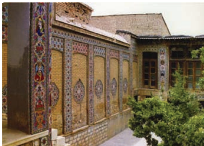
شکل ۱۳-۵- خانه ضیائیان شیراز

— جاذبه‌های تاریخی: همچون مجموعه‌های زندیه، مشیر و قوام در شیراز و فسا و داراب و خانه‌های قدیمی که به‌طور عمده از زمان قاجاریه در این استان به جای مانده‌اند و توسط سازمان میراث فرهنگی به ثبت رسیده‌اند و یا به موزه تبدیل شده‌اند؛ به عنوان نمونه، از خانه ضیائیان در محله سنگ سیاه و در مجاورت آرامگاه سیبویه می‌توان نام برد که مجموعه‌ای زیبا شامل پنجاه تصویر از بزرگان دینی و اجتماعی بر دیوارهای این خانه و بر روی کاشی‌های رنگی منقوش شده است.