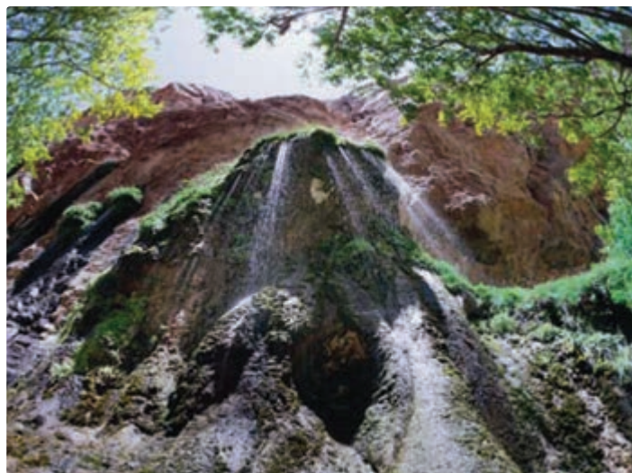
شکل ۱۱-۵- تنگ براق اقلید