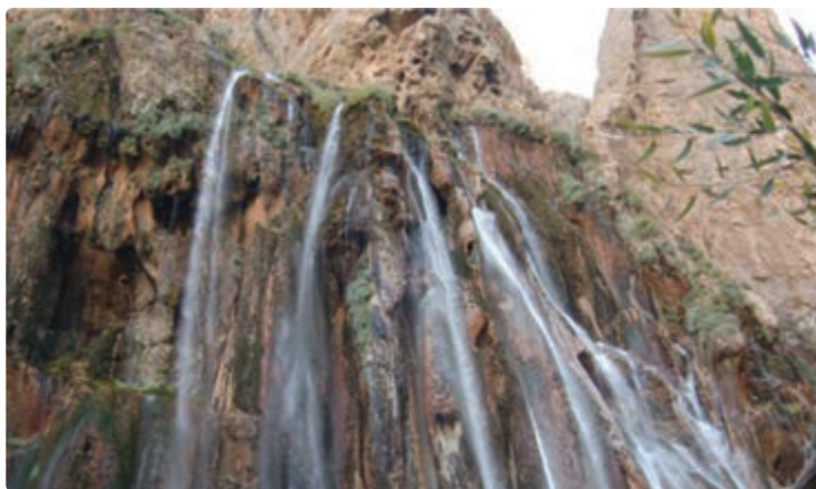
شکل ۱۰-۵- آبشار مارگون- سپیدان

توان‌ها و جاذبه‌های گردشگری در این استان را می‌توان به دو دسته کلی تقسیم کرد :