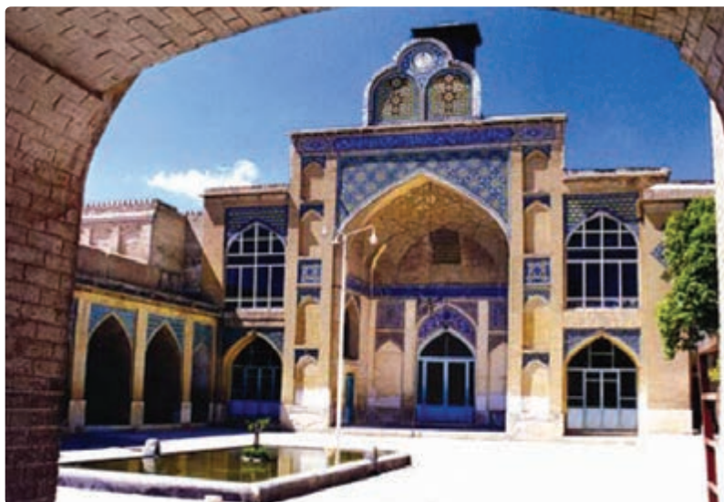
شکل ۸-۵- مسجد مشیر شیراز