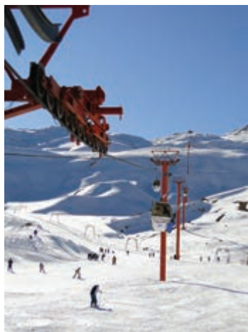
شکل ۱۸-۵- مجتمع پولاد کف