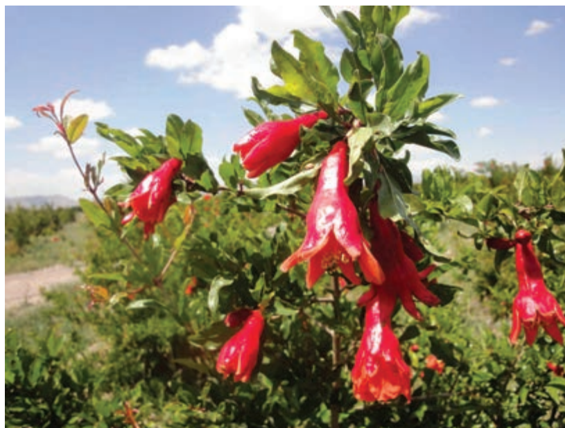
شکل ۲۴-۵- محصول انار در نیریز

بخش کشاورزی در این استان به‌گونه‌ای است که بعضی از فراورده‌ها جنبه صادراتی و ارزآوری به خود گرفته‌اند؛ همچون گندم و انار و مرکبات. تعدادی از محصولات کشاورزی استان در کشور، رتبه‌های اول تا سوم را به خود اختصاص داده‌اند، حتی تولید و صادرات انجیر فارس در جهان رتبه اول را به خود اختصاص داده است.