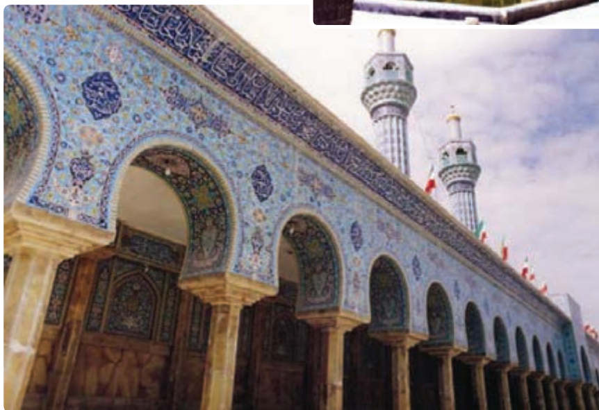
شکل ۹-۵- مسجد اعظم گراش