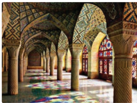
شکل ۲۱-۵- مسجد نصیرالملک - شیراز