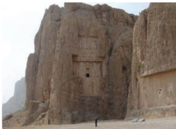
شکل ۲-۵- نقش رستم - مرو دشت

در اهمیت پارسیان و تمدنی که بر جای گذاشته‌اند، می‌توان گفت اولین حکومت مقتدر و امپراطوری ایرانی را در این مرز و بوم بر جای گذاشتند که آوازه آن در فرهنگ جهانی خودنمایی می‌کند. این استان پیشینه‌ای هم‌پایه تاریخ ایران دارد و همواره یکی از مراکز شکل‌گیری و شکوفایی تمدن‌های کهن ایران زمین به‌شمار می‌رود.