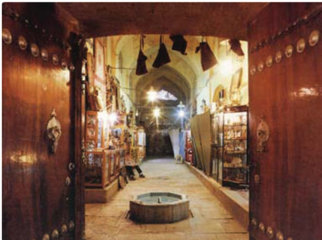
شکل ۱۲-۵- بازار مشیر - شیراز