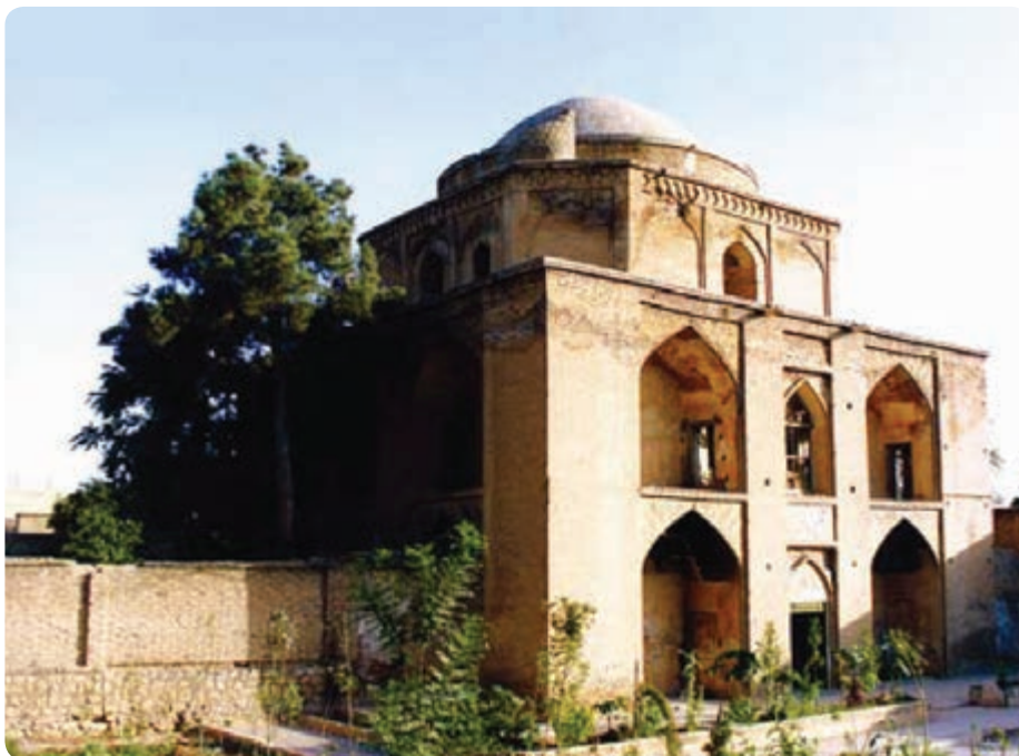
شکل ۵-۵- بی بی دختران شیراز

در کشور ما گام‌های نخست در توسعه این بخش برداشته شده است، به گونه‌ای که اکنون بیش از ۵۰ هزار نفر به‌طور مستقیم در زمینه گردشگری مشغول به کارند. از این تعداد در استان فارس در حال حاضر ۴۵۰۰ نفر در این صنعت شاغل‌اند. گردشگری و خودباوری: نهرو، نخست‌وزیر هند در کتاب نگاهی به تاریخ جهان می‌نویسد: من هرگاه در برابر ایران و تمدن ایران قرار می‌گیرم، ناخودآگاه سر تعظیم فرود می‌آورم.