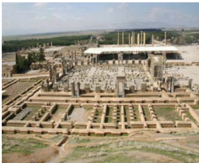
شکل ۵-۶- تخت جمشید مرودشت