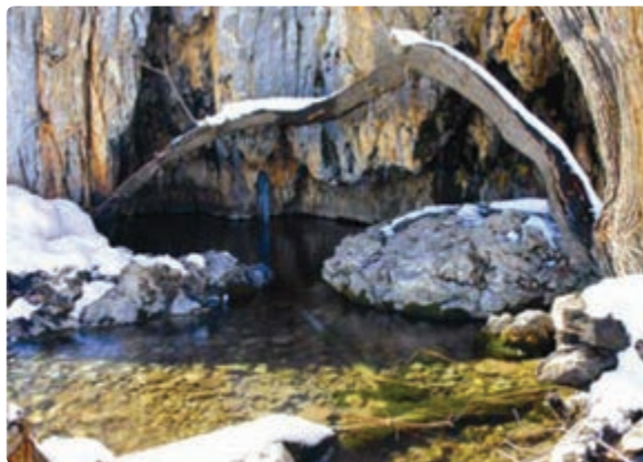
شکل ۱۹-۵- سرچشمه رودخانه شش‌پیر - سپیدان