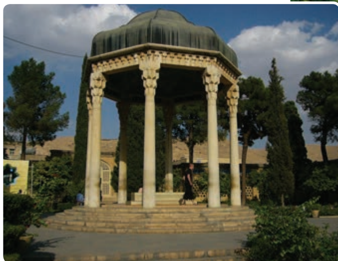
شکل ۱۶-۵- حافظیه - شیراز