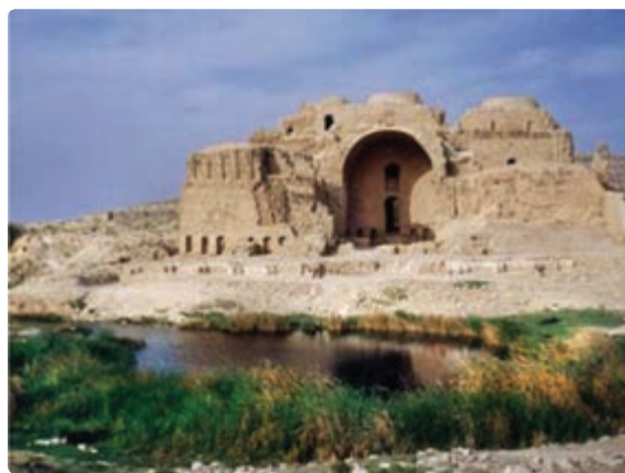
شکل ۲۲-۵- کاخ اردشیر - فیروزآباد