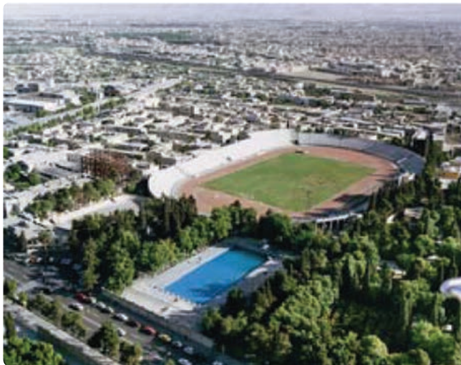
شکل ۲۳-۵- نمایی از استادیوم حافظیه - شیراز

تاکنون فعالیت‌های زیادی برای جذب گردشگر انجام گرفته است، اما برخی راهکارهای دیگر می‌تواند به رونق و توسعه این صنعت در استان بینجامد که عبارت‌اند از: