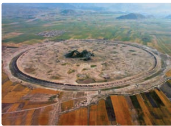
شکل ۱-۵- شهر دارابگرد - داراب

اگر قرار باشد که آثار تمدنی کشورها در یک مسابقه مشارکت داده شوند ارائه تخت جمشید از ایران کافی است که ما را در ردیف پنج کشور اول جهان قرار دهد. همچنین گسترش فرهنگ اسلامی در میان مردم فارس موجب خلق آثار تحسین‌برانگیزی از سوی مسلمانان ایرانی شد و همین آثار به سرزمین فارس اهمیت خاصی بخشیده است.