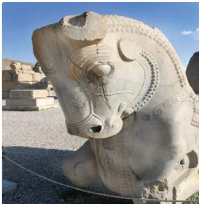
شکل ۵-۷- تخت جمشید

قدمت سکونت آریایی‌ها در این استان، حکومت‌های هخامنشیان و ساسانیان و بعد از آن حکومت‌های اسلامی، همگی آثار و بناهایی را از خود بر جای گذاشته‌اند که بازدید از آنها هدف بسیاری از گردشگران داخلی و خارجی است.