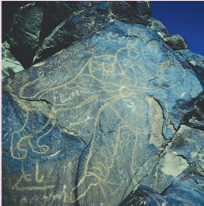
شکل ۲-۱۰- سنگ نگاره کال جنگال در جنوب غرب بیرجند

●/ استان ما در دوره ساسانی: استان ما یکی از ایالت‌های آباد و با اهمیت امپراطوری قدرتمند ایران در دوره ساسانی به حساب می‌آمد که از ۲۲۶ میلادی آغاز شده بود. در دوره ساسانی این ایالت از حیث نیروی انسانی اهمیت خاصی داشته؛ زیرا از مردمانی سلحشور، رزمجو و با استعداد برخوردار بوده است؛ به طوری که شاهان ساسانی به نیروی بازو و شهامت و همکاری آنها با دولت اطمینان خاطر داشتند.