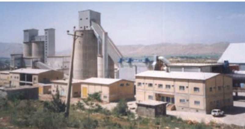
شکل ۲۲- ۵