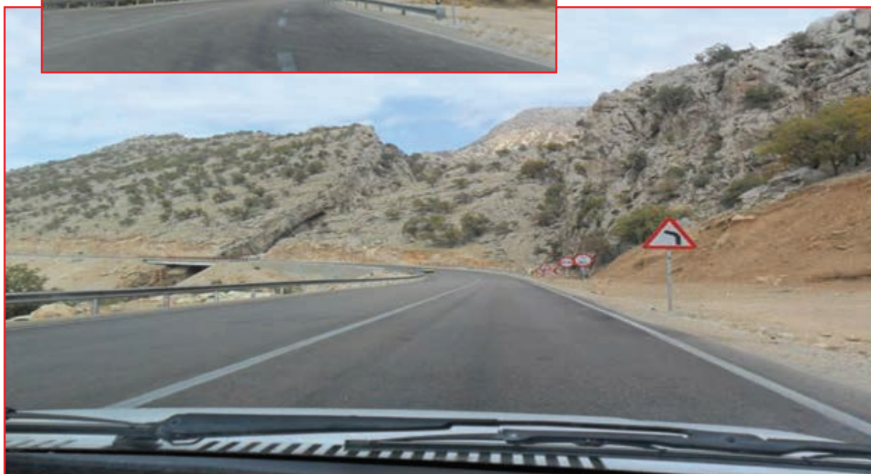
شکل ۲۰-۵- راه‌های ارتباطی استان