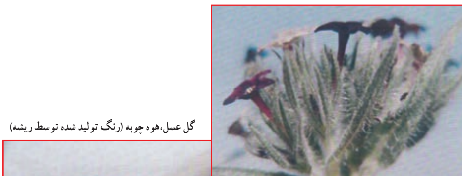
گل عسل، هوه چوبه (رنگ تولید شده توسط ریشه)