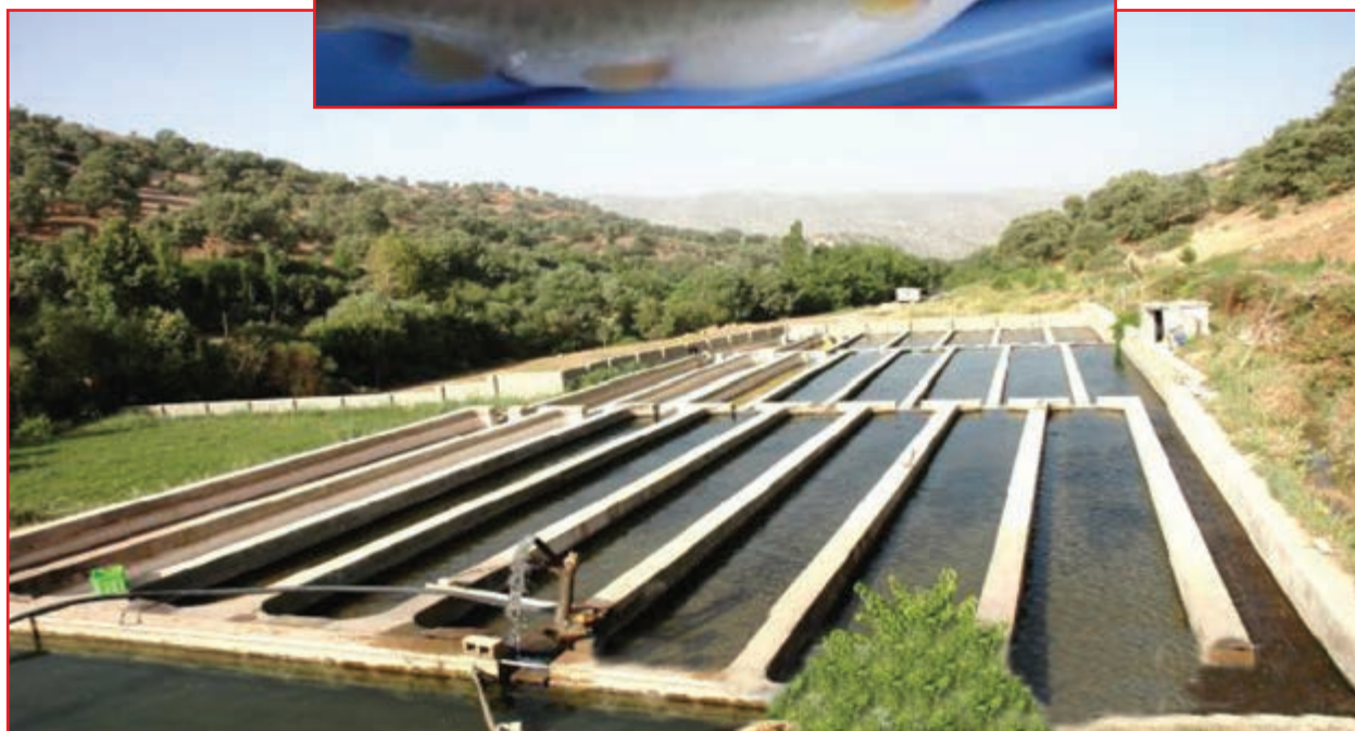
شکل ۱۹-۵- مزرعه پرورش ماهی قزل آلا