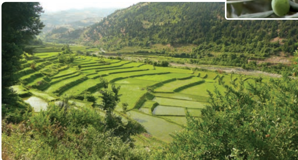
شکل ۲۰-۵ ب - تراس بندی زمین برای کشت برنج در نواحی کوهپایه ای