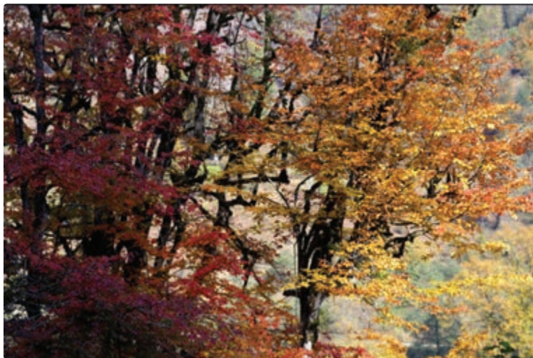
شکل ۵-۶- پاییز جنگل‌های ماسال

از جاذبه‌های طبیعی شهرستان محل زندگی خود گزارشی تهیه و در کلاس ارائه دهید.