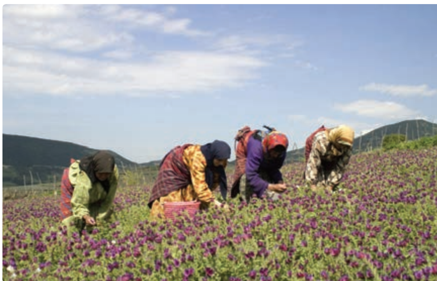
شکل ۲۲-۵. برداشت گل گاوزبان

زمین‌های کوهستانی هم عمدتاً محل کشت غلات (گندم و جو)، گیاهان علوفه‌ای و برخی گیاهان دارویی است.