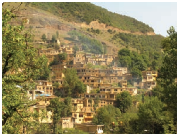
شکل ۹-۵- شهر تاریخی ماسوله