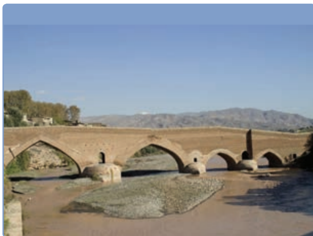
شکل ۱۲-۵- پل تاریخی لوشان (تنها پل ارتباطی به قسمت‌های داخلی کشور)