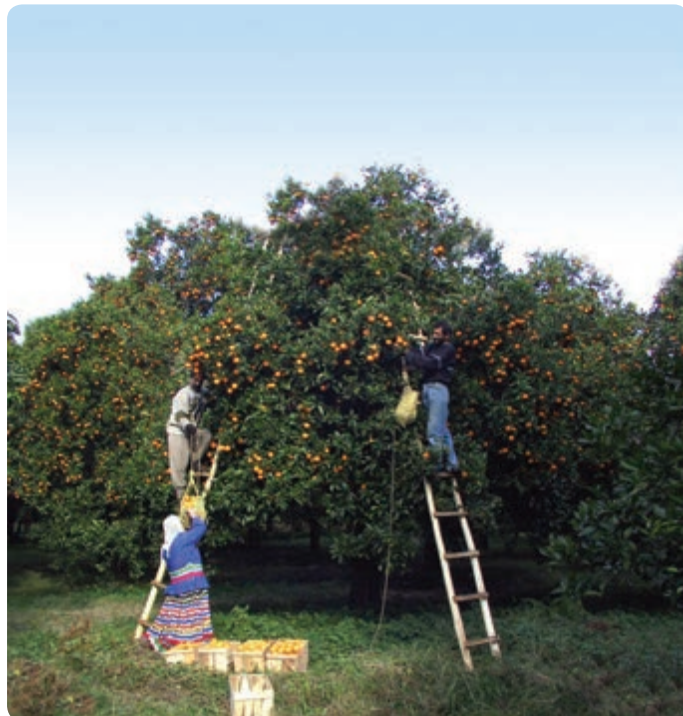
شکل ۲۳-۵- برداشت مرکبات

استان گیلان با برخورداری از امکانات و استعدادهای متنوع آبرزی پروری به جهت دارا بودن مزارع پرورش ماهیان گرم آبی، سردآبی و ماهیان خاویاری، آب بندان‌ها، چاه‌های آب و مزارع شالیزاری، یکی از قطب‌های مهم پرورش آبزیان کشور است که در صورت فراهم شدن بستر مناسب‌تر، این فعالیت می‌تواند نقش به‌سزایی در توسعه پایدار و همه‌جانبه استان ایفا کند. گفتنی است گیلان اولین استان در کشور است که در زمینه پرورش ماهیان خاویاری شروع به کار کرد و گونه منحصر به فرد فیل ماهی را پرورش داد و سبب شد ایران دومین کشور در زمینه تکثیر این ماهی در جهان باشد.