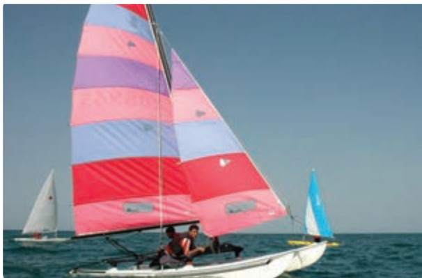
شکل ۱-۵- ب - قایقرانی

الف) سواحل: ماسه‌ای بودن بخش عمده‌ای از سواحل و نزدیکی به جنگل از ویژگی‌های سواحل گیلان است. در نواحی تالش، جنگل با فاصله اندکی از ساحل قرار دارد و این زیبایی طبیعی جنگل را دوچندان می‌کند.