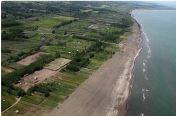
شکل ۱-۵- الف - سواحل زیبای گیلان

استان گیلان یکی از مراکز مهم گردشگری در ایران است. این استان دارای امتیازهای قابل توجهی برای جذب گردشگر است که به چند مورد آن اشاره می‌شود. از جمله: آب و هوای مناسب، تنوع ناهمواری و پوشش گیاهی، تنوع چشم‌اندازهای انسانی و موقعیت نسبی مناسب برای جذب گردشگران داخلی و خارجی.