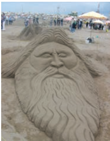
شکل ۱-۵- ج - جشنواره مجسمه‌های شنی در سواحل گیلان

علاوه بر تالاب انزلی، تعداد زیادی از تالاب‌های طبیعی و دریاچه‌های مصنوعی دیگر هم در استان گیلان وجود دارد که تالاب استیل آستارا و دریاچه سد سفیدرود از جمله آن‌هاست.