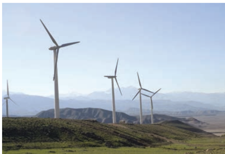
شکل ۵-۲۷- نیروگاه برق بادی منجیل