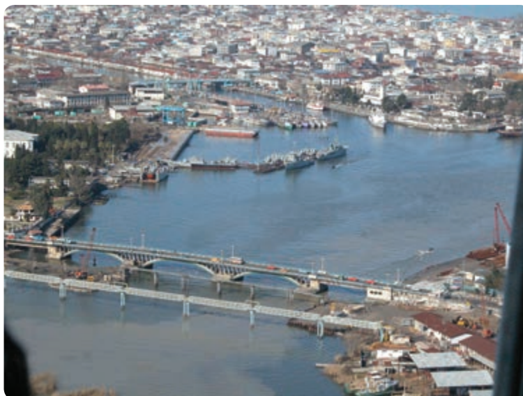
شکل ۲۸-۵- شهر گردشگری بندر انزلی

مواهب طبیعی و موقعیت ممتاز جغرافیایی باعث شده است تا گردشگران زیادی از نواحی مختلف کشور به استان گیلان سفر کنند. همچنین، استان ما از طریق آستارا با کشور جمهوری آذربایجان مرز خشکی دارد و به علت فعال بودن این گمرک، شمار گردشگران خارجی در این شهر زیاد است. در صورت توسعه گمرک آستارا و بندر انزلی، علاوه بر حمل کالا به کشورهای حوزه دریای خزر، زمینه مساعدی هم برای جذب بیشتر گردشگران خارجی فراهم خواهد شد که در ایجاد اشتغال در بخش خدمات تأثیر دارد. در بخش بازرگانی وجود دریای خزر، بندر انزلی و آستارا موجب می‌شود تا مبادلات بازرگانی با آسیای میانه و حتی اروپای شرقی گسترش یابد. وجود سوابق طولانی تجارت و مبادلات بازرگانی میان استان گیلان و جمهوری‌های تازه استقلال یافته از طریق بندر انزلی و آستارا، و نزدیکی استان با تهران، علاوه بر بالا بردن توانمندی بازرگانی استان، در افزایش ارتباطات فرهنگی بین کشورهای منطقه نیز مؤثر است.