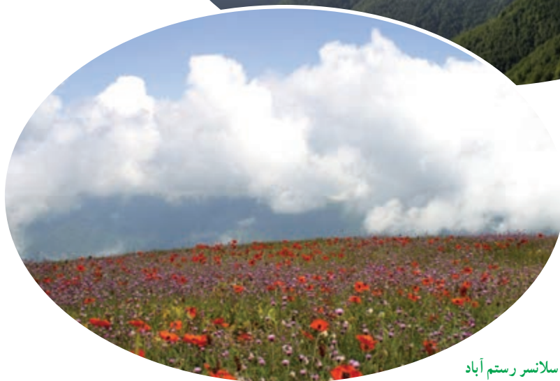
شکل ۴-۵- سلاسر رستم آباد