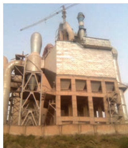
شکل ۵-۲۶- کارخانه سیمان لوشان

در توسعه بخش صنعت استان، اصلی ترین قابلیت های توسعه عبارت اند از : - بالا بودن سطح سواد، آگاهی و فرهنگ عمومی، و وجود نیروهای تحصیل کرده و دارای تخصص بالا - وجود مواد معدنی و مواد اولیه مورد نیاز برخی از صنایع در محل - برخورداری از امکانات متنوع تولید و توانایی به کارگیری انرژی های نوین تجدیدپذیر برای تأمین برق.