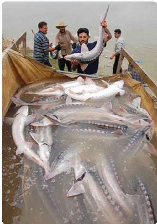
شکل ۲۴-۵- رهاسازی ماهیان خاویاری