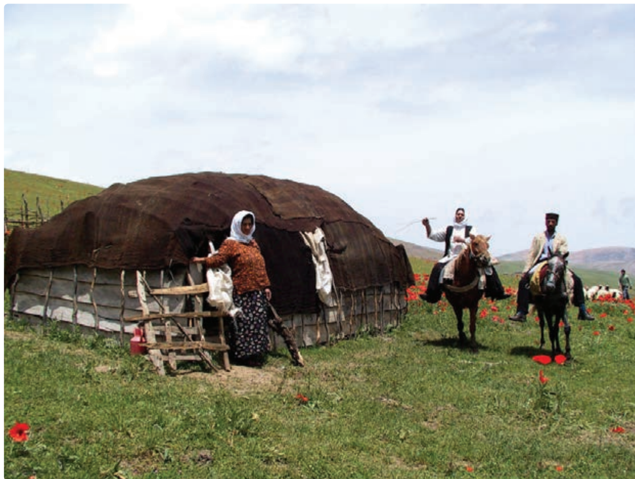
شکل ۱۷-۵- دامداران گیلانی در شکردهشت