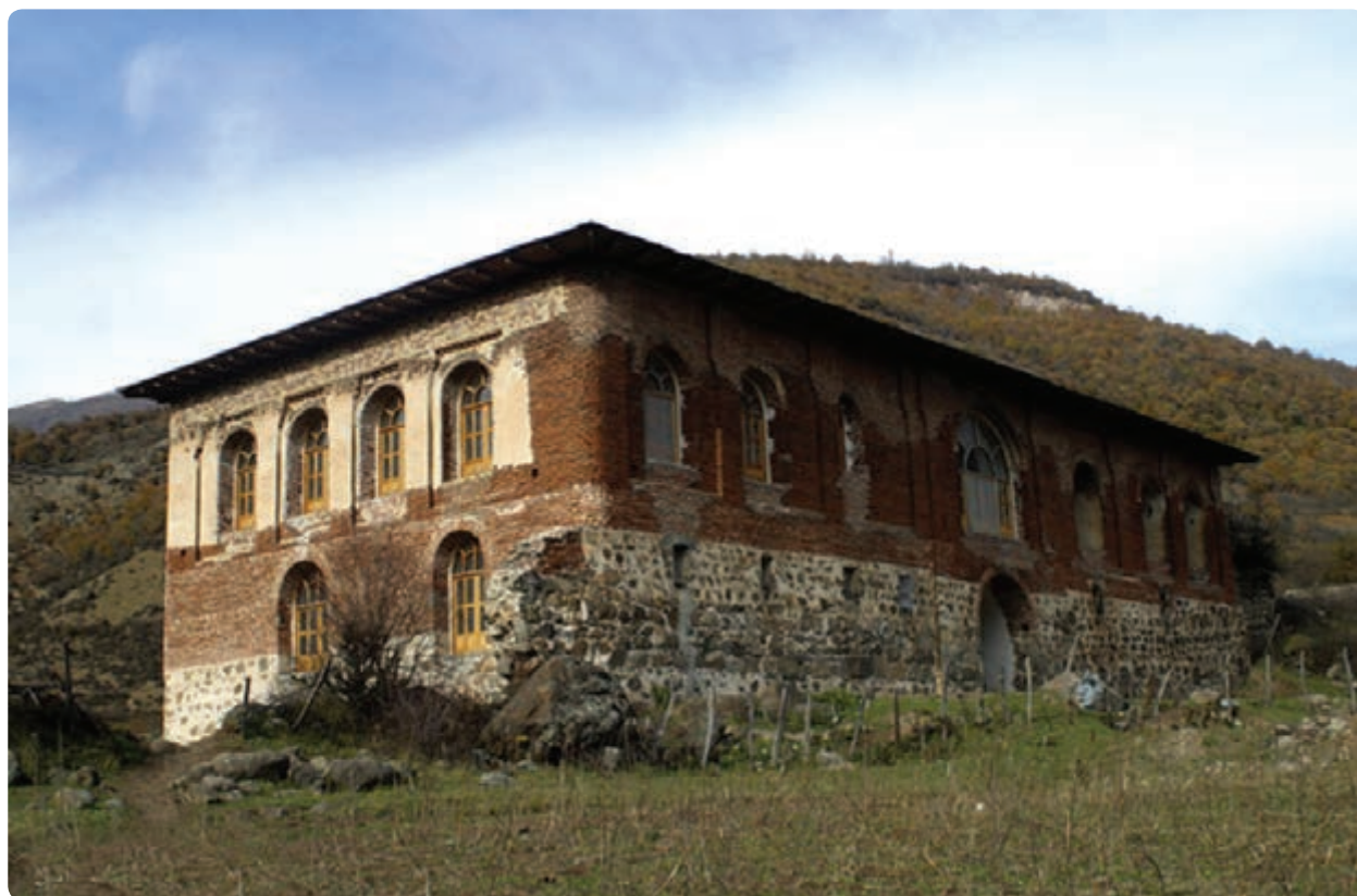
شکل ۸-۵- کاخ آق اولر تالش (یکی از قصرهای سردار اُمجد در تالش)