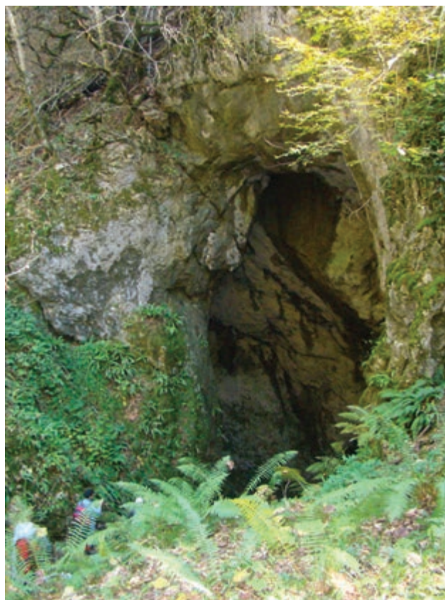
شکل ۷-۵- غار آویشو - شاندرمن

۲- جاذبه‌های تاریخی و یادمانی: قدیمی‌ترین بناهای تاریخی و یادمانی گیلان در کوهپایه‌ها و مناطق کوهستانی است و آثار مربوط به پیش از ورود آریایی‌ها مثل تپه‌های مارلیک در حوالی روستای نصفی رحمت آباد رودبار و مساکن ماقبل تاریخ مریان در روستای مریان کرگانرود تالش از نظر تاریخی اهمیت ویژه‌ای دارند.