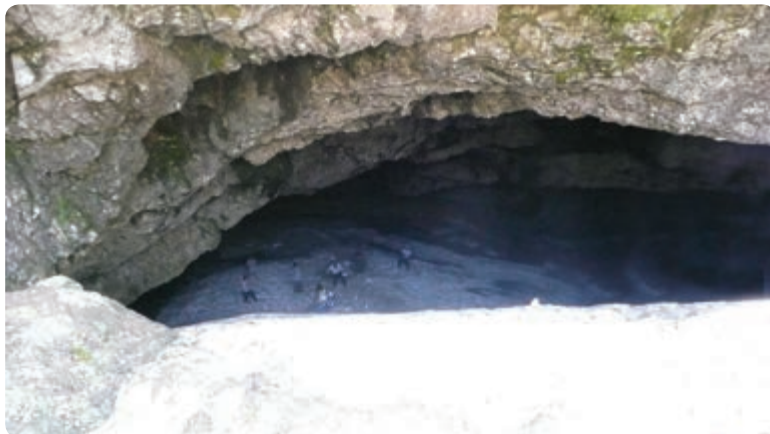
شکل ۵-۵- برفچال در کوه دلفک

ب) رودها: بستر رودهای گیلان عموماً در مسیر دره‌های کوهستانی که از جنگل‌های سرسبز و انبوه پوشیده شده‌اند، قرار دارد. این رودها از نظر ماهیگیری و صید قزل‌آلا اهمیت داشته، به دلیل جریان تند خود برای قایقرانی قابلیت دارند.