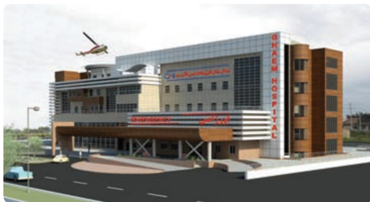
شکل ۱۹-۵. بیمارستان فوق تخصصی بین‌المللی قائم

در قدم اول، تبدیل جاده‌های معمولی به آزادراه یا اتوبان، نقش به‌سزایی در افزایش حجم آمد و شد عبوری، بالا رفتن امنیت مسافران، تقلیل زمان و کاهش تصادفات جاده‌ای دارد و در صورت تحقق اتصال استان به خط راه آهن سراسری، گردشگران زیادی به این استان مسافرت خواهند کرد.