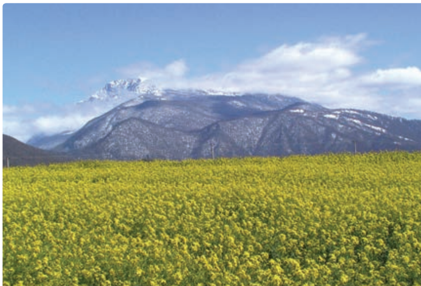
شکل ۲۱-۵. کشت دانه‌های کلزا - تهیه روغن نباتی

زمین‌های کوهستانی هم عمدتاً محل کشت غلات (گندم و جو)، گیاهان علوفه‌ای و برخی گیاهان دارویی است.