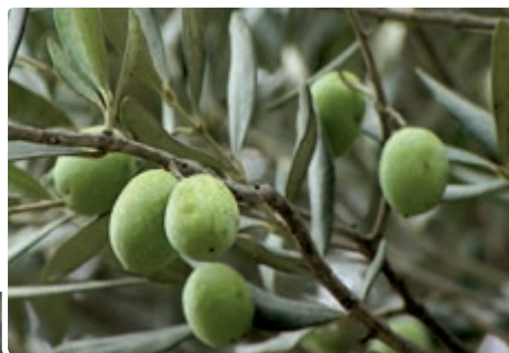
شکل ۲۰-۵ الف - محصول زیتون

مهم ترین کانون فعالیت های کشاورزی استان، مناطق پست جلگه ای است. زمین های کوهپایه ای به پوشش جنگلی و در برخی مناطق محصولات باغی اختصاص دارد کشت برخی از محصولات خاص زمین های جلگه ای مانند برنج در امتداد درّه ها بر روی تراس های رودخانه ای تا جایی که وسعت زمین و شرایط رویش اجازه دهد، در نواحی کوهپایه ای نیز معمول است. درّه سفیدرود از رستم آباد تا حوالی منجیل و لویشان به کشت زیتون اختصاص دارد.