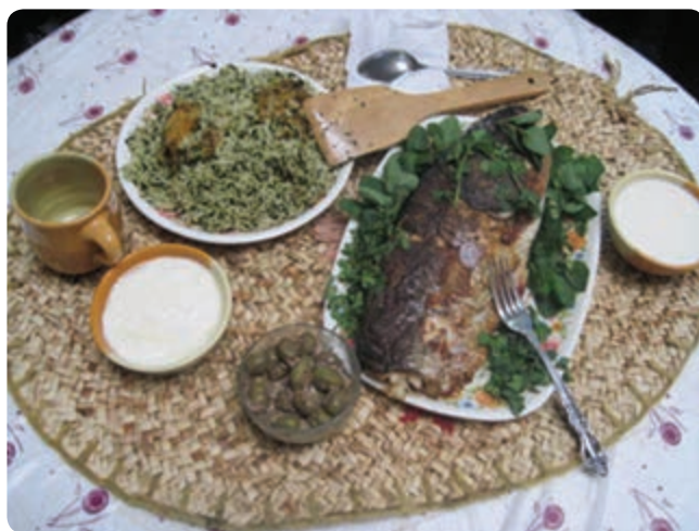
شکل ۱۶-۵- سفره سنتی گیلان