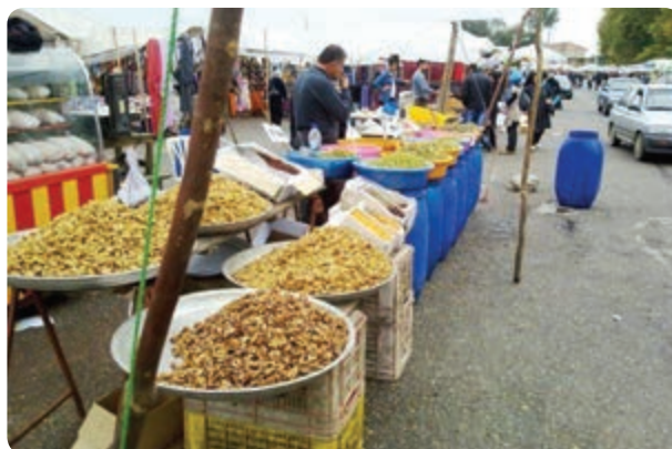
ج- نمایی از بازار هفتگی