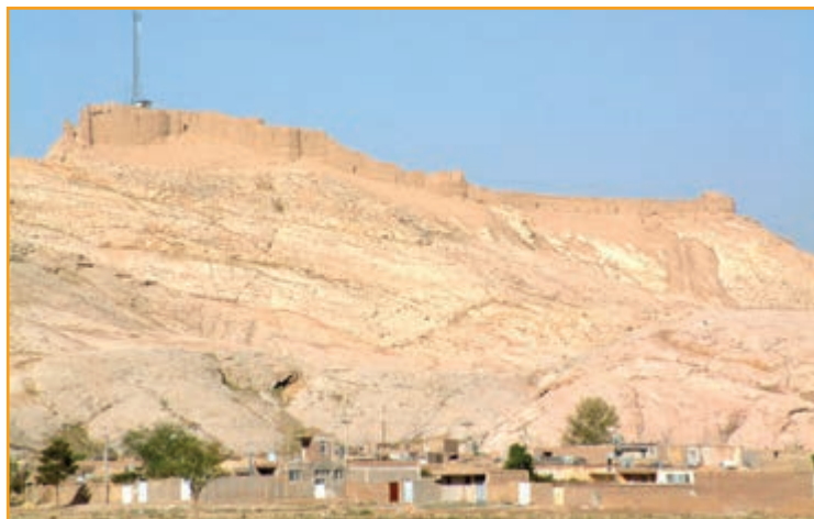
شکل ۱-۴- قلعه دختر کرمان

تولد و نشو و نمای او شهر بابک کرمان بود، در آبادانی این مملکت سعی فراوان داشت از جمله اینکه در شهر کرمان در جوار قلعه دختر قلعه اردشیر را بنا نهاد و آن را گواشیر نامید، و هنوز آثار خرابه های قلعه دختر و قلعه اردشیر بر فراز تپه ای در شرق کرمان پابرجاست.