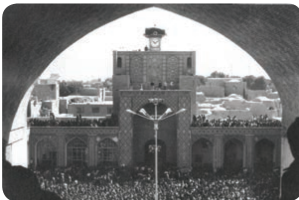
شکل ۷-۴- تجمع مردم در آستانه پیروزی انقلاب در مسجد جامع کرمان