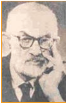
شکل ۴-۱۹- دکتر سعید نفیسی