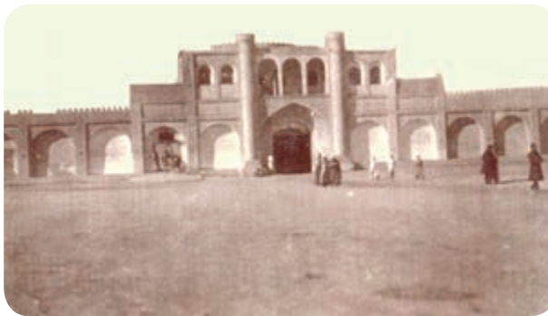
شکل ۴-۴- دروازه ناصری کرمان