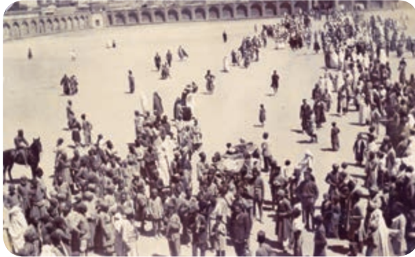
شکل ۳-۴- ارگ تاریخی کرمان (میدان ارگ فعلی)

در آستانه به قدرت رسیدن صفویان، کرمان از جمله مناطقی بود که در معرض حمله و غارت ازبکان قرار گرفت و شاه اسماعیل صفوی باشکست ازبکان، امنیت را برای کرمان به ارمغان آورد. حاکم مشهور کرمان در دوره صفویه گنجعلی خان بود. وی در طول سی سال حکومت خود بر کرمان به احداث آثار و بناهای متعدد از جمله کاروانسرا، بازار، حمام، مسجد، مدرسه و آب انبار پرداخت.