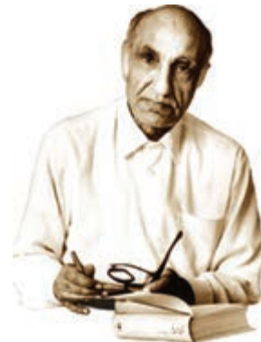
شکل ۴-۲۰- دکتر ابراهیم باستانی پاریزی