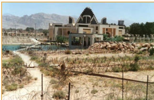
شکل ۳۰-۴ موزه دفاع مقدس استان کرمان

یادمان ها و گلزارهای شهدای استان استان کرمان با ۸۱۸ گلزار شهید و ۲۷ حرم مطهر شهدای گمنام، یکی از استان های نمونه کشور است. همچنین موزه دفاع مقدس که در سال ۱۳۷۶ به هنگام برگزاری کنگره سرداران ۸۰۰۰ شهید استان های کرمان و سیستان و بلوچستان و هرمزگان به عنوان اولین موزه دفاع مقدس کشور افتتاح شد و ستاد معراج شهدا یادگار ۶۴۰۲ شهید و سرداران شهید استان، از جمله یادمان های دفاع مقدس استان به شمار می آیند. نصب تصاویر کاشی شهدا در سطح شهرهای استان و تندیس های دفاع مقدس در میادین شهرهای استان از دیگر یادمان های دفاع مقدس است.