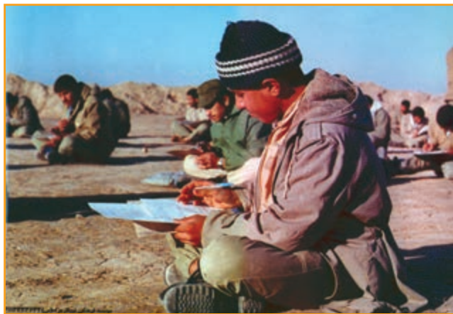
شکل ۲۸-۴ دانش آموزان رزمنده کرمانی در جبهه دفاع مقدس