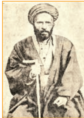
شکل ۴-۲۱- ناظم الاسلام کرمانی