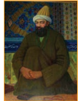
شکل ۴-۱۶- شاه نعمت الله ولی