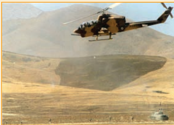
شکل ۲۵-۴- عملیات هلیکوپتر کبری در رزم با دشمن متخاصم

۲- پایگاه هوانیروز کرمان : از ابتدای جنگ تحمیلی تا پایان دفاع مقدس ملت ایران در بسیاری از عملیات‌ها حضور داشتند . تیزروازان هوانیروز با هلیکوپترهای کبری، ۲۱۴ و غیره از عملیات‌های پدافندی ایستگاه ذوالفقاری آبادان در آبان ۱۳۵۹ تا عملیات مرصاد در مرداد ۱۳۶۷ در عملیات‌های مهم ارتش و سپاه نقش آفرین بودند.