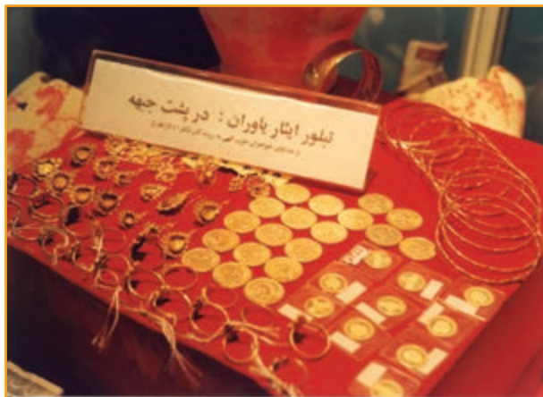
شکل ۳۲-۴- نمونه‌ای از کمک‌های مردم استان کرمان در طول هشت سال دفاع مقدس

استان کرمان در حوزه کمک‌های مردمی سرآمد سایر استان‌های کشور بود. اعزام کاروان‌هایی با بیش از ۳۰۰ دستگاه انواع مختلف خودرو، همراه با حمل کمک‌های مردم شهیدپرور کرمان در نوع خود کم‌نظیر بود.