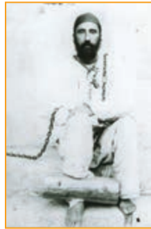
شکل ۴-۱۸- میرزا رضای کرمانی