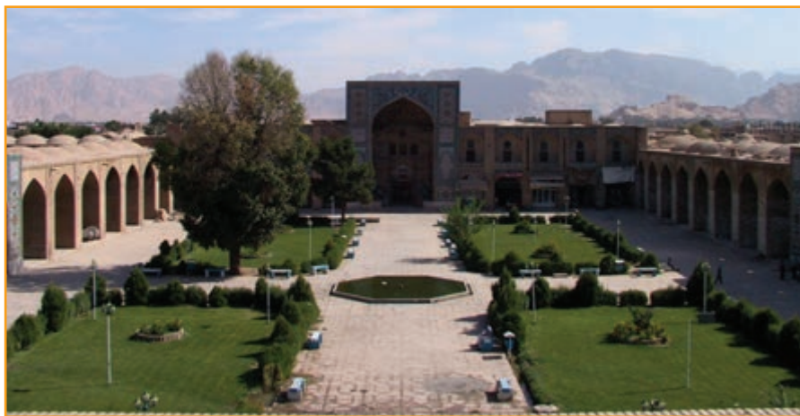
شکل ۲-۴- مجموعه تاریخی گنجعلی خان کرمان

ملک قاورد را بنیانگذار سلاجقه کرمان می دانند وی اقدامات متعددی در جهت آبادانی کرمان انجام داد از جمله سرکوبی راهزنان و برقراری امنیت، احداث کاروانسراها، آب انبار، آبادی جاده ها و ساخت مسجد بوده است. مهم ترین اقدامش در زمینه تسهیل روابط تجاری ساخت میل های (مناره) متعدد در مسیر راه سیستان بوده است. از دیگر اقدامات وی حفر چاه آب بین منطقه کویری کرمان و یزد بوده است. در این دوره پارچه های ابریشمی (بم)، توتیا (شُرْمه) از کوهبنان، قند از مکران، خرما از بم و جیرفت و شهاد به تمام نقاط صادر می شده است.