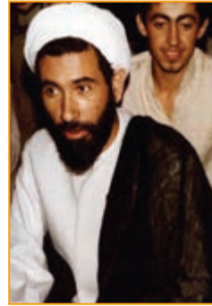
شکل ۴-۱۲- شهید دکتر محمد جواد باهنر