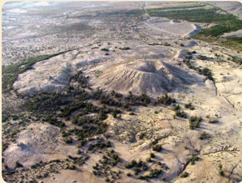
شکل ۸-۴- تپه تاریخی کنار صندل (تمدن حوزه هلیل)

وجود آثار تپه‌های تاریخی فراوان در استان کرمان دلیل قدمت چندین هزار ساله تمدن آن است.