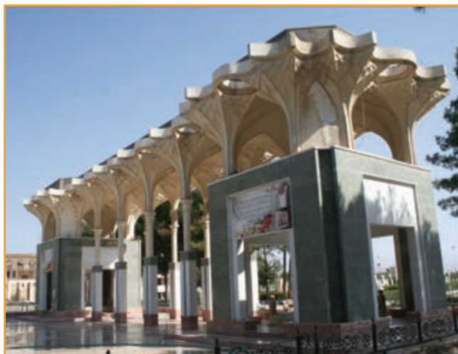
شکل ۲۹-۴ بنای یادمان شهدای گمنام استان کرمان