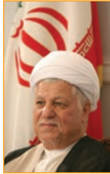
شکل ۴-۱۳- آیت الله هاشمی رفسنجانی