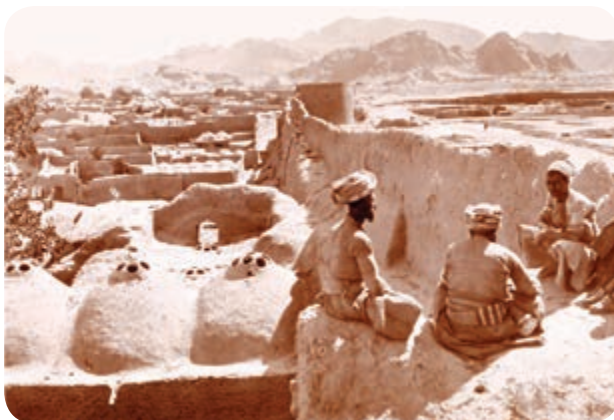
شکل ۵-۴- حصار و قسمتی از شهر قدیمی کرمان در عصر قاجار

پس از مرگ کریمخان و در آغاز حکومت لطفعلی خان زند، آقا محمد خان قاجار جهت تسخیر شیراز به آنجا حمله نمود. لطفعلی خان از شیراز فرار کرده تا اینکه به پیشنهاد حاکم نرماشیر و بم به کرمان آمده و مردم کرمان از وی حمایت کردند و این خبر برای آقا محمد خان بسیار ناگوار بود. لذا برای فتح کرمان با سپاهی عظیم به سوی کرمان هجوم آورد و پس از ماهها محاصره و سرانجام پس از فتح کرمان دست به کشتار عظیمی زد و هزاران نفر از مردم کرمان را کور کرد و شهر به ویرانه‌ای مبدل شد.