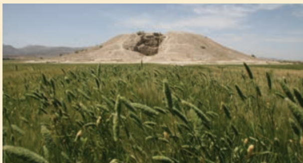
شکل ۱۰-۴- محوطه باستانی تپه یحیی