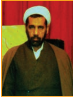
شکل ۴-۱۴- شهید حجت الاسلام علی ایرانمنش