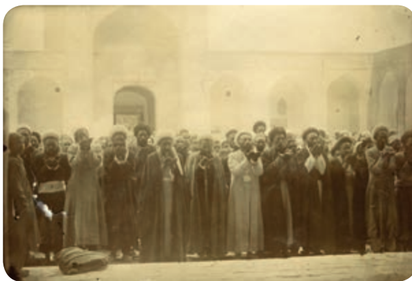
شکل ۶-۴- آیت‌الله حاج میرزا محمد رضا در مسجد جامع

ج) دوره معاصر : سرانجام همزمان با شروع انقلاب اسلامی مردم کرمان همچون دیگر دوران با حضور فعال و شجاعانه خود در صحنه سیاسی و شرکت در راهپیمایی‌ها و تحصن‌ها و مبارزه با رژیم ستم شاهی پهلوی همگام با روحانیت مبارز گام‌های استواری در رسیدن به هدف که سقوط رژیم پهلوی و استقرار نظام مقدس جمهوری اسلامی بود برداشتند. مسجد جامع و مسجد امام (ملک) دو پایگاه اصلی مردم انقلابی در کرمان بود. حادثه‌ای که باعث تسریع حرکت انقلاب در کرمان شد، به آتش کشیدن مسجد جامع توسط عمال مزدور رژیم در ۲۴ مهر ۱۳۵۷ بود.