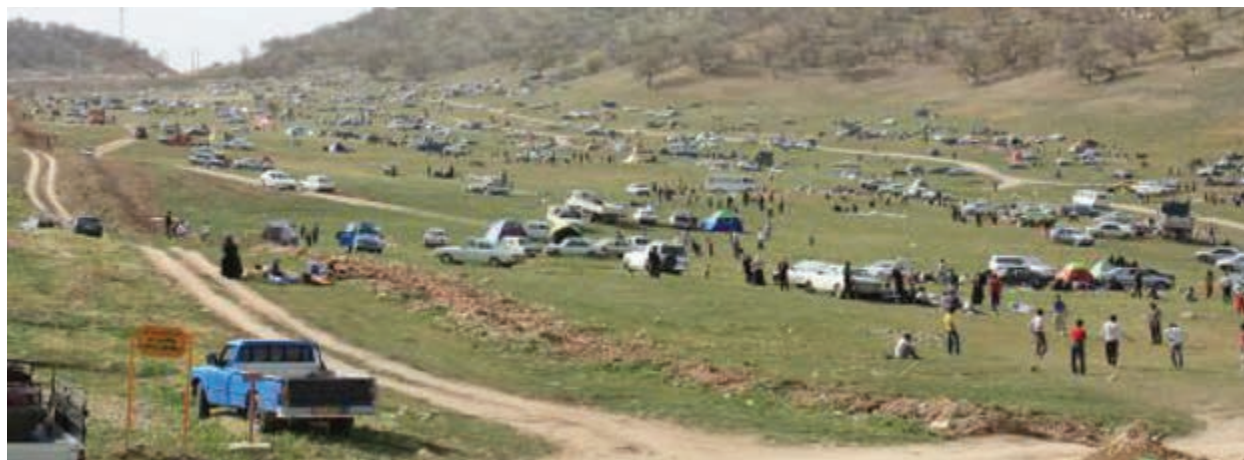
شکل ۱۱-۵ - سرنجل کل یاسوج