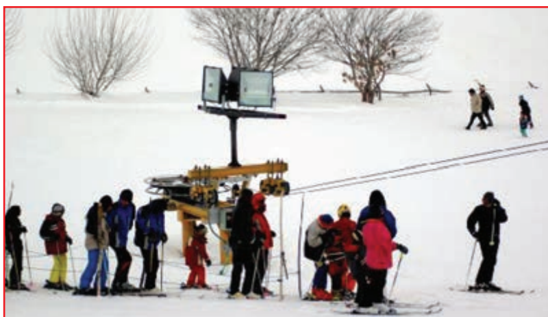
شکل ۱۲-۵ - پیست اسکی کاکان