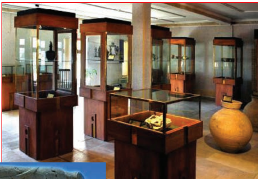
شکل ۶-۵ - گنجینه یاسوج