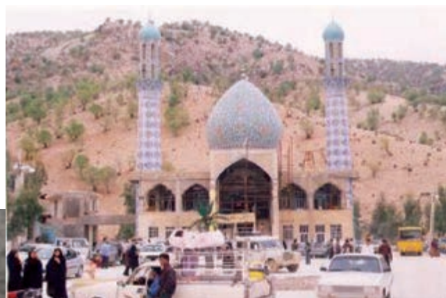
شکل ۲- ۵- امامزاده سید محمد