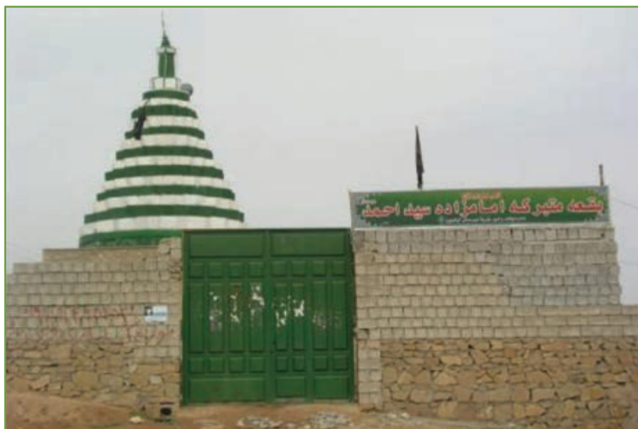
شکل ۴- ۵

۵- روستای توریستی کریک در ۱۵ کیلومتری جنوب غربی شهر سی سخت دارای طبیعت دل انگیزی است و معماری منازل مسکونی آن به صورت پلکانی می باشد. این روستا دارای سه امامزاده میر اسحاق محمد، معروف به شاه عسکر و امامزاده علی و امامزاده شاه نعمت الله می باشد. این روستا به علت قابلیت های تاریخی فرهنگی و چشم انداز طبیعی، مذهبی از روستاهای مهم گردشگری در سطح استان و کشور است. بارگاه امامزاده های مهم بی بی زهرا خاتون در دامنه های زیبای قتل دنا، امامزاده سید محمد در سی سخت و امامزاده محمود طیار سادات محمودی در شهرستان دنا قرار دارند.