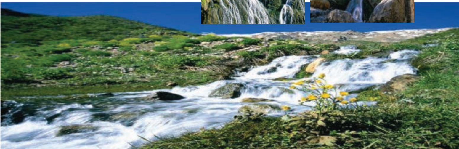
شکل ۹-۵- چشم‌اندازی از آبشارهای استان