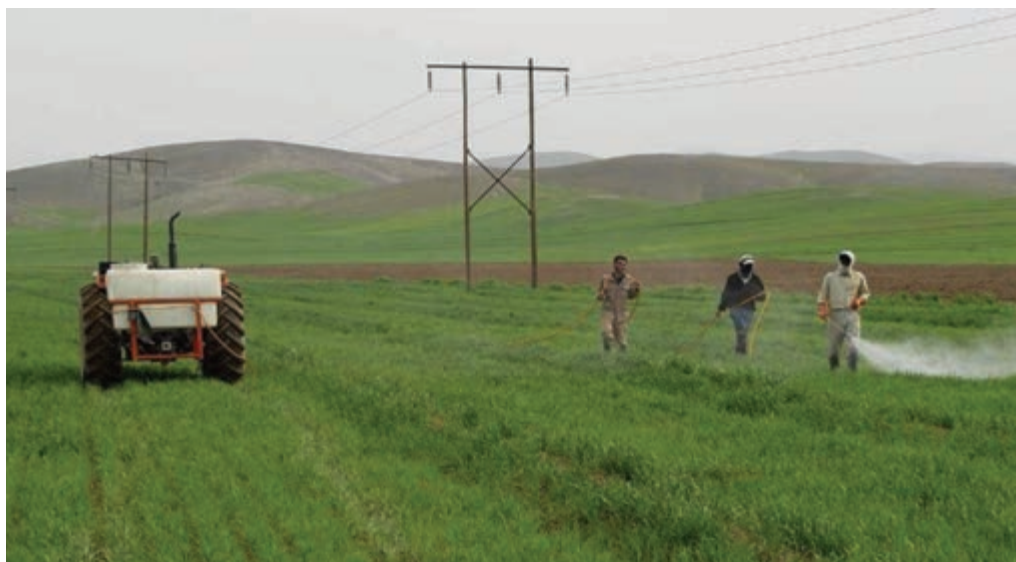
شکل ۲۲-۵- فعالیت‌های کشاورزی در اطراف شهر ری

۲- دشت‌ها و کوهپایه‌های جنوبی البرز؛ شامل ورامین، ری، شهریار و رباط کریم است. این بخش برای کشاورزی مساعد است؛ زیرا از منابع آب‌های سطحی و زیرزمینی برخوردار است اما زمین‌هایی که در نزدیکی شوره‌زارها واقع شده‌اند، برای کار کشاورزی مناسب نیستند.