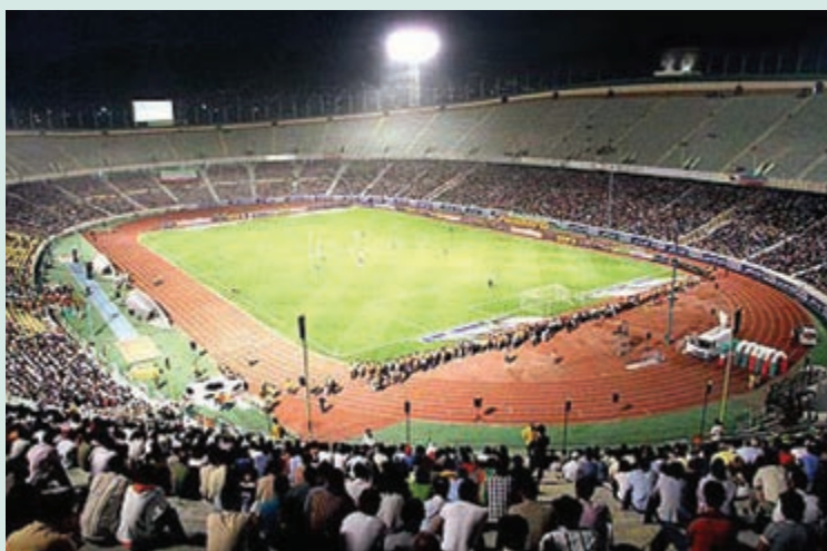
شکل ۶-۸- استادیوم آزادی تهران

استان تهران طی سی سال گذشته به خصوص از دهه ۱۳۷۰، شاهد رونق فعالیت‌های ورزشی بوده است. تعداد فضاهای ورزشی روباز و سرپوشیده استان از ۲۷۶ مورد در سال ۱۳۶۸ به ۲۷۶۸ مورد در سال ۱۳۸۷ رسیده است، اما به علت افزایش جمعیت، رشد سرانه فضای ورزشی برای هر نفر ۲۳/۰ در سال ۱۳۸۷ بوده است.