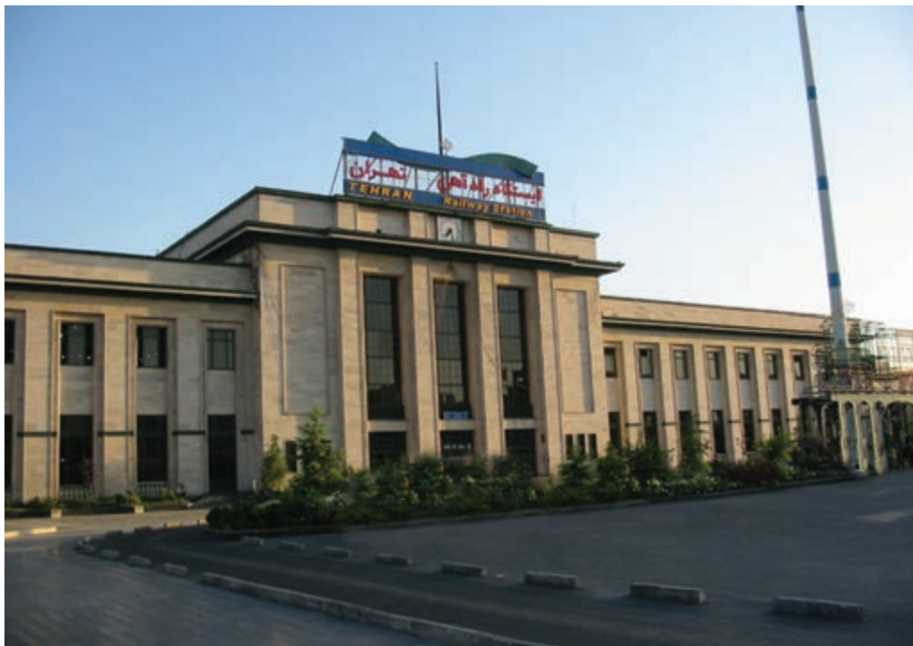
شکل ۲-۶- ایستگاه راه آهن تهران

آغاز به کار متروی تهران در سال ۱۳۷۸ نقطه عطفی در توسعه شبکه ریلی استان محسوب می شود که روزانه هزاران مسافر را جابه جا می کند.