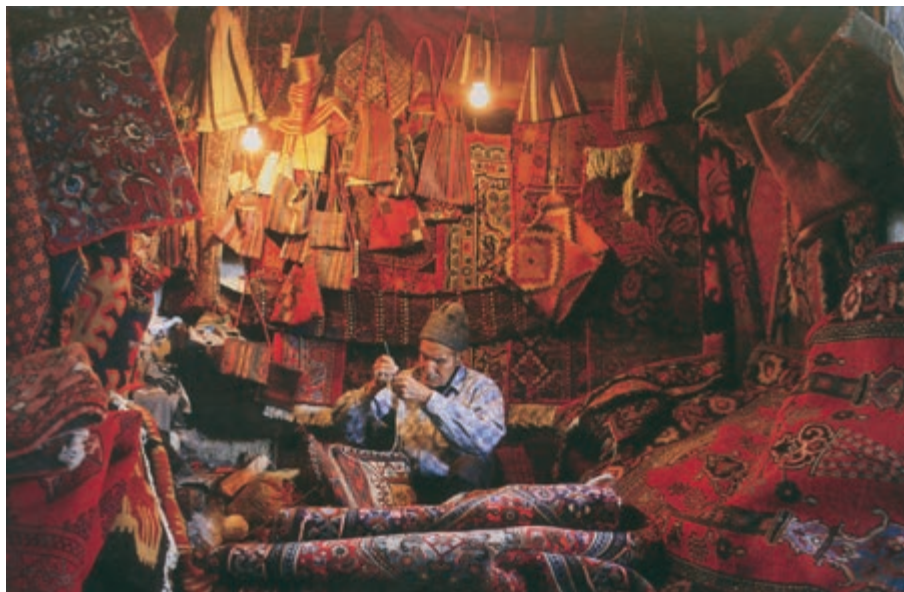
شکل ۲۷-۵- نمونه‌ای از بازار صنایع دستی تهران

۳- صنایع دستی عشایری: قدیمی‌ترین نوع صنایع دستی استان است که تولید آن عموماً به طور خانگی و فصلی انجام می‌پذیرد. این نوع از صنایع دستی، با توجه به ترکیب قومی منطقه، در میان صنایع دستی استان جایگاهی ویژه دارد و هم‌اینک یکی از نقاط برجسته و مثبت صنایع دستی استان محسوب می‌شود. دست‌اندرکاران این بخش از دست‌ساخته‌های ایرانی که بافت انواع قالی و قالیچه، جاجیم و گلیم، چننه ۱ ، رویه پستی، جوال ۲ ، خورجین ۳ و نیز رنگرزی و ریسندگی پشم را در انحصار خود دارند، گروهی از عشایر لر، قشقایی، شاهسون و... هستند که در دهه‌های اخیر از زادگاه خود به تهران، ری، ورامین و کرج مهاجرت کرده‌اند.