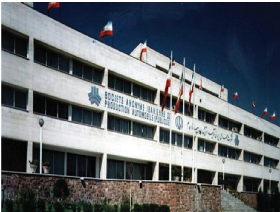
شکل ۲۵-۵- شرکت خودروسازی سایپا