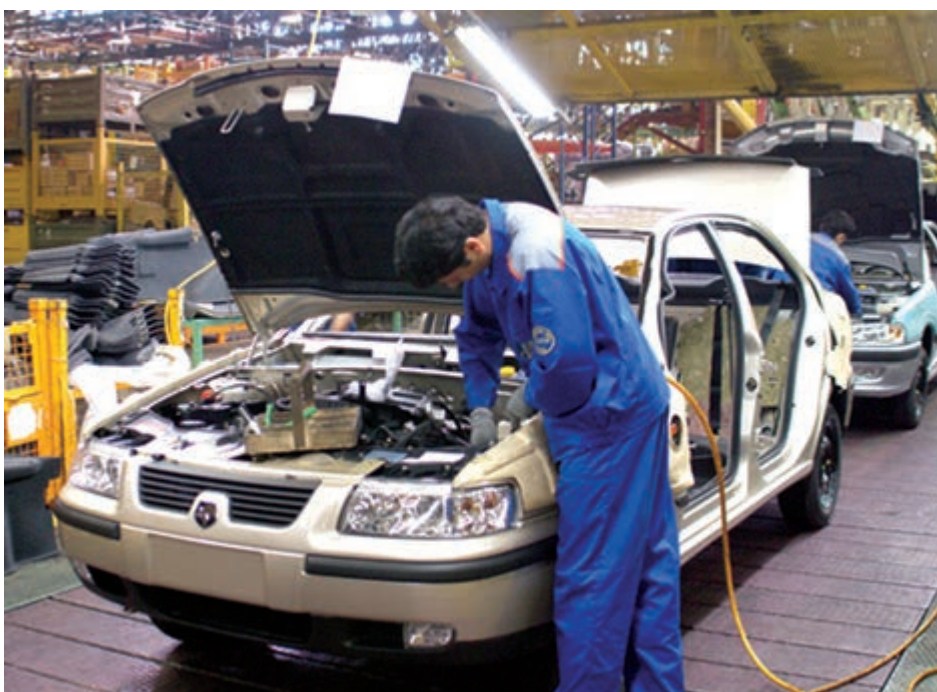
شکل ۲۶-۵- تولید اتومبیل در کارخانه ایران خودرو