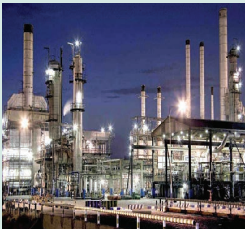
شکل ۵-۶- نیروگاه برق در تهران

صد/وسیما: ارتباطات رسانه‌ای و وسایل ارتباط جمعی به‌عنوان یکی از ابزارهای نیرومند در جهت فرهنگ‌سازی، نقش مؤثری را در توسعه اجتماعی، اقتصادی و فرهنگی جامعه به‌عهده دارد. براساس آمار و اطلاعات موجود در طی سال‌های ۱۳۷۵ تا ۱۳۸۵، تعداد ایستگاه‌های رادیویی موج متوسط، تلویزیون و اف. ام از ۱۵۴ ایستگاه به ۳۵۵ ایستگاه (۲/۳ برابر) و هم‌چنین، تعداد مجموع فرستنده‌های اصلی از ۲۷۷ به ۱۰۱۵ فرستنده افزایش یافته است.