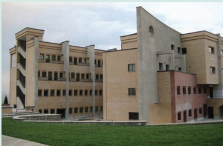
شکل ۶-۷- دانشگاه آزاد اسلامی واحد تهران

اماکن مذهبی در استان تهران براساس آمار سال ۱۳۸۶، به تعداد ۳۹۹ مکان متبرکه بوده است. در این استان، ۳۵۶۵ مسجد و ۶۰۱ حسینیه برای انجام فرایض دینی و مذهبی وجود دارد. همچنین، تعداد ۱۹ مکان مذهبی مربوط به اقلیت‌های مذهبی در شهر تهران وجود دارد.