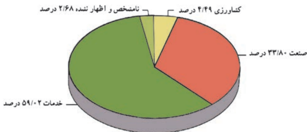
شکل ۵-۲۰- نمودار درصد شاغلان در بخش‌های مختلف اقتصادی استان

استان تهران یکی از قطب‌های اقتصادی کشور است. تجمع کانون‌های اقتصادی در این استان و موقعیت سیاسی و اداری و نیز مرکزیت آن باعث شده است که بخش عمده امکانات در محدوده آن متمرکز شود. نمودار زیر، شاغلان را در سه بخش کشاورزی، صنعت و خدمات در استان تهران نمایش می‌دهد.