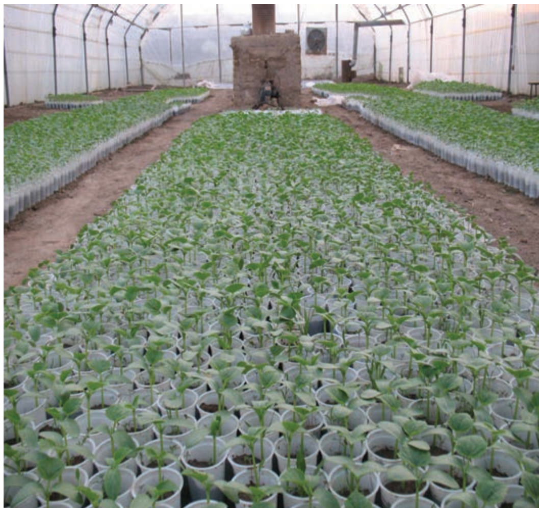
شکل ۲۳-۵- کشت گلخانه‌ای

محصولات عمده این بخش را گندم، جو، یونجه، ذرت علوفه‌ای، گوجه فرنگی، خیار، سبزی‌ها، سیب‌زمینی، نباتات علوفه‌ای، انگور، چغندر قند و پنبه تشکیل می‌دهد. از نواحی مهم آن می‌توان به دشت شهریار و ورامین اشاره کرد.