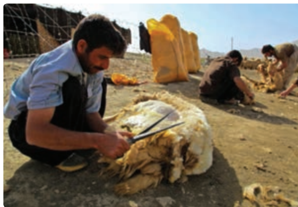
شکل ۳-۳- شیوه های همیاری در استان