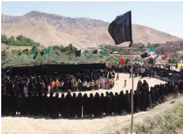
شکل ۴-۳- مراسم سنتی چه مه ر