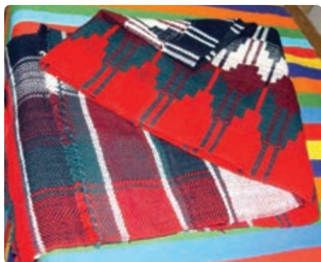
شکل ۳-۷- برخی صنایع دستی استان