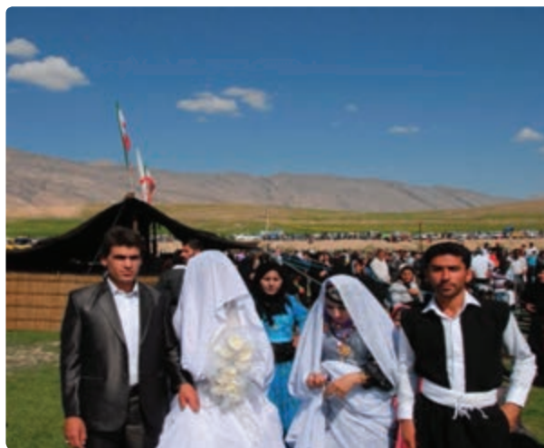
شکل ۲-۳- مراسم عروسی سنتی