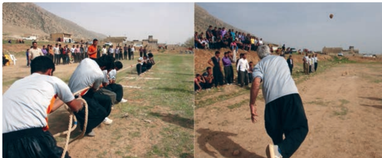
شکل ۵-۳- بازی‌های محلی در استان