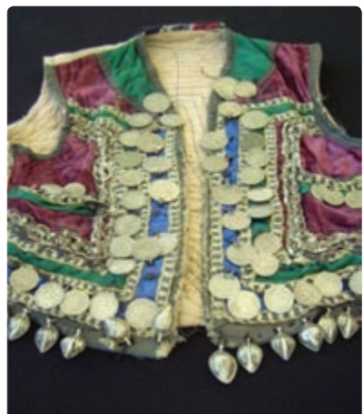
شکل ۳-۶- انواع لباس‌های محلی استان