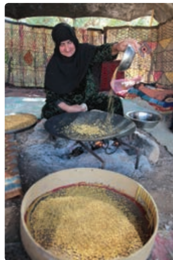
شکل ۹-۳- برخی خوراکی های محلی استان