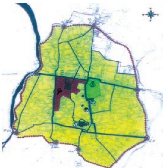
شکل ۴-۴- شهر قزوین در دوره قاجاریه

هـ. ق) پس از پیروزی بر افغان‌ها عازم قزوین شد. او به هنگام اقامت در قزوین تاجی را که بزرگان محلی در اختیارش نهاده بودند به سر نهاد و در داخل ارگ قزوین کوشکی بنا نهاد و تالاری برای پذیرایی پی افکند که به نام تالار نادری معروف شد. با مرگ نادر و درهم ریختگی اوضاع کشور، کریم خان زند (۱۱۹۳-۱۱۶۳ هـ. ق) بر تخت پادشاهی ایران نشست. قزوین در این دوره جزئی از حاکمیت این سلسله به‌شمار می‌رفت. با تأسیس سلسله قاجاریه، قزوین توسط حکام منصوب دربار قاجار یا نمایان آنان که بیشتر از شاهزادگان و وابستگان دربار بودند اداره می‌شد.