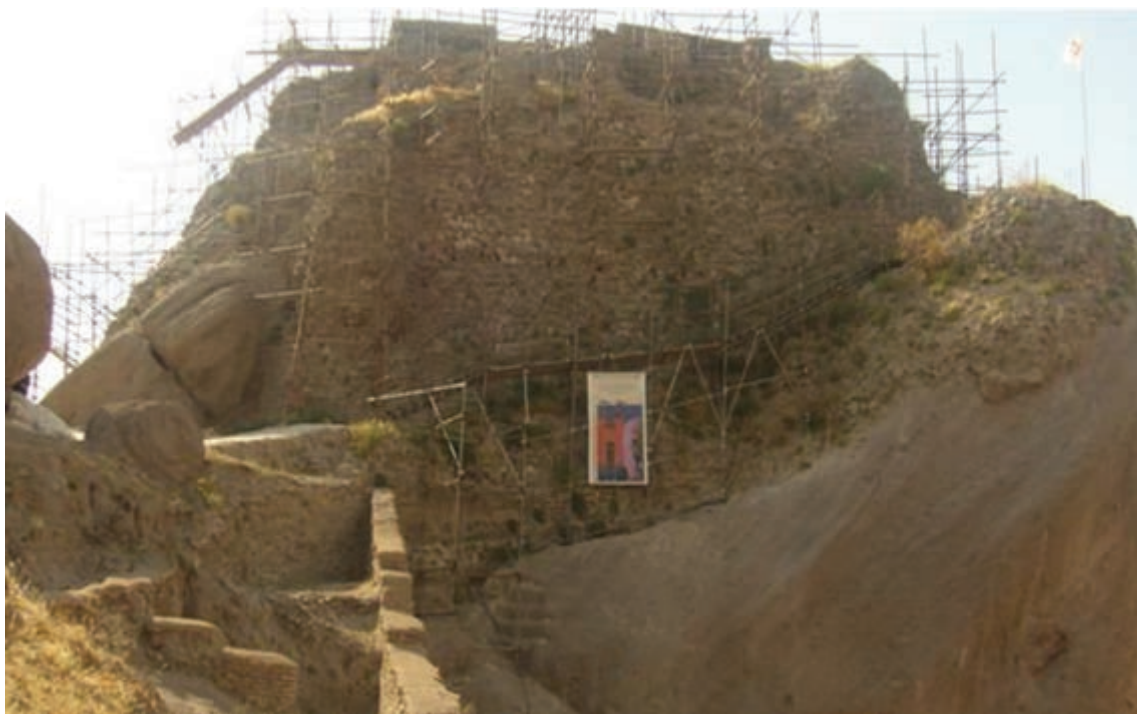
شکل ۲-۴- قلعه حسن صباح الموت، در حال مرمت