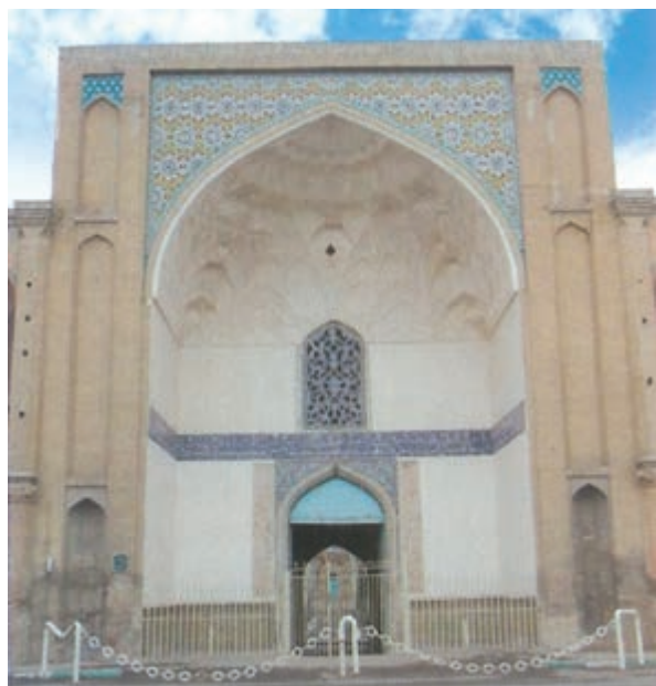
شکل ۳-۴- سردر عالی قابو از بناهای دوران صفویه

ورود سپاهیان مغول به ایران موجب ویرانی‌های بسیاری شد. با ورود آنان به شهر قزوین مردم شهر، تا سه روز با رشادت و شجاعت در مقابل مغولان مقاومت کردند، اما در نهایت سپاه مهاجم وارد شهر شد و خسارات فراوانی بر آن وارد کرد. پس از پایان حکومت مغولان و نبود حکومت قوی، صفویان توانستند دولتی نیرومند در ایران تأسیس نمایند و ثبات و نظم را به کشور بازگردانند. در زمان شاه تهماسب اول (۹۸۴-۹۳۰ ه.ق) قزوین به‌عنوان پایتخت ایران برگزیده شد و این موجب رونق و توسعه شهر گردید و واحدهای تجارتي جدیدی چون: کاروانسراها، بازارها و قیصریه‌ها در آن بنا شد. کالاهای نواحی مختلف به سوی آن سرازیر شد و راه‌های تجارتي توسعه و رونق یافت.