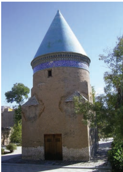
شکل ۶-۴- آرامگاه حمدالله مستوفی

حمدالله مستوفی : او نویسنده و مورخ و جغرافیدان معروف سده هشتم (تولد ۶۸۰- وفات ۷۵۰ ه.ق) و مؤلف تاریخ گزیده نزه القلوب و ظفرنامه، در دوره ایلخانان مغول می باشد. مستوفی در کارهای دیوانی و محاسباتی سرآمد بود. مزار او در محله ملک آباد قزوین واقع است.