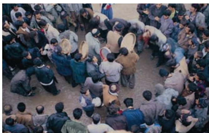
شکل ۵-۳- مراسم آیینی عرفانی پیر شالیار تخت - سروآباد

مراسم پیرشالیار در میان مردم کردستان به ویژه منطقه هورامان از جایگاه خاصی برخوردار است و ریشه در باورهای دینی مردم منطقه دارد. این مراسم بسیار کهن که تحت عنوان «چه‌ژنه و پیری» (عروسی پیر شالیار) است، در هفته دوم بهمن ماه که مصادف با جشن سده است، طی مراحل و رسومات خاصی در روستای هورامان تخت برگزار می‌شود و ادامه آن نیز در نیمه فصل بهار مصادف با ۱۵ اردیبهشت در آرامگاه پیرشالیار (تزدیکی روستای هورامان تخت)، تحت عنوان مراسم «کومسای» برگزار می‌شود. گفتنی است که بازدید از این مراسم اکنون جنبه کشوری و حتی بین‌المللی پیدا کرده است؛ به طوری که جمع کثیری از علاقه‌مندان، روزنامه‌نگاران و محققان داخلی و خارجی به هنگام برگزاری مراسم در میان بازدیدکنندگان دیده می‌شوند.