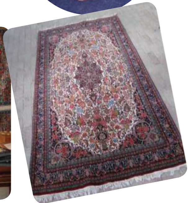
شکل ۶-۳- نمونه‌هایی از صنایع دستی استان