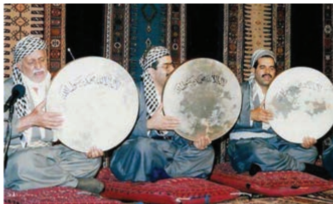
شکل ۳-۳- مولودی خوانی

از مهم‌ترین آیین‌های مذهبی نیز می‌توان به اعیاد فطر و قربان که دارای اهمیت خاصی‌اند، اشاره کرد. همچنین میلاد پیامبر اکرم (ص) به عنوان روزی خجسته همراه با مراسم مولودی خوانی و نواختن دف دارای جایگاه ویژه‌ای در میان مردم استان است که در تمام طول ماه ربیع‌الاول برگزار می‌شود. گذشته از آن، جشن معراج پیامبر و شب برات (جشن نیمه شعبان) نیز جزء اعیاد باشکوه این منطقه است.