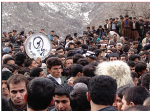
شکل ۱-۳- بخش‌هایی از ویژگی‌های فرهنگی کردها

از جاذبه‌های مهم استان کردستان ویژگی‌های فرهنگی کم‌نظیر آن است. این ویژگی‌ها بیشتر در عناصر فرهنگی همانند زبان، لباس، موسیقی، جشن‌ها، مراسم خاص و صنایع دستی نمایان شده و به صورت پویا در زندگی مردم جاری‌اند. این عناصر هویت ما را تشکیل می‌دهند. در این درس می‌خواهیم شما را با مهم‌ترین ویژگی‌های فرهنگی مردم کردستان آشنا کنیم.