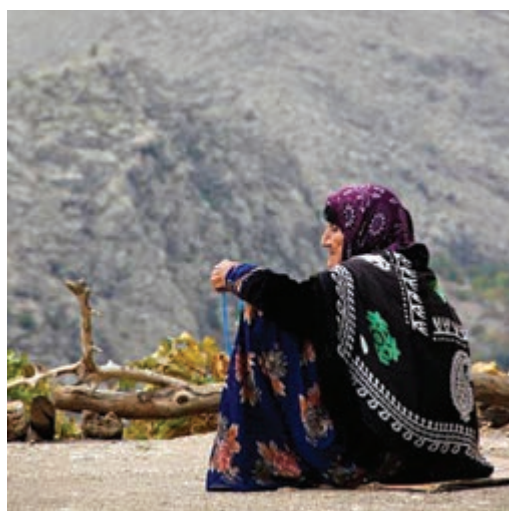
شکل ۲-۳- نمونه‌ای از لباس مردم کرد