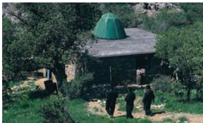
شکل ۴-۳- مقبره پیر شالیار در هورامان تخت - سروآباد