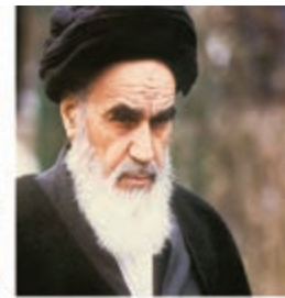
امام خمینی (ره)