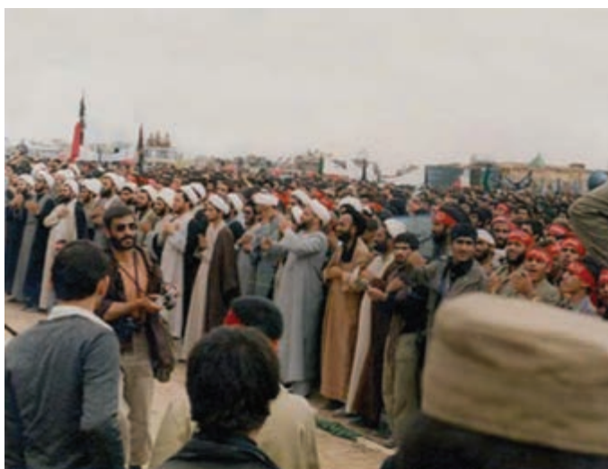
شکل ۱۴-۴- اعزام طلاب به جبهه