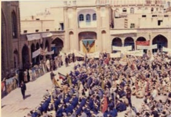
شکل ۴-۱۱- عزیمت رزمندگان روحانی به جبهه‌ها