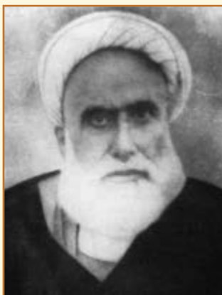
حاج شیخ عباس قمی

— قاضی احمد قمی نویسنده کتاب «خلاصة التواریخ».