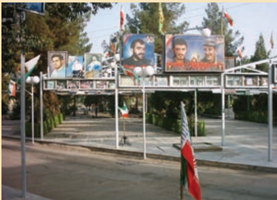
شکل ۴-۱۲- گلزار شهدای قم

در طول جنگ حدود ۵۰/۰۰۰ نفر از استان قم به جبهه‌های نبرد اعزام شدند. از این تعداد، حدود ۶۰۰۰ نفر از رزمندگان قمی به شهادت رسیدند، ۱۲۷۰۰ نفر به افتخار جانبازی نائل آمدند و ۵۴۰ نفر نیز از آزادگان سرافرازند.