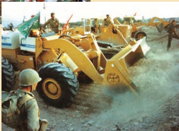
شکل ۱۵-۴ نقش جهاد سازندگی در هشت سال دفاع مقدس