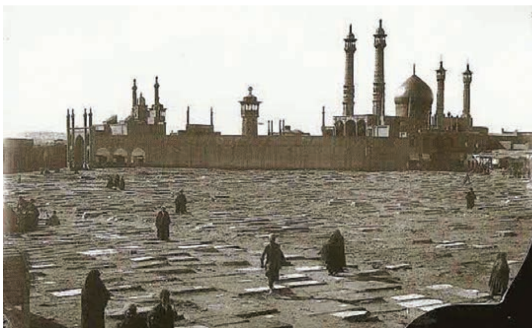
شکل ۲-۴- تصویر تاریخی از حرم مطهر حضرت معصومه (س)

در دوران سلطنت پهلوی دوم، قم به سنگر مبارزه فکری و مذهبی علیه سیاست‌های ضد مذهبی حکومت تبدیل شد. اولین جرقه انقلاب اسلامی در بهمن سال ۱۳۴۱ در شهر مقدس قم زده شد. مخالفت‌های علما و در رأس آنها حضرت امام خمینی (ره) با لایحه انجمن‌های ایالتی و ولایتی، رفراندوم اصول ششگانه انقلاب شاه و لایحه کاپیتولاسیون، شهر قم را به پایگاه مبارزه علیه رژیم محمد رضا پهلوی تبدیل کرد.