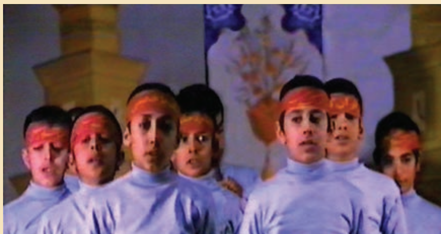
شکل ۱۶-۴ گروه سرود مدرسه قطب راوندی ساعتی قبل از شهادت