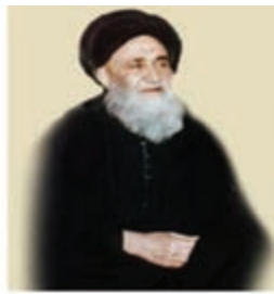
آیت الله مرعشی نجفی