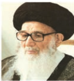
آیت الله گلپایگانی

در دوره معاصر، بزرگان زیادی در این سرزمین مقدس زندگی کرده‌اند که به چند نفر از آنها اشاره می‌شود: حضرت امام خمینی (ره) بنیان‌گذار جمهوری اسلامی ایران، آیت الله حاج شیخ عبدالکریم حائری مؤسس حوزه علمیه قم، علامه محمد حسین طباطبایی صاحب تفسیر ارزشمند المیزان، آیت الله مرعشی نجفی، آیت الله بروجردی، آیت الله گلپایگانی، آیت الله خوانساری، آیت الله بهاء‌الدینی، آیت الله اراکی، آیت الله صدر، آیت الله بهجت، آیت الله مشکینی و استاد علی اصغر فقیهی معلم و پژوهشگر برجسته. گفتنی است شهید مفتح، شهید مرتضی مطهری، شهید بهشتی، شهید آیت الله سعیدی و شهید حسین غفاری در راه پیروزی انقلاب اسلامی، به شهادت رسیدند.