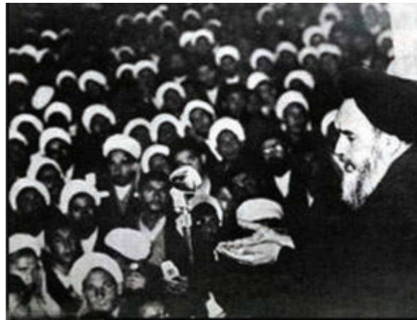
شکل ۳-۴- سخنرانی پرشور امام خمینی (ره) در ۱۲ خرداد سال ۱۳۴۲

پس از پیروزی شکوهمند انقلاب اسلامی ایران، شهر قم به پایتخت مذهبی کشور تبدیل شده است و علما و مردم آگاه قم در تحولات سیاسی کشور نقش مهمی ایفا می کنند و همواره پشتیبان برنامه ها و اهداف انقلاب اسلامی هستند.