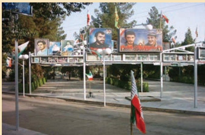
شکل ۱۸-۴ گلزار شهدای امام زاده علی بن جعفر علیه السلام قم

شهدای گمنام : یکی از مکان‌هایی که مورد بازدید و زیارت مردم قم و زائران حرم مطهر حضرت معصومه (س) قرار می‌گیرد مرقد پاک و مطهر ۱۴ شهید گمنام در محل کوه خضر نبی (ع) است. این شهدا که در پایین کوه خضر به خاک سپرده شده‌اند یکی از میعادگاهها و زیارتگاههای مردم به‌شمار می‌رود که در هفته به‌خصوص شب‌های جمعه پذیرای تعداد زیادی از زائران و هم‌زمان شهدا و مردم استان و دیگر مناطق کشور است.