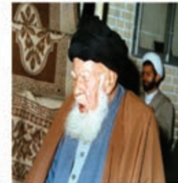
آیت الله بهاء‌الدینی