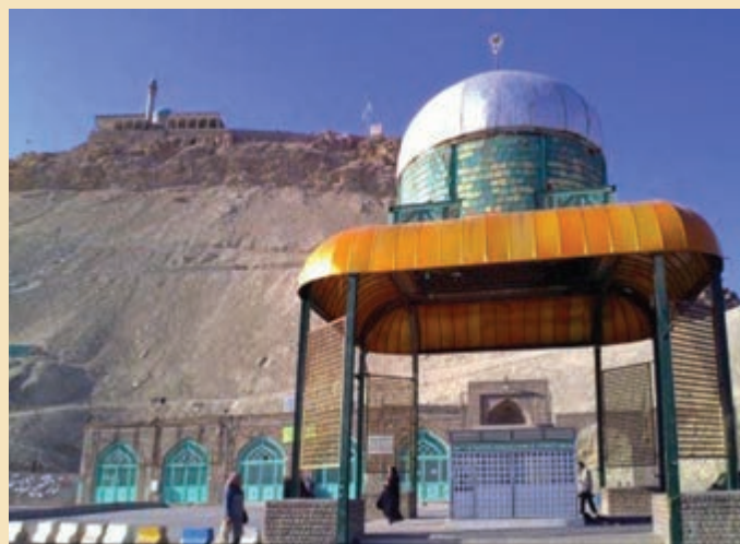
شکل ۱۹-۴ مرقد مطهر شهدای گمنام استان در دامنه کوه خضر نبی (ع)

شهدای گمنام : یکی از مکان‌هایی که مورد بازدید و زیارت مردم قم و زائران حرم مطهر حضرت معصومه (س) قرار می‌گیرد مرقد پاک و مطهر ۱۴ شهید گمنام در محل کوه خضر نبی (ع) است. این شهدا که در پایین کوه خضر به خاک سپرده شده‌اند یکی از میعادگاهها و زیارتگاههای مردم به‌شمار می‌رود که در هفته به‌خصوص شب‌های جمعه پذیرای تعداد زیادی از زائران و هم‌زمان شهدا و مردم استان و دیگر مناطق کشور است.