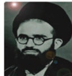
آیت الله سعیدی