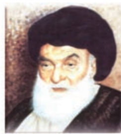
آیت الله بروجردی