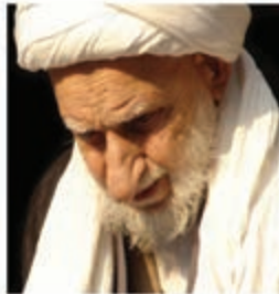
آیت الله بهجت