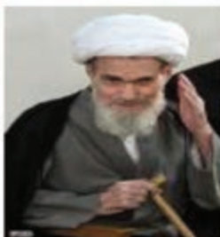
آیت الله مشکینی