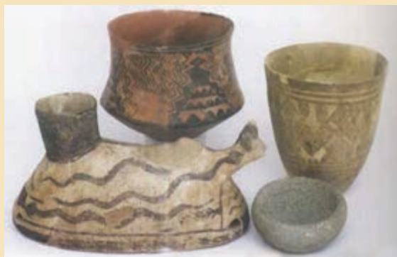
شکل ۴-۶- آثار کشف شده در قره تپه قمرود

ظروف از سفال‌های آجری و نخودی رنگ استفاده می‌کردند اما با ورود آریایی‌ها، سفالینه‌های خاکستری جایگزین آنها شد.