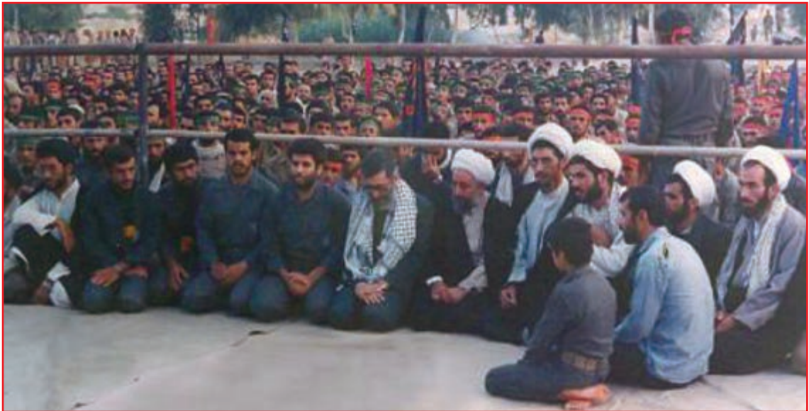
شکل ۸-۴- حضور رهبر معظم انقلاب در بین رزمندگان استان

تعداد شهدای استان: از افتخارات این استان در دفاع مقدس کسب مقام اول در اعزام نیرو از نظر جمعیت به جبهه‌های جنگ و اهداء ۱۸۰۰ شهید، ۳۳۰۰۰ رزمنده، ۱۳۰۰۰ جانباز، ۳۱۰ نفر آزاده، که ۲۷۰ نفر از شهدا پاسدار، ۳۰۰ نفر سرباز و بقیه بسیجی بوده‌اند.