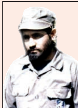
شهید فریبرز پناهی (دهدشت)