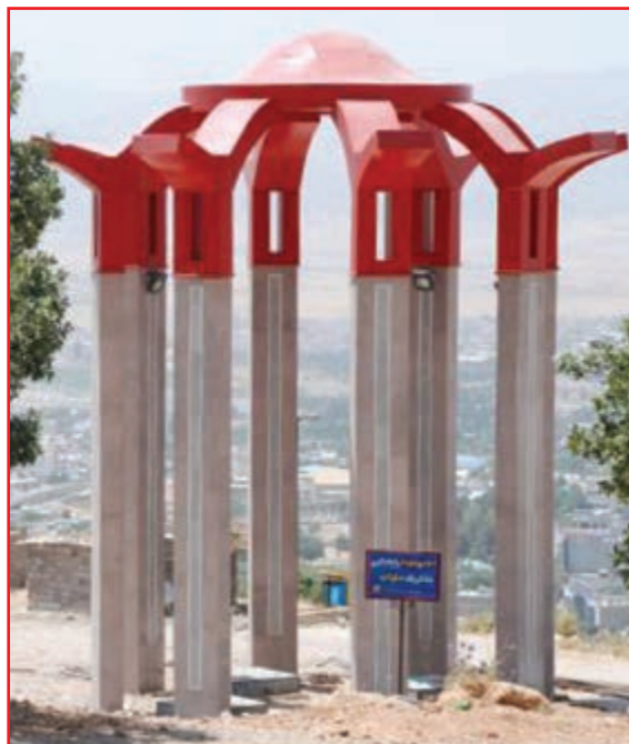
شکل ۹-۴- یادمان شهدای گمنام

تعداد شهدای استان: از افتخارات این استان در دفاع مقدس کسب مقام اول در اعزام نیرو از نظر جمعیت به جبهه‌های جنگ و اهداء ۱۸۰۰ شهید، ۳۳۰۰۰ رزمنده، ۱۳۰۰۰ جانباز، ۳۱۰ نفر آزاده، که ۲۷۰ نفر از شهدا پاسدار، ۳۰۰ نفر سرباز و بقیه بسیجی بوده‌اند.