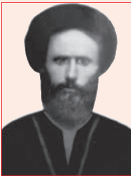
شکل ۱۷-۴- مرحوم آقا میرعلی صفدر تقوی

الف) مرحوم آقا میرعلی صفدر تقوی: در سال ۱۲۹۴-۱۲۹۳ در کهگیلویه متولد شد. پس از فوت پدرش (میرمحمد جعفر) مدتی در حوزه های علمی کازرون و شیراز به تحصیل علم پرداخت. سپس عازم نجف شد. ایشان در مدت تحصیل در حوزه علمی نجف با فقهای مشهوری همچون مرحوم آیت الله العظمی سید محمد کاظم یزدی صاحب عروة الوثقی و مرحوم آیت الله العظمی سید ابوالحسن اصفهانی صاحب وسیله النجات مراوده و مکاتبات داشته است که از مقام علمی ایشان حکایت می کند. بعد از بازگشت به کهگیلویه، مقام ممتاز علمی و تقوای وی باعث شد اعتماد عمومی مردم را به دست آورد. از وی سروده هایی با مضامین دینی و سیاسی به جا مانده است. وی سرانجام در ۱۵ صفر ۱۳۵۷ ه.ق مطابق با ۲۷ فروردین ۱۳۱۷ در سن ۶۳ سالگی در شهر سوق به رحمت خدا پیوست.