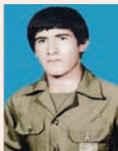
شهیدالله کس نوربخش خرسندیان

شکل ۱۲-۴ - کیوتران یک آشیانه (سه شهید از یک خانواده)