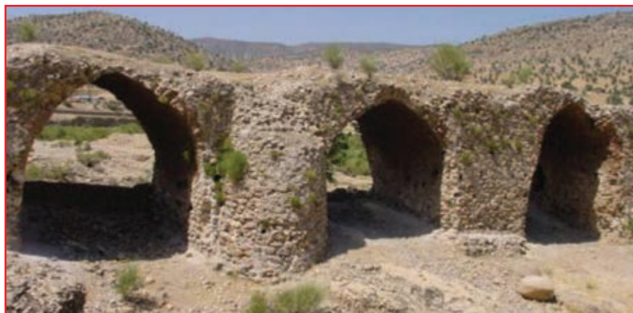
شکل ۲-۴- پل قدیمی پاتاوه از دوره هخامنشیان

با آمدن پارس‌ها به این نواحی و قدرت گرفتن شاهان اولیه هخامنشی، این منطقه خاستگاه تمدن هخامنشی نیز به حساب می‌آید. امپراتوری هخامنشی دارای ۲۳ استان (ساتراپ) بود که ساتراپ پارس یکی از آنها به شمار می‌رفته است. کهگیلویه و بویراحمد بخشی از ساتراپ پارس بوده است. پایه‌های پل هخامنشی در کنار شهر پاتاوه و پایه پل هخامنشی تخت شاه نشین و حماسه ملی آریو برزن این موضوع را تأیید می‌کند.