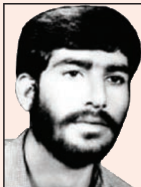
شهید سجاد احمدی (گچساران)