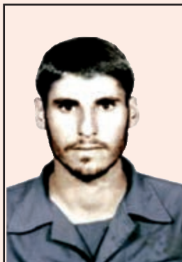
شهید خدامراد مرادی (چرام)