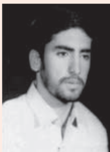
شهید سیده‌همت‌الله غریبی