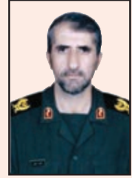
شهید گودرز نجفی (دنا)