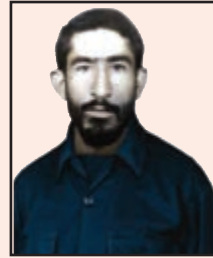
شهید نورالله یزدانپناه (لوداب)