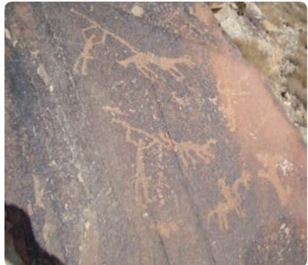
شکل ۱-۴- نقش سنگ نگاره‌های کوه ارنان

قبرهای خورشیدی در ارتفاعات کوه‌های بوهروک و نواحی جنوب غربی یزد که مربوط به دوران خورشید پرستی است و مربوط به سه تا شش هزار سال پیش است، نمونه‌های دیگری است. زراعت و مدنیت یزد، از مناطق مهریز و فهرج، یزد، رستاق، مید، اردکان و ابرکوه شروع شد اما کشاورزی در مهریز، فهرج و یزد در ابتدا وابسته به آب‌های سطحی ولی بعداً به دلیل کمبود ریزش‌های جوی و در کنار آن گرم شدن هوا مانند دیگر مناطق وابسته به آب‌های زیرزمینی، قنات (کاریز) شد.