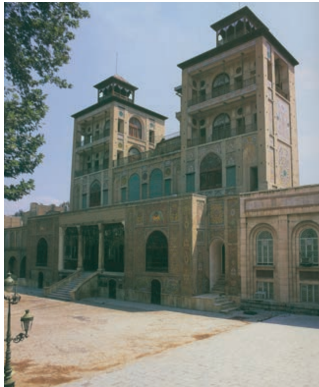
شکل ۱۵-۵- کاخ شمس العماره در مجموعه کاخ موزه گلستان

● اماکن تاریخی: تپه‌های باستانی، کاروانسراها، غارها و کتیبه‌های تاریخی، آب انبارها و حمام‌های قدیمی، بقعه‌ها، میادین و قلعه‌ها و برج‌های تاریخی از جمله جاذبه‌های دیگر استان تهران است (جدول ۲-۵).