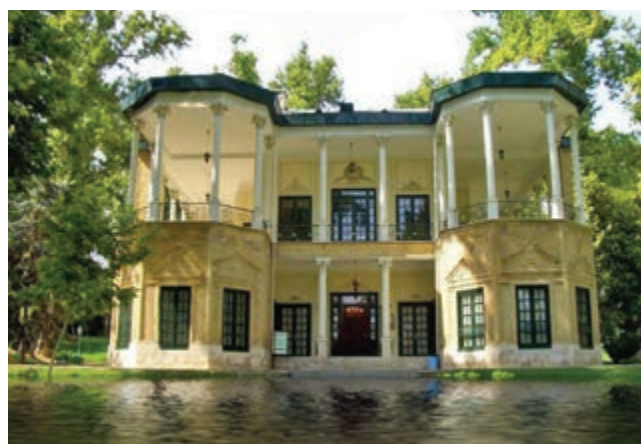
شکل ۱۴-۵- کوشک احمد شاه در مجموعه کاخ موزه نیاوران