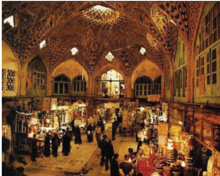
شکل ۱۷-۵- بازار بزرگ تهران

● بازارها: در تهران تعداد زیادی بازار، مراکز خرید و نمایشگاه‌های تجاری و هنری وجود دارد که در فصول مختلف سال موجب جذب گردشگران به این استان می‌شود. بازار سنتی تهران، بازار بین الحرمین، تیمچه امین اقدس و ...، از جمله بازارهای قدیمی تهران‌اند که علاوه بر حفظ اهمیت تجاری، از اهمیت تاریخی نیز برخوردارند.