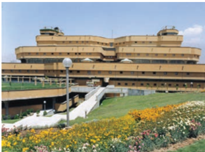
شکل ۵-۶- کتابخانه ملی