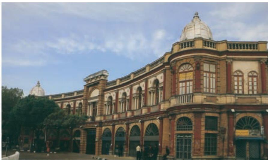
شکل ۱۶-۵- میدان حسن آباد