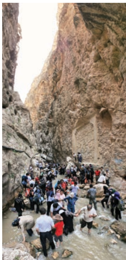
شکل ۹-۵- تنگه واشی

غرب و شرق استان تهران را رودخانه‌های خروشان در بر گرفته که با احداث سد بر روی آن‌ها دریاچه‌های بزرگ و زیبایی به وجود آمده است که مناسب انواع ورزش‌ها و تفریحات آبی هستند.