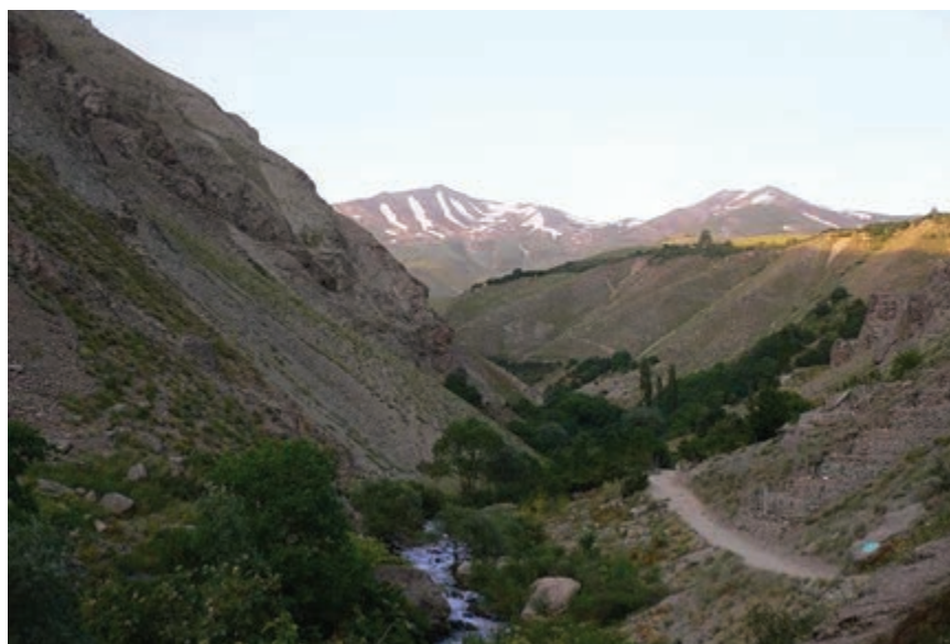
شکل ۱۳-۵- مسیر آبشار شکر آب