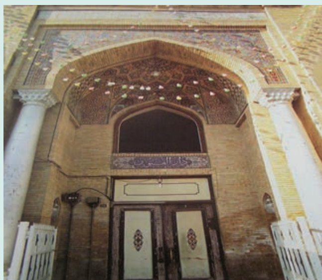
شکل ۵-۷- مدرسه دارالفنون

در مورد یکی از دانش آموختگان مشهور مدرسه دارالفنون گزارشی کوتاه تهیه کنید.