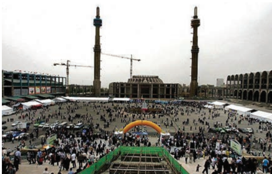
شکل ۱۸-۵- نمایشگاه بین المللی کتاب تهران - مصلی بزرگ امام خمینی (ره)

برپایی نمایشگاه‌های متعدد و گوناگون در تمام طول سال، مانند نمایشگاه بین المللی کتاب تهران، نمایشگاه دائمی گل و گیاه و برگزاری جشنواره‌های فرهنگی - هنری نیز از دیگر جاذبه‌های استان تهران برای گردشگران است.