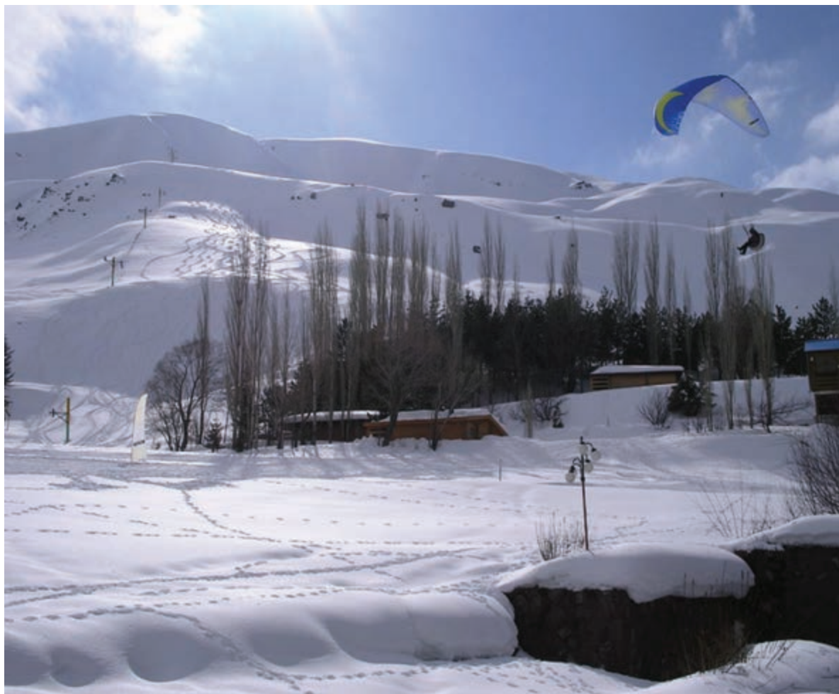
شکل ۱۲-۵- پیست اسکی دیزین

پیست اسکی دیزین، توچال و آبدلی بزرگ‌ترین پیست‌های اسکی ایران در دامنه کوه‌های سر به فلک کشیده البرز پذیرای دوستداران ورزش‌های مفرح زمستانی هستند. غارها، چشمه‌ها، دریاچه‌ها و آبشارهای طبیعی از دیگر جاذبه‌های گردشگری این استان است، تنگه واشی یکی از این جاذبه‌هاست که در فصل تابستان زیباترین چشم‌اندازهای طبیعی را به نمایش می‌گذارد (جدول ۱-۵). غار رودافشان در ۶۲ کیلومتری جاده دماوند یکی از زیباترین غارهای استان تهران در نزدیکی روستای رودافشان واقع شده است.