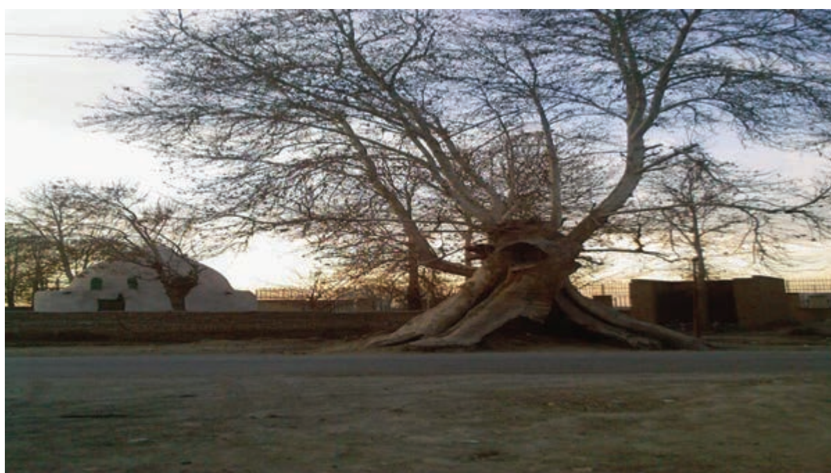
شکل ۵-۱۱- درختی کهن در ورامین