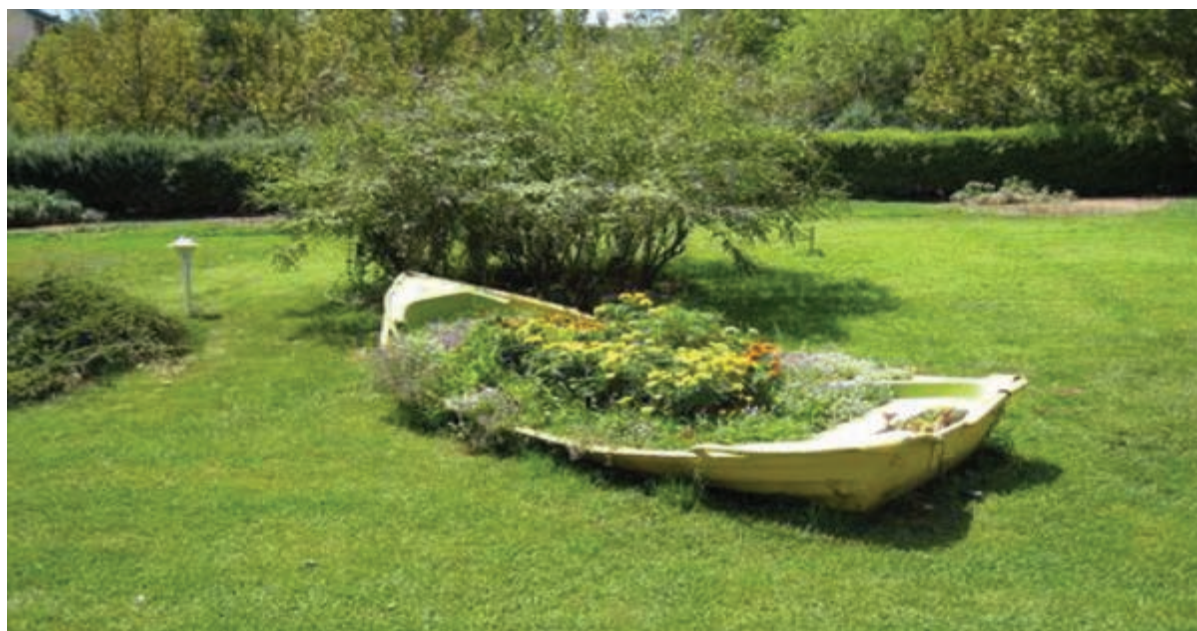
شکل ۵-۱۰- پارکی زیبا در تهران