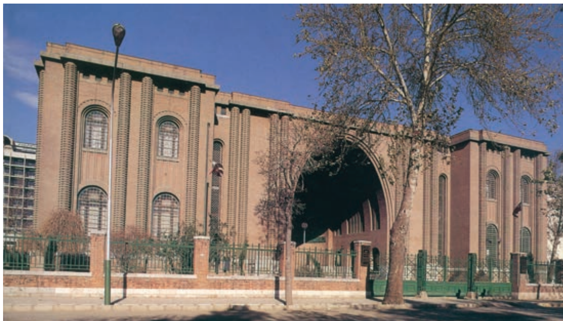
شکل ۸-۵- موزه ایران باستان

جاذبه‌های گردشگری در استان تهران به دو بخش تقسیم می‌شود :