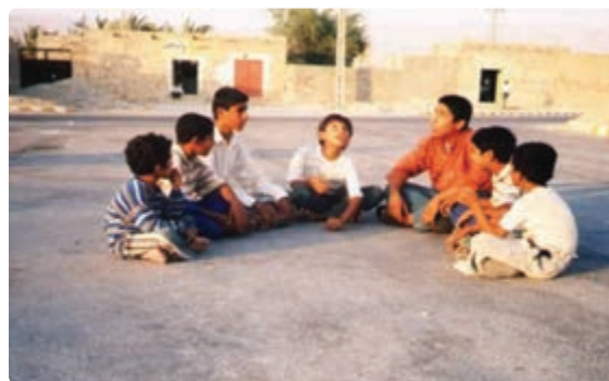
شکل ۱۳-۹- تصاویری از بازی‌های محلی در استان بوشهر