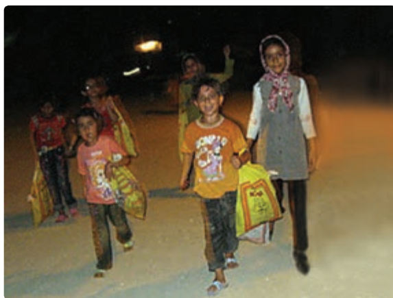
شکل ۱۱-۹- مراسم گره گشو در شهرستان دیر

به سبب آنکه این رسم در ماه مبارک رمضان صورت می گیرد می توان انجام آن را در اعتقادات مذهبی شیعیان جست و جو کرده و به روز تولد امام حسن مجتبی علیه السلام مربوط دانست.