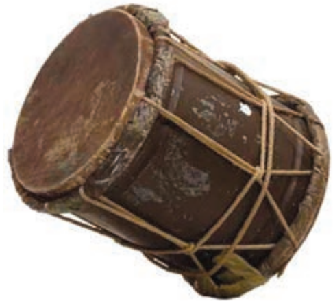
شکل ۹-۸- دمام

مراسم سینه زنی : این مراسم مذهبی با نوحه خوانی شخصی که به عنوان پیش خوان یا سرخوان شناخته شده آغاز می شود. در ابتدای مراسم، نوجوانان، جوانان و دست اندرکاران مسجد، گرد پیش خوان حلقه ای دایره ای شکل تشکیل می دهند که به آن «بر» (Bor) می گویند. سینه زنی در تعزیت پیشوایان دینی و مذهبی در شهرها و روستاهای استان برگزار می گردد.