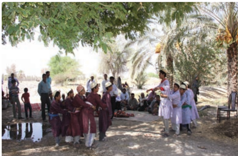
شکل ۱۴-۹. بازی هل هله گرگ چنبری