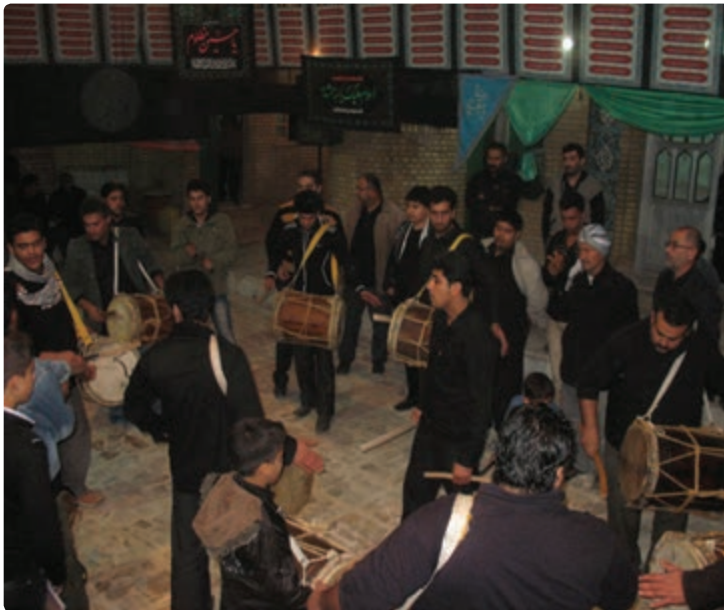
شکل ۹-۹- مراسم دمام زنی

جشن ها و آیین های استان بوشهر به جشن های مذهبی و ملی تقسیم می شوند. جشن های بزرگ مذهبی شامل جشن میلاد حضرت محمد (ص)، میلاد حضرت علی (ع)، میلاد حضرت امام زمان (عج)، عید فطر، عید قربان از جمله اعیاد مذهبی هستند که باشکوه خاصی برگزار می شوند. مراسم عید نوروز به عنوان جشن ملی مانند دیگر استان های کشور در استان بوشهر اجرا می شود. مراسم سنج و دمام زنی : استفاده از سنج، دمام و بوق که هم زمان در مراسم عزاداری نواخته می شود، ابتدا برای خبر کردن از آن استفاده می شد که بعدها جزئی از مراسم عزاداری گردیده است.