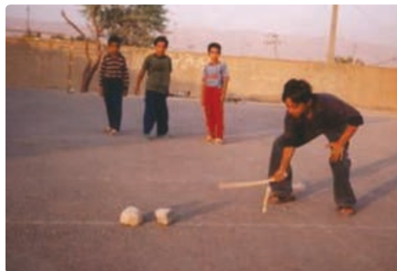
شکل ۱۵-۹. بازی چوکیلی