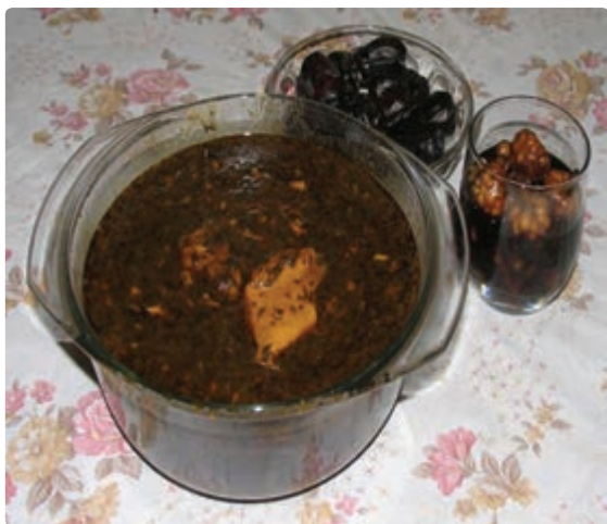
شکل ۹-۶ - قلیه ماهی

در استان بوشهر به دلیل نزدیکی به دریا اکثر غذاهای سنتی از آبریان تهیه می‌شود و مردم منطقه کوهستانی و دشت نشین از غذاهایی استفاده می‌نمایند که بیشتر در آنها گندم، لبنیات و خرما به کار رفته است. قلیه ماهی و میگو، تنداز ماهی، گمنه(للك)، رشته، لځ لځ، عدس، مرغ شکم گرفته، ماهی شور، شکرپلو، قیمه، پختی، برنجوش، دال عدس، کشکته و... از انواع غذاهای استان است و رنگینک، حلوا خرمایی و... به عنوان پیش غذا در میان مردم استان رایج است.