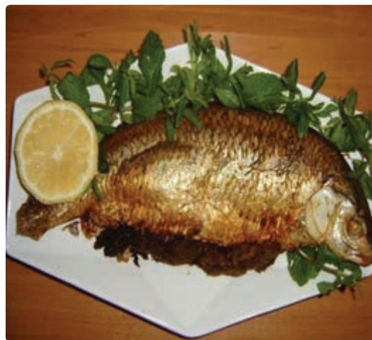
شکل ۹-۵ - ماهی شکم پر