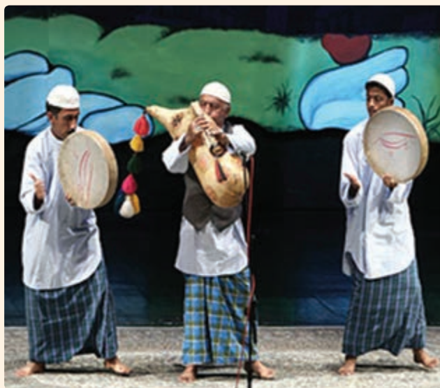
شکل ۱۶-۹- اجرای ساز نی امبان

البته موسیقی استان متقابلاً بر موسیقی ملی ایران تأثیر گذار بوده است، از جمله در ردیف موسیقی سنتی ایران، بسیاری از گوشه‌های آواز دشتی در ردیف سنتی متأثر از شروه و آوازهای رایج در منطقه دشتی، دشتستان و تنگستان و... می‌باشد.