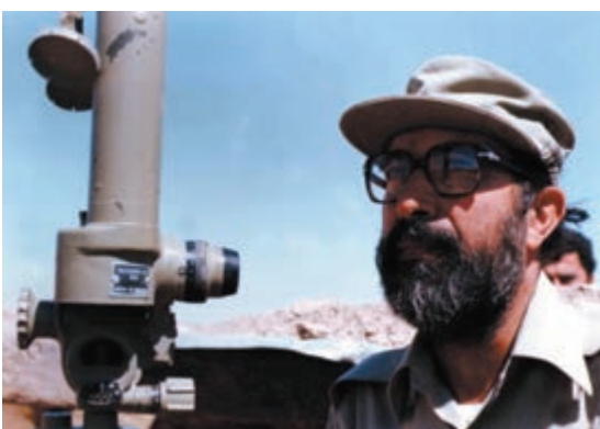
شکل ۱۱-۴- شهید دکتر مصطفی جمران

شخصیت‌های برجسته‌ی زیادی را می‌توان از تهران نام برد که سنگرهای خود را در مجلس شورای اسلامی، مدرسه و ... ترک کردند و به جبهه‌ها شتافتند و به درجه رفیع شهادت نائل آمدند؛ از آن جمله می‌توان شهید مصطفی جمران را نام برد. همچنین از میان سرداران سپاه و ارتش نیز افراد برجسته‌ای بودند که با وجود مسئولیت‌های کلان کشوری، سنگرها را بر صندلی‌ها ترجیح دادند و همچون سایر رزمندگان به خطوط مقدم جبهه رفتند؛ از جمله تیمسار ولی... فلاهی، شهید ستاری، شهید حسن باقری، شهید کلاهدوز و شهید سید مرتضی آوینی (شهید اهل قلم) روایتگر «روایت فتح».