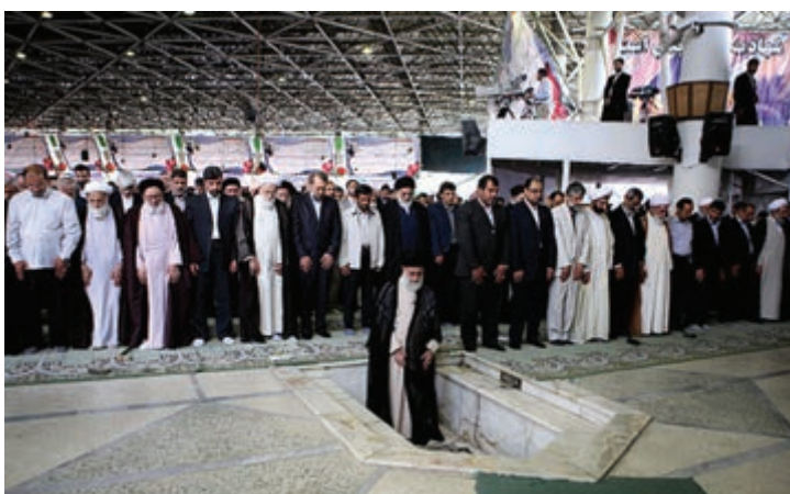
شکل ۱۶-۴- نماز جمعه تهران به امامت مقام معظم رهبری

مردم تهران نه تنها در صحنه دفاع حضور فعال داشتند بلکه با تشکیل ستاد معین بازسازی، همچنان حضور خود را در صحنه حفظ کردند و در زمینه آبادسازی مناطق آزاد شده به خصوص خرمشهر، به تلاش های خود ادامه دادند.