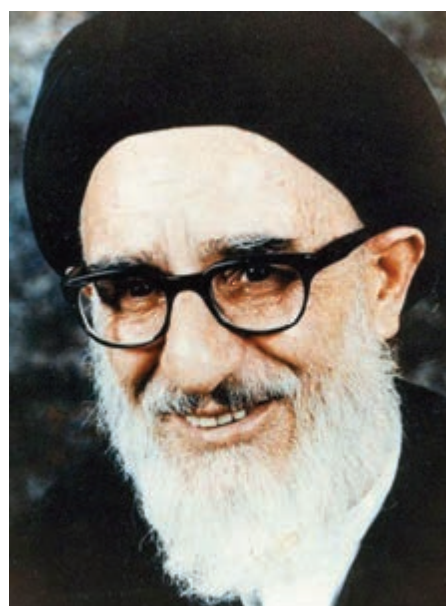
شکل ۱۴-۴- مرحوم آیت‌الله طالقانی