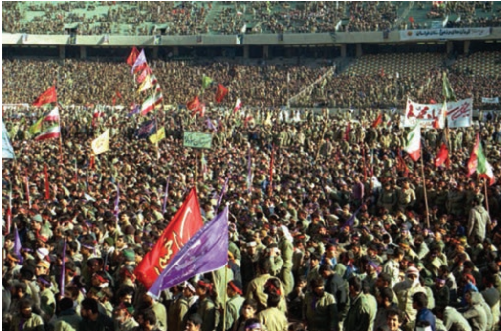
شکل ۷-۴ اعزام سراسری یکصد هزار نفری سپاه حضرت محمد (ص) از شهر تهران

شهر تهران به دلیل مرکزیت سیاسی، نقش بسیار ارزشمندی در دفاع از کیان اسلامی در دوران هشت سال دفاع مقدس بر عهده داشت. استان تهران اگرچه از نظر جغرافیایی دور از مرزها به سر می‌برد، ولی به واسطه پایتخت بودن و پشتیبانی خطوط جبهه، تقریباً مانند شهرهای مرزی مورد حملات هوایی قرار می‌گرفت. تهران به دلیل برخورداری از استعدادهایی در زمینه جذب و انتقال نیرو نسبت به سایر شهرها موقعیت ویژه‌ای داشت، به همین جهت، از اولین شهرهایی بود که در آغاز جنگ تحمیلی مورد حمله قرار گرفت. وجود پادگان‌های متعدد و فرودگاه‌های نظامی، خود استعداد بالقوه‌ای برای جذب نیروهایی شده بود که در بدو پیروزی انقلاب به دامن مردم پناه آورده بودند و پس از آغاز جنگ، عمده آن‌ها به پادگان‌ها برگشتند و به دفاع از سرزمین مقدس خود پرداختند. استان تهران با برخورداری از جمعیت کثیری نسبت به سایر استان‌ها و دارا بودن پادگان‌ها و مراکز دفاعی متعدد، به طور طبیعی نقش بسیار خطیری در دفاع از میهن اسلامی بر عهده داشت. با آغاز جنگ تحمیلی علیه جمهوری نوپای اسلامی، حضور داوطلبانه و فعال نیروهای مردمی، بسیاری از مشکلات را حل کرد. علاوه بر آن، حضور ارزشمند نیروهای مردمی در قالب نیروهای داوطلب، از پایگاه‌های بسیج ادارات و مساجد نیز شکوه دیگری از این عظمت را نشان داد که اوج آن را در اعزام سراسری یکصد هزار نفری سپاه حضرت محمد (ص) شاهد بودیم.