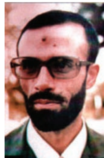
شکل ۸-۴- شهید کلاهدوز