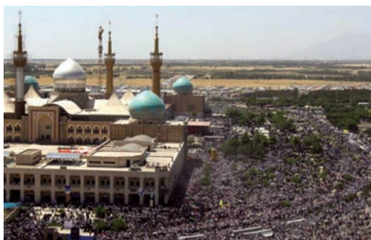
شکل ۱۷-۴- حرم مطهر امام خمینی (ره)

اکنون نیز جای آن دارد که با پاس داشتن خون شهدای گرانقدر، حفظ دستاوردهای رشادت های آن عزیزان و ادامه راه آن ها، رضایت خداوند بزرگ را نیز فراهم آوریم.