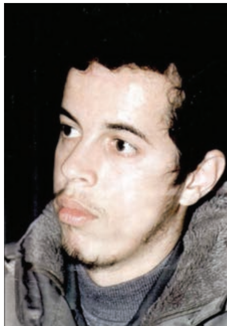
شکل ۱۲-۴- شهید حسن باقری

از روحانیان ممتاز می‌توان از مرحوم آیت‌الله طالقانی یاد کرد. او شکنجه‌های بسیاری در زندان طاغوت کشید و از یاران امام خمینی (ره) و اولین امام جمعه تهران پس از انقلاب بود. آیت‌الله طالقانی شاگردان بسیاری برای مبارزه با رژیم ستم‌شاهی تربیت کرد که شهید چمران یکی از کسانی بود که در مجالس درس ایشان شرکت می‌کرد.