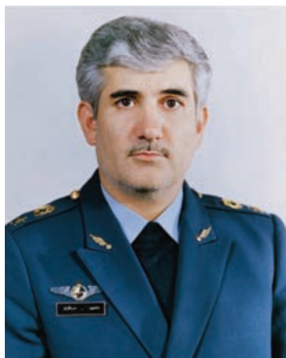
شکل ۹-۴- شهید ستاری