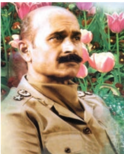
شکل ۱۰-۴- شهید فلاهی

از دیگر کمک‌های مردمی به رزمندگان علاوه بر اهدای کالا، می‌توان به اهدای خون نیز اشاره کرد. مردم هر وقت احساس می‌کردند به خون آن‌ها نیاز است، دریغ نمی‌کردند. همچنین، آنان با شرکت فعال در راهپیمایی‌ها به مناسبت‌های مختلف، به رغم بمب‌گذاری‌ها و حملات هوایی دشمن، موجب تقویت روحیه رزمندگان می‌شدند و دشمنان را مأیوس می‌کردند.