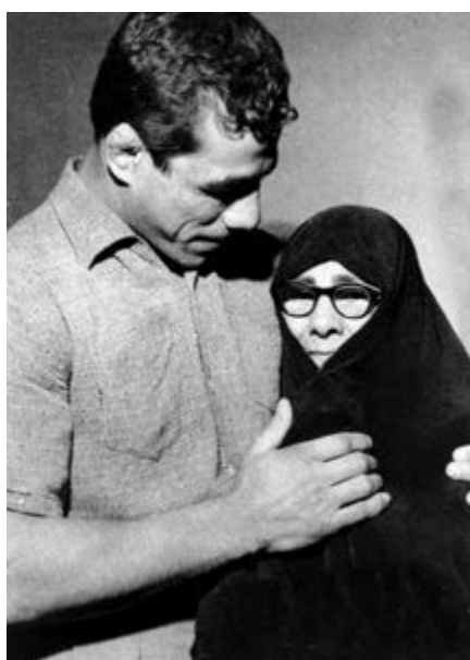
شکل ۱۵-۴- جهان پهلوان تختی

از روحانیان ممتاز می‌توان از مرحوم آیت‌الله طالقانی یاد کرد. او شکنجه‌های بسیاری در زندان طاغوت کشید و از یاران امام خمینی (ره) و اولین امام جمعه تهران پس از انقلاب بود. آیت‌الله طالقانی شاگردان بسیاری برای مبارزه با رژیم ستم‌شاهی تربیت کرد که شهید چمران یکی از کسانی بود که در مجالس درس ایشان شرکت می‌کرد.