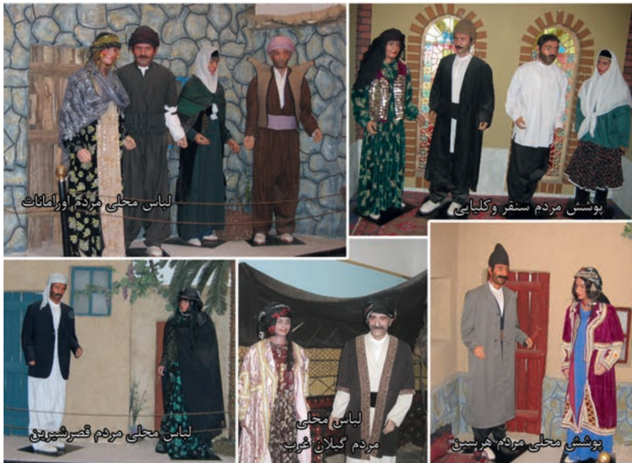
شکل ۲-۳- لباس های محلی مردم استان کرمانشاه (موزه مردم شناسی واقع در تکیه معاون الملک)