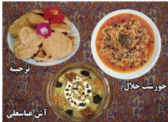
شکل ۳-۳- برخی از غذاهای محلی استان کرمانشاه

بیشتر غذاهای رایج در استان همان هایی هستند که در اکثر نقاط کشور رواج دارند ولی برخی از خوراک ها و شیرینی ها نیز ویژه این استان بوده و از تنوع و شهرت خاصی برخوردار است. از جمله می توان به موارد زیر اشاره کرد : برخی از غذاهای محلی استان کرمانشاه شامل : دنده کباب، خورش خلال، پلو کشمش، دانه کولانه، بورانی کنگر، پلو شویت، قورمه، هلیسه، آش غوره، بُورانی چغندر، آش ترخینه، آش عدس، دلمه، خورش کدو حلوایی و شیرینی ها شامل : نان برنجی، نان خرمايي، کاک، پُری (پرساق) و حلوا است. در بین انواع شیرینی ها نان برنجی و کاک و نان خرمایی از شیرینی های مشهوری است که در سطح کشور به عنوان سوغات استان کرمانشاه شناخته شده اند؛ چنانکه روغن حیوانی کرمانشاه نیز در تمام کشور جایگاه ویژه ای دارد.