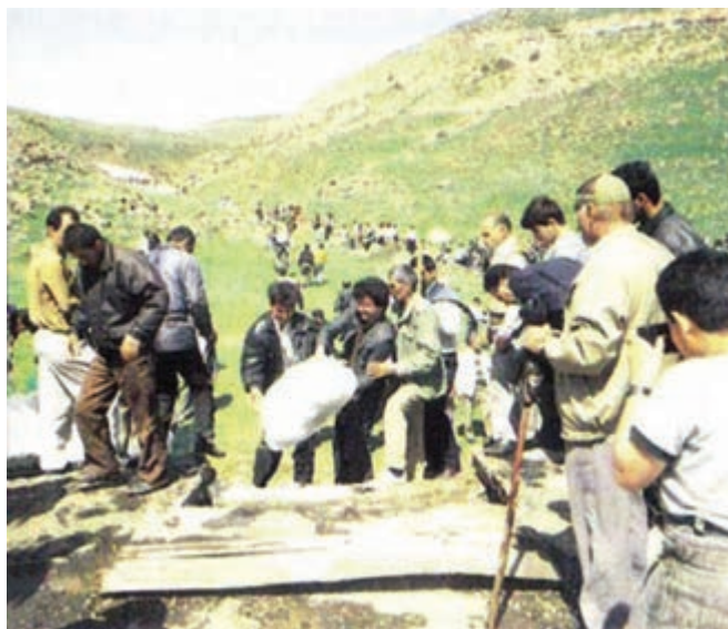
شکل ۱۱-۳- مراسم ورف چال

۴- مراسم ورف چال (چاه برف): یکی از مراسم قابل توجه در ارتباط با آب در روستای اسک واقع در جاده هراز مراسم ورف چال است. این مراسم در یکی از روزهای جمعه در فاصله اول تا پانزده اردیبهشت ماه همزمان با ذوب آخرین برف‌های زمستانی برگزار می‌شود.