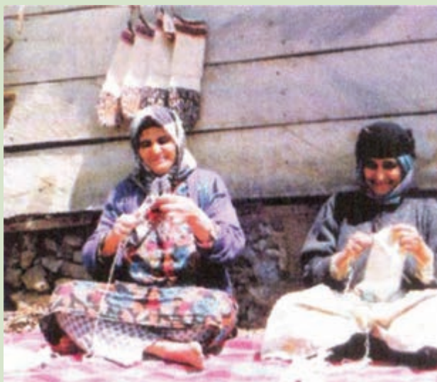
شکل ۴-۳- زنان روستا در حال بافت جوراب پشمی