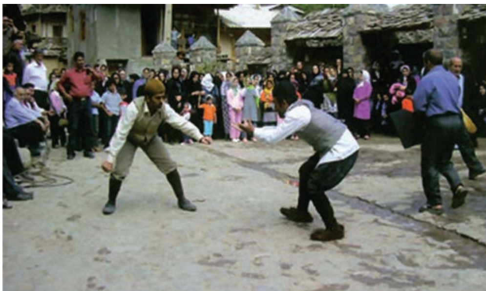
شکل ۱-۳- جشن تیرگان

ساده‌ترین تعریف از فرهنگ عبارت است از روش زندگی که انسان‌ها برای برآوردن نیازهای اجتماعی خود برمی‌گزینند. مردمانی که دارای زبان و آداب و سنن مشترک هستند و در یک محدوده جغرافیایی زندگی می‌نمایند یک گروه فرهنگی واحد را تشکیل می‌دهند.