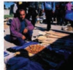
شکل ۹-۳- نمایی از بازارهای محلی در مازندران