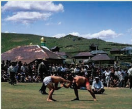
شکل ۲-۳- کشتی لوچو

دختران و پسران در سنین مختلف به انواع بازی‌های محلی می‌پردازند. برخی از این بازی‌ها شناخته شده‌ترند. تپ‌چو، تپله بازی، پرپر- کلاغ پر، هفت سنگ کا، چش بپته کا، لپ کا، آقوز کا. این بازی‌ها، سرگرمی سنتی اهالی مازندران، به‌خصوص مردم دهات و بیلاق این منطقه بوده است و تا حدود ۵۰ سال پیش، رایج‌ترین سرگرمی‌ها به حساب می‌آمده که در ایام بیکاری در ایوان خانه‌ها، منزلگاه‌های رمه‌ها و یا در مجالس