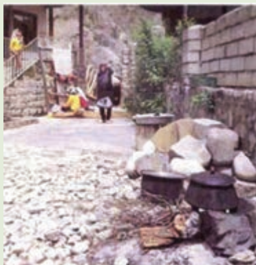
شکل ۸-۳- تصویری از بخت و پز سنتی