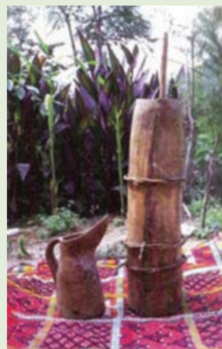
شکل ۷-۳- تلم، وسیله‌ای برای گرفتن دوغ و کره از ماست