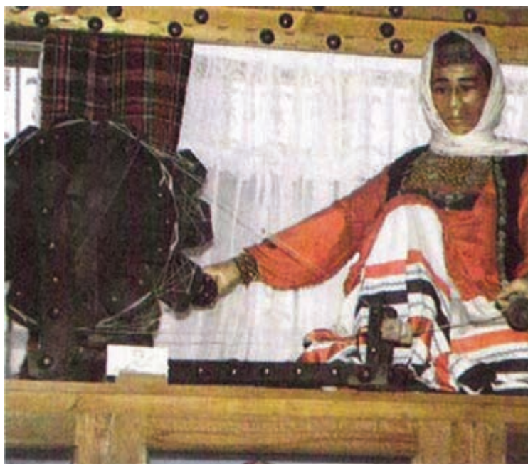
شکل ۳-۳- پوشاک سنتی زنان مازندران

نوع و چگونگی پوشش هر جامعه‌ای از ویژگی‌های خاص فرهنگی آن جامعه محسوب می‌شود. در مازندران هم به تناسب مناطق جغرافیایی و تنوع فرهنگی در هر منطقه انواعی از پوشش وجود داشت.