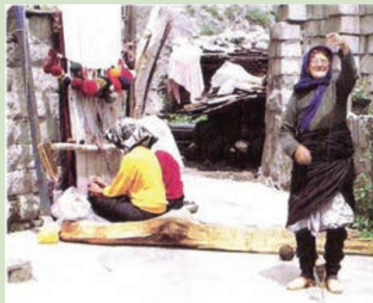
شکل ۳-۵- بافندگی در روستاهای مازندران