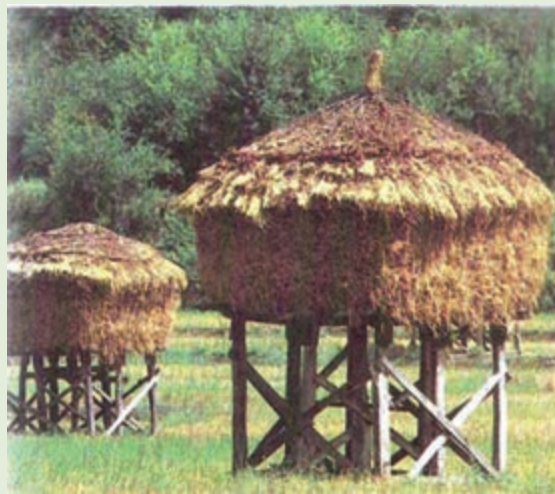
شکل ۱۲-۳- کوبا، انبار شالی در مزرعه نوعی همکاری میان سویه (همیاری)

و یاری‌گری به‌طور عمیق در بین مردم آن وجود داشته است. این نوع همکاری بیشتر در آماده کردن زمین‌های کشاورزی برای کاشت گندم، برنج و سایر اقلام کشاورزی، در آماده کردن رودها و جوی‌ها برای آبرسانی به کشتزارها مانند لایروبی، جوی‌روبی، ساختن سد و آب‌بندها اجرای بسیاری از مراسمات خاص مذهبی مانند مراسم ماه محرم، ازدواج و عروسی، سوگواری و عزاداری مشاهده می‌شد. در همه‌جا این نوع همکاری دارای اسم خاصی بوده است که در مازندران بیشتر به نام کایر یا قرضی شناخته شده است. تصویر زیر نمونه‌ای از کاری را که با همکاری هم انجام می‌دهند، نشان داده می‌شود.