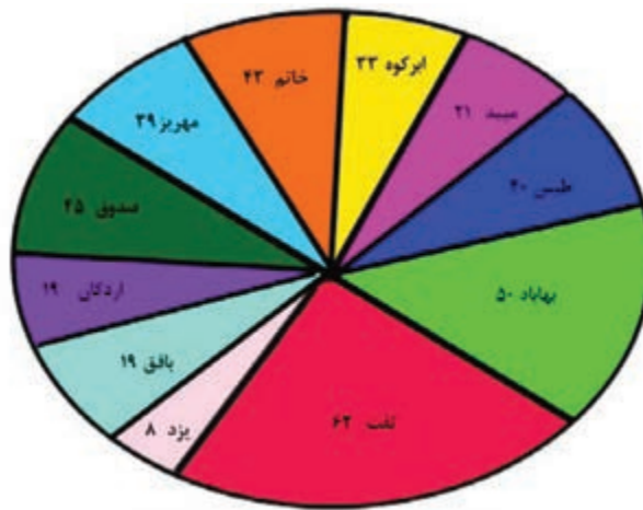
نمودار ۱-۲- جمعیت روستایی شهرستان های استان به درصد، سال ۱۳۸۵