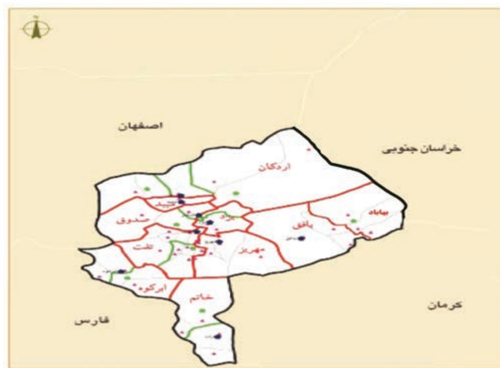
شکل ۴-۲- نقشه پراکندگی شهرها و روستاهای استان

هنری دارای شهرت جهانی بوده و هنوز هم به طور نسبی از کیفیت خوبی برخوردار است. شهر یزد دارای صنایع مدرن و پیشرفته، بیمارستان‌های مجهز و متعدد و نیروی انسانی متعهد و متخصص، دارای سرمایه‌های مادی و معنوی است که ضمن حفظ سنت گذشته این شهر را آباد و توانمند در مسیر توسعه، حفظ می‌کند.