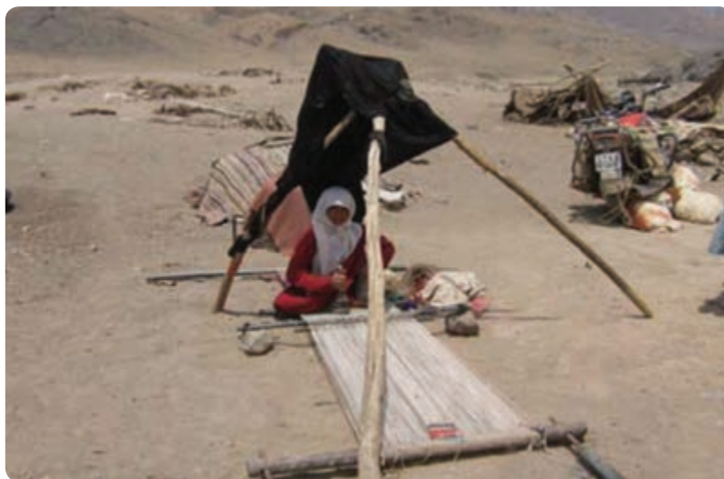
شکل ۶-۲- زندگی عشایری در استان

ج) زندگی کوچ نشینی : در استان یزد زندگی کوچ نشینی محدودی در مناطقی از جنوب استان مانند شهرستان خاتم و دیده می‌شود. کوچ نشین‌های شهرستان خاتم از استان فارس در بعضی از فصول سال، به این منطقه کوچ می‌کنند.