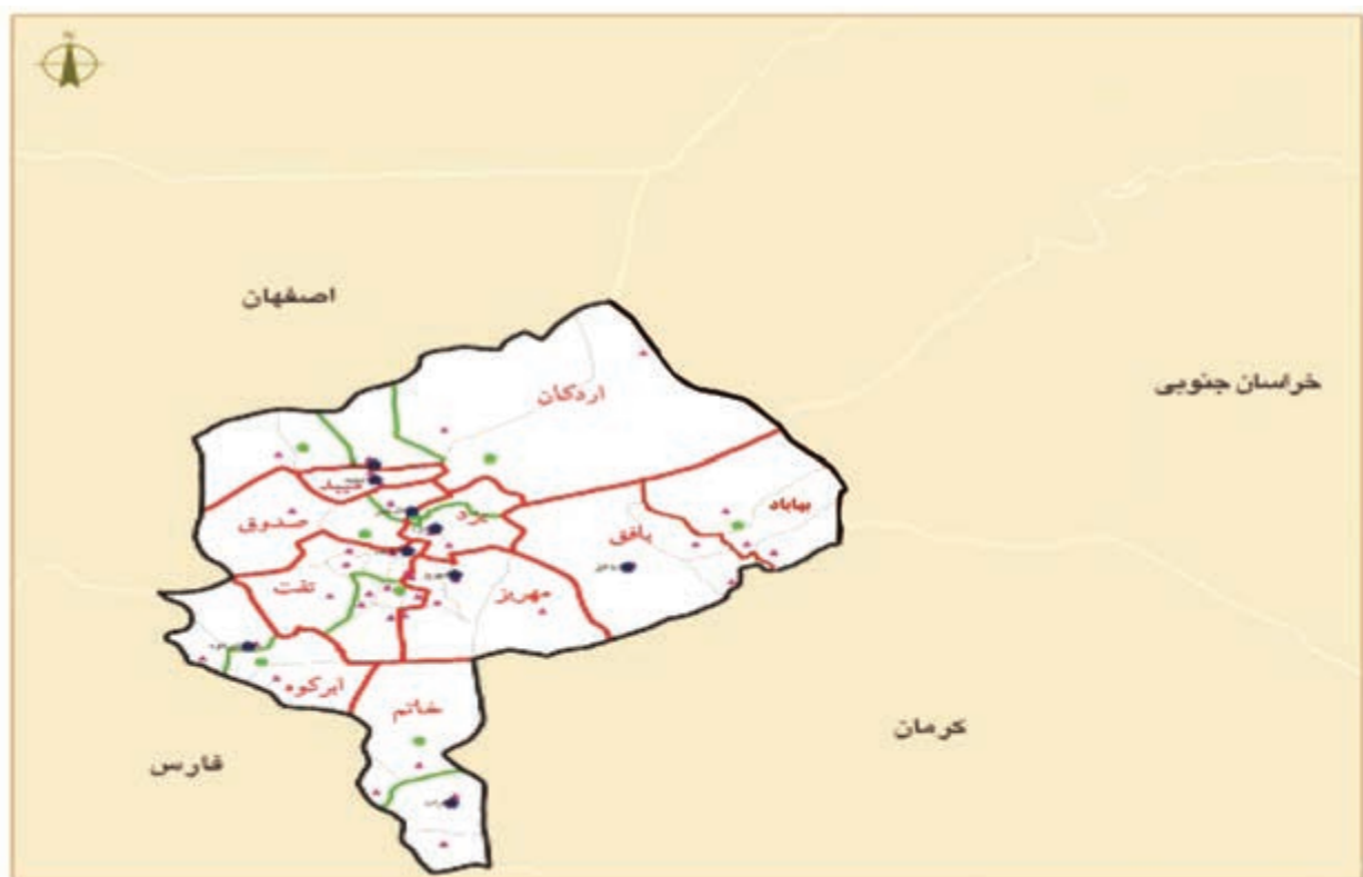
شکل ۱-۲- نقشه تقسیمات سیاسی استان

در اولین دوره قانون گذاری در سال ۱۲۸۵ هجری شمسی پس از نهضت مشروطیت قانون تشکیل ایالات و ولایات به تصویب رسید. در این دوره ایران به چهار ایالت و ۱۲ ولایت تقسیم شد که یزد یکی از ولایات بوده است. در تقسیمات کشوری سال ۱۳۱۶ هجری شمسی ایران به ۱۰ استان تقسیم شد که اصفهان و یزد شامل استان دهم بودند. در سال ۱۳۴۸ یزد به فرمانداری کل و در سال ۱۳۵۲ به استان تبدیل شد. با توجه به شکل ۱-۲ استان یزد در حال حاضر دارای ۱۰ شهرستان، ۲۰ شهر، ۱۸ بخش و ۴۵ دهستان می باشد.