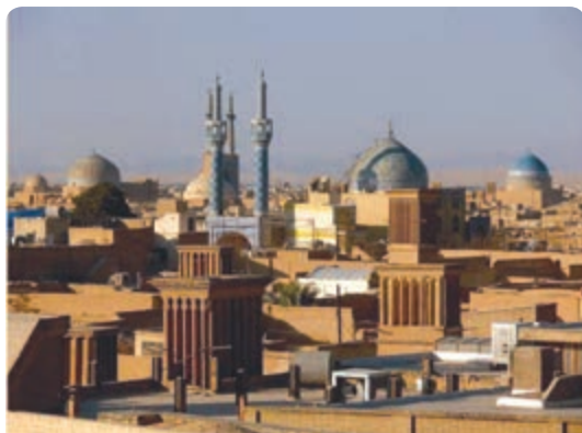
شکل ۲-۳- زندگی شهری

شیوه زندگی مردم هر منطقه تا حدودی تابع شرایط آب و هوایی است و اثر آن را در شهرسازی و معماری می‌توان یافت. قدمت تمدن و آبادی نشینی در این سرزمین از هزاره سوم پیش از میلاد فراتر می‌رود. در کشور ما ایران مردم به سه شیوه شهری - روستایی و کوچ‌نشینی زندگی می‌کنند. در این درس با شیوه‌های زندگی در استان یزد آشنا می‌شوید.