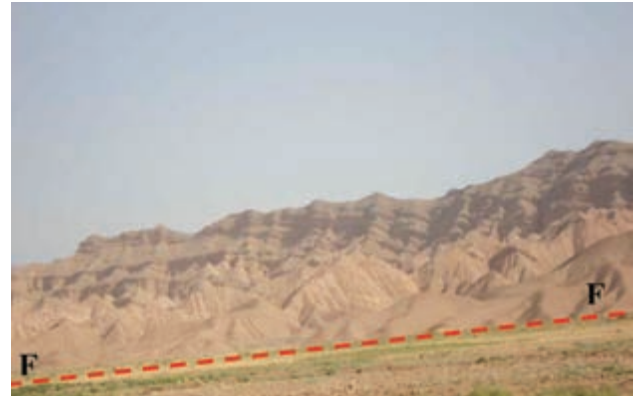
شکل ۶۲-۱ گسل امین آباد از گسل‌های فعال استان

سیل: بعد از زلزله، سیل مخرب‌ترین خطر طبیعی استان به حساب می‌آید. خراسان شمالی از نظر وقوع سیلاب در بین استان‌های کشور جایگاه دوم را دارد.