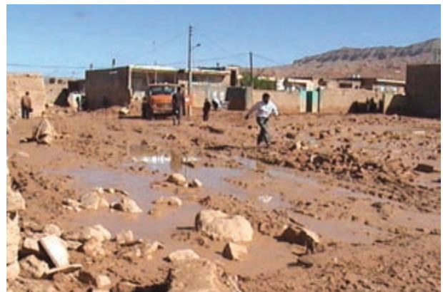
شکل ۶۴-۱ ورود سیلاب‌ها به مناطق مسکونی روستای فرتان اسفراین