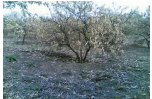
شکل ۶۹-۱ آوار سرمازدگی در باغات استان