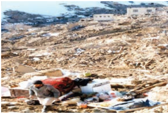
شکل ۶۰- روستای ناوه پس از زلزله

زلزله : زلزله مخرب‌ترین پدیده طبیعی است که همه ساله خسارت‌های جانی و مالی زیادی به انسان‌ها وارد می‌کند. خراسان شمالی از استان‌های زلزله خیز کشور است. به علت فراوانی و طول زیاد گسل‌ها و جوان بودن چین‌خوردگی‌ها در استان، تاکنون زلزله‌های بسیاری در این استان به وقوع پیوسته است. از مخرب‌ترین آنها می‌توان به زمین لرزه‌های سال ۱۳۵۲ دهنّه اجاق در شهرستان اسفراین و زلزله ۱۹ بهمن سال ۱۳۷۵ روستای ناوه در شهرستان بجنورد اشاره نمود. هر چند، زلزله‌ها، سبب تخریب ساختمان‌ها می‌شوند ولی رعایت نکات ایمنی در ساختمان سازی می‌تواند تا حدودی از خسارات آن بکاهد. تأثیر این نکته را در مقایسه شکل‌های (۱-۵۹) و (۱-۶۰) می‌توانید به خوبی مشاهده کنید.