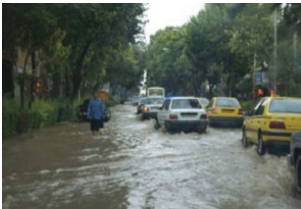
شکل ۶۵-۱ آب‌گرفتگی خیابان‌های شهر بجنورد در سیلاب سال ۱۳۸۷

علل وقوع سیلاب در استان منشأ طبیعی و انسانی دارد. از مهم‌ترین دلایل طبیعی آن می‌توان به ذوب ناگهانی برف و یخ در کوهستان‌ها، بارش‌های رگباری، کم شدن پوشش گیاهی و شیب زمین و از مهم‌ترین عوامل انسانی می‌توان به عدم اعمال مدیریت صحیح در حوضه‌های آبخیز، برداشت غیر اصولی مصالح رودخانه‌ای، تجاوز به حریم رودخانه‌ها، توسعه شهرها و روستاها در عرصه‌های سیل‌گیر اشاره نمود.