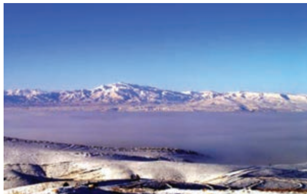
شکل ۷۱-۱ پدیده وارونگی دما در دشت بجنورد

جغرافیایی و محصور شدن برخی از شهرهای استان در میان کوه‌ها و پدیده وارونگی دما، باعث آلودگی هوای استان شده‌اند. در حال حاضر بیش از ۳۰۰ واحد صنعتی در استان مشغول فعالیت هستند. فعالیت این واحدها و شرایط طبیعی برخی از شهرهای استان سبب شده است این شهرها با مشکل آلودگی هوا مواجه شوند.