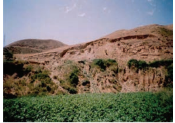
شکل ۶۷-۱ لغزش چرخشی در روستای اترآباد علیای بجنورد

سرمازدگی: به علت قرارگیری استان در مسیر اصلی ورود توده هوای سرد و خشک سیبری، در بعضی از سال‌ها، تشدید فعالیت زیانه این توده هوا در اوایل پاییز (سرمازدگی زودرس) و اوایل بهار (سرمازدگی دیررس)، سبب سرمازدگی ناگهانی محصولات باغی و زراعی شده و خسارات زیادی را به کشاورزان استان وارد می‌کند.