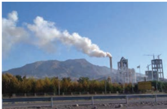
شکل ۷۰-۱ صنایع استان یکی از منابع آلودگی هوا

مسئولیت نظارت بر آلودگی هوا در استان بر عهده سازمان محیط زیست است. این سازمان جهت کاهش آلودگی هوا اقداماتی انجام داده است که از مهم‌ترین آنها می‌توان به موارد زیر اشاره نمود :