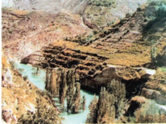
شکل ۶۸-۱ زمین لغزش در روستای اسطرخی شیروان