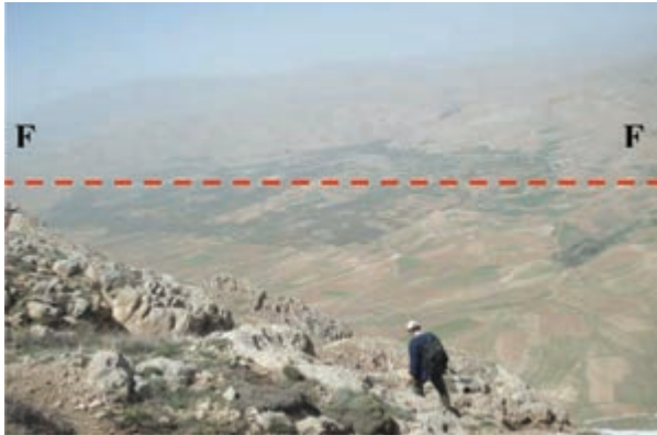
شکل ۶۳-۱ گسل سالوک از گسل‌های فعال استان

آخرین فعالیت گسل‌های استان مربوط به گسل امین آباد، در شمال غرب شهر اسفراین است که منجر به زمین لرزه‌ای با قدرت ۴/۵ درجه در مقیاس ریشتر شد. این زمین لرزه در نیمه شب جمعه ۱۸ آذرماه ۱۳۹۰ بر اثر فعال شدن قسمت شمال غربی این گسل رخ داد. این زلزله خسارات مالی و جانی نداشت ولی سبب ترس و وحشت مردم شد.