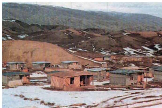
شکل ۶۱- بازسازی روستای زده توب چنار شهرستان مانه و سملقان با استفاده از اسکلت زوگالی (چوبی)