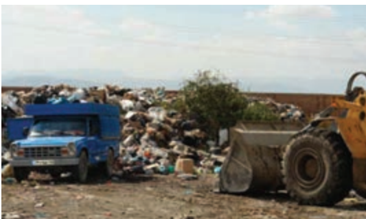
شکل ۷۳-۱- شیوه‌های نامناسب جمع‌آوری، انتقال و دفن زباله در استان