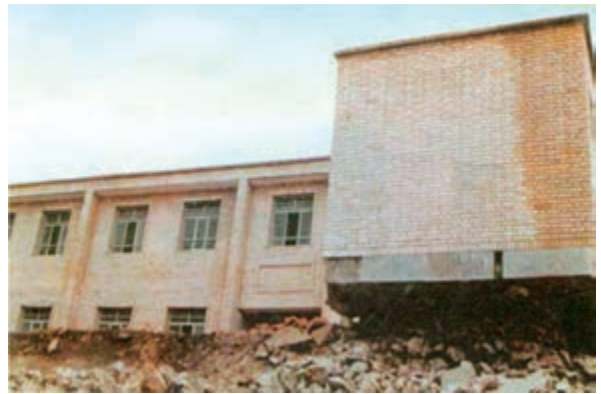
شکل ۵۹- ساختمان دبستان روستای ناوه پس از زلزله