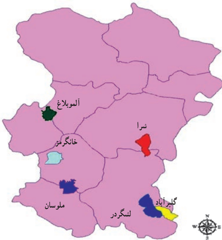
شکل ۱-۷۰- نقشه مناطق حفاظت شده استان

استان ما در حال حاضر، دارای ۶ منطقه مهم حفاظت شده است که عبارت‌اند از: گلپرایاد، خان‌گرمز، لشگردر، شرا، آلموبلاغ، ملوسان و دو منطقه شکار ممنوع شیرین‌سو و و آق‌گل. (نقشه ۱-۷۰)