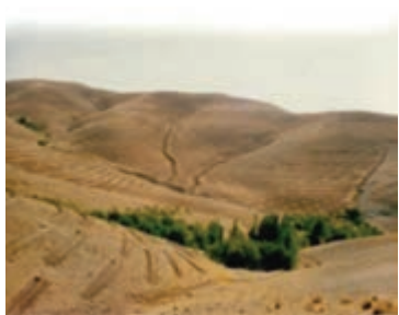
شکل ۱-۶۶- احداث بانکت بندی