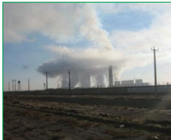
شکل ۷۸-۱ آلودگی هوا - صنایع