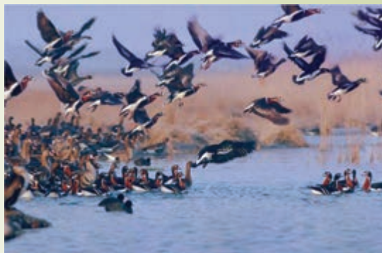
شکل ۷۵-۱- منطقه شکار ممنوع - شیرین سو

منطقه شکار ممنوع: منطقه شکار ممنوع نیز همچون مناطق حفاظت شده دارای شرایط مناسب جهت حفظ و تکثیر گونه‌های مختلف گیاهی و جانوری‌اند و با نظارت سازمان حفاظت محیط زیست دارای ممنوعیت شکار و صید، قطع درختان و آسیب رساندن به محیط است.