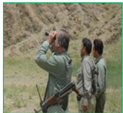
شکل ۱-۷۲- محیط‌بانان سازمان حفاظت از محیط زیست

پژوهش کنید! بررسی کنید که در سال‌های اخیر کدام یک از گونه‌های گیاهی و جانوری محل زندگی شما از بین رفته است؟ نتیجه را به کلاس ارائه دهید.