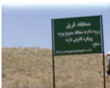
شکل ۱-۶۸- حفاظت و قرق مراتع