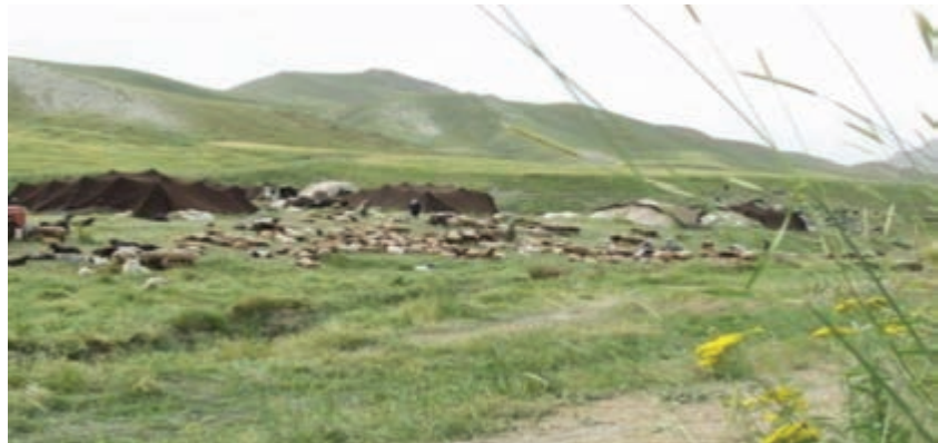
شکل ۵۷-۱ تغذیه دام عشایر