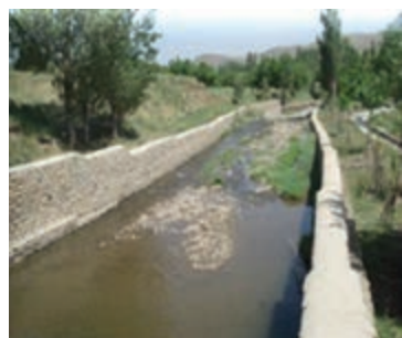
شکل ۱-۶۴- دیوار حاشیه رودخانه