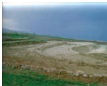
شکل ۱-۶۵- تراس بندی