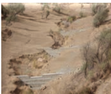
شکل ۱-۶۳- بند گابیونی (سنگ‌ها در تور سیمی)