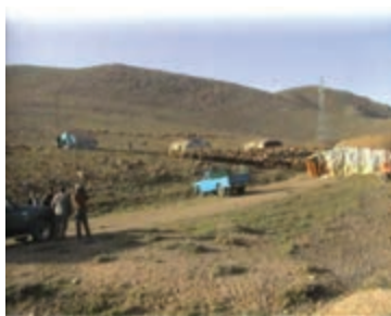
شکل ۱-۶۷- مدیریت و نظارت بر چرا