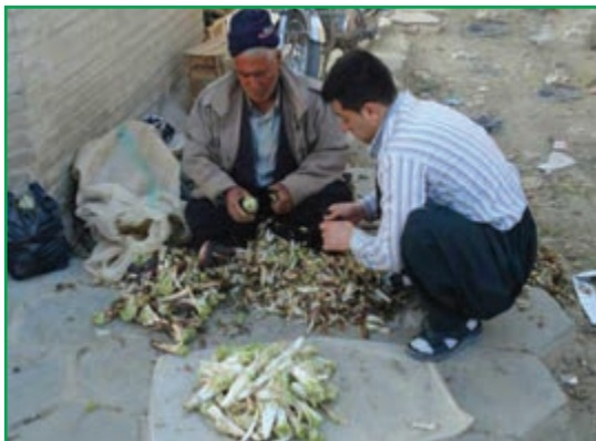
شکل ۵۸-۱ برداشت کنگر از مراتع