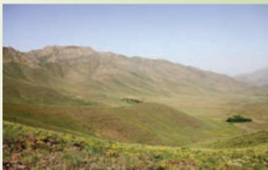
شکل ۷۴-۱- منطقه حفاظت شده لشگردر - ملایر

منطقه حفاظت شده لشگردر: این منطقه در جنوب شرقی شهر ملایر و در ۹۰ کیلومتری شهر همدان در محاصره ۱۴ روستای مجاور از جمله جوزان، مانیزان، فروز، ازناوله، زنگنه و احمد روغنی است و به لحاظ طبیعت مساعد از نظر آب، پوشش گیاهی و شرایط اقلیمی، همواره زیستگاه مناسبی برای جانوران و پرندگان است.