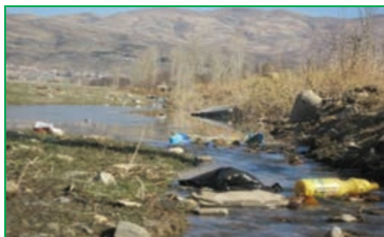
شکل ۸۱-۱- فاضلاب‌های شهری در بستر رودخانه‌ها

و به چرخه آب برمی گردند که باعث آلودگی آب و خاک می شوند. در اثر فعالیت های تولیدی و صنعتی در کارخانجات و واحدهای صنعتی استان نیز فاضلاب صنعتی تولید می شوند و در نتیجه مقدار قابل توجهی از مواد شیمیایی خطرناک را وارد آب های سطحی و زیرزمینی می کنند.