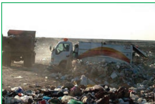
شکل ۸۳-۱- دفع غیربهداشتی زباله ها