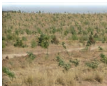
شکل ۱-۶۱- نهال کاری