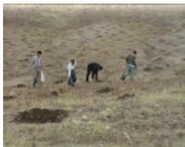
شکل ۱-۶۲- کپه کاری