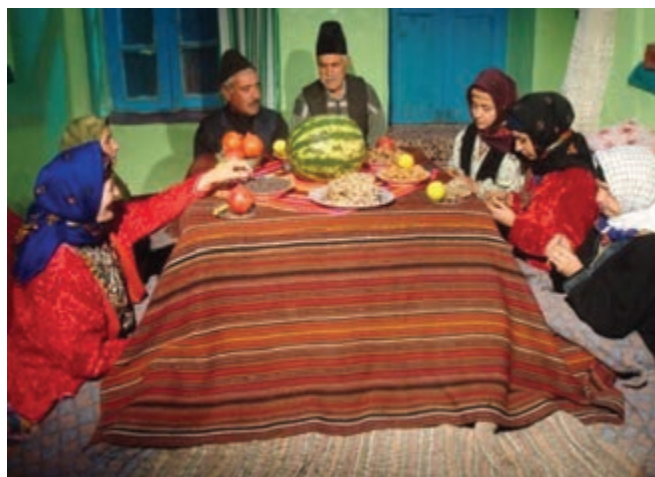
شکل ۳-۳- نمونه ای از مراسم شب چله در روستا

یلدا به عنوان طولانی ترین شب سال که به چله نیز معروف است، در استان زنجان هم مانند سایر استان ها از حال و هوای ویژه ای برخوردار است. به طوری که اهالی استان، برای پذیرایی و برگزاری مراسم خاص آن با خرید آجیل، هندوانه، و میوه های مختلف و شیرینی به استقبال این شب طولانی می روند. همچنین خانواده داماد برای عروس، با تهیه هدایایی همراه با خوراکی های این شب که در مجموعه ای به نام «خونچا» گردآوری کرده اند به دیدار خانواده عروس می روند. در این شب بزرگترها با شاهنامه خوانی و قصه های شیرین ایرانی اعضای خانواده را سرگرم کرده و این شب را گرمی می دارند.