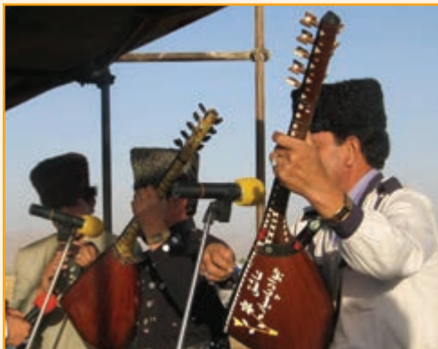
شکل ۵-۳- موسیقی محلی استان

موسیقی بومی استان زنجان از گنجینه موسیقی فولکلوریک و کلاسیک آذری تأثیر پذیرفته است و در حال حاضر نیز وجه غالب ترکیب موسیقی بومی، به‌ویژه مناطق روستایی استان را تشکیل می‌دهد. پیوستگی فرهنگی و قومی مردم استان با مردم آذری زبان از یک‌سو و ارتباط آن با منطقه‌هایی، غیر از زبان آذری از سوی دیگر، زمینه شکل‌گیری نوعی از موسیقی محلی ویژه را فراهم آورده است، که به موسیقی زنجانی معروف