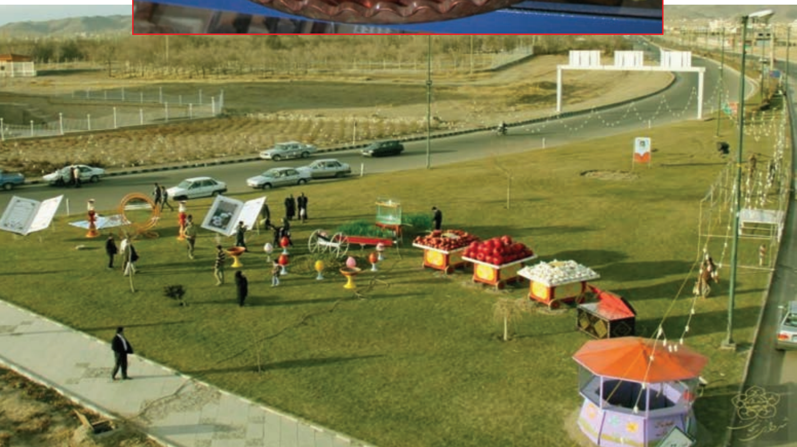
شکل ۱-۳ سفره هفت سین همراه با صنایع دستی بومی استان