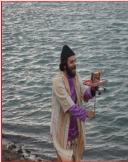
شکل ۲-۳- نمایش تکم گردانی