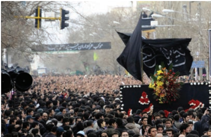
شکل ۳-۶- مراسم عزاداری حسینیه اعظم زنجان

شبییه‌خوانی یا تعزیه: نوع دیگری از عزاداری‌های رایج در استان است که مردم استان در شهرها و خصوصاً در اکثر روستاها با اجرای آن به عزاداری ائمه اطهار علیهم السلام می‌پردازند. شهر ارمغان‌خانه در اجرای تعزیه در استان شهرت خاصی دارد.