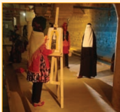
شکل ۴-۳- نمونه‌ای از لباس‌های محلی استان