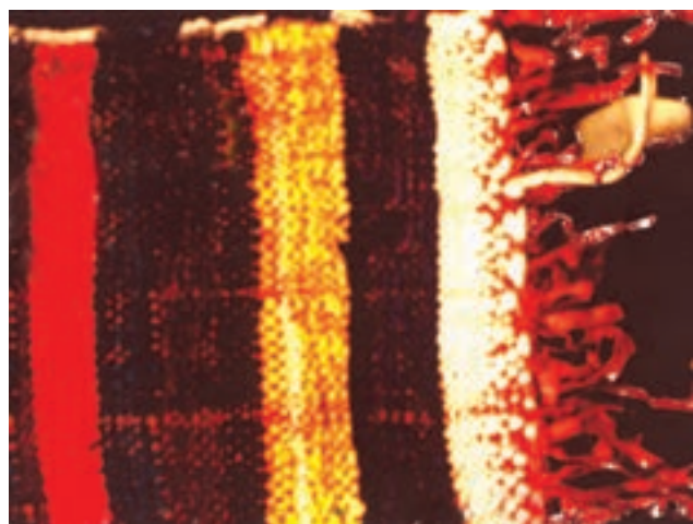
تصویر ۲-۴ - زیلوی میبد

زیلو: زیلو دست‌بافته‌ای است که با استفاده از تار و پود پنبه‌ای بر دارهای عمودی تولید می‌گردد. بافت این زیرانداز تابستانی در روستاها متداول است. زیلو نسبت به سایر دست‌بافته‌ها ضخیم و زمخت می‌باشد. این دست‌بافته دو رویه است و نقش یک طرف آن با طرف دیگر تفاوت دارد. پلاس ۱ : در بافت پلاس نیز، مانند بافت زیلو، از تار و پود پنبه‌ای استفاده می‌شود. با این تفاوت که در بافت پلاس از نخ‌های پنبه‌ای نامرغوب و پست استفاده می‌شود. پلاس بافته‌ای دو رویه، معمولاً بدون نقش و ضخیم و درشت می‌باشد.