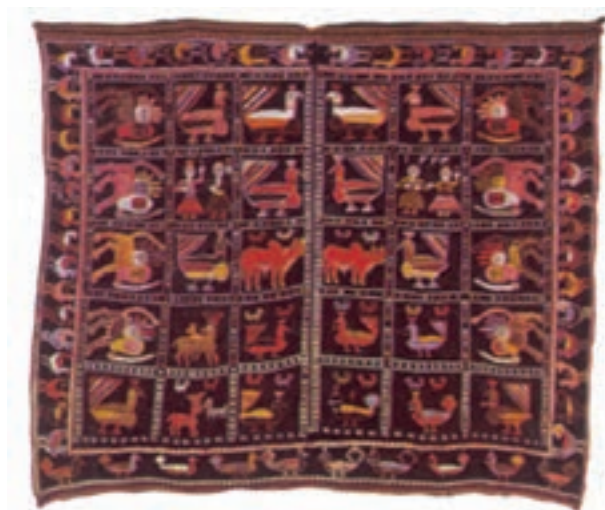
تصویر ۱۶-۲- قلیان‌دان جهت حمل و نگهداری قلیان استفاده می‌گردد.