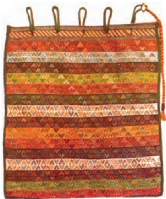
تصویر ۱۱-۲- جوال جهت حمل بار مورد استفاده قرار می گیرد. جوال سوزنی قشقایی

جوال - خورجین - چنته: دست بافت ها در میان ایلات و عشایر جنبه ی کاربردی دارد و آن ها هیچ گاه به صرف ترین به تولید این بافته ها اقدام نمی کنند از این رو با به کارگیری انواع روش های بافتی که در بافت گلیم ساده، سوزنی، جاجیم و... به کار می رود یا ترکیب بعضی از روش ها با یکدیگر وسایل دیگری چون جوال، خورجین، چنته و... نیز می بافند که متناسب با اندازه ی هر یک جهت حمل اشیاء بر پشت حیوان یا بر دوش انسان مورد استفاده قرار می گیرد (تصاویر ۱۱ و ۱۲ و ۱۳).