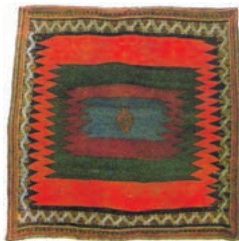
تصویر ۱۸-۲- بافته‌ای از ایلات و عشایر کرمان جهت سفره و یاروکسی