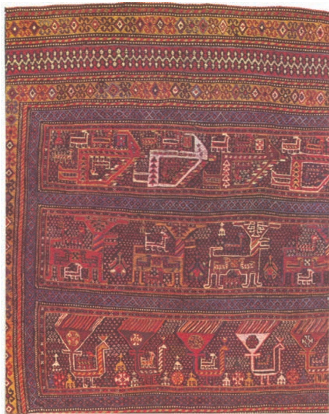
تصویر ۸-۲ سوزنی، از دست بافت‌های ایل قشقایی

سوزنی: بافت سوزنی در میان ایلات و عشایر فارس متداول است. این دست بافته نیز با پیچش نخ‌های پود به دور تارها شکل می‌پذیرد و یک‌رویه است و در پشت آن نیز نخ‌های پود آویزان هستند. در بافت سوزنی، برخلاف نام آن، از سوزن استفاده نمی‌شود بافت سوزنی به صورت قطعات کوچک متداول است (تصویر ۸).