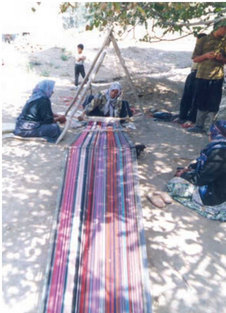
تصویر ۱-۲- بافت جاجیم در ایلات شاهسون (آذربایجان)

جاجیم: بافت جاجیم در میان ایلات و عشایر ترکمن، کردستان، آذربایجان و فارس و نیز روستاها بر روی دستگاه های ساده ای که بر سطح