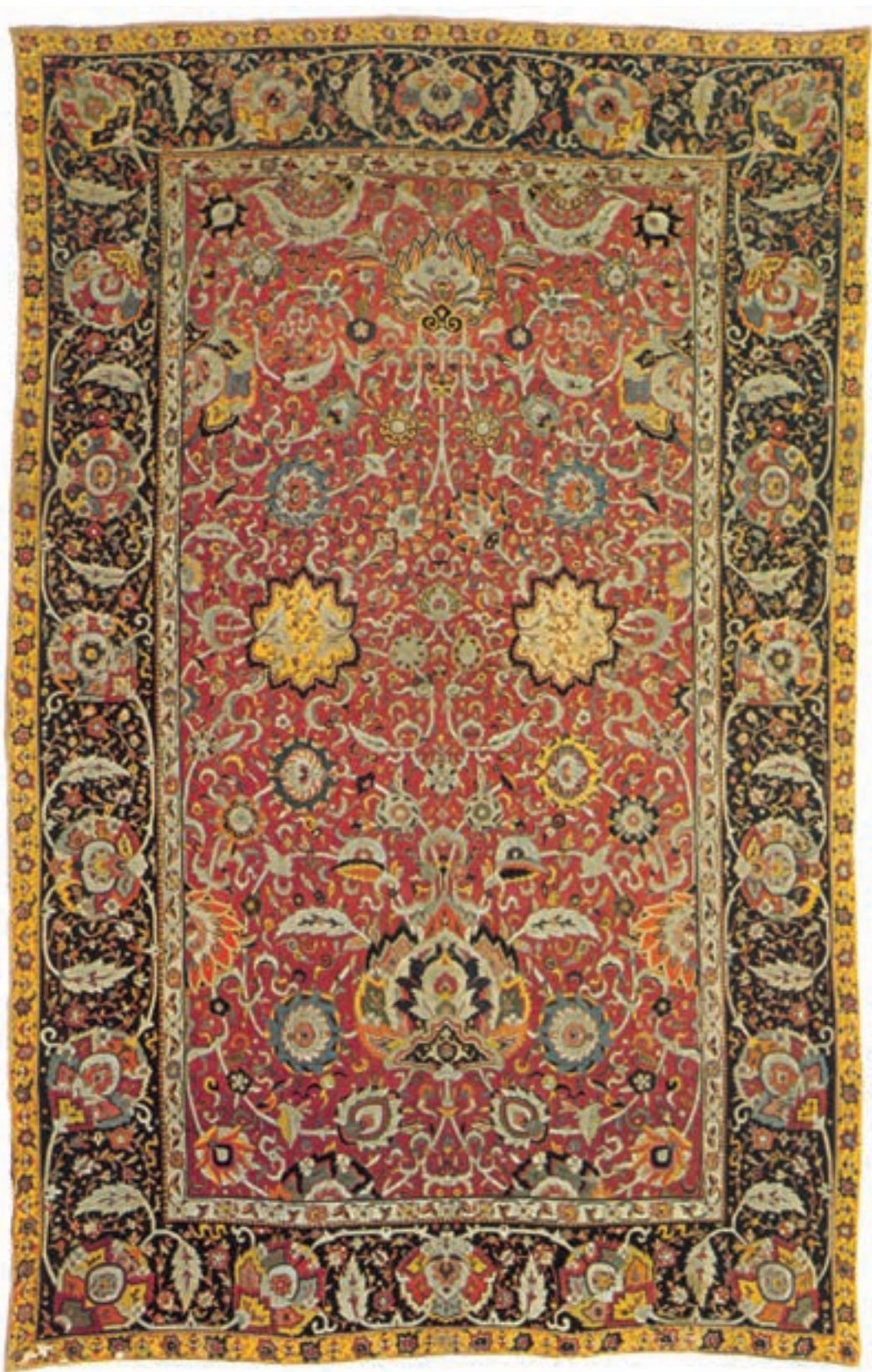
تصویر ۱۵-۱ این قالی به دستور شاه عباس (۹۷۰ هجری) صفوی جهت هدیه به حرم امام رضا (ع) بافته شده است. در بافت این قالی علاوه بر ابریشم از نقره نیز استفاده شده است. ابعاد قالی عبارت است از ۳۵۴ × ۵۶۰ سانتی متر که هم اکنون در موزه‌ی آستان قدس رضوی نگهداری می‌شود.