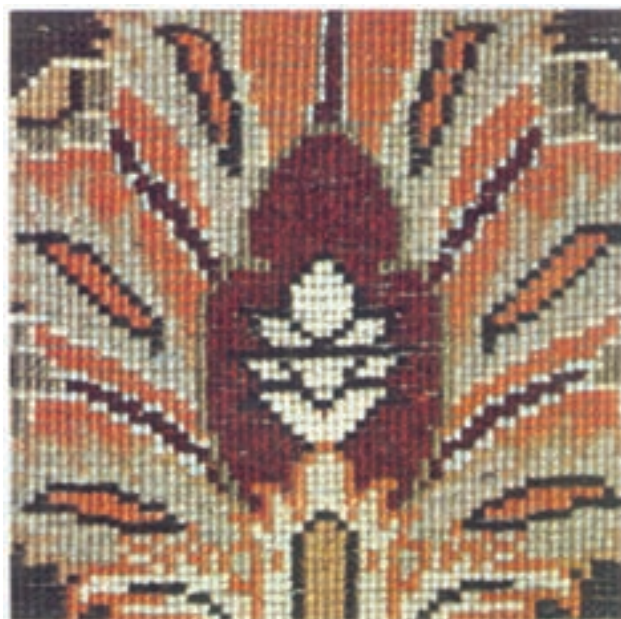
تصویر ۱۲-۱- این تصویر از پشت فرش و در مساحت یک دسی مترمربع از اندازه‌ی اصلی گرفته شده است. منظور از آن نشان دادن تعداد گره و رج‌شمار و حدود مرغوبیت فرش می‌باشد.

قالی پازیریک با پشم و به روش گره‌ی متقارن بافته شده است و تعداد گره‌های آن ۳۶۰۰ گره در یک دسی مترمربع می‌باشد ۱ لذا از نظر کیفیت بافت می‌تواند مورد توجه قرار گیرد (تصویر ۱۲). طرح و رنگ به کار رفته در بافت پازیریک نشانه‌ای آشکار از پیشرفت طراحی و رنگرزی در گذشته‌ی دور قالی‌بافی ایران است. از طرفی با توجه به سطح و کیفیت بافت پازیریک، کارشناسان چنین ارزیابی می‌کنند که بایستی حداقل ۱۰۰۰ سال تجربه‌ی بافتن در پشت سر بافت قالی‌پُرزداری چون قالی مذکور (پازیریک) وجود داشته باشد. چنان‌که گفتیم محل نگهداری این قالی در موزه‌ی آرمیتاژ شهر سن پترزبورگ روسیه می‌باشد.