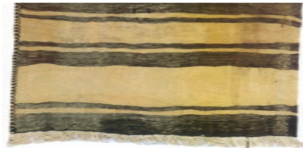
تصویر ۳-۱- گلیم بافته شده از پشم خودرنگ (بختیاری)

بافت گلیم در گستره‌ی سرزمین ایران صورت می‌گرفته است و به‌طور حتم می‌توان گفت اولین گلیم‌ها ساده و بدون نقش و نگار بوده است، اما به مرور و با تکامل بافت‌های اولیه‌ی گلیم، با