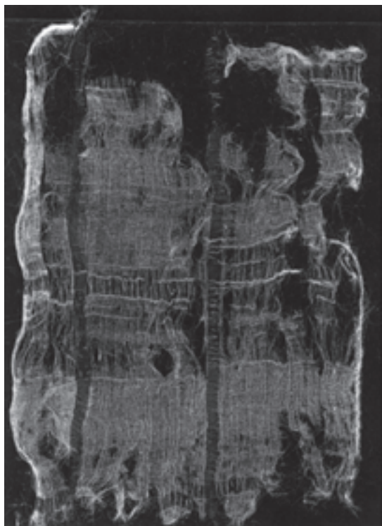
تصویر ۲-۱- قطعه پارچه‌ای ابریشمی بازمانده از قرن سوم هجری

به کارگیری پشم‌های خودرنگ (مشکی - قهوه‌ای - شکری - کرم و...) نقش و نگارهایی نیز بر گلیم جان گرفته است (تصویر ۳).