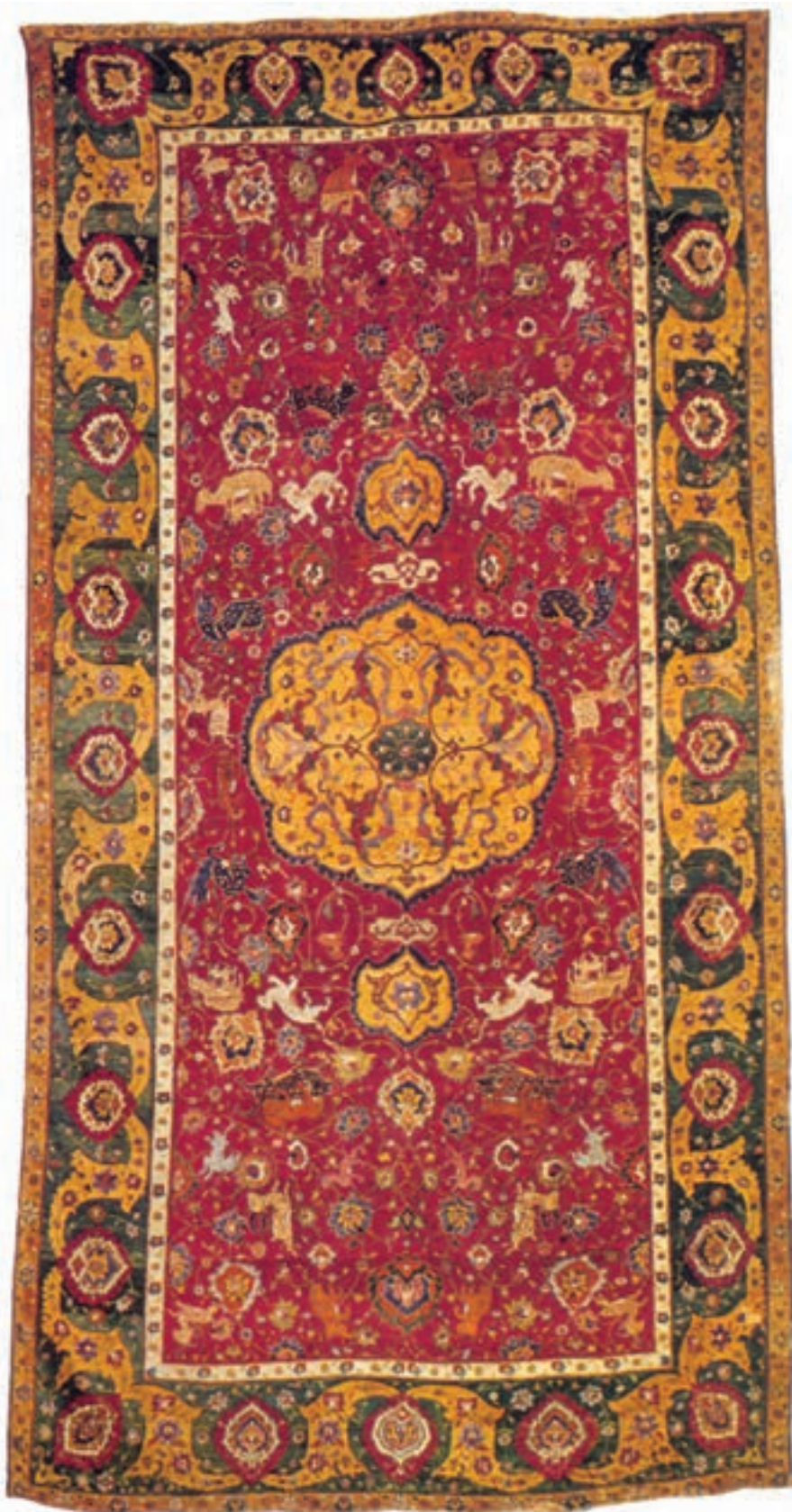
تصویر ۱۶-۱. قالی بافت اصفهان در ابعاد ۴۲۷×۲۲۹ سانتی متر که در موزهی واشنگتن امریکا نگهداری می شود. طرحی از حیوانات افسانه ای و نقوش اسلیمی و گل های عباسی در متن دیده می شود.