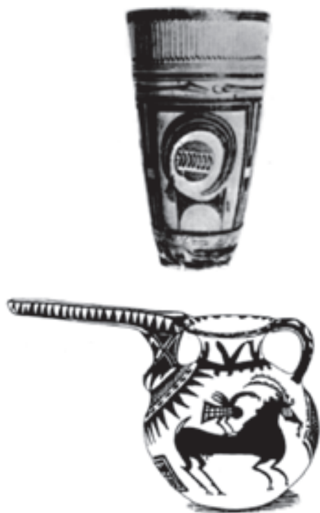
تصویر ۵-۱ نمونه‌هایی از نقش بر سفال

تا قبل از اختراع خط، انسان مفاهیم و اندیشه‌های خود را از طریق تصویر و طرح منتقل می‌کرد. تصاویر و نقوش بسیاری بر سنگ‌ها، سفالینه‌ها، فلزات و... وجود دارد که هر یک بیانگر اندیشه‌ها، اعتقادات و روابط انسان‌های دوران خود می‌باشد (تصویر ۵). هر چند امروزه انتقال پیام از طریق خط و نوشتن دارای بالاترین اهمیت است با این حال جایگاه طرح و تصاویر در انتقال پیام‌ها و دیدگاه‌های انسان امروزی هم‌چنان قابل توجه است.