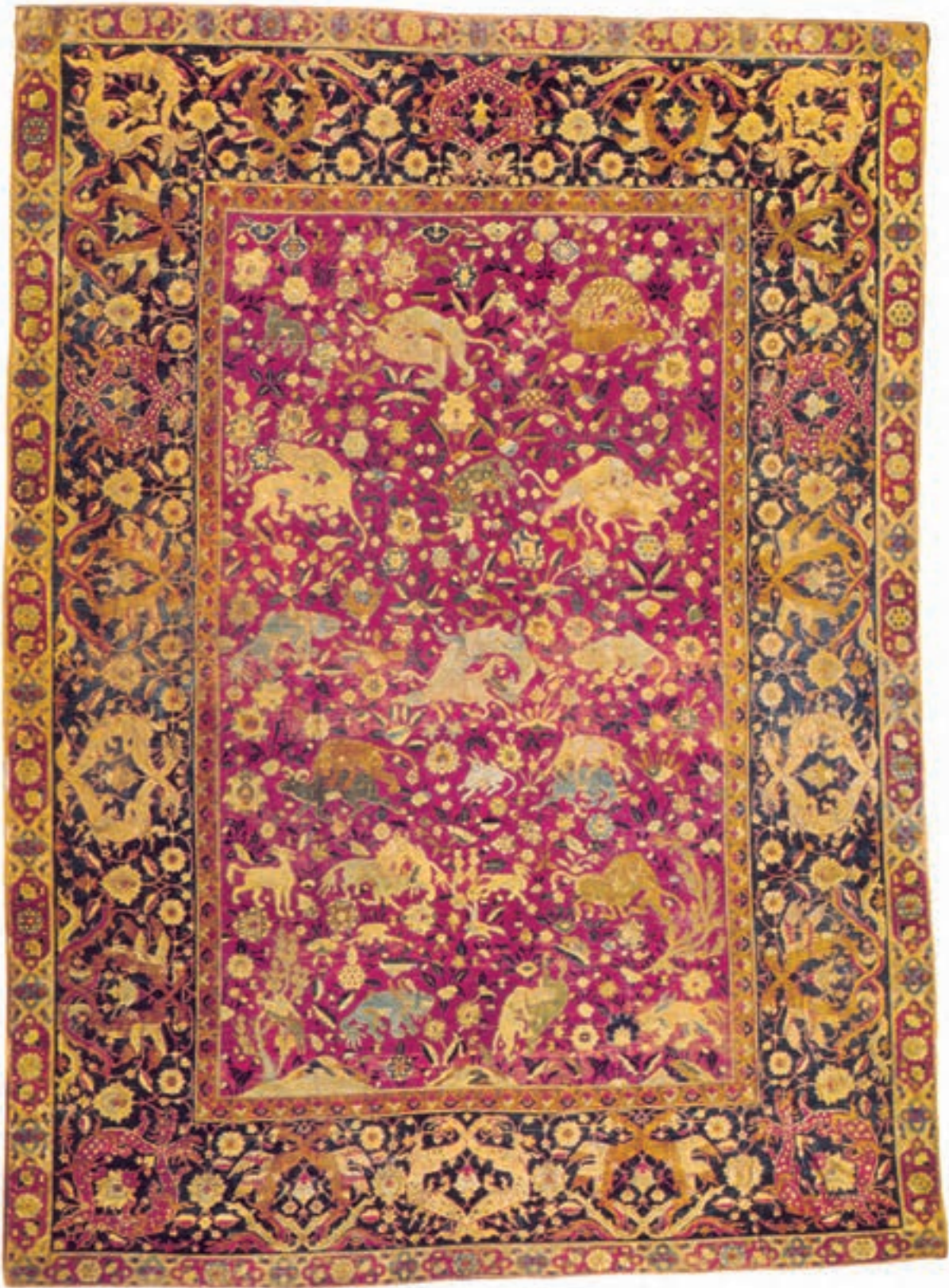
تصویر ۱۸-۱. قالی بافت اصفهان در ابعاد ۱۶۸×۲۳۳ سانتی متر که در قرن دهم هجری بافته شده است. این قالی در موزه‌ی فرش ایران نگهداری می‌شود و جفت آن در موزه‌ی لوور پاریس (فرانسه) است.