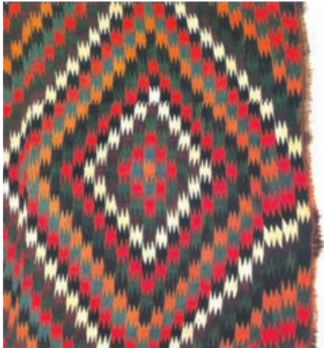
تصویر ۶-۱ بخشی از گلیم بافت ورامین

بافت گلیم بعدها به مرور ایام و با تسلط نسبت به آن پیش آمد. همان‌طور که اشاره شد بافت گلیم در بسیاری از نقاط متداول بوده است؛ با این توضیح که مشابهت‌های بسیاری در روش‌های بافت و برعکس، تفاوت‌هایی در طرح و نقش و رنگ‌بندی گلیم‌ها در مناطق مختلف وجود داشته است که هنوز هم وجود دارد (تصاویر ۶ و ۷).