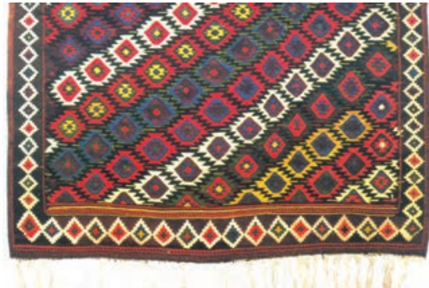
تصویر ۷-۱ بخشی از گلیم بافت گرمسار