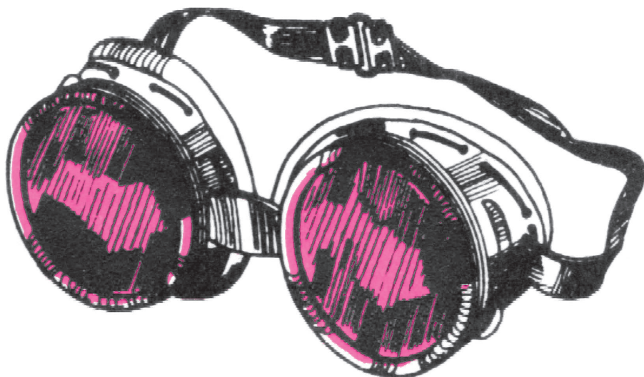
شکل ۲-۴- عینک حفاظتی

اگر اسیدهای مختلف با شتاب با آب مخلوط شوند، مخصوصاً اسید سولفوریک غلیظ، تولید حرارت زیادی می‌کنند و به جوش می‌آیند که قطرات آن‌ها، به ویژه اگر اسید سولفوریک باشد، به اطراف پاشیده می‌شود و در اثر آن ممکن است قسمت‌هایی از بدن مثل صورت و دست‌ها یا نقاط دیگر بدن مجروح گردد. اگر برحسب اتفاق اسید سولفوریک غلیظ بر روی بدن ریخته شود باید فوری آن را با آب فراوان شست‌وشو داد. توصیه می‌شود، برای جلوگیری از پاشیده شدن اسید و سایر محلول‌های خطرناک در هنگام کار از عینک‌های محافظ پلاستیکی استفاده کنید (شکل ۲-۴).