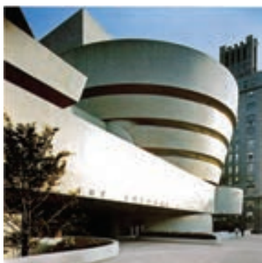
تصویر ۲- معماری مدرن، ساختمان موزه سالمون، نیویورک، سال ۱۹۵۹-۱۹۵۶

نخستین نشانه‌های یک نهضت جدید، در سال ۱۹۰۵ در نمایشگاهی به پیشگامی «هانری ماتیس» ۳ ظهور کرد. آشنایی هنرمندان با فرهنگ غیراروپایی راه‌های تازه‌ای را برای انتقال عواطف پیش پای آنها گذاشت. نقاشی‌های آنها از نظر طرح ساده و از لحاظ رنگ درخشان بود. در این نمایشگاه منتقدی آنها را «فووها» (حیوان وحشی) نامید. آنها با در کنار هم قراردادن رنگ‌های متضاد قدرت و شدت تازه‌ای به رنگ بخشیدند. نمایش کنش عاطفی هنرمند به موضوع کارش با استفاده از شدیدترین رنگ و قوی‌ترین خط، از هر شبیه‌سازی مهمتر بود (تصویر ۳).