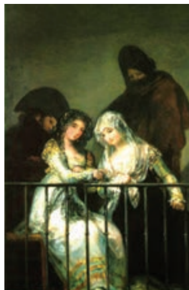
تصویر ۱۲- زنان در بالکن، اثر فرانسیسکو گویا، ۱۸۱۵-۱۸۱۰ میلادی، رنگ و روغن روی بوم، موزه هنر متروپولیتن، نیویورک

دومیه ۲ نیز با تکنیک چاپ سنگی مقدار زیادی کاریکاتورهای اجتماعی و سیاسی برای چاپ در مجلات و روزنامه‌ها ساخت (تصویر ۱۳). میله ۳ (میله) نقاشی است که تمایلات هر دو مکتب واقع‌گرایی و رمانتیک را در آثارش می‌توان دید (تصویر ۱۴).