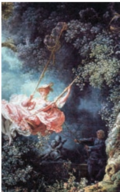
تصویر ۷- بخشی از تابلو به نام تاب، اثر فراگونار

اصطلاحی در تاریخ هنر برای توصیف هنر تزئینی در زمینه‌های مختلف، چون تزئینات معماری، نقاشی، تندیس‌سازی، طراحی ائانیه، اشیای زینتی و غیره پدید آمد. واژه روکوکو از واژه فرانسوی روکای به معنی «سنگریزه» گرفته شده است و به سنگریزه‌ها و صدف‌هایی اطلاق می‌شود که برای تزئین فضای داخل غارها و سرداب‌های مصنوعی به کار برده می‌شوند. واتو ۲ از برجسته‌ترین هنرمندان سده هجدهم میلادی سبک خاصی را آفرید که پس از او به روکوکو انجامید. نقاشی این دوره، سرشار از جلوه‌های پراحساس و حتی شاد و فریبنده با موضوع‌های دنیوی و سبکسرانه، رنگ‌های لطیف و خطوط منحنی و منطبق با سلیقه اشرافیت است. فراگونار ۳ ، که نقاشی‌های او تزئینی با رنگ‌های چشم‌نواز است از نمایندگان این سبک به‌شمار می‌رود (تصویر ۷).