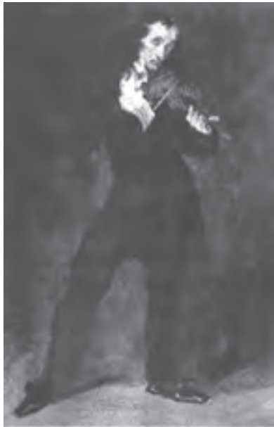
تصویر ۱۰- باگانی، انر اوژن دلاکروا، حدود ۱۸۳۲، رنگ روغن روی مقوا، ۲۸×۴۲ سانتی‌متر، مجموعه فیلیس، واشنگتن

جنبش‌های اجتماعی این عصر سبب دگرگونی در ذهن انسان اروپایی شد. در این مکتب نقاشان کارگاه نقاشی را رها کردند. آنها به طبیعت عشق می‌ورزیدند و براساس عاطفه و ذهن هنرمند رنگ‌ها را تابناک و سرزنده به تصویر می‌کشیدند. موضوعات معمولی و چهره‌های عادی را انتخاب و جایگزین تناسبات رسمی و قراردادی کردند. لازم به ذکر است که اینها همه در عصر «انقلاب صنعتی» یعنی گریز از ماشین و پناه بردن به دامان طبیعت بود. شاخص‌ترین هنرمند رمانتیک دلاکروا ۲ است که دامنه امکانات بیانی این هنر را گسترش فراوان داد. او شیوه رنگ‌پردازی و قلم‌زنی خود را به نقاشان بعدی مخصوصاً به امپرسیونیست‌ها انتقال داد. هنر نقاشی در عصر رمانتیسیسم، بیشتر موضوعات را از ادبیات الهام می‌گرفت. دلاکروا نیز داستان‌های تابلوهایش را عموماً از ادبیات و رخدادهای روزگار خود بر می‌گزید (تصویر ۱۰).