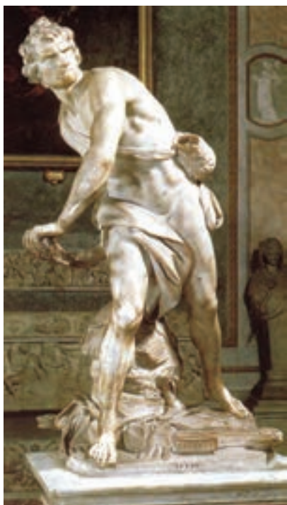
تصویر ۶- داوود در حال پرتاب سنگ به سمت جالوت، اثر برنینی، سنگ مرمر، سال ۱۶۲۳ میلادی، روم (مقایسه کنید با داوود میکلا آنژ)

تندیس‌سازی باروک نیز همانند نقاشی بسیار زنده، پرشور و چشمگیر است و بیان‌گر تلاش هنرمند در ارائه احساسات عمیق انسان است و تلاش دارد واکنش تماشاگر را برانگیزد (تصویر ۵). تندیس داوود در حال پرتاب سنگ به جالوت اثر برنینی سرشار از بیان احساس، تحرک و بویایی است (تصویر ۶).