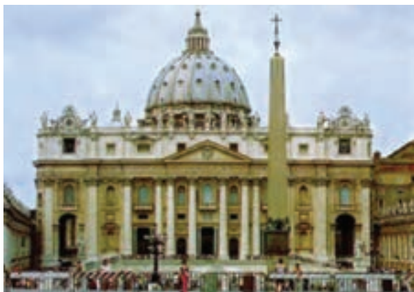
تصویر ۱- کلیسای سن‌پیر روم، نما اثر کارلو مادرنو، ستون کاری اثر برنینی، حدود ۱۶۱۲-۱۶۰۷ میلادی

معماری باروک با ساخت کلیساهای بزرگ از شهر رُم شروع شد. معماران این عصر نیز مانند دوره رنسانس هم پژوهشگر و هم در چند رشته تخصص داشتند، معماری باروک بنا به سلیقه معمار یا سفارش‌دهنده از سنت‌های مختلفی چون کلاسیک باستان، گوتیک و رنسانس در یک بنا سود می‌برد و تلاش می‌کرد بین عناصر مختلف هماهنگی ایجاد کند. در معماری باروک استفاده از شکل بیضی به جای دایره در گنبدها، پنجره‌ها و سقف رایج شد. سطوح محدب و مقعر، تأکید بر مرکز ساختمان، ارتباط معماری با فضای پیرامون، تأکید تزئینات داخلی و تلاش برای هماهنگی میان معماری، نقاشی و تندیس‌سازی بود. کارلو مادرنو ۲ و برنینی ۳ از بنیان‌گذاران معماری باروک در شهر رُم بودند. نما و صحن بیرونی