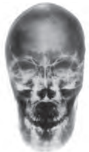
تصویر ۱۹- پرتره جمجمه، اثر الکساندر دوکادنه، چاپ سیباکروم روی آلومینیوم، هنر عکس، ۲۵۰ × ۱۴۸

در مقابل این شکل‌های جدید هنری، نوعی بازگشت به موضوعات و ارزش‌های کلاسیک به وجود آمده است که به جای پافشاری بر ژولیدگی زندگی شهری معاصر، تلاش دارند ارزش‌های کلاسیک را در آثارشان ارائه دهند. برتوچی در اثر خود (تصویر ۲۰) دو نوجوان ایتالیایی را با پس‌زمینه نقشه ایتالیا نشان می‌دهد تا بازگشتی به سنت‌های کلاسیک روم باستان باشد.