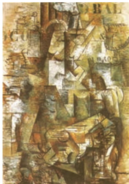
تصویر ۵- پرتغالی‌ها، اثر ژرژ براک، کوبیسم ترکیبی، رنگ و روغن، ۱۹۱۱ میلادی

فوتوریست‌ها بیشترین استقبال را از جنبش کوبیسم کردند. آنها تلاش کردند صورت پویاتری از کوبیسم را ارائه کنند. فوتوریست‌ها به‌ستایش دنیای نوین، ماشین، سرعت و خشونت پرداختند. آنها می‌خواستند هنر را به زندگی نزدیک کنند و حرکت را جوهر زندگی امروزی می‌دانستند. تأکید آنها بر نور و حرکت بود. دوران شکوفایی این جنبش در پایان جنگ جهانی رو به‌زوال گذاشت. بوتچونی ۷ از بزرگان این جنبش است که تلاش دارد حرکت و انرژی را در آثارش جلوه‌گر سازد (تصویر ۶).