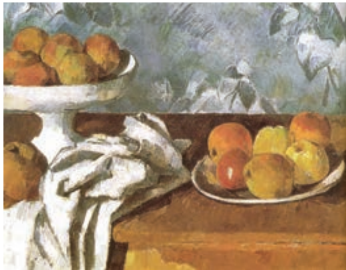
تصویر ۱۷- نقش اشیا، اثر پل سزان، حدود سال‌های ۱۸۸۲-۱۸۷۹ میلادی، رنگ روغن روی بوم، ۴۶×۵۵ سانتی‌متر، کلکسیون خصوصی

«سزان» ۶ از دیگر نقاشان این مکتب، با روش علمی در صدد یافتن قواعد جدیدی برای نظم دادن به تجربه و ادراک رنگ بود (تصویر ۱۷). از نظر سزان «نقاش باید طبیعت را به شکل استوانه، کره و مخروط نشان دهد».