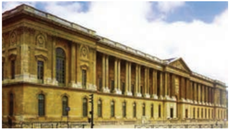
تصویر ۲- نمای شرقی کاخ لوور، سال ۱۶۷۰-۱۶۶۷ میلادی، پاریس (در حال حاضر موزه لوور)

کلیسای سن پیر ۱ در رُم کار مادرنو و ستون کاری آن کار برنینی است (تصویر ۱). برنینی از معماران و تندیس‌سازان بزرگ شهر رُم بود، وی پیرو سنت کلاسیک باستان بود و خود را جانشین میکل‌آنژ می‌دانست، تزینات پُر تجمل صحن داخلی کلیسا از نمونه کارهای او است. کاخ لوور ۲ از آثار باشکوه معماری باروک است. این بنا متأثر از سنت کلاسیک باستانی است اما ستون‌های دو تایی آن ابتکار جدیدی بود که در معماری فرانسه رواج یافت (تصویر ۲).