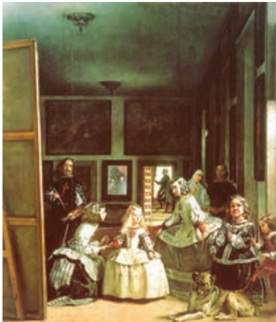
تصویر ۴- تصویر ندیمه‌ها اثر و لاسکوئز، رنگ و روغن، سال ۱۶۵۶ میلادی، مادرید

نقاشان باروک در نمایش طبیعت به واقعیت وفادار بودند و در آثارشان به رنگ، بافت، محاسبه روشنایی و تاریکی، استفاده از نور برای جلب توجه، حالت نمایشی، فضای پر و خالی و جلوه‌های غیر مترقبه اهمیت می‌دادند. از ویژگی‌های نقاشی باروک رواج نقاشی‌های علمی، تجسم فرهنگ و ادبیات عامه و آدم‌های معمولی، طبیعت بیجان، نقاشی منظره، نقاشی سقفی (تصاویر ۳ و ۴)، از هنرمندان برجسته این دوره می‌توان به کارا و ادجو ۳ ، دیه گو و لاسکوئز ۴ و رامبرانده ۵ اشاره کرد.