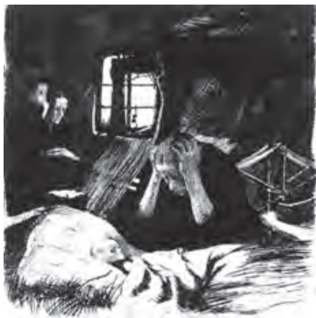
تصویر ۴- نیاز، اثر کته کُل ویتس، اکسپرسیونیسم سال‌های ۱۹۰۱-۱۸۹۳ میلادی، چاپ سنگی

نُلده ۱ ، کُل ویتس ۲ و ... ماندگارترین آثار اکسپرسیونیستی را آفریدند. آنها در وحشتناک‌ترین لحظات سده بیستم یعنی زمان استبداد نازی بر تمدن اروپایی می‌زیستند و شاهد مستقیم کشتارها و فساد آلمان در سال‌های پس از جنگ بودند (تصویر ۴).