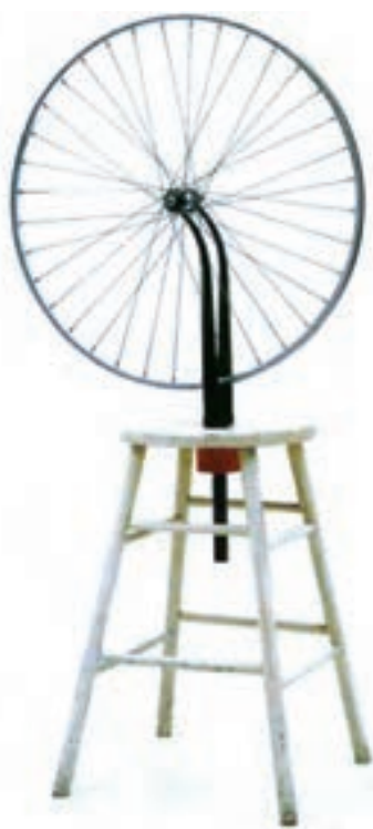
تصویر ۷- دوچرخه فلزی سوارشده روی پایه چوبی رنگ آمیزی شده، اثر مارسل دوشان، هنر دادائیسم ۱۹۱۳ م، موزه هنر مدرن، نیویورک