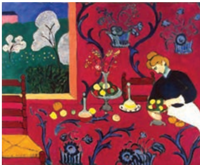
تصویر ۳- میز غذاخوری، اثر هانری ماتیس، ۱۹۰۸ میلادی، موزه هر میثاژ، سن پترزبورگ