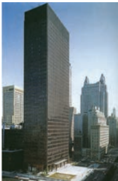
تصویر ۱- معماری مدرن ساختمان سیگرم، نیویورک، سال ۱۹۵۸-۱۹۵۴

معماری مدرن ابتدا از اروپا شروع شد و سپس در آمریکا رونق گرفت. معماری مدرن دو مسیر را ادامه داد، یکی معماری ماشین‌وار که معتقد بود شکل بنا باید تابع عملکرد آن باشد و دیگری معماری شخصی که بیانگر، جذاب، متمایل به جلوه‌های تزئینی و استفاده از عناصر معماری گذشته بود. بتون مسلح، آهن و شیشه نقش مهمی در اشکال معماری قرن بیستم داشت. معماری ماشین‌وار مدرن اغلب با ساختمان‌های مکعب گونه و آسمان خراش‌ها در مراکز شهری مشخص می‌شود (تصویر ۱ و ۲).