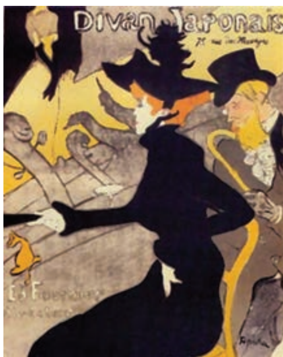
تصویر ۱۹- پوستر، اثر هنری دو تولوز-لوترک، ۱۸۹۲