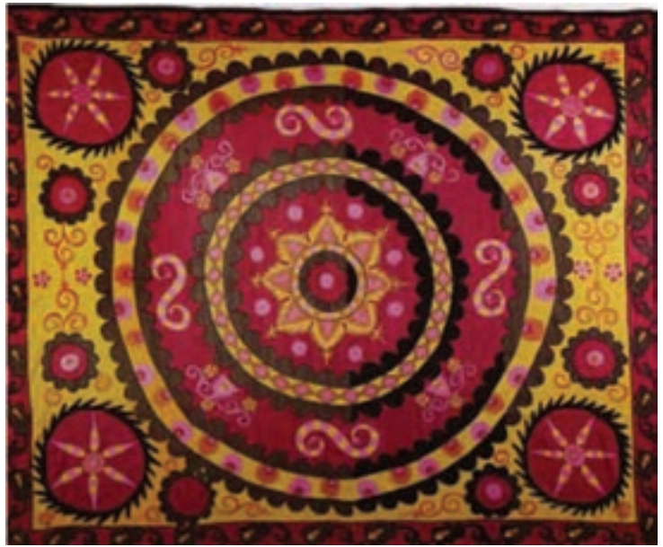
تصویر ۳۱- پارچه، ابریشم - کتان، آسیای مرکزی (ازبکستان)، سده ۱۹ هجری