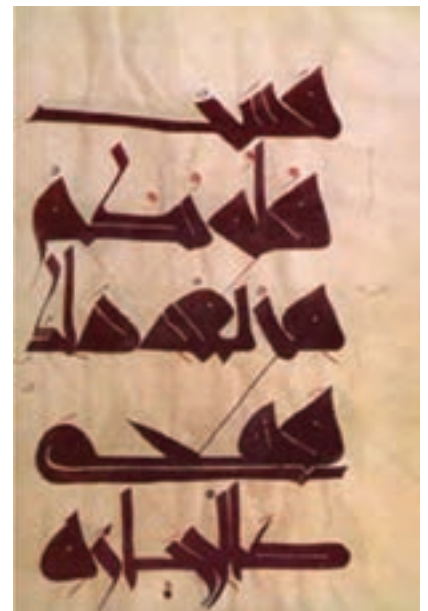
تصویر ۱۲- یک صفحه قرآن به خط کوفی مغربی (مراکشی)، روی پوست، سوره بقره، آیه ۷۴، خط علی بن وزاق سده پنجم هجری، موزه قیروان، تونس