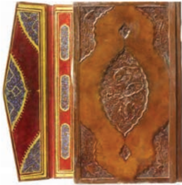
تصویر ۱۶- جلد ضربی. ایران، جلد کتاب مهر و مشتری، سده نهم هجری. موزه توپ‌کاپی، استانبول

(پانزدهم میلادی) جلدهای ایرانی به اروپا رسید و جلد سازی اروپا را تحت تأثیر قرار داد و جلد‌هایی با نقش‌های ایرانی ساخته شد.