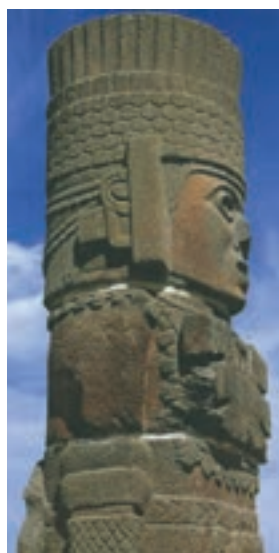
تصویر ۷- تندیس ایستاده، تولتک، مکزیکوسیتی