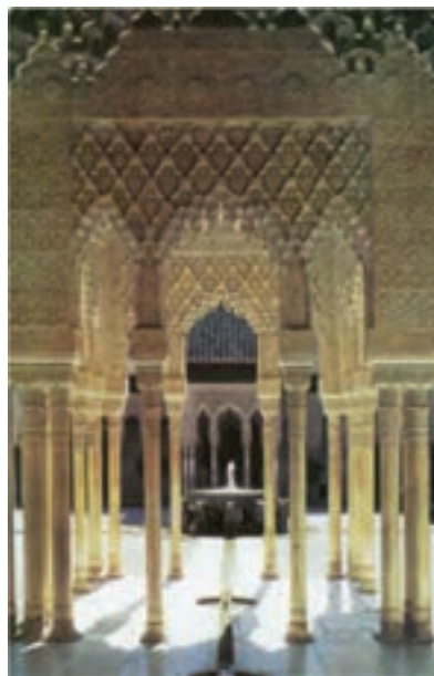
تصویر ۶- کاخ الحمراء، گرانادا، اسپانیا، سده ۸ هجری (۱۴ میلادی)