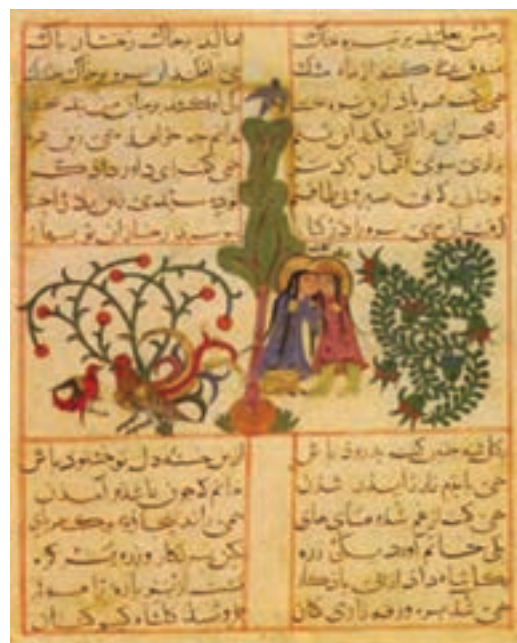
تصویر ۱۸- منظومه ورقه و گلشاه، مکتب سلجوقی، اوایل سده هفتم هجری، موزه توپ‌کاپی، استانبول

در دوره‌های پس از سلجوقی کم‌کم در نگارگری ایرانی مضامین اجتماعی و زندگی روزمره مردم وارد شد. نمایش جزئیات، تقارن عناصر، هماهنگی خط و نقاشی و استفاده علمی از رنگ مانند به‌کارگیری رنگ آبی برای آسمان، قرمز و نارنجی برای زمینه رواج یافت. همچنین تنوع در طراحی پیکرها به طبیعت‌گرایی در طراحی حیوانات، درختان، گل و بوته‌ها اوج گرفت. در دوره صفوی نیز شاهد رواج تک چهره‌سازی توسط هنرمندانی همچون رضا عباسی هستیم (تصویر ۱۹ تا ۲۱).