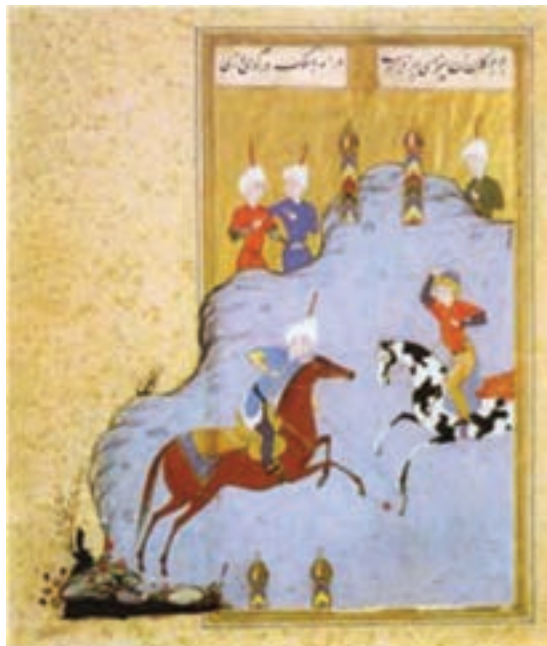
تصویر ۲۰- بازی گوی و چوگان، مکتب تبریز، کتاب گوی و چوگان، منسوب به مظفر علی، اوایل سده دهم هجری