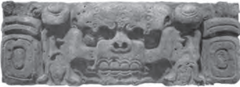
تصویر ۳- سرخداای مرگ، بخشی از سنگ محراب، کوبان، هندوراس، حدود سال‌های ۵۰۰ تا ۶۰۰ میلادی، در ۳۷ در ۱۰۴ سانتی‌متر، موزه مردم‌شناسی، لندن

آنها به همراه قوم تولتک پایتخت خود را به یوکاتان ۱ (شرق مکزیک) انتقال دادند و در این محل سنت‌های هنری آنها درهم آمیخت و در حدود سده ۱۱ میلادی، معبد بزرگ هرمی شکلی را در چیچن ایتسا برپا کردند که امروزه جزء یکی از عجایب هفتگانه جهان است (تصویر ۳ و ۴).