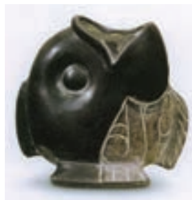
تصویر ۲- ظرف سفالی به شکل ماهی، اولمک، مکزیک

مایاها در شرق آمریکای مرکزی می‌زیستند و در حدود ۱۰۰۰ پیش از میلاد وارد مرحله شهرنشینی شدند و کم کم به اوج زندگی شهرنشینی خود رسیدند. آنها در ساخت بناهای شگفت‌انگیز، یادمان‌های سنگی، سفالگری، فلزکاری و نساجی توانا بودند. آنان در همه جا بر دیواره بناها نقش برجسته‌های نمادین می‌ساختند. خصوصیات بارز این نقش برجسته‌ها انبوهی و فشردگی صورت‌های شبه انسان و حیوان و شکل مکعب گونه آنها است. معمولاً پیکره‌ها با لباس مذهبی یا آئینی در میان علائم یا حروف رمزی نمایش داده می‌شوند (تصویر ۲). در حدود ۹۰۰ میلادی بسیاری از شهرهای مایا متروک شد و