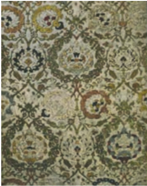
تصویر ۳۲- پارچه مخمل و زربفت، سده ۱۱، دوره صفوی، موزه توپکاپی