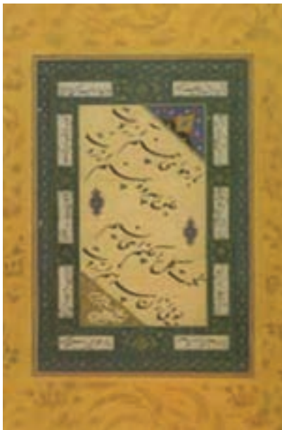
تصویر ۱۴- یک قطعه خط نستعلیق، خط مالک دیلمی، دوره صفوی

خوشنویسی ممتازترین و شریف‌ترین هنر اسلامی است. قرآن کریم نقش اول را در تعالی این هنر به عهده داشت، زیرا قرآن باید با خطی نوشته می‌شد که شایسته آن باشد، کاتبان وحی با سعی و تلاش خوشنویسی را به هنر درجه اول تبدیل کردند (تصویر ۱۲). یکی از ویژگی هنرهای اسلامی استفاده از خط در همه دست ساخته‌ها است. هنرمندان عبارات مذهبی و غیر مذهبی را با زیبایی هرچه تمامتر روی آثار مختلف می‌نوشتند. یکی از جذابیت‌های خوشنویسی مسلمانان تنوع خطوط آنها است. خط‌های کوفی، نسخ، ثلث و نستعلیق بیشترین رواج را داشت و خوشنویسان ایرانی در طراحی و تنوع خطوط سهم بیشتری داشتند (تصاویر ۱۳ تا ۱۴).