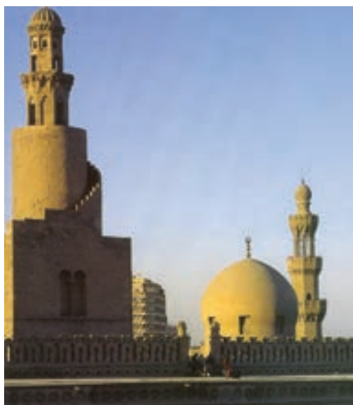
تصویر ۹- مسجد ابن طولون در قاهره ساخته شده در ۲۵۹ هجری