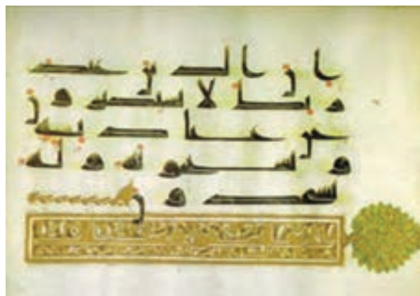
تصویر ۱- یک صفحه قرآن به خط کوفی تحریری، ایران، سده سوم هجری (۹ میلادی)، موزه ملی ایران

با هجرت رسول اکرم (ص) در سال اول هجری برابر با سال ۶۲۲ میلادی به شهر مدینه و تأسیس حکومت اسلامی در آن شهر، اساس هنر و تمدن اسلامی شکل گرفت. آنچه بیش از همه در شکل‌گیری هنر اسلامی نقش داشت، قرآن بود. انتشار قرآن به زبان عربی و رواج آن در تمام سرزمین‌هایی که دیانت اسلام را پذیرفتند، سبب پیوند و اتحاد بین ملل مختلف ساکن در این سرزمین‌ها شد و قرآن عامل خلق آثار هنری گردید (تصویر ۱).