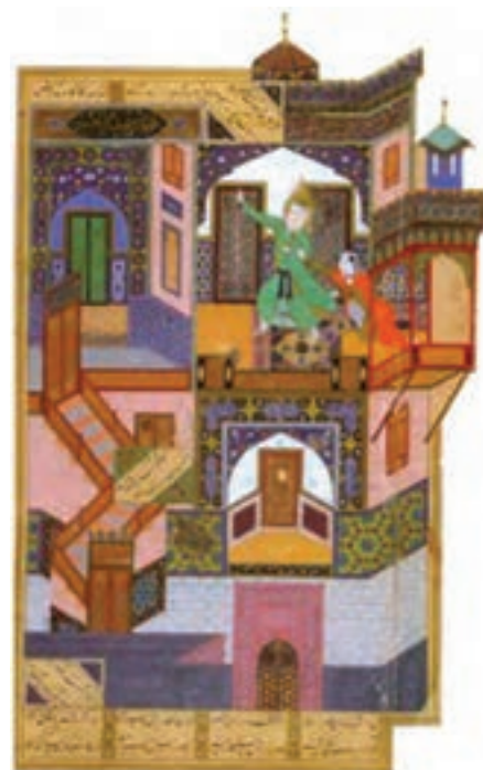
تصویر ۱۹- فرار یوسف از نزد زلیخا، مکتب هرات، بوستان سعدی، اثر بهزاد، سده ۹ هجری