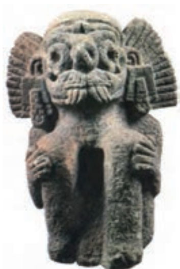
تصویر ۸- هنر آزتک، تندیس سنگی تالوک، خدای باران آزتک، سده‌های ۱۴-۱۵ میلادی، ارتفاع ۴۰ سانتی‌متر، موزه مردم‌شناسی، برلین.