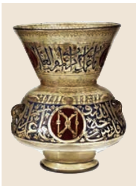
تصویر ۳۰- قندیل (چراغ سقفی)، سده ۸ هجری، دوره مملوک، موزه هنر متروپولیتن نیویورک

شیشه‌گری نیز از فنون و هنرهای دوره اسلامی است که به‌ویژه در دوره سلجوقی با الگوبرداری از شیشه‌گری دوره ساسانی و مراکز شیشه‌گری در سوریه و سایر کشورهای حوزه مدیترانه شرقی شکوفا بوده است. ظروف شیشه‌ای در اشکال و با تزیینات گوناگون و رنگ‌های متنوع ساخته می‌شد و مراکزی چون گرگان، نیشابور، ری و بندر سیراف در استان هرمزگان در ایران و برخی شهرها در کشورهای میانرودان (عراق امروزی)، سوریه و مصر از مراکز مهم و عمده شیشه‌گری کشورهای اسلامی بودند (تصاویر ۲۹ و ۳۰).