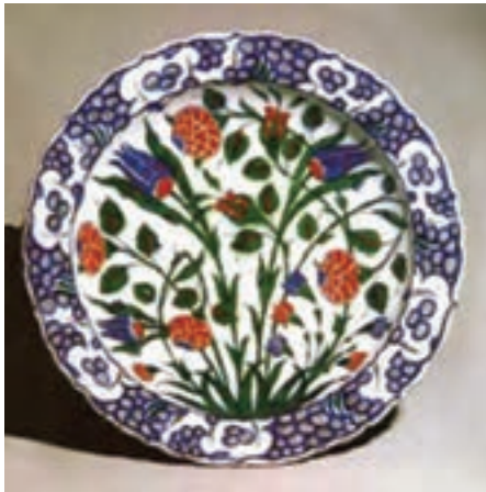
تصویر ۲۶- بشقاب سده دهم هجری، آزنیک، ترکیه