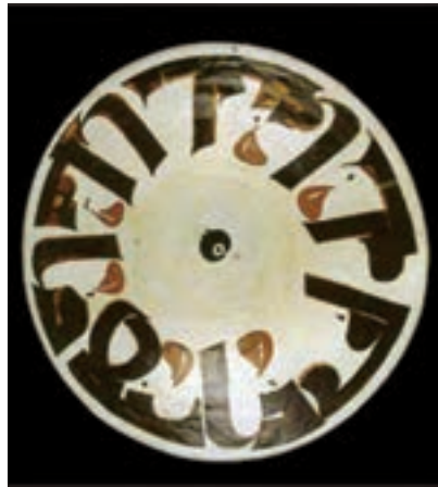
تصویر ۲۵- بشقاب سفالی، خط نوشته کوفی ایران، نیشابور، سده ۳ یا ۴ هجری