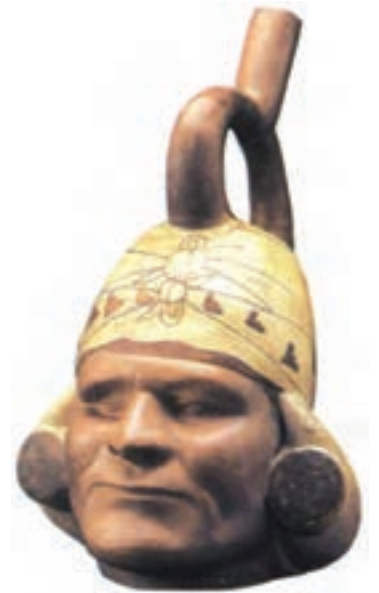
تصویر ۵- ظرف سفالی به شکل مرد تک چشم، پرو، حدود سال‌های ۲۵۰ تا ۵۵۰ میلادی، ارتفاع ۲۹ سانتی‌متر، موزه هنر شیکاگو

همزمان با تمدن مایا، در شمال شهر مکزیکو، تمدن دیگری به نام تئوتیواکان شکل گرفت. هنر این قوم بیشتر جنبه مذهبی داشت. سازندگان معابد مردمی کشاورز بودند که سبک هنری مشخصی در نخستین سده‌های عصر مسیحیت آفریدند. اینان خدایانی که مظاهر طبیعت ماه و خورشید و ... بودند، را می‌پرستیدند و پیکره‌های زیادی با چهره انسانی می‌ساختند (تصویر ۵ و ۶).