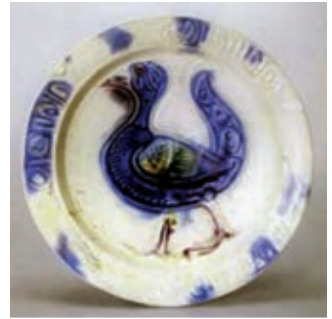
تصویر ۲۴- بشقاب با نقش پرند، سوریه یا مصر، سده هفتم هجری، موزه ارمیتاژ