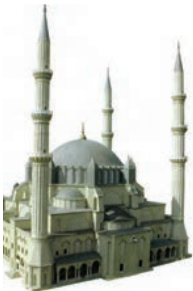
تصویر ۱۰- ماکت، سبک معماری مساجد عثمانی