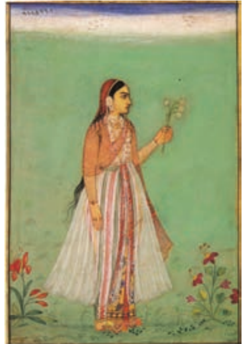
تصویر ۲۲- مکتب مغولی هند، دختری با شاخه گل، از یک مرقع، اندازه ۱۴/۴ در ۹/۷ سانتی متر، سده یازدهم، مجموعه خلیلی، لندن