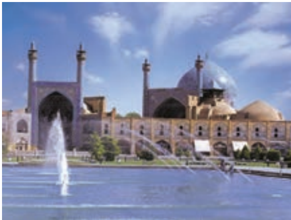
تصویر ۴- مسجد امام، دوره صفوی، اصفهان

گیاهی در تزیینات، پرهیز از طبیعت‌پردازی و واقع‌گرایی دیده می‌شود (تصویر ۴). تصویر ۲- خانه خدا (کعبه)، قبله‌گاه مسلمین جهان، مکه معظمه