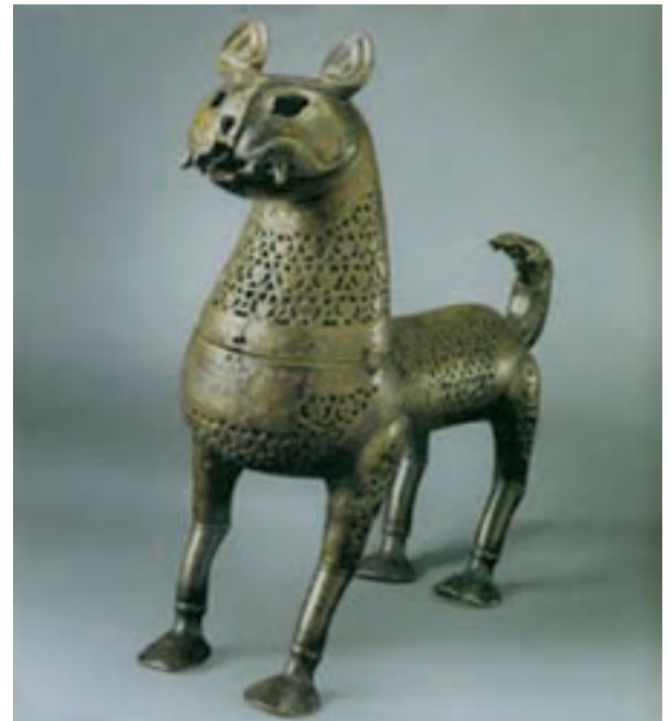
تصویر ۲۷- بخور سوز مفرغی، ایران. سده پنجم هجری، موزه ارمیتاژ

تولید اشیای فلزی در اغلب شهرهای جهان اسلام رواج داشت. دست آفریده‌های فلزی شهرهای ایران، مصر، سوریه و ترکیه از شهرت زیادی برخوردار هستند. هنرمندان مسلمان توجه خاصی به تنوع شکل و تزئین اشیاء داشتند. در میان اشیای فلزی، ساخت ظروف و لوازم خانگی از جایگاه ویژه‌ای برخوردار بودند. به دلیل تحریم استفاده از طلا و نقره، آثار فلزی اغلب با مفرغ، برنج و مس ساخته می‌شدند. زیبایی اشیای فلزی تنها در تنوع شکل آنها نیست بلکه تزئینات آنها چشمگیر است. فلزکاران انواع نقش‌های هندسی، گیاهی، برج‌های دوازده‌گانه، صحنه‌های رزم، بزم و شکار را به روش قلمزنی ایجاد می‌کردند. علاوه بر این گاهی با نوشته، سیاه قلمکاری، میناکاری، ترصیع و زراندود زیبایی آنها را صد چندان می‌کردند (تصاویر ۲۷ و ۲۸).