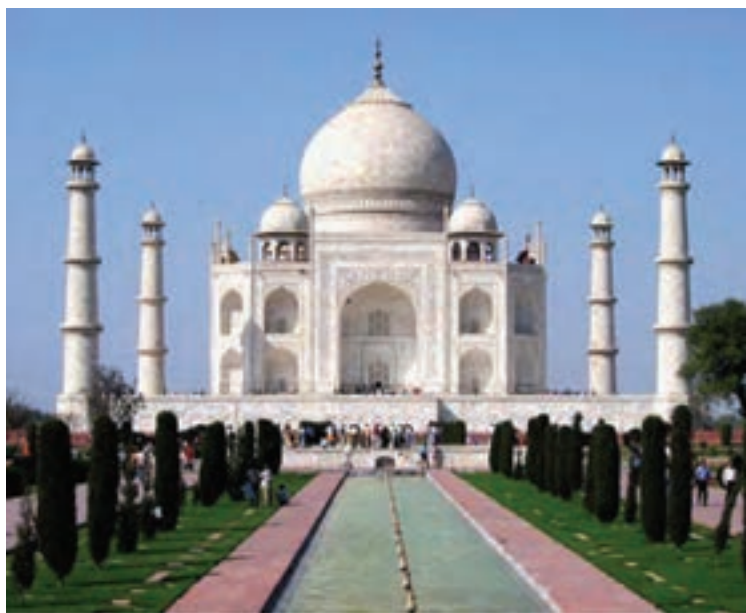
تصویر ۷- تاج محل، آرامگاه ممتاز محل همسر شاه جهان، آگرا، هند، اواسط سده ۱۱ هجری (سده ۱۸ میلادی)

۱- ورودی‌ها، ۲- اتاق‌های بخش مسکونی، ۳- فضای سرپوشیده رو به قبله، ۴- حیاط یا میانسرا، ۵- صفا جهت اقامت یاران و مستمندان