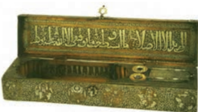
تصویر ۲۸- قلمدان برنجی، ساخت موصل، سده هفتم هجری. موزه ارمیتاژ