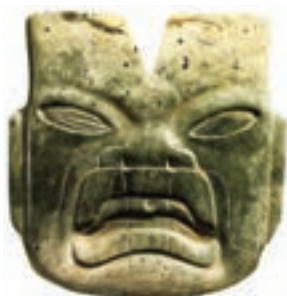
تصویر ۱- چهره انسان، اولمک

اولمک‌ها در جنوب شرق مکزیک زندگی می‌کردند و نخستین اقوامی بودند که در حدود ۱۲۰۰ پیش از میلاد وارد تمدن شهری شدند. آنها از پایه‌گذاران تمدن‌های آمریکای مرکزی محسوب می‌شوند. اولمک‌ها در ساخت بناهای مذهبی و پیکره‌های بزرگ یادمانی به ویژه سردیس‌ها توانا بودند (تصویر ۱). از آثار مکشوف چنین استنباط می‌شود که اولمک‌ها در دانش نجوم بسیار پیشرفته و تقویم‌های دقیقی داشته‌اند.