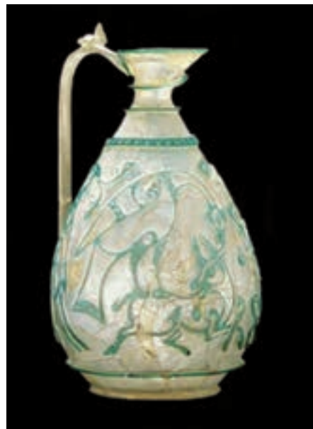
تصویر ۲۹- تنگ شیشه‌ای، ایران، نیشابور، سده ۶ هجری