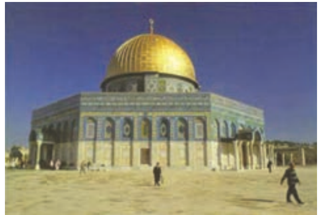
تصویر ۳- قبة الصخره، سال ۷۱ هجری، تزیینات سده ۱۱ هجری، (۱۷ میلادی) فلسطین

هنر اسلامی تنها به معماری و نقاشی محدود نمی‌شود بلکه هنرهای دیگر مانند خوشنویسی، کتاب‌آرایی، نگارگری، سفالگری، فلزکاری، پارچه‌بافی، شیشه‌گری، قالی‌بافی، درودگری (نجاری) و ... را نیز در بر می‌گیرد.