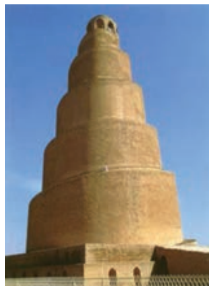
تصویر ۸- منار مسجد سامرا، سده سوم هجری، عراق