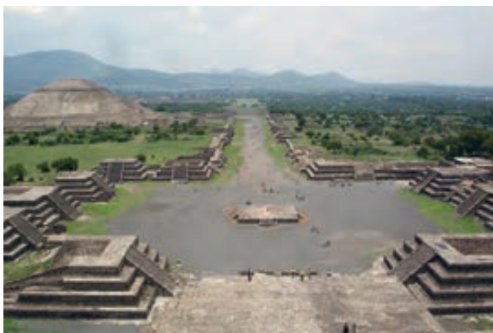
تصویر ۶- بخشی از شهر بزرگ توتیوآکان