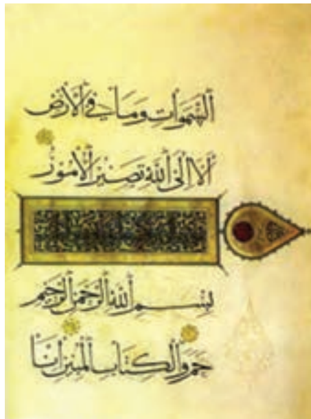
تصویر ۱۳- یک صفحه قرآن به خط ثلث، خط احمد بن سهروردی، اوایل سده هشتم هجری (دوره ایلخانی)، موزه ملی ایران