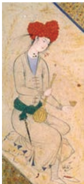
تصویر ۲۱- مکتب اصفهان، یک قطعه نقاشی، جوان نشسته، اثر آقارضا