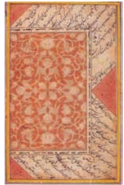
تصویر ۱۵- صفحه آرای کتاب، یزد، سده نهم هجری