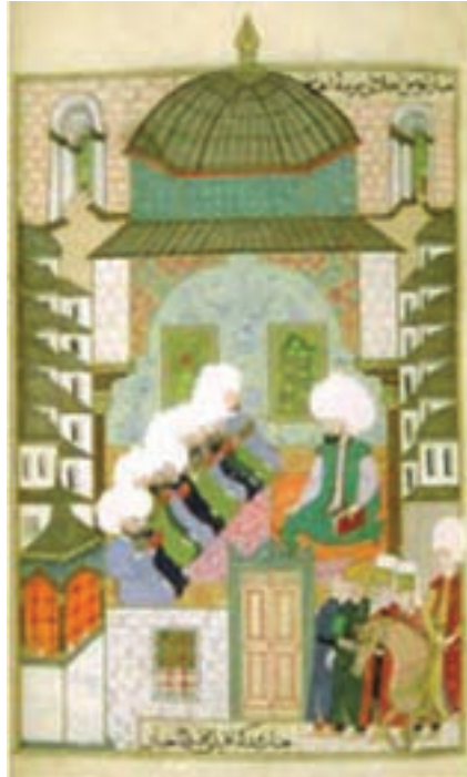
تصویر ۲۳- مکتب عثمانی، اثر محمد امیر شاه، کلاس درس در مدرسه غضنفر آقا در استانبول، سده یازدهم هجری

برخی از هنرمندان دوره صفوی در دربار عثمانی (ترکیه) و مغولی هند حضور یافتند. در این زمان مصور سازی کتاب به تقلید از کتاب‌های مصور ایرانی مورد توجه قرار گرفت و آثار با ارزشی در زمینه‌های مختلف مصور شد. هنرمندان ایرانی در شکل‌گیری مکتب نگارگری عثمانی و مغولی هند، نقش مهمی داشتند (تصاویر ۲۲ و ۲۳).