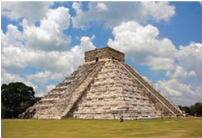
تصویر ۴- معبد چیچن ایتسا (Chichen-Itza)، یوکاتان، سده ۱۱ میلادی

آنها به همراه قوم تولتک پایتخت خود را به یوکاتان ۱ (شرق مکزیک) انتقال دادند و در این محل سنت‌های هنری آنها درهم آمیخت و در حدود سده ۱۱ میلادی، معبد بزرگ هرمی شکلی را در چیچن ایتسا برپا کردند که امروزه جزء یکی از عجایب هفتگانه جهان است (تصویر ۳ و ۴).