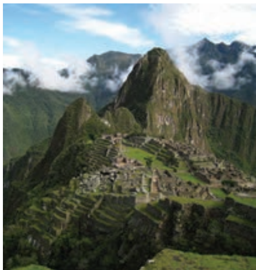
تصویر ۹- شهر ماچوپیککو، تمدن اینکارو، حدود ۱۵۰۰ میلادی

مهندسی ساختمان و شیوه معماری خشک (بدون ملات) شهرت دارند. معماری شکوهمند اینکا در مراکز عمده‌ای چون کوزکو ۱ و ماچوپیککو ۲ مشهور است. معابد هرمی شکل و مرتفع آنها از پاره‌ای جهات به اهرام مصر و زیگورات‌های بین‌النهرین شباهت دارند. در سده‌های ۱۹ و ۲۰ میلادی، آشنایی هنرمندان معاصر با هنر و تمدن گذشته اینکاها سبب گردید که هنر این قوم مورد توجه قرار گیرد (تصویر ۹).