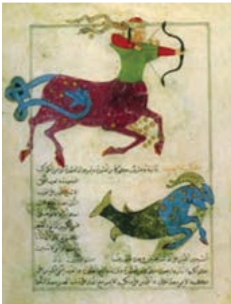
تصویر ۱۷- صورت فلکی قنطورس، کتاب عجایب المخلوقات قزوینی، مکتب بغداد، سده هشتم هجری

در اواخر سده دوم هجری نهضت ترجمه با مرکزیت بغداد شکل گرفت و کتاب‌های زیادی از پهلوی ساسانی، یونانی، مصری و هندی به عربی ترجمه شد. در میان آنها کتاب‌های مصور علمی چون گیاه‌شناسی، جانورشناسی، ستاره‌شناسی که مصور بودند نیز وجود داشت. این کتاب‌های مصور عامل توجه مسلمانان به تصویرسازی کتاب شد متأسفانه تا سده ششم هجری غیر از قرآن به ندرت کتابی باقی مانده است. اما کتاب‌های باقی مانده از اوایل سده هفتم هجری به بعد نشانگر توجه به مصورسازی کتاب‌های علمی در پایتخت‌های جهان اسلام (قاهره، بغداد، دمشق، تبریز، شیراز، هرات و ...) است (تصویر ۱۷).