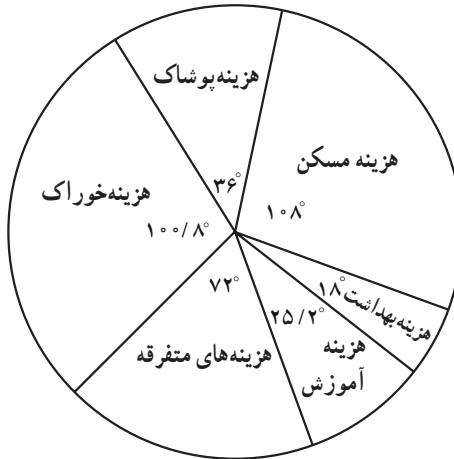
شکل ۱- نمودار دایره‌ای هزینه خانوارها

باید توجه نمود که جمع درجه‌ها بایستی 360^\circ باشد.