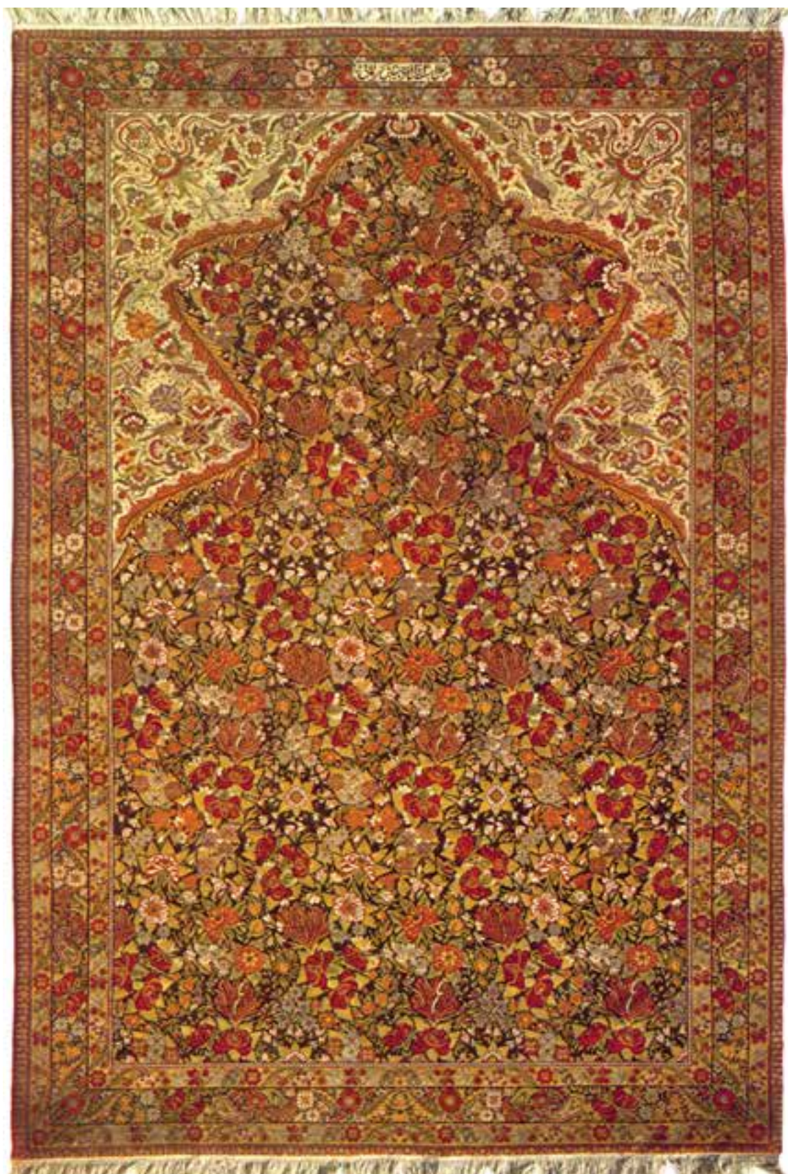
تصویر ۲۶-۱۴- قالی بافت کرمان