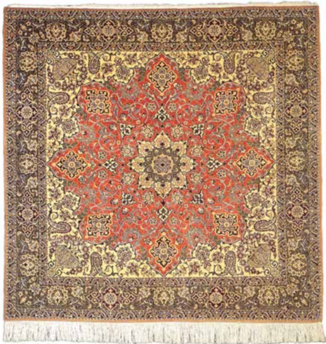
تصویر ۷-۱۴- قالی بافت ناین

طرح‌های هندسی خاصی که به نام طرح جوشقان شهرت دارد در قالی‌های بافت جوشقان و میمه مشاهده می‌گردد. در ناین و اطراف آن نیز قالی‌بافی با طرح و سبکی خاص رایج است. طرح‌ها و نقوش به کار گرفته شده در قالی‌های ناین مشابهت بسیاری با طرح‌ها و نقوش قالی‌های اصفهان دارد که با تعداد رنگ‌های کم‌تری رنگ‌بندی شده است. قالی‌های ناین به‌طور معمول دارای تارهای چله‌ای پنبه‌ای است. قالی‌بافی در منطقه‌ی اصفهان و کاشان بر روی دارهای ثابت و با استفاده از گره‌ی نامتقارن صورت می‌پذیرد.