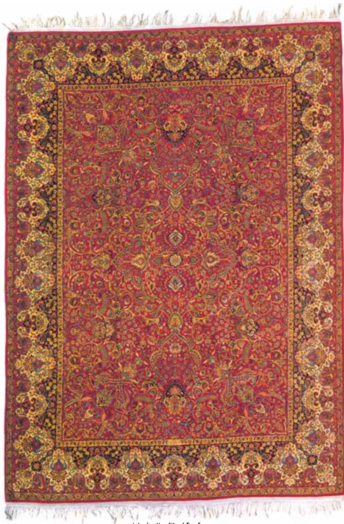
تصویر ۶-۱۴- قالی بافت اصفهان