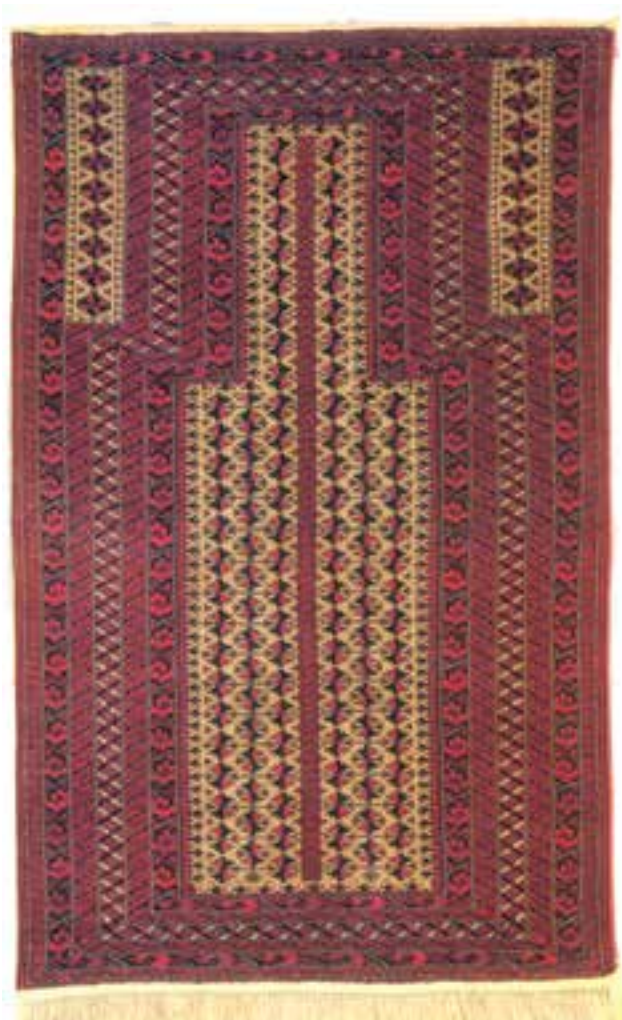
تصویر ۱۲-۱۴- قالی بافت بلوچ

کردستان: قالی‌بافی در مناطق کوهستانی غرب ایران در شهرستان‌های سنندج، کرمانشاه، بیجار، قروه، سقز، بانه، تکاب، بوکان و سنقر متداول است. بافت قالی در این مناطق معمولاً بر روی دارهای گردان تبریزی و با گره‌ی متقارن صورت می‌گیرد. در منطقه‌ی سنندج و اطراف آن استفاده از نقش ماهی و بته با رنگ‌های تند لاک‌ی و زمینه‌های سرمه‌ای تیره به فراوانی مشاهده