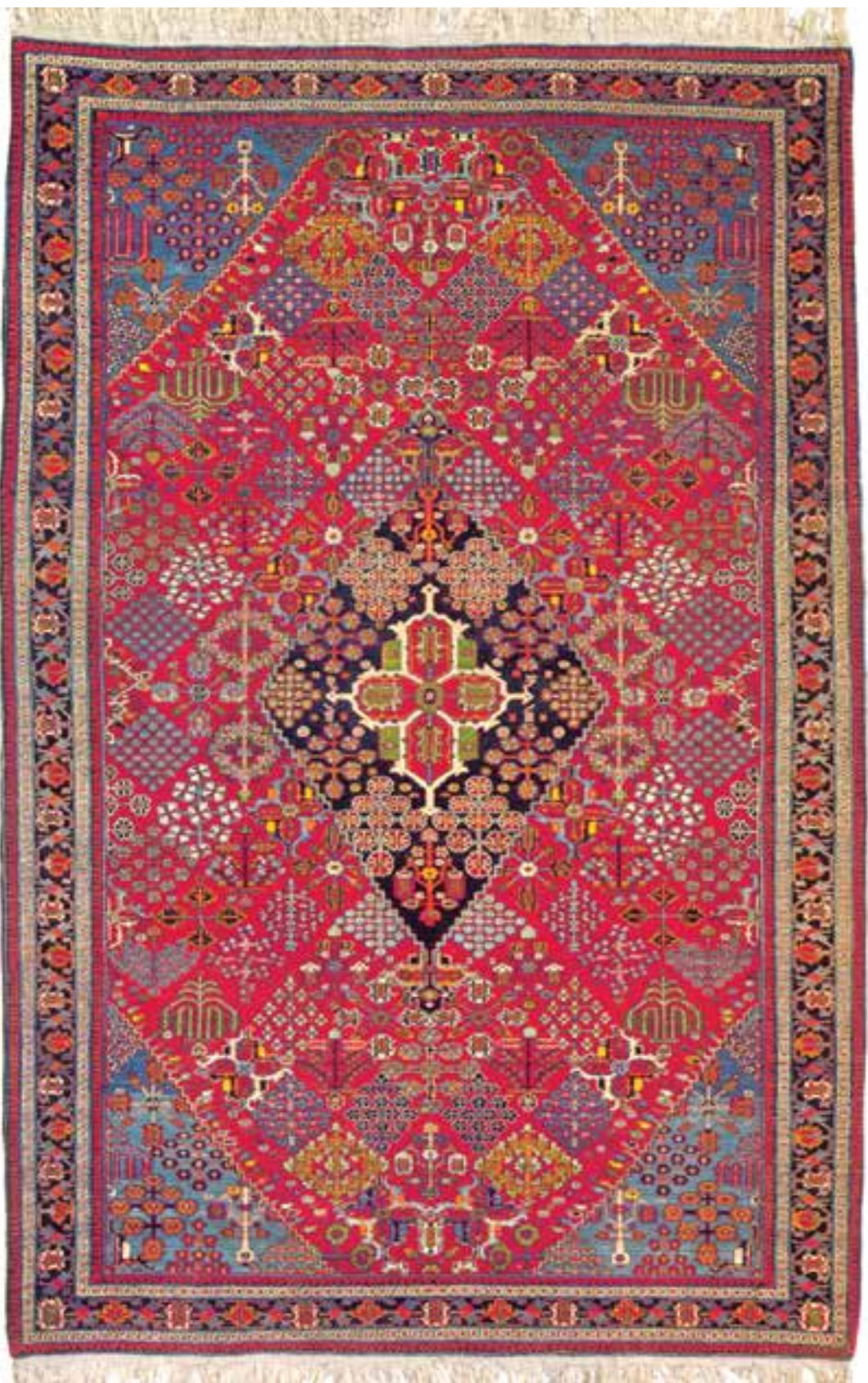
تصویر ۸-۱۴- قالی بافت جوشقان