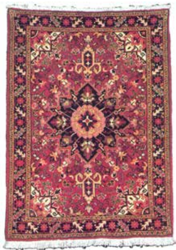
تصویر ۲-۱۴- قالیچه‌ی بافت هریس