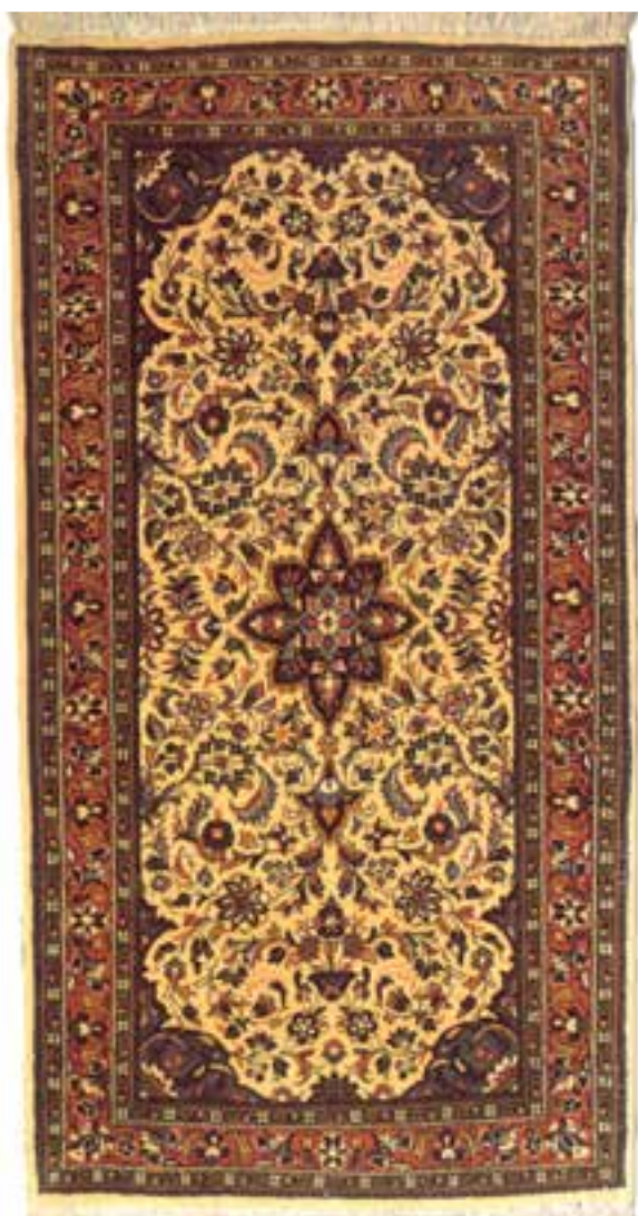
تصویر ۲۹-۱۴- قالی بافت اراک