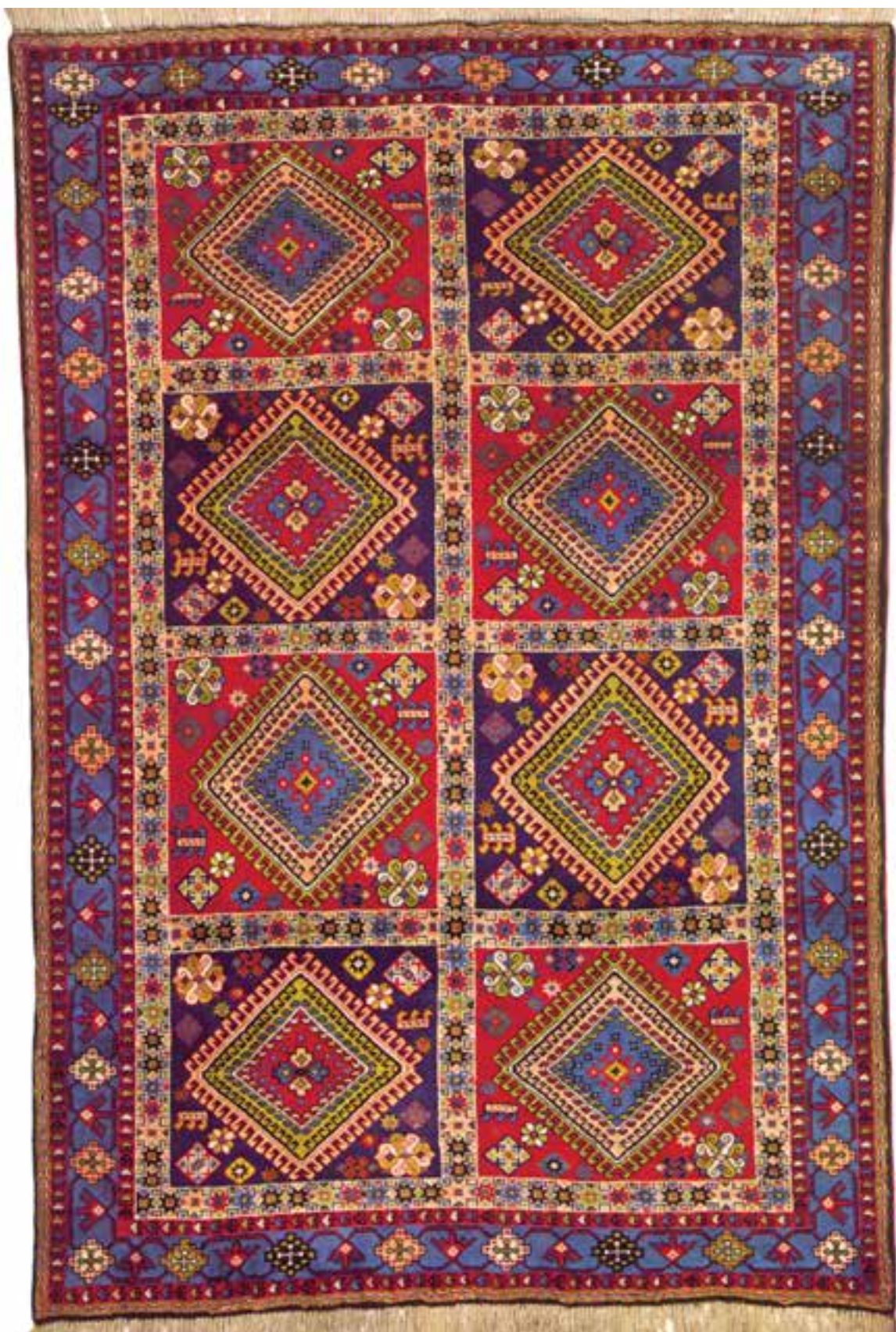
تصویر ۲۳-۱۴ - قالی بافت یلمه