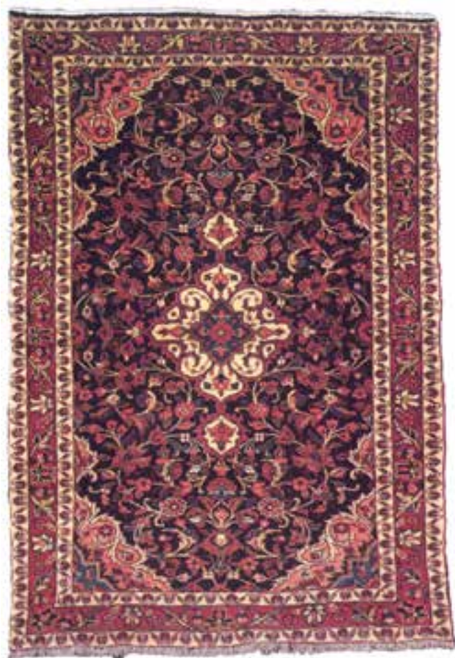
تصویر ۳۳-۱۴ - قالی بافت درجزین همدان