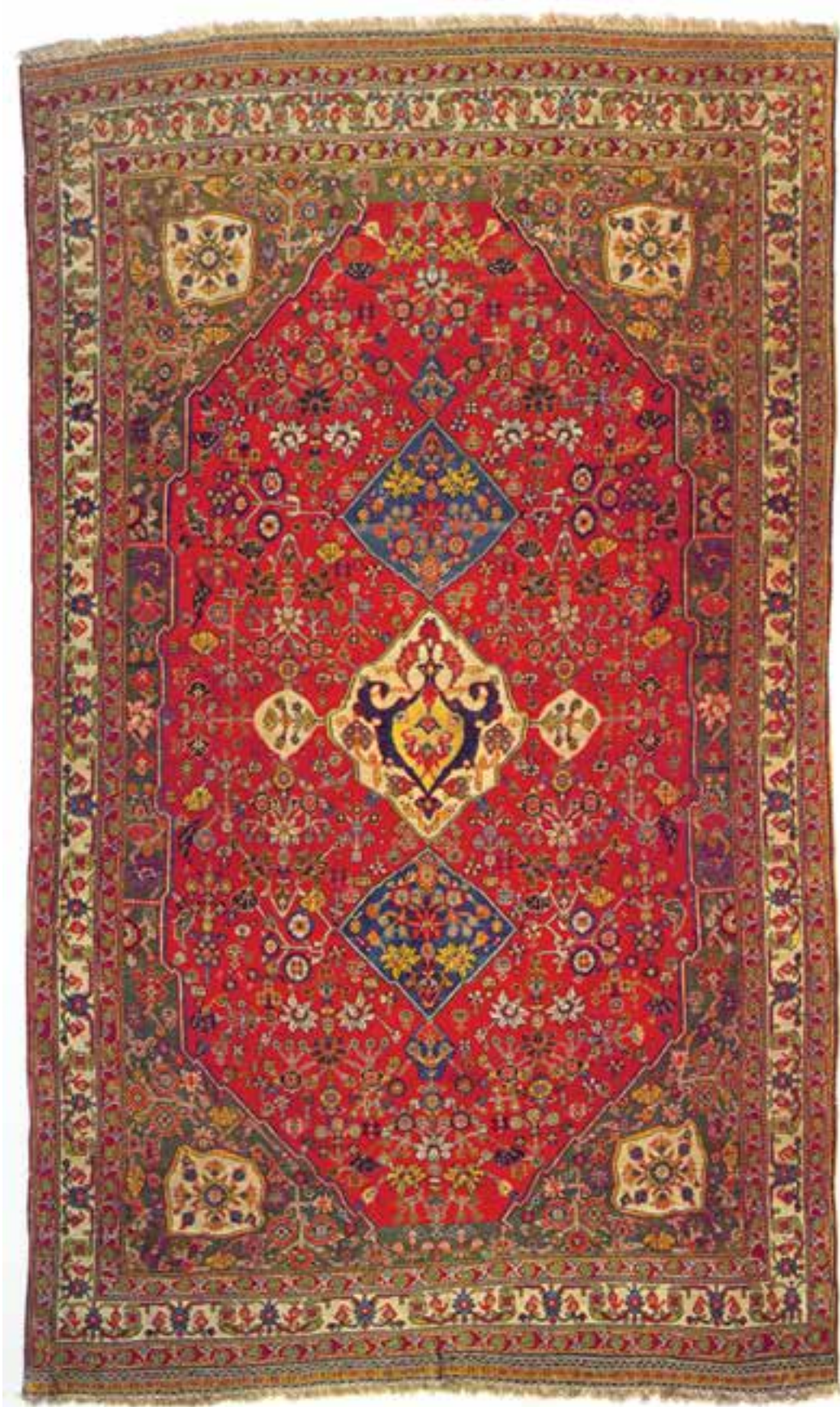
تصویر ۱۶-۱۴- قالی بافت فارس (قشقایی)