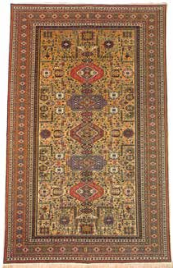
تصویر ۴-۱۴- قالیچه‌ی بافت اردبیل