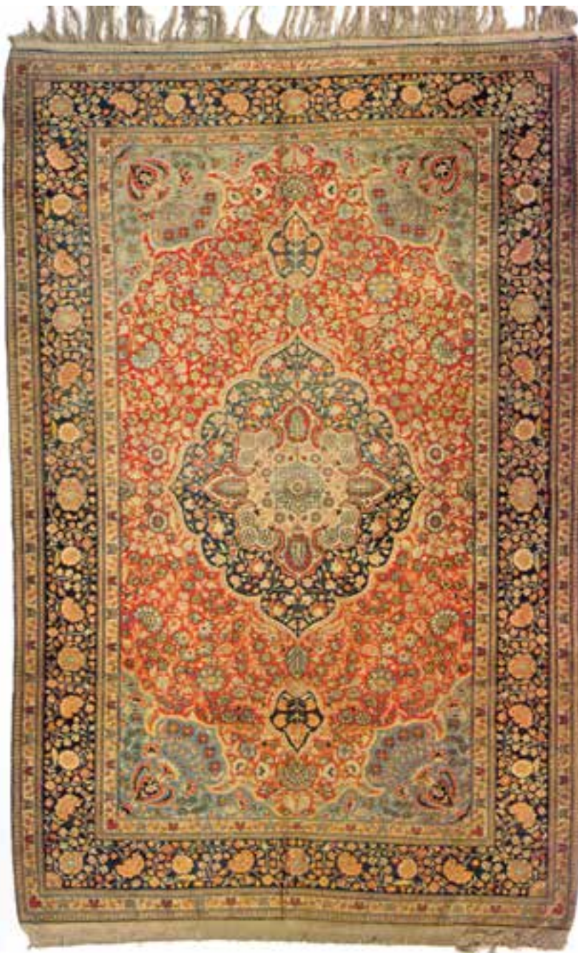
تصویر ۵-۱۴- قالی بافت کاشان

اصفهان: اصفهان و کاشان از پراهمیت‌ترین مناطق قالی‌بافی دوران صفوی بوده‌اند. بسیاری از قالی‌های قدیمی بازمانده از دوران صفوی نمایانگر پیشرفت قالی‌بافی در مناطق ایران مرکزی است. هم‌اکنون نیز قالی‌بافی در مناطق اصفهان، کاشان، نایین، شهرضا، نجف‌آباد، جوشقان، اردستان، میمه و ... رایج است. بافت قالی‌های اعلا و ظریف با استفاده از پشم و ابریشم در اصفهان و مناطق اطراف آن متداول است. طرح‌ها و نقوش