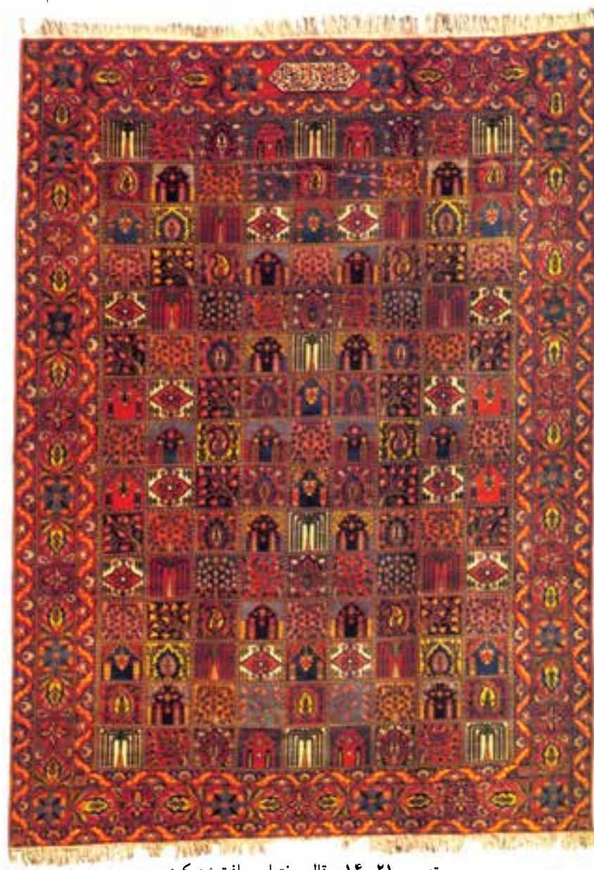
تصویر ۲۱-۱۴- قالی بختیاری بافت شهرکرد

در مناطق جنوبی بختیاری قالی‌هایی با تار و پود پشمی بافته می‌شود. طرح و نقوش هندسی این قالی‌ها مشابهت بسیاری با نقوش قشقایی فارس دارد و به نام یلمه شهرت دارد.