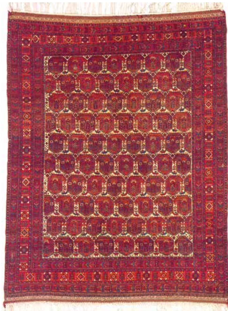
تصویر ۲۵-۱۴- قالی بافت شهر بابک کرمان

علاوه بر کرمان، راور و رفسنجان نیز از مراکز مهم بافت قالی‌های با کیفیت در این استان محسوب می‌گردند. جالب توجه است که در مناطق جنوب استان کرمان (شهر بابک، سیرجان) که بیش‌تر محل استقرار طوایف و عشایر افشار است طرح‌ها و نقش‌هایی بافته می‌شود که کلاً متفاوت با طرح‌های قالی کرمان