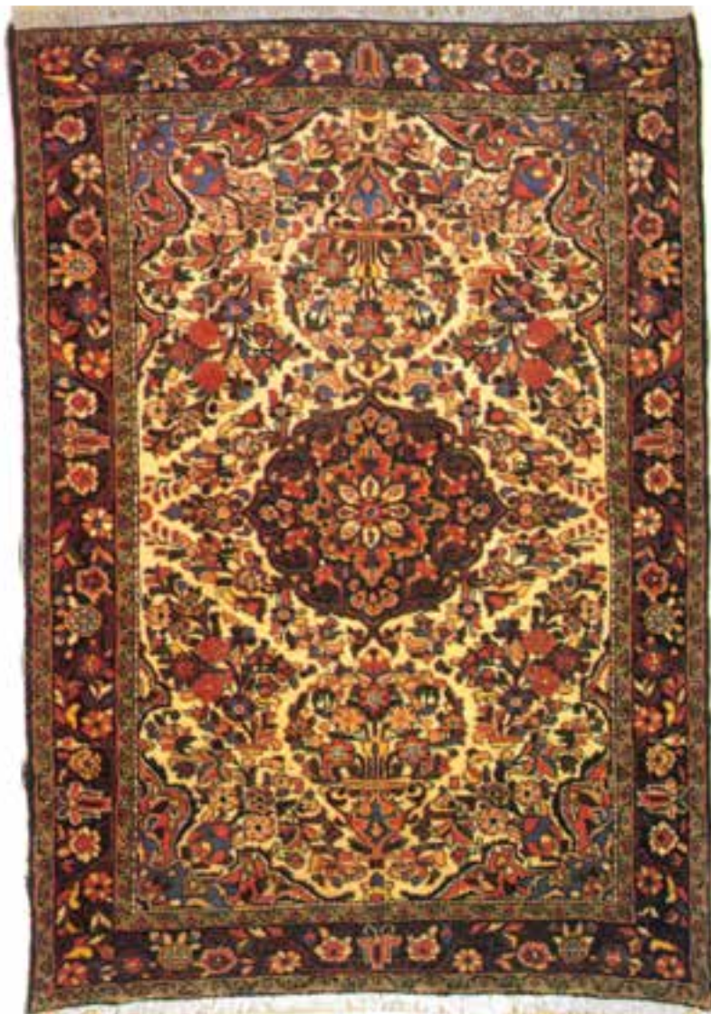
تصویر ۳۱-۱۴ قالی بافت برچالو همدان

در بسیاری از این قالی‌ها دیده می‌شود. در همدان قالی‌بافی دوپود نیز متداول است و به نام شهرباف مشهور است. در بافت این قالی عموماً از نقش‌ها و طرح‌های کردستان بهره می‌برند. این قالی کیفیت قابل توجهی از نظر بافت و رنگ دارد. از جمله مناطق مشهور قالی‌بافی در همدان می‌توان از درجزین، آنجلاس، نهاوند، برچالو، مهربان، ملایر، اسدآباد و کبودرآهنگ نام برد.