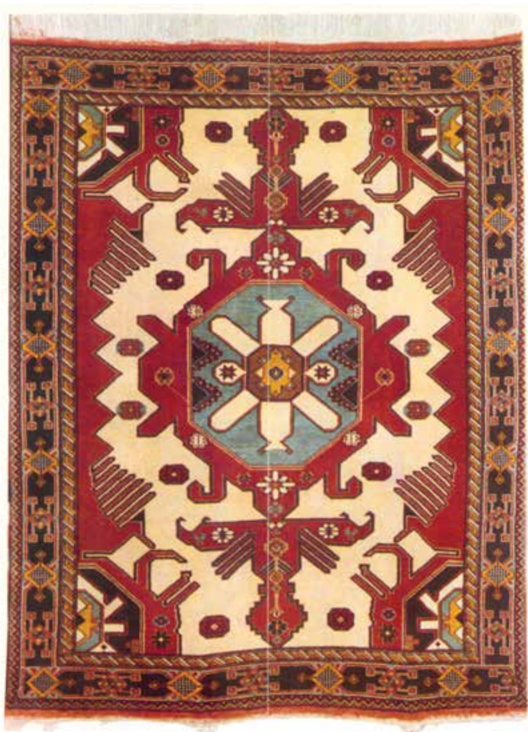
تصویر ۱۱-۱۴- قالی کردی قوچان

قالی بافی در مناطقی چون سبزوار، نیشابور، بردسکن و کاشمر با به کارگیری طرح‌ها و نقوش ناین، ورامین، تبریز و اخیراً اراک و مشک‌آباد صورت می‌پذیرد و این بیش‌تر به دلیل توجهات اقتصادی است که تقلید و استفاده از نقوش سایر مناطق را در مرکز خراسان رایج نموده است. در شمال منطقه‌ی خراسان چون قوچان و بجنورد بافت قالی با استفاده از نقوش هندسی که شباهت زیادی به قالی‌های کردستان و قفقاز دارد رایج است و به‌طور معمول قالی‌ها در اندازه‌های کوچک تولید می‌گردند.