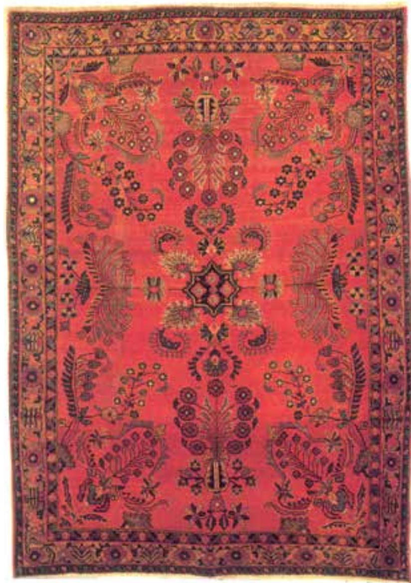
تصویر ۲۷-۱۴- قالی بافت ساروق

فراهان نیز یکی دیگر از مشهورترین مناطق قالی‌بافی اراک محسوب می‌گردد که با به‌کارگیری نقوش ماهی و بته و همچنین نقوش هندسی قالی‌هایی پرکیفیت عرضه می‌نماید. بافندگان منطقه‌ی اراک از گره‌ی نامتقارن در بافت قالی استفاده می‌نمایند.