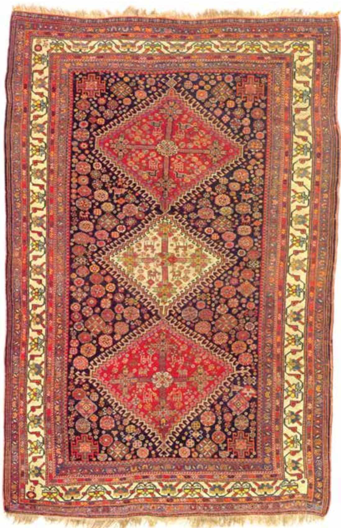
تصویر ۱۸-۱۴ - قالی بافت فارس (قشقایی)