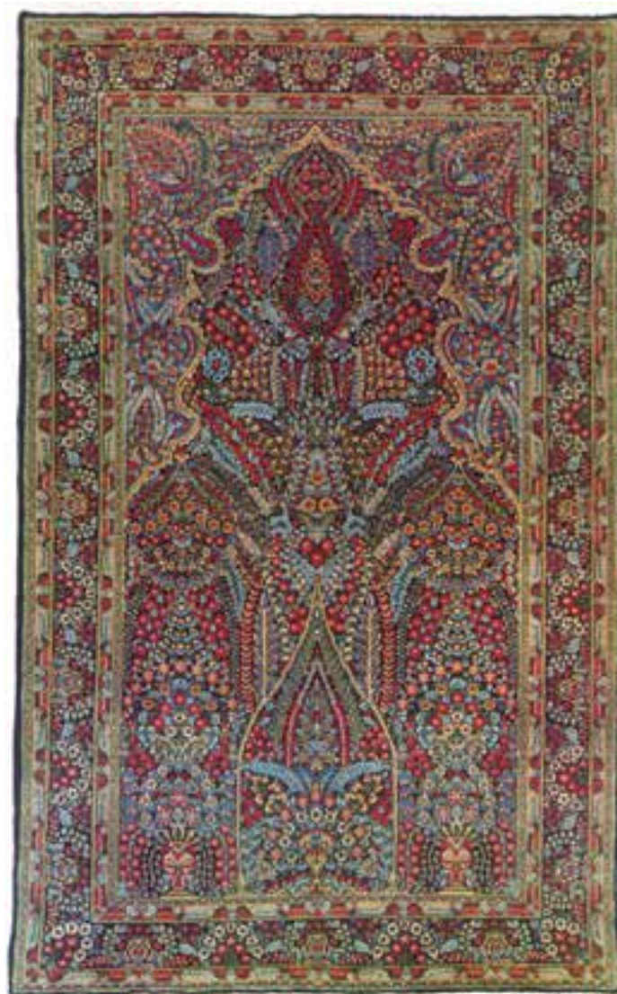
تصویر ۲۴-۱۴- قالی بافت راور کرمان

در بافت قالی‌های کرمانی از گره‌ی نامتقارن استفاده می‌کنند و بسیاری از قالی‌ها با سه پود بافته می‌شوند که از ویژگی‌های قالی کرمان است، چون در دیگر مناطق معمولاً از دو پود در بافت استفاده می‌کنند. قابل ذکر است که در گذشته‌ای نه‌چندان دور سبک و شیوه‌ای به‌نام بی‌گره‌بافی در قالی‌بافی کرمان رایج شد که لطافت بسیاری بر کیفیت قالی کرمان وارد نمود.