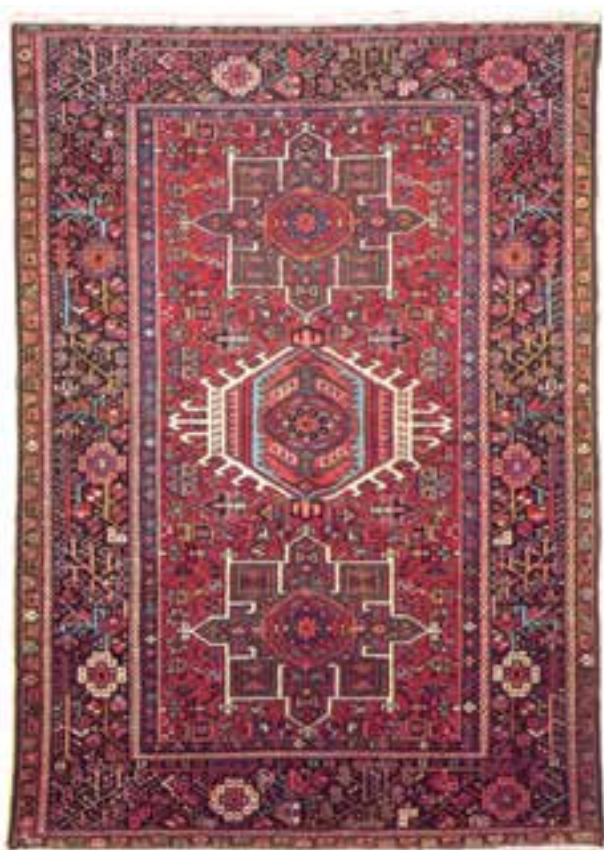
تصویر ۳-۱۴- قالیچه‌ی بافت قرجه