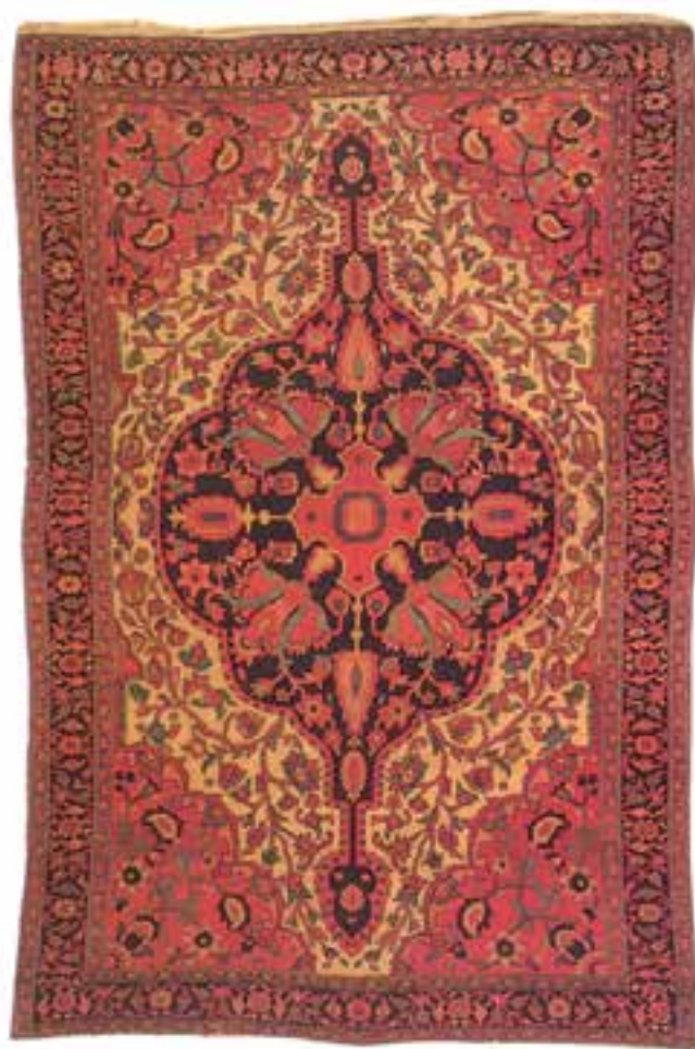
تصویر ۳۲-۱۴ - قالی بافت ملایر