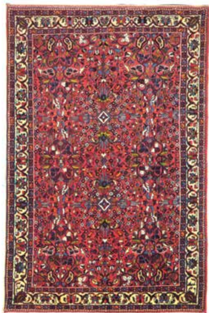
تصویر ۲۸-۱۴- قالی بافت تفرش