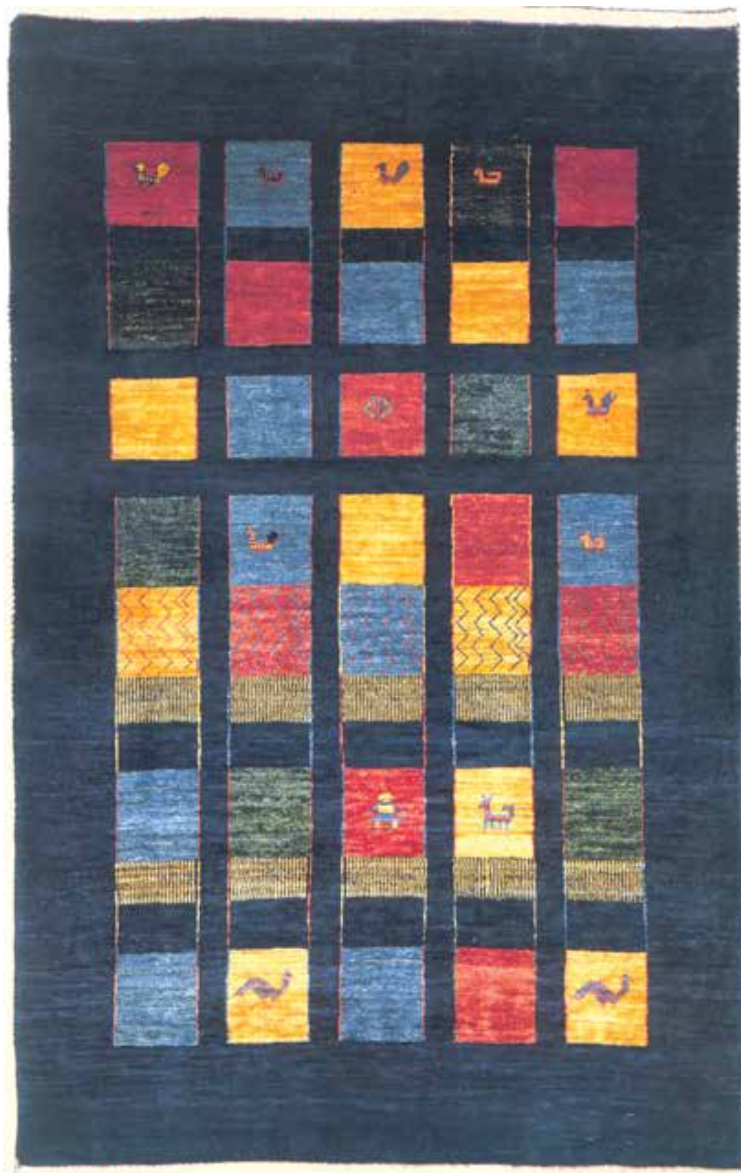
تصویر ۱۴-۲۰ - گبه بافت فارس (قشقایی)