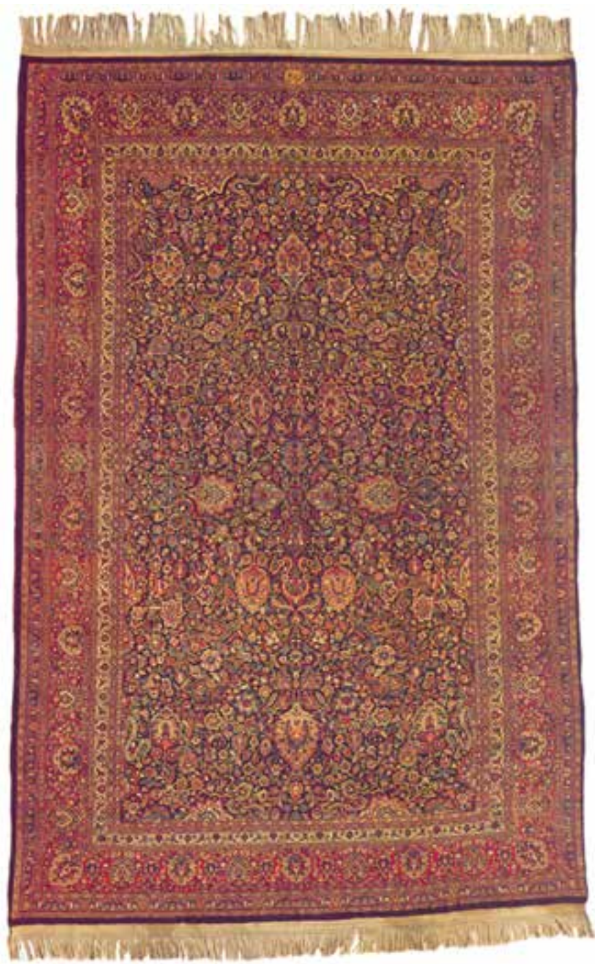
تصویر ۹-۱۴- قالی بافت مشهد کارگاه عمو اوغلی

خراسان: بررسی نتایج آماری قالی‌بافی منطقه‌ی خراسان نشانگر آن است که تعداد قابل توجهی دار قالی (نزدیک به ۱۵۰,۰۰۰ دار) در منطقه‌ی پهن‌اور خراسان وجود دارد. از این‌رو این منطقه با دارا بودن بیش‌ترین حجم تولید قالی در ایران حائز اهمیت شمرده می‌شود. قالی‌بافی در خراسان، در مناطق مشهد، بیرجند، طبس،