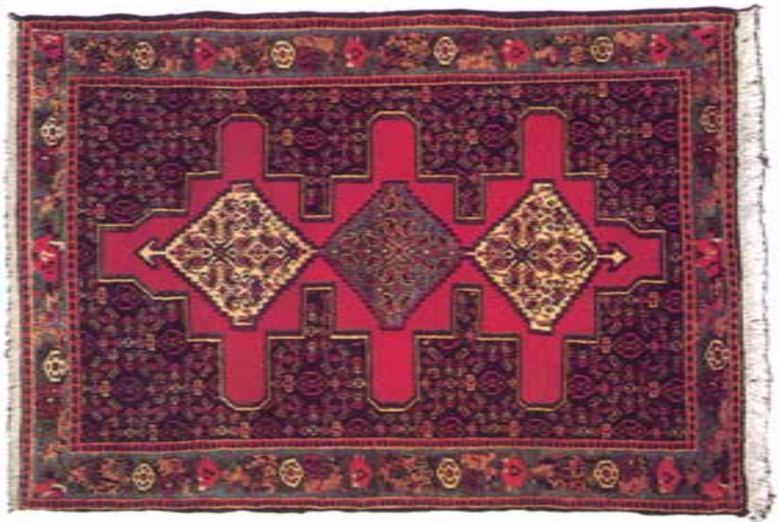
تصویر ۱۳-۱۴- قالی بافت سنندج