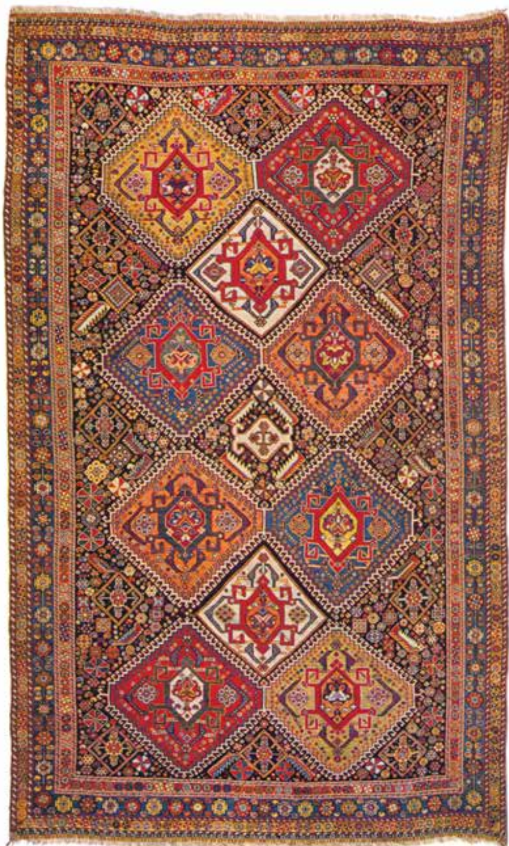
تصویر ۱۹-۱۴- قالی بافت فارس (قشقایی)