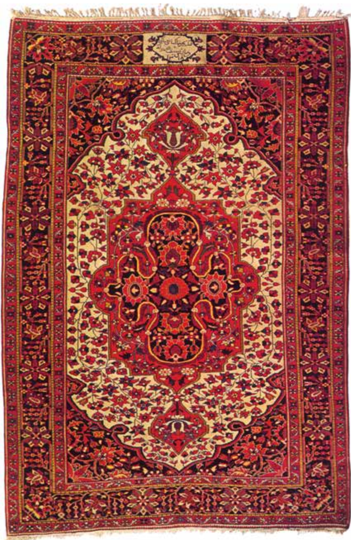
تصویر ۳۴-۱۴ - قالی بافت ملایر