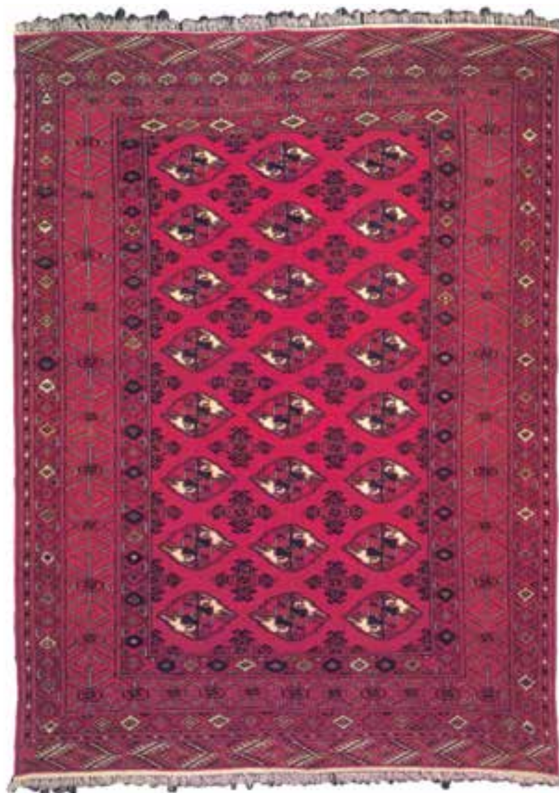
تصویر ۳۵-۱۴ - قالیچه‌ی ترکمن

ترکمن: ترکمن‌ها در منطقه‌ی شمالی ایران، در شرق دریای خزر، زندگی می‌کنند. قالی‌بافی از دیرباز در میان ترکمن‌ها متداول بوده است و خصوصیات فرهنگی آنان موجب گردیده که در طی سالیان صرفاً به بافت طرح‌ها و نقوش خاص خود اقدام نمایند. قالی‌بافی در میان ترکمن‌ها به‌عنوان یک ضرورت، که بخشی از اقتصاد آنان را تشکیل می‌دهد، تلقی می‌گردد. قالی‌های ترکمن دارای کیفیت‌های متنوعی است. در چله‌ی این قالی‌ها علاوه بر نخ‌های پنبه‌ای از نخ‌های پشمی و ابریشمی نیز استفاده می‌شود. نقش قالی‌های ترکمن معمولاً به‌صورت واگیره‌ای است که به‌نام گول نامیده می‌شود. این نقش دارای حاشیه‌های باریک متعدد