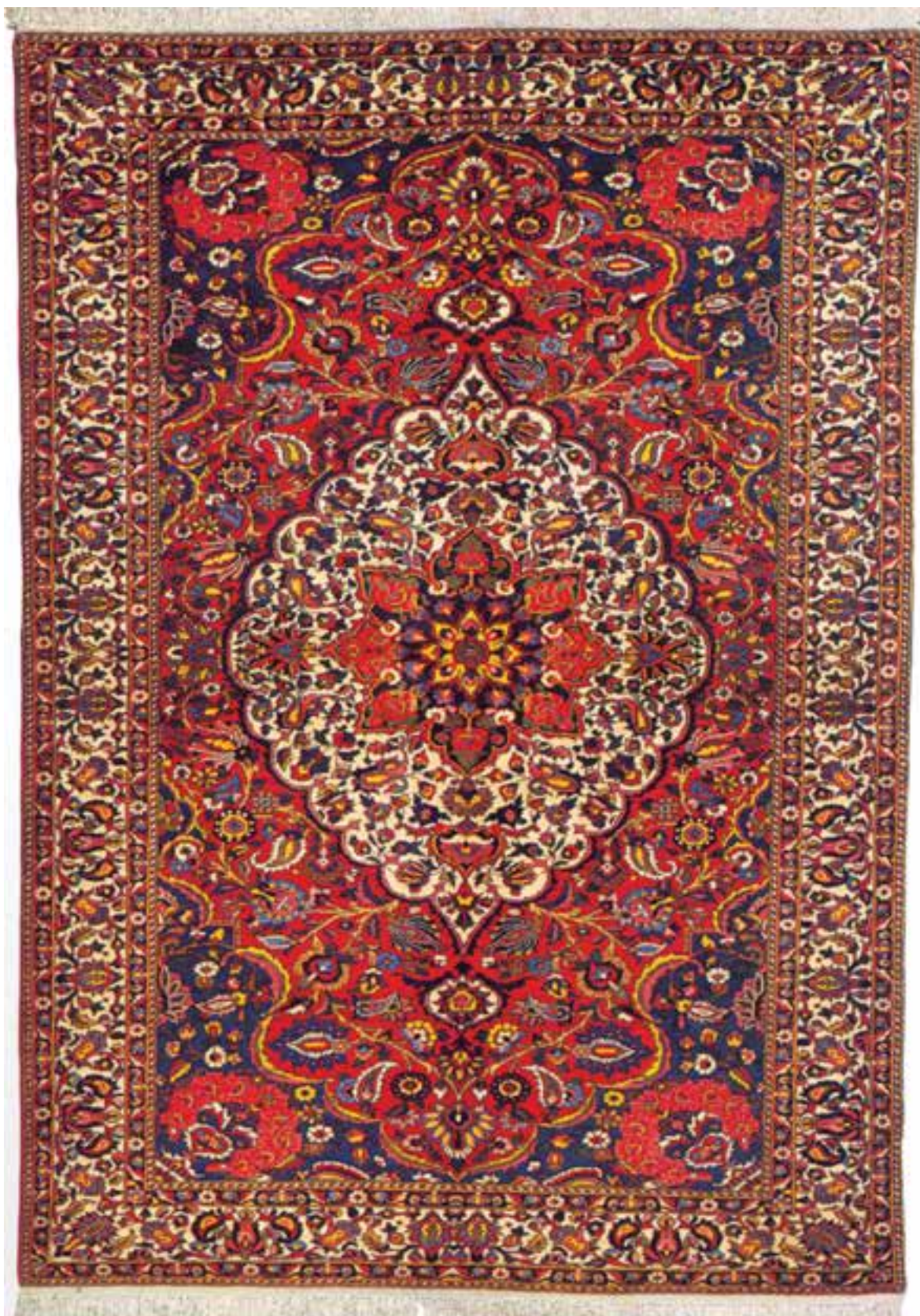
تصویر ۲۲-۱۴- قالی بافت شهرکرد