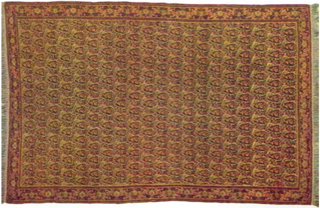
تصویر ۱۴-۱۴- قالی بافت سنندج