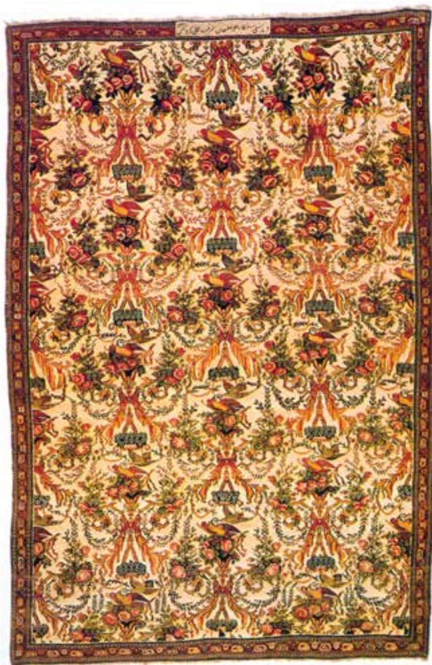
تصویر ۱۵-۱۴- قالی بافت بیجار

بوده است که به فراخور فصول سال با استقرار در محل‌های مناسب (ییلاق - قشلاق) به چرا و نگه‌داری دام و احشام می‌پرداختند دست بافت‌ها و قالی‌های بافت ایلات فارس ضمن آن که نیازهایشان را تأمین می‌نماید بخش قابل توجهی از حجم تولید قالی‌های فارس محسوب می‌گردد.