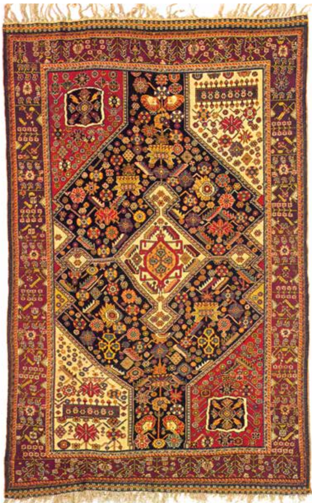
تصویر ۱۷-۱۴- قالی بافت فارس (قشقای)