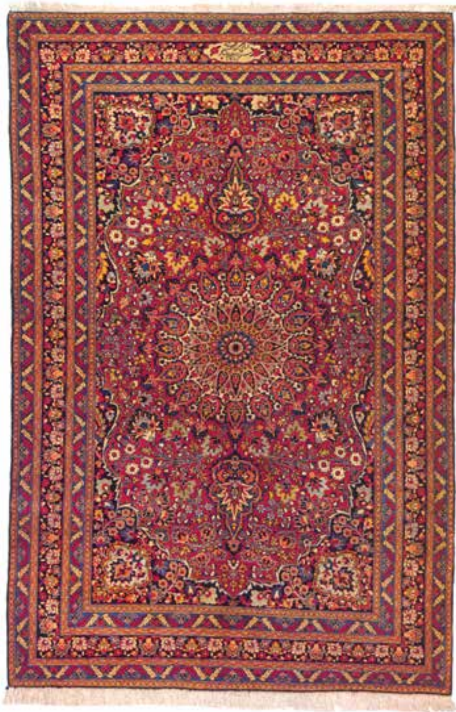
تصویر ۱۰-۱۴ قالی بافت بیرجند

در گذشته‌ای نه‌چندان دور، مشهد از مراکز تولید قالی‌های با کیفیت و نفیس محسوب می‌شد ولی هم‌اکنون به‌جز قالی‌های آستان قدس رضوی و معدودی از تولیدکنندگان خصوصی، عمده‌ی تولیدات قالی مشهد تجارتی تلقی می‌شود.