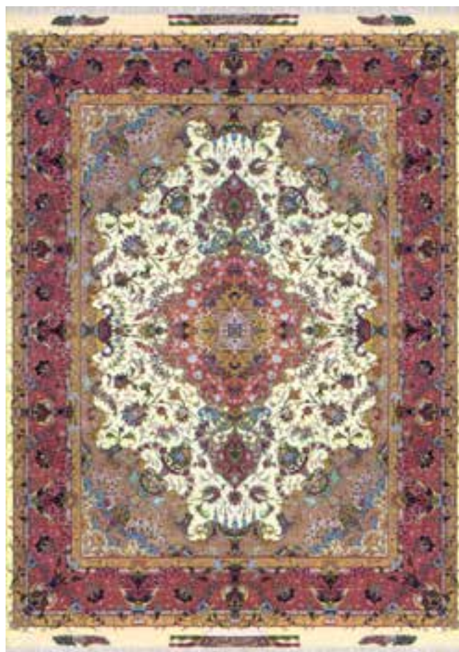
تصویر ۲۰-۲- قالی بافت تبریز