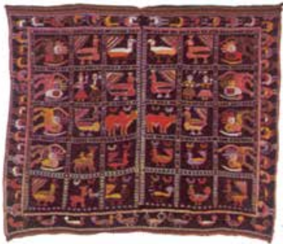
تصویر ۱۶-۲- قلیان‌دان جهت حمل و نگهداری قلیان استفاده می‌گردد.