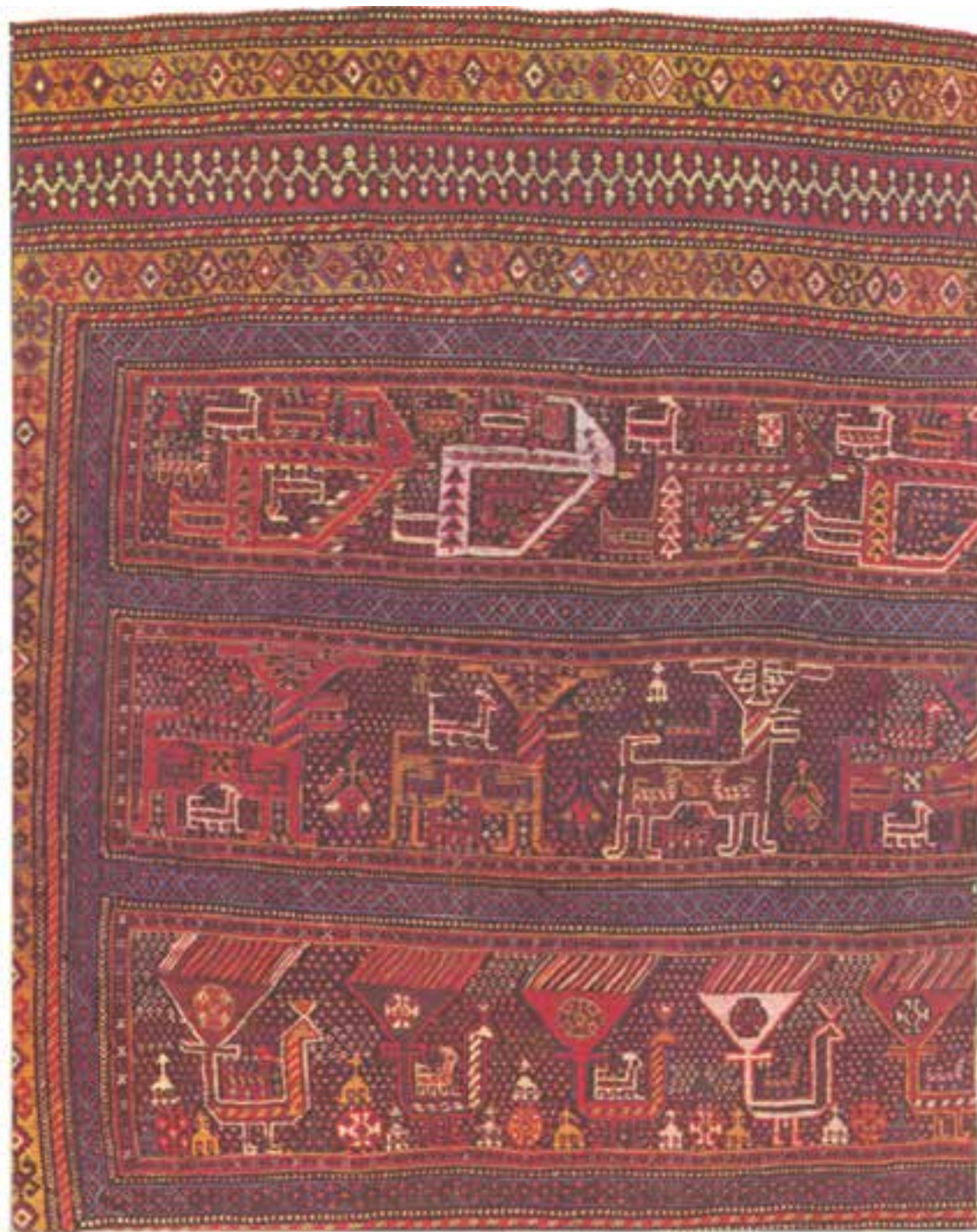
تصویر ۸-۲- سوزنی، از دست‌بافته‌های ایل قشقایی

سوزنی: بافت سوزنی در میان ایلات و عشایر فارس متداول است. این دست‌بافته نیز با پیچش نخ‌های پود به دور تارها شکل می‌پذیرد و یک‌رویه است و در پشت آن نیز نخ‌های پود آویزان هستند. در بافت سوزنی، برخلاف نام آن، از سوزن استفاده نمی‌شود بافت سوزنی به صورت قطعات کوچک متداول است (تصویر ۸).