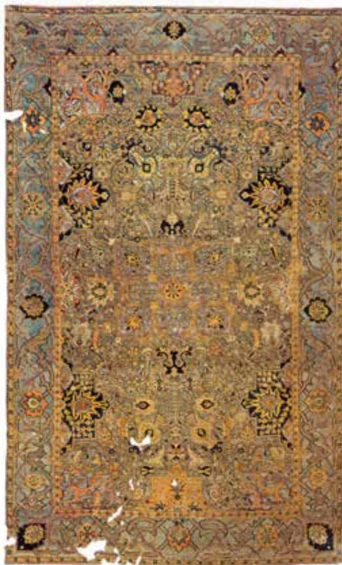
تصویر ۲۱-۲- قالی صوف بازمانده از قرن ۱۱ هجری، که در بافت آن از ابریشم و طلا و نقره استفاده شده است. محل نگهداری - موزه ملی ایران