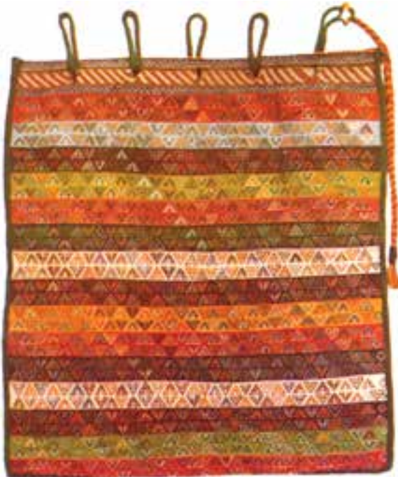
تصویر ۱۱-۲- جوال جهت حمل بار مورد استفاده قرار می گیرد. جوال سوزنی قشقایی

جوال - خورجین - چنته: دست بافت ها در میان ایلات و عشایر جنبه ی کاربردی دارد و آن ها هیچ گاه به صرف ترین به تولید این بافته ها اقدام نمی کنند از این رو با به کارگیری انواع روش های بافتی که در بافت گلیم ساده، سوزنی، جاجیم و... به کار می رود یا ترکیب بعضی از روش ها با یکدیگر وسایل دیگری چون جوال، خورجین، چنته و... نیز می بافند که متناسب با اندازه ی هر یک جهت حمل اشیا بر پشت حیوان یا بر دوش انسان مورد استفاده قرار می گیرد (تصاویر ۱۱ و ۱۲ و ۱۳).