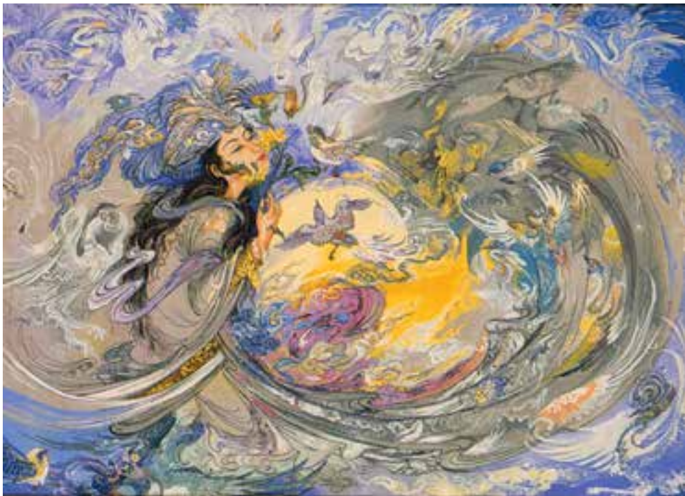
تصویر ۱۹-۲- تصویری از فرش‌های هنری

در بافت قالی روش‌های متنوعی به کار گرفته می‌شود. در بافت قالی‌های تصویری به کارگیری رنگ‌های متعدد و ترکیب آن‌ها با یکدیگر و همچنین تغییراتی که در گره‌ها ایجاد می‌گردد دارای اهمیت بسیار است و به مهارت زیاد نیاز دارد. در بافت قالی‌های دو رویه نیز مهارت بسیاری لازم است. همچنین در برخی بافته‌ها با به کارگیری نخ‌های طلایی و نقره‌ای در متن بافته، نقوش را برجسته می‌یابند (صوف) قالی بافی در میان شهرها و روستاها و ایلات و عشایر بسیار گسترش و رواج دارد.