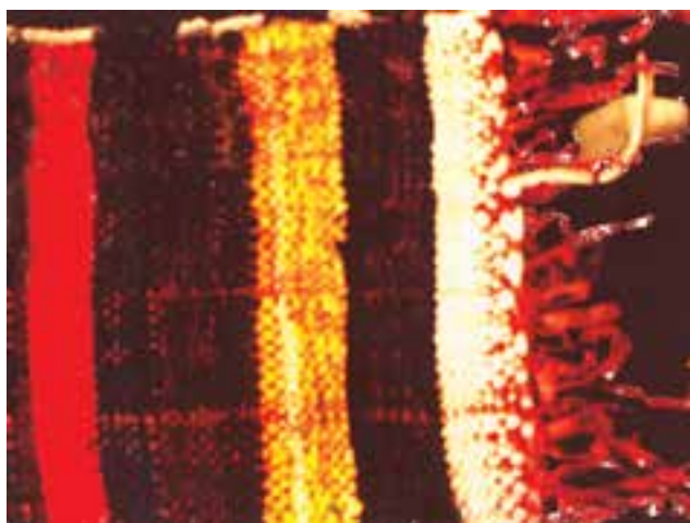
تصویر ۲-۴ - زیلوی میبد

زیلو: زیلو دست‌بافته‌ای است که با استفاده از تار و پود پنبه‌ای بر دارهای عمودی تولید می‌گردد. بافت این زیرانداز تابستانی در روستاها متداول است. زیلو نسبت به سایر دست‌بافته‌ها ضخیم و زمخت می‌باشد. این دست‌بافته دو رویه است و نقش یک طرف آن با طرف دیگر تفاوت دارد. پلاس ۱ : در بافت پلاس نیز، مانند بافت زیلو، از تار و پود پنبه‌ای استفاده می‌شود. با این تفاوت که در بافت پلاس از نخ‌های پنبه‌ای نامرغوب و پست استفاده می‌شود. پلاس بافته‌ای دو رویه، معمولاً بدون نقش و ضخیم و درشت می‌باشد.