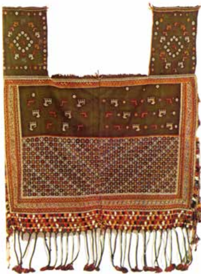
تصویر ۱۰-۲- جل اسب سوزنی قشقایی