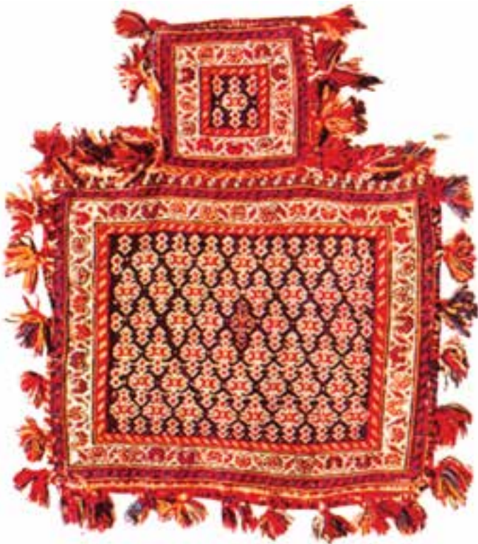
تصویر ۱۷-۲- نمک‌دان جهت حمل نمک یا ذخیره‌ی آن مورد استفاده قرار می‌گیرد.