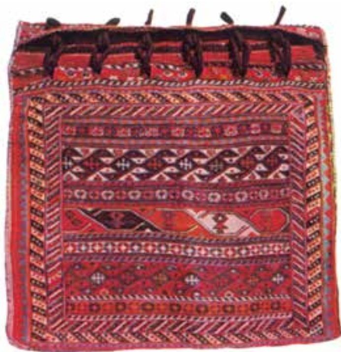
تصویر ۱۲-۲- خورجین از جوال کوچک تر است و در حمل اشیا استفاده می گردد.