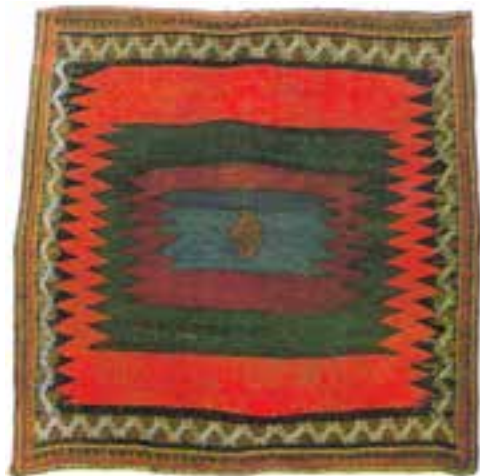
تصویر ۱۸-۲- بافته‌ای از ایلات و عشایر کرمان جهت سفره و یاروکسی