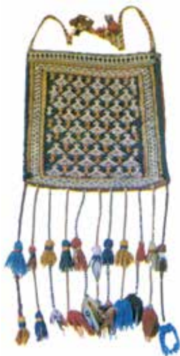
تصویر ۱۳-۲- چننه مانند کیف است و بر دوش حمل می شود.