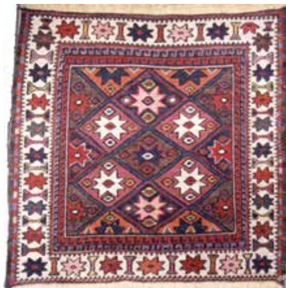
تصویر ۷-۲- ورنی، بافت ایلات شاهسون