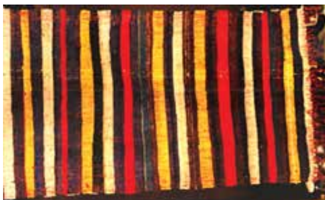
تصویر ۲-۵ - پلاس و دیتیل آن