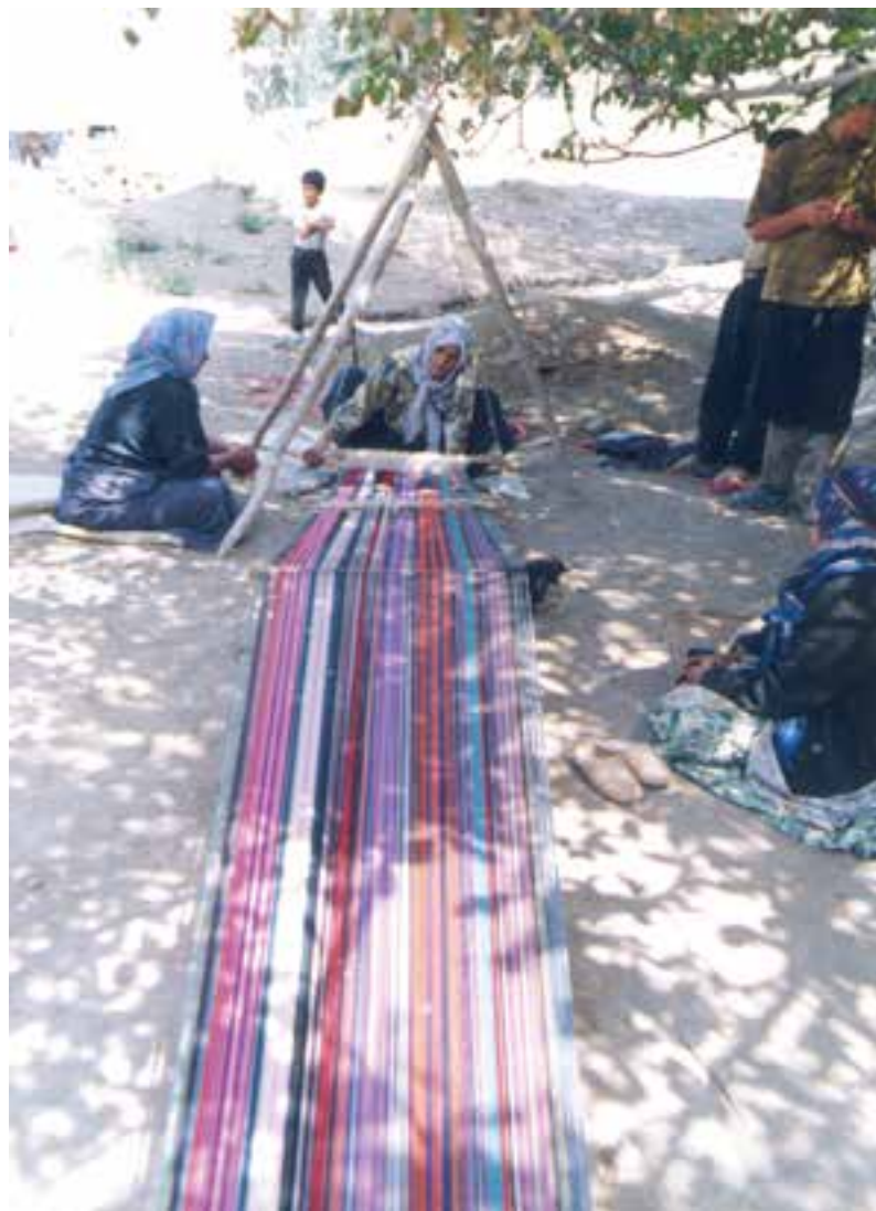
تصویر ۱-۲- بافت جاجیم در ایلات شاهسون (آذربایجان)

جاجیم: بافت جاجیم در میان ایلات و عشایر ترکمن، کردستان، آذربایجان و فارس و نیز روستاها بر روی دستگاه های ساده ای که بر سطح