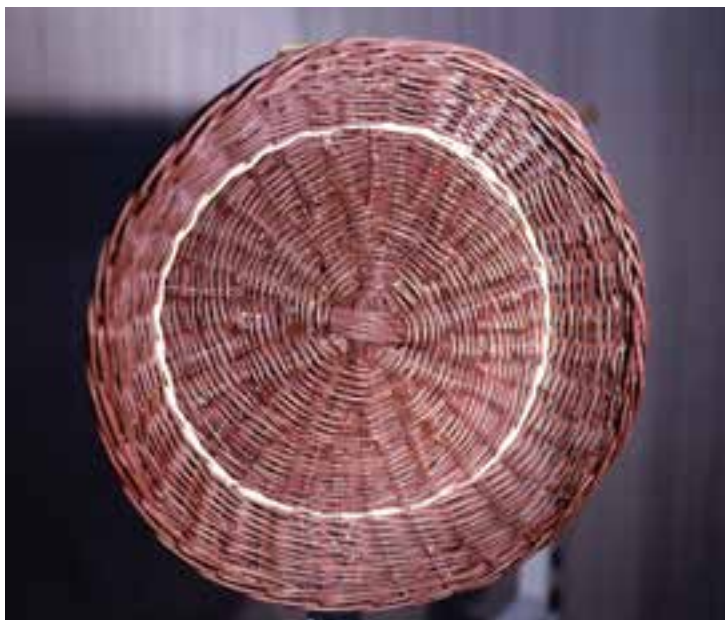
تصویر ۱-۱- نمونه‌ای از سبدبافی

شاخه و ریشه‌ی گیاهان و درهم تنیدن آن‌ها آغاز کرده است (سبدبافی، تصویر ۱).