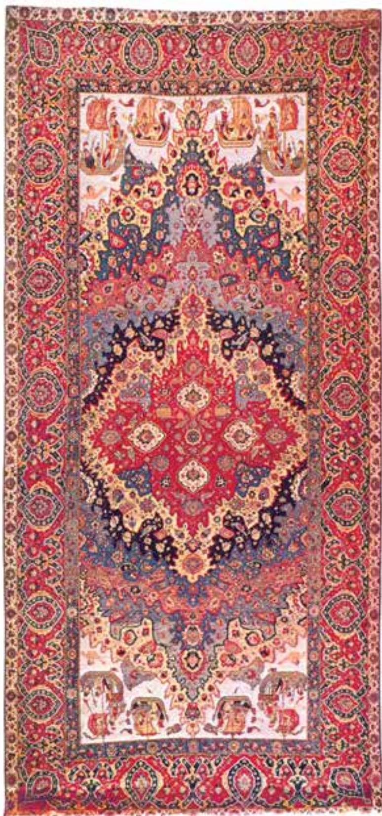
تصویر ۱۷-۱- این قالی عصر صفوی به نام موج دریا شهرت دارد و در موزه‌ی وین اتریش نگهداری می‌شود. طرح قالی به‌خوبی نشانگر ارتباط کشورهای خارجی (پرتغال) با دربار صفوی است. اندازه‌ی قالی ۶۷۷×۳۷۲ سانتی‌متر و محل بافت به اصفهان منتسب می‌باشد.