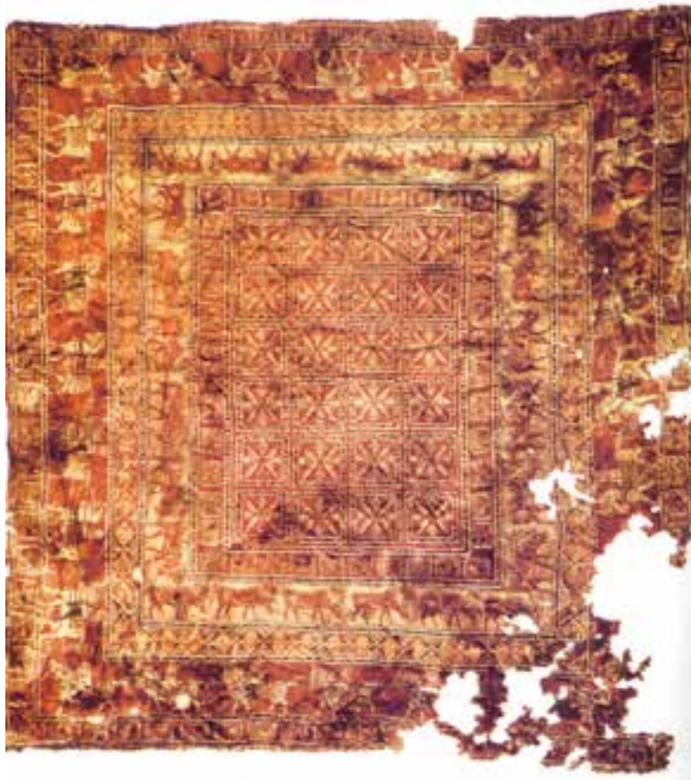
تصویر ۱۱-۱- قالی پازیریک