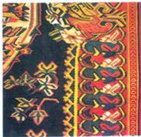
تصویر ۹-۱- نقشی از گلیم بیجار