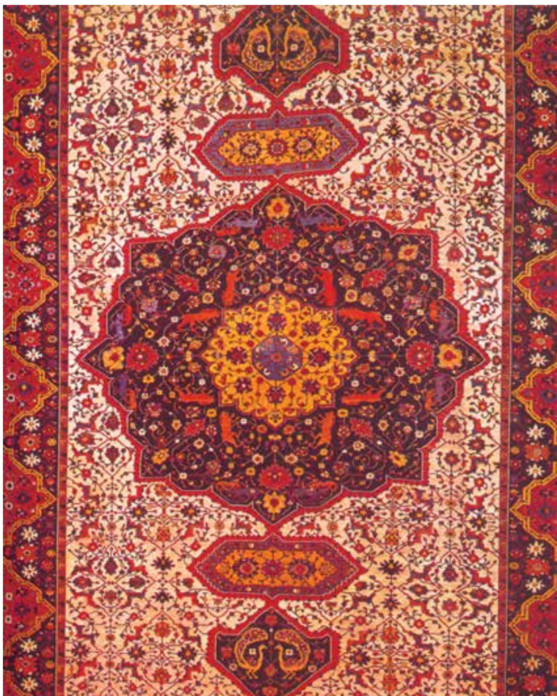
تصویر ۲۰-۱. قالی بافت اصفهان در ابعاد ۶۳۵×۳۳۰ سانتی متر که در موزه‌ی وین نگهداری می‌شود. نقوش هندسی به‌کار رفته در این قالی نمایانگر یکی دیگر از ویژگی‌های هنری عصر صفوی است. سال بافت: ۱۰۸۰ هجری