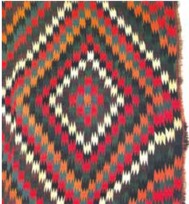
تصویر ۶-۱ بخشی از گلیم بافت ورامین

بافت گلیم بعدها به مرور ایام و با تسلط نسبت به آن پیش آمد. همان‌طور که اشاره شد بافت گلیم در بسیاری از نقاط متداول بوده است؛ با این توضیح که مشابهت‌های بسیاری در روش‌های بافت و برعکس، تفاوت‌هایی در طرح و نقش و رنگ‌بندی گلیم‌ها در مناطق مختلف وجود داشته است که هنوز هم وجود دارد (تصاویر ۶ و ۷).