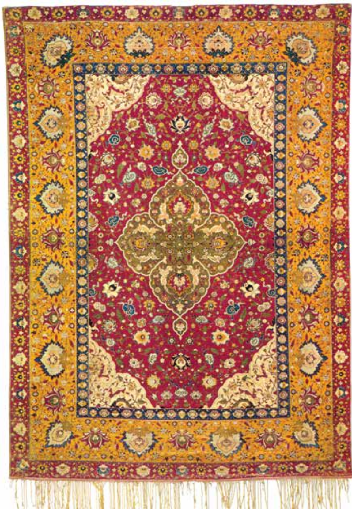
تصویر ۱۹-۱- قالی بافت اصفهان با ابعاد ۲۵۰×۱۵۰ سانتی متر که در قرن دهم هجری بافته شده است. این قالی در موزهی گوبلن پاریس نگهداری می‌شود.