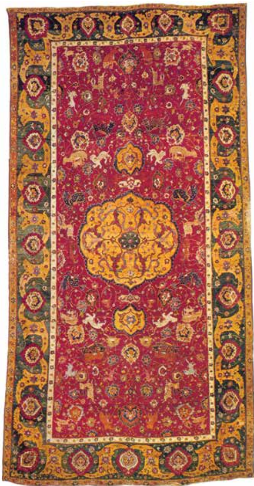
تصویر ۱۶-۱. قالی بافت اصفهان در ابعاد ۴۲۷×۲۲۹ سانتی متر که در موزهی واشنگتن امریکا نگهداری می‌شود. طرحی از حیوانات افسانه‌ای و نقوش اسلیمی و گل‌های عباسی در متن دیده می‌شود.