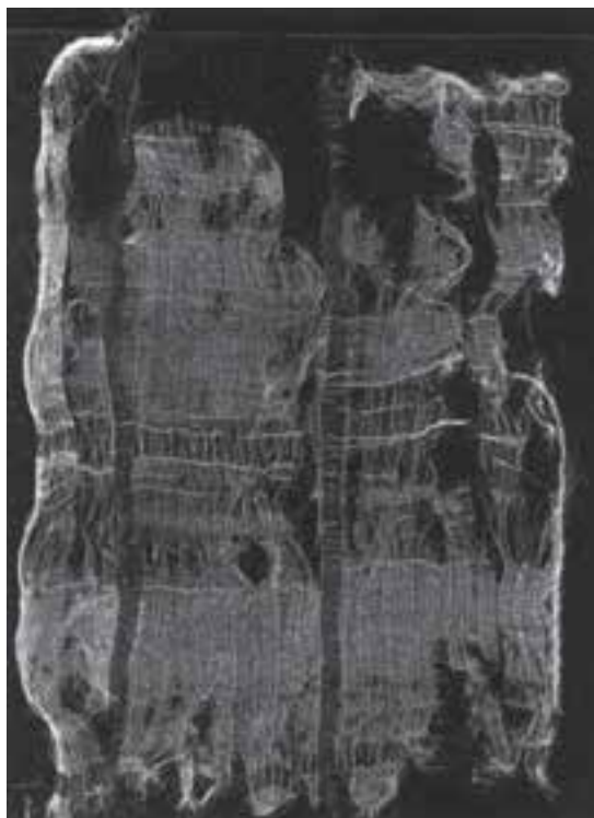
تصویر ۲-۱- قطعه پارچه‌ای ابریشمی بازمانده از قرن سوم هجری

به کارگیری پشم‌های خودرنگ (مشکی - قهوه‌ای - شکری - کرم و...) نقش و نگارهایی نیز بر گلیم جان گرفته است (تصویر ۳).