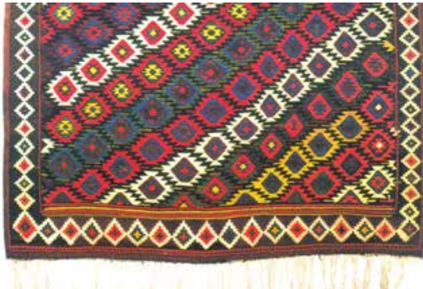
تصویر ۷-۱ بخشی از گلیم بافت گرمسار