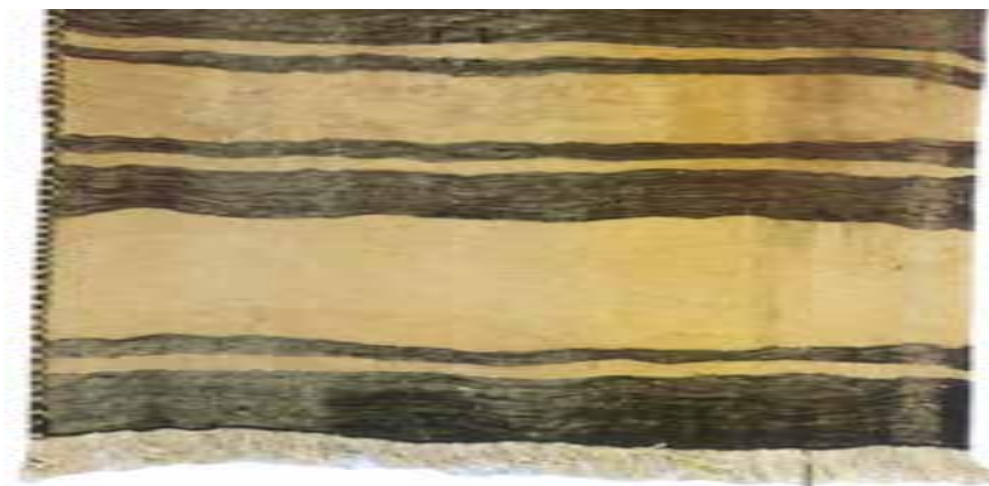
تصویر ۳-۱- گلیم بافته شده از پشم خودرنگ (بختیاری)

بافت گلیم در گستره‌ی سرزمین ایران صورت می‌گرفته است و به‌طور حتم می‌توان گفت اولین گلیم‌ها ساده و بدون نقش و نگار بوده است، اما به مرور و با تکامل بافت‌های اولیه‌ی گلیم، با