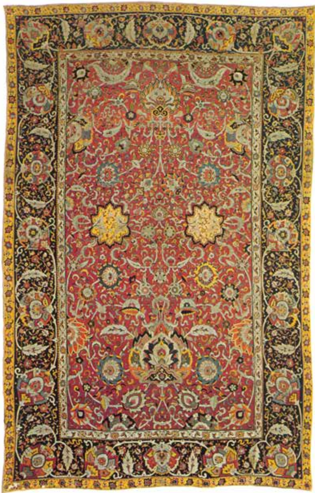
تصویر ۱۵-۱ این قالی به دستور شاه عباس (۹۷۰ هجری) صفوی جهت هدیه به حرم امام رضا (ع) بافته شده است. در بافت این قالی علاوه بر ابریشم از نقره نیز استفاده شده است. ابعاد قالی عبارت است از ۳۵۴ × ۵۶۰ سانتی متر که هم اکنون در موزه ی آستان قدس رضوی نگهداری می شود.