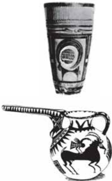
تصویر ۵-۱- نمونه‌هایی از نقش بر سفال

تا قبل از اختراع خط، انسان مفاهیم و اندیشه‌های خود را از طریق تصویر و طرح منتقل می‌کرد. تصاویر و نقوش بسیاری بر سنگ‌ها، سفالینه‌ها، فلزات و... وجود دارد که هر یک بیانگر اندیشه‌ها، اعتقادات و روابط انسان‌های دوران خود می‌باشد (تصویر ۵). هر چند امروزه انتقال پیام از طریق خط و نوشتن دارای بالاترین اهمیت است با این حال جایگاه طرح و تصاویر در انتقال پیام‌ها و دیدگاه‌های انسان امروزی هم‌چنان قابل توجه است.