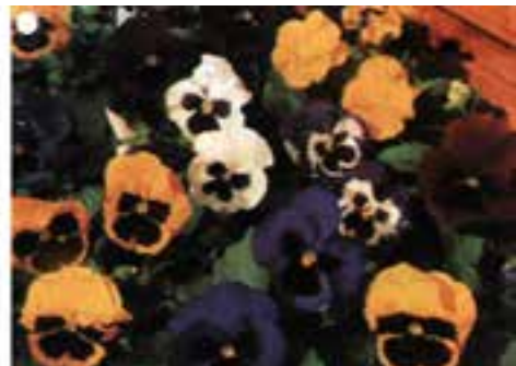
شکل ۸-۹- ارقامی از بنفشه سه رنگ (بنفشه فرنگی)