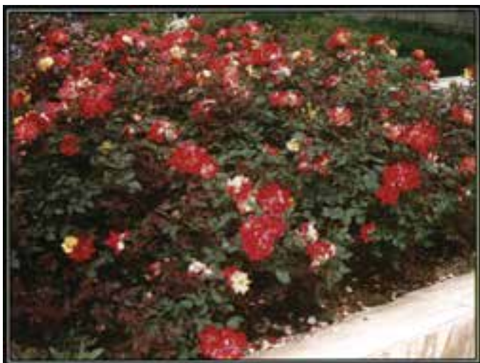
رز هفت رنگ