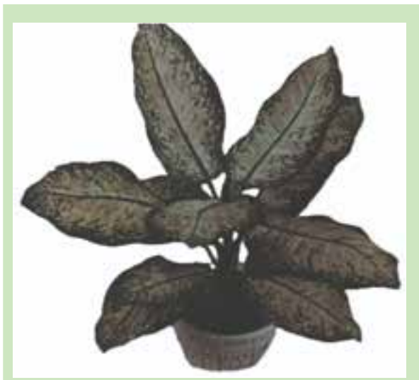
شکل ۹-۱۱- دیفن باخیا رژینا

دیفن باخیا رژینا ۱ (شکل ۹-۱۱) : دارای قد نسبتاً کوتاه، ساقه‌ی ضخیم که بر روی برگ‌های سفید مایل به سبز آن رگه‌هایی به رنگ سبز کمرنگ با حاشیه‌ی سبز تیره دیده می‌شود.