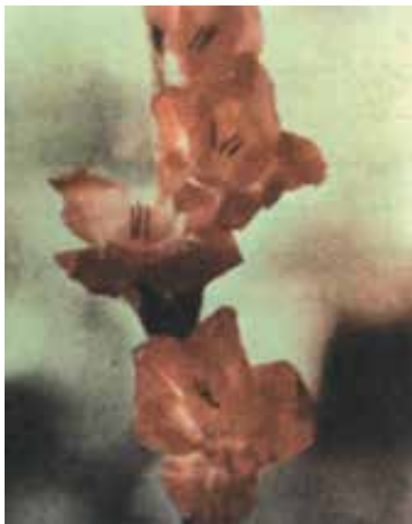
شکل ۹-۶- رقم آلفرد نوبل