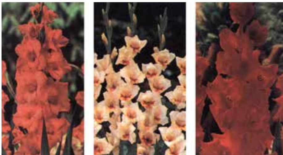
شکل ۲-۹- ارقامی از گلایل