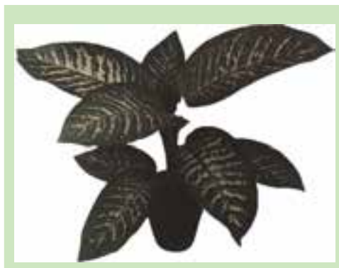
شکل ۹-۱۰- دیفن باخیا آمونتا

دیفن باخیا (شکل ۹-۱۰): دارای برگ‌های متوسط سبز رنگ آراسته به لکه‌های دراز سفید، کرم و زرد کمرنگ که از هر دو طرف برگ دیده می‌شود.