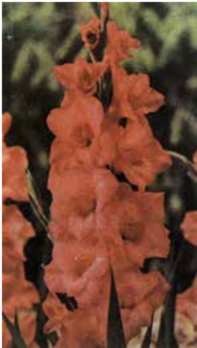
شکل ۹-۵- رقم سانسوسی

رقم آلفرد نوبل ۲ : در این رقم کنار گل‌ها صورتی و گلوی گل سفید رنگ است. گل‌ها درشت و کمی جدا از هم بر روی ساقه قرار می‌گیرند؛ پیاز آن کاملاً مقاوم و مدت دوام گل بریده‌ی آن در آب، زیاد است (شکل ۹-۶).