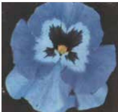
شکل ۷-۹- بنفشه فرنگی

گیاهی است از خانواده‌ی (Violaceae) علفی، از نظر گیاه‌شناسی چند ساله ولی در گل‌کاری