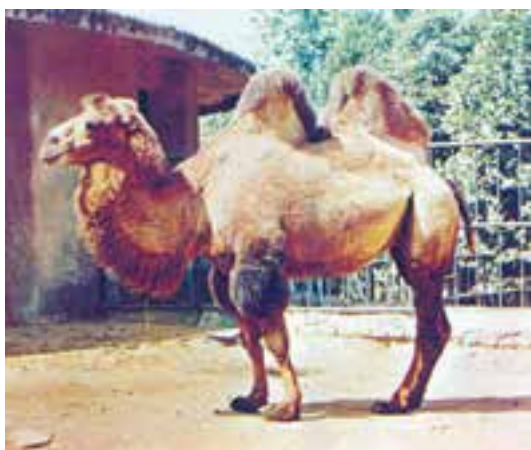
شکل ۶-۴ - شتر دوکوهان