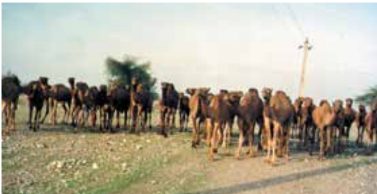
شکل ۷-۴- نگهداری شتر بصورت گله ای

شترهای ضعیف برای خریداری توصیه نمی شوند، زیرا آنها مستعد ابتلا به بعضی از بیماریها می باشند.