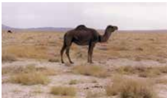
شکل ۵-۴ - شتر یک کوهان

در استان آذربایجان شرقی، به دلیل وجود کیلومترها جاده سنی بین شهرها و راههای خاکی بین بخشها و دهات مختلف، ضرورت استفاده از شتر به رنگهای سفید، سیاه و گاهی ابلق دیده می‌شود.