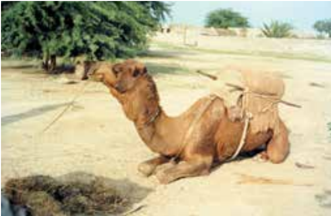
شکل ۱- ۴- حمل بار با شتر

۳- شتر دو کوهانه. ( Camelus Bacterianus )