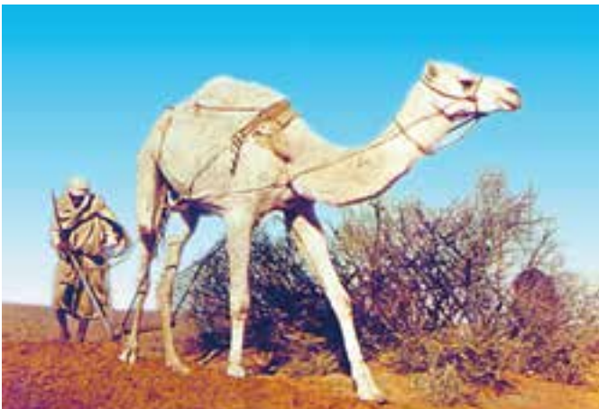
شکل ۴-۴- استفاده از شتر در کشاورزی

استان سیستان و بلوچستان به دلیل موقعیت خاص اقلیمی با دارا بودن تعداد ۹۷۰۰۰ نفر شتر طبق سرشماری سال ۱۳۵۴ وزارت کشاورزی رتبه اول را در کشور دارد. در کشور ایران، با کشتار شتر بخش عمده‌ای از گوشت مصرفی مردم تأمین می‌شود. به طوری که در سال ۱۳۵۰ میزان ۱/۱۸ درصد از کل کشتار در کشتارگاه‌های کشور را شتر تشکیل می‌دهد. از نقطه نظر طبقه‌بندی، شتر به عالم جانداران، سلسله جانوران، شاخه مهره‌داران، رده پستانداران، زیررده جفت‌داران، راسته سم‌داران، زیرراسته زوج سُم‌ان، دسته تی‌لوپودا، خانواده شتر، جنس شتر بزرگ و نوع شترهای یک کوهان و دوکوهان تعلق دارد. تا به حال، روشن نشده است که شتر یک کوهان و دوکوهان یک نوع حیوان هستند یا دو نوع. برخی از محققین این دو را یک نوع و بعضی دیگر دو نوع حیوان می‌دانند. نواحی گسترش