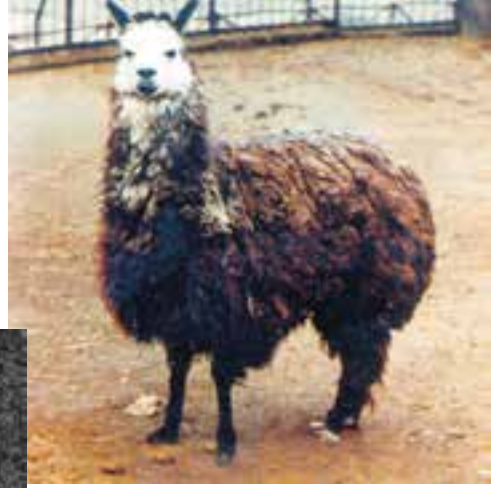
شکل ۲-۴ - شتر بی کوهان (لاما)