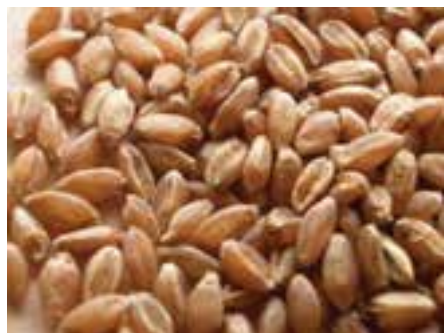
شکل ۸-۸ - گندم

گندم: گندم یکی از منابع اصلی انرژی در جیره‌های طیور است و در دام نیز استفاده می‌گردد. میزان انرژی قابل متابولیسم گندم برای نشخوارکنندگان ۳۲۵۴ کیلوکالری در هر کیلوگرم و برای طیور ۲۹۹۰ کیلوکالری در هر کیلوگرم است. از آن‌جا که گندم برای تهیه نان و بیسکویت استفاده می‌شود مصرف آن در تغذیه دام و طیور در بعضی کشورها محدودیت دارد.