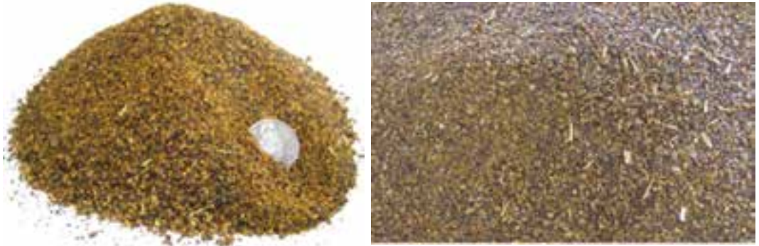
شکل ۱۱-۸- کنجاله کلزا

کنجاله کلزا، می‌تواند باعث ایجاد طعم ماهی و مزه‌های نامطلوب دیگر در تخم مرغ شود. تانن هم به دلیل مقاومت در مقابل آنزیم‌ها، قابلیت هضم آن را کاهش می‌دهد.