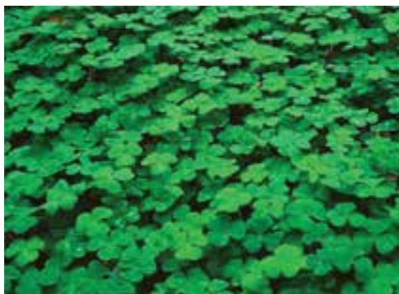
شکل ۸-۲ - شبدر