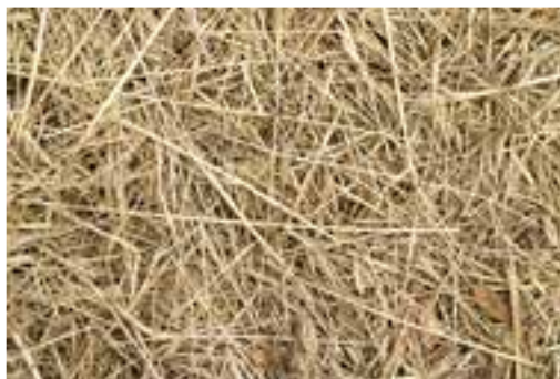
شکل ۵-۸ - کاه

کاه، ساقه باقیمانده گیاه پس از خرمن کوبی و جدا کردن دانه است. عموماً کاه از غلات و گیاهان تیره حبوبات به دست می‌آید. کاه غلات به نوبه خود، هم برای تغذیه و هم برای تهیه بستر دام‌ها به کار می‌رود. این ماده، به علت کمبود پروتئین و داشتن مقدار زیادی سلولز و لیگنین از نظر تغذیه کم ارزش است و فقط برای حجیم شدن غذا به عنوان علوفه در تغذیه دام مورد استفاده قرار می‌گیرند. البته باید توجه کرد که کاه در جیره غذایی طیور مورد مصرف ندارد.