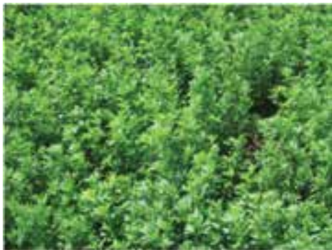
شکل ۸-۱ - یونجه

شبدر : همانند یونجه از خانواده لگومینوز بوده و سه برگی است. شبدر از نظر ترکیب شیمیایی درصد پروتئین بالایی دارد و نیز کربوهیدرات‌های محلول آن زیاد است.