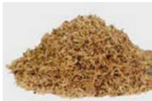
شکل ۴-۸ - تفاله چغندر قند

غذاهای حیوانی : از انواع این غذاها که منشأ حیوانی دارند، می‌توان از شیر و مشتقات آن نام