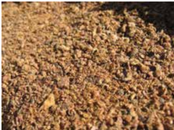
شکل ۱۰-۸ - کنجاله تخم پنبه

کنجاله تخم پنبه حاوی ماده سمی به نام گوسیپول است که مقدار آن به شرایط آب و هوایی، کیفیت خاک و روش روغن‌گیری از تخم پنبه بستگی دارد. گوسیپول می‌تواند در طیور باعث بروز مشکلات هضمی، کاهش خوش‌خوراکی، تغییر رنگ زرده تخم مرغ به سبز زیتونی و کاهش تولید مثل و مسمومیت شود. از این رو مصرف کنجاله تخم پنبه محدودیت دارد. استفاده از سولفات آهن و سایر ترکیبات آن، به دلیل ترکیب شدن آهن با گوسیپول، می‌تواند از اثرات سمی کنجاله تخم پنبه بکاهد. حرارت دادن به کنجاله تخم پنبه نیز می‌تواند از میزان گوسیپول آن بکاهد.