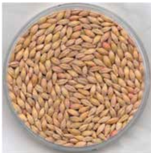
شکل ۷-۸ - جو

مشکل اصلی جو، وجود بتاگلوکان است. پرندگان آنزیم بتاگلوکاناز را ندارند، در نتیجه بتاگلوکان در آن‌ها هضم نمی‌شود و چون بتاگلوکان آب جذب می‌کند، مصرف زیاد جو در طیور باعث چسبندگی مدفوع، آلوده شدن تخم مرغ‌ها به مدفوع و افزایش رطوبت بستر می‌شود. به همین دلیل در صورتی که از جو در جیره طیور استفاده شود، لازم است از آنزیم مناسب (گلوکاناز) استفاده گردد.