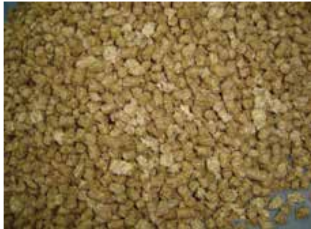
شکل ۸-۹ - کنجاله سویا

به دلیل وجود تعدادی مواد ضد تغذیه‌ای ۱ محدودیت مصرف دارد. هر چند عمل‌آوری با حرارت در حین تولید کنجاله سویا تا حدی از محدودیت مصرف کنجاله سویا می‌کاهد.