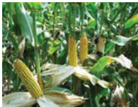
شکل ۶-۸ - ذرت