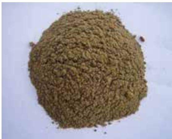
شکل ۱۲-۸ - پودر ماهی

میزان پروتئین پودر ماهی بسته به نوع ماهی از ۶۰ تا ۷۰ درصد متغیر است و از نظر اسید آمینه لیزین و متیونین غنی است. چنانچه از پودر ماهی به میزان زیاد در جیره گاوهای شیری استفاده شود، احتمال اینکه شیر آنها طعم و بوی ماهی بگیرد وجود دارد. همچنین استفاده زیاد آن در طیور باعث ایجاد طعم ماهی در تخم مرغ و گوشت طیور می شود.