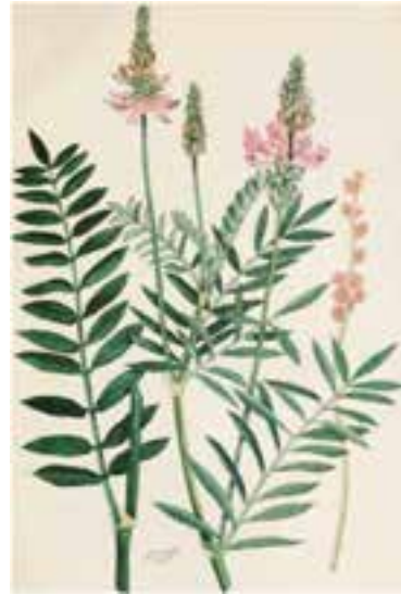
شکل ۳-۸ - اسپرس

ب- خانواده گرامینه (گندمیان): مهمترین انواع گیاهان خانواده گرامینه که ممکن است به صورت علوفه سبز مورد مصرف قرار گیرند، عبارت از: ذرت، ذرت خوشه‌ای، جو، گندم و چاودار می‌باشند. اکثر این گیاهان به صورت سبز و کمتر به عنوان علف خشک مورد استفاده قرار می‌گیرند. همچنین از آن‌ها به عنوان سیلو (به ویژه در مورد ذرت) نیز استفاده می‌شود. شاخ و برگ این گیاهان سرشار از کربوهیدرات است ولی از نظر پروتئین فقیرند. لذا بهتر است همراه با یونجه یا سایر گیاهان خانواده بقولات مورد استفاده‌ی دام قرار گیرند.