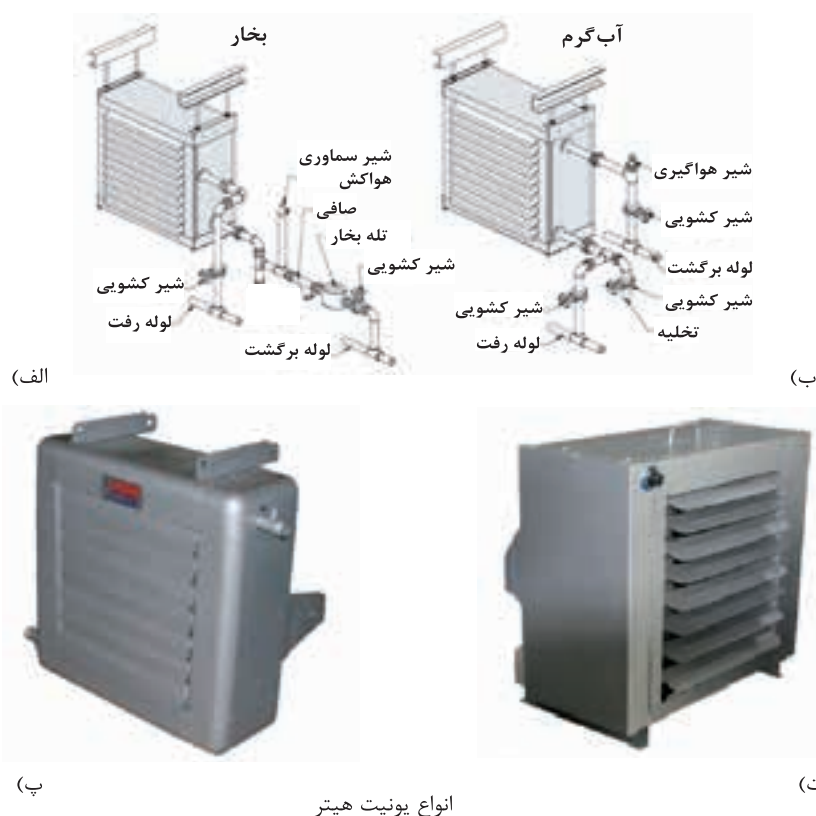
انواع یونیت هیتر