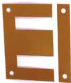
ورق نوع EI

هسته‌ی ترانسفورماتور متشکل از ورقه‌های نازک است که سطح آن‌ها با توجه به قدرت ترانسفورماتور محاسبه می‌شود. برای کم کردن تلفات آهنی، هسته‌ی ترانسفورماتور را نمی‌توان به‌طور یک‌پارچه ساخت. بلکه معمولاً آن‌ها را از ورقه‌های نازک فلزی که نسبت به یک‌دیگر عایق‌اند، می‌سازند. این ورقه‌ها از آهن بدون پسماند (ورق دیناموبلش) با آلیاژی از سیلیسیم (حداکثر ۴/۵ درصد) که دارای قابلیت هدایت الکتریکی کم و قابلیت هدایت مغناطیسی زیاد است ساخته می‌شوند. در اثر زیاد شدن مقدار سیلیسیم، ورقه‌های دیناموبلش شکننده می‌شود. برای عایق کردن ورق‌های ترانسفورماتور، قبلاً از یک کاغذ نازک مخصوص که در یک سمت این ورقه چسبانده